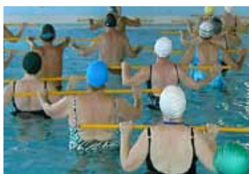
Una de les activitats a la piscina.

Del 21 al 25 de novembre, de 8 a 21 h, de dilluns a divendres, la piscina del Complex Esportiu Municipal ofereix la possibilitat de provar qualsevol activitat dirigida aquàtica. La iniciativa pretén donar a conèixer els recursos de què disposa aquest equipament, així com els beneficis de la pràctica esportiva. Per