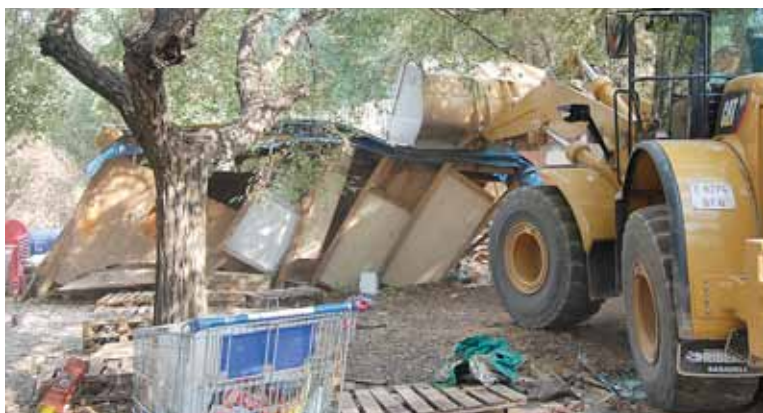
Una de les màquines que van enderrocar les construccions.

El divendres 30 de setembre, al matí, les instal·lacions de l'antic Càmping Hispano van ser desallotjades totalment dels col·lectius que les havien estat ocupant els darrers anys. A primera hora del matí, se'n va fer efectiu el desnonament, avalat per una ordre judicial. A les antigues instal·lacions, que havien sofert una degradació important que suposava greus problemes de seguretat i de salubritat, hi van comparèixer una comissió judi-