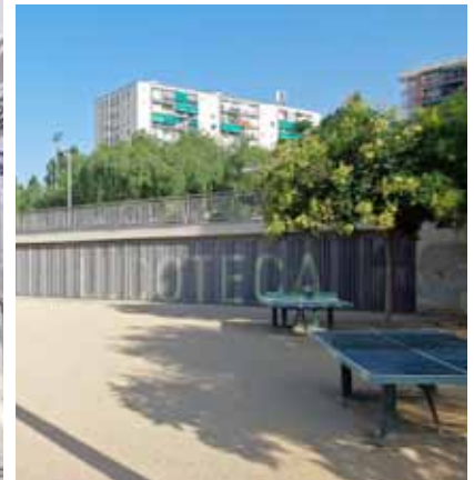
D'esquerra a dreta, el carrer de Primer de Maig, el de Mare de Déu del Carme, unes maquetes dels contenidors que s'instal·laran a la vila i l'Espai Familiar "Ludoteca".