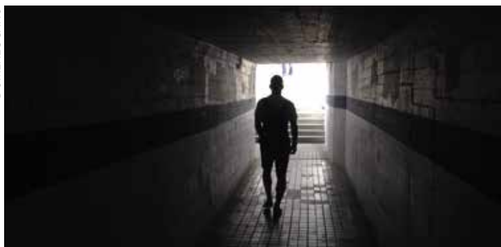
Es van analitzar els passos que hi ha entre l'estació d'Ocata i Alella.