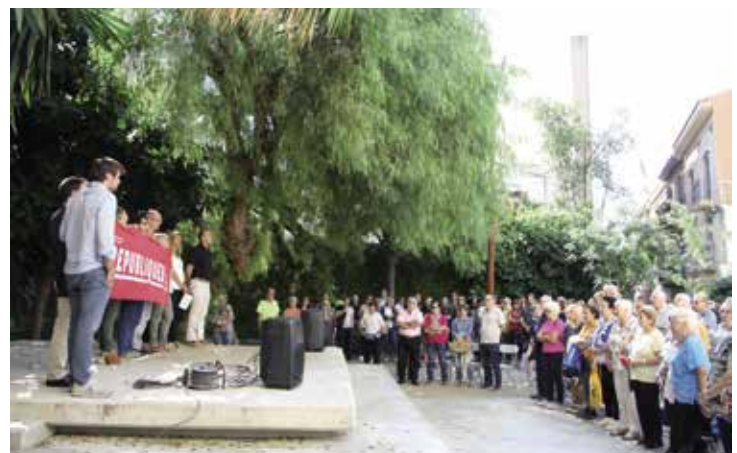
Acte commemoratiu als jardins de Can Malet.