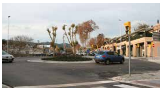
La nova rotonda.