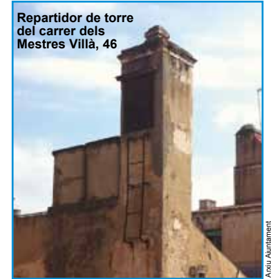
Repartidor de torre del carrer dels Mestres Villà, 46

El sistema de mines va funcionar al Masnou fins a la dècada de 1960-1970, en què se'n va fer càrrec el servei municipal. Actualment encara hi ha cases que, tot i tenir l'aigua del servei municipal, utilitzen l'abastiment de la mina per a ús domèstic: rentar, regar, etc.