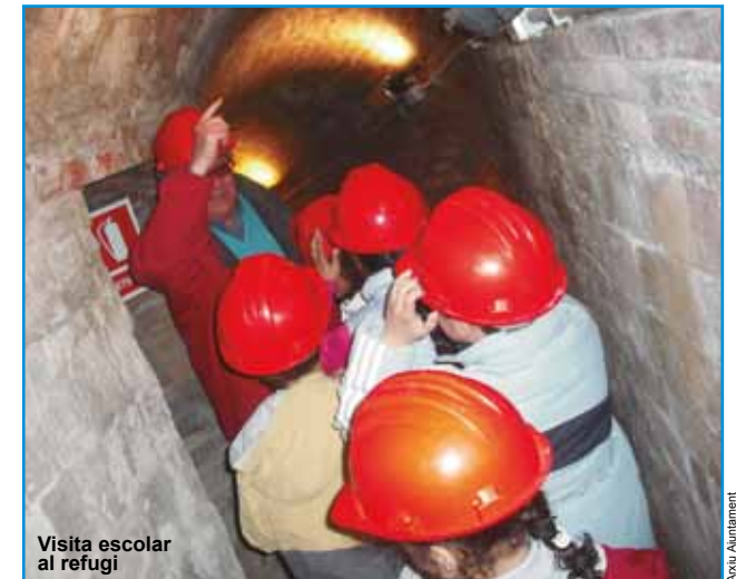
Visita escolar al refugi

Per facilitar-hi l'accés i garantir-hi la seguretat, es van reforçar algunes de les parets laterals de la mina amb maó, es va donar més altura a les galeries i s'hi va construir una nova escala d'accés.