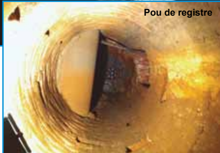
Pou de registre