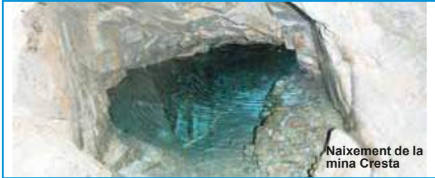
Naixement de la mina Cresta