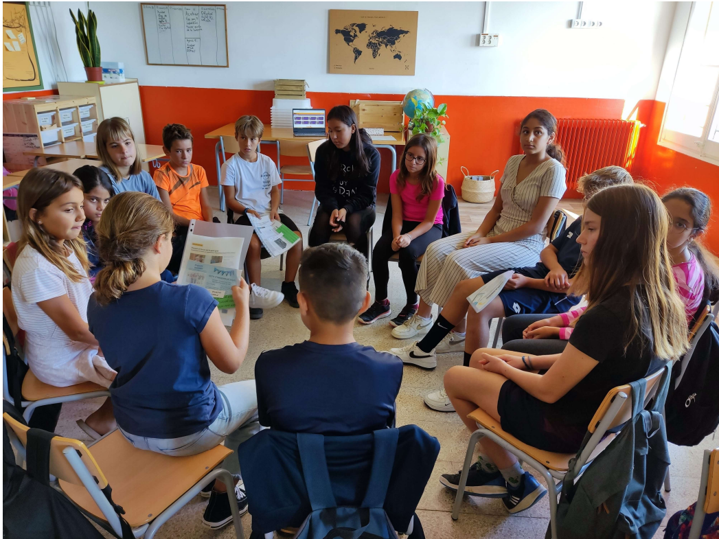
Dinàmica d'elecció dels temes del CMI