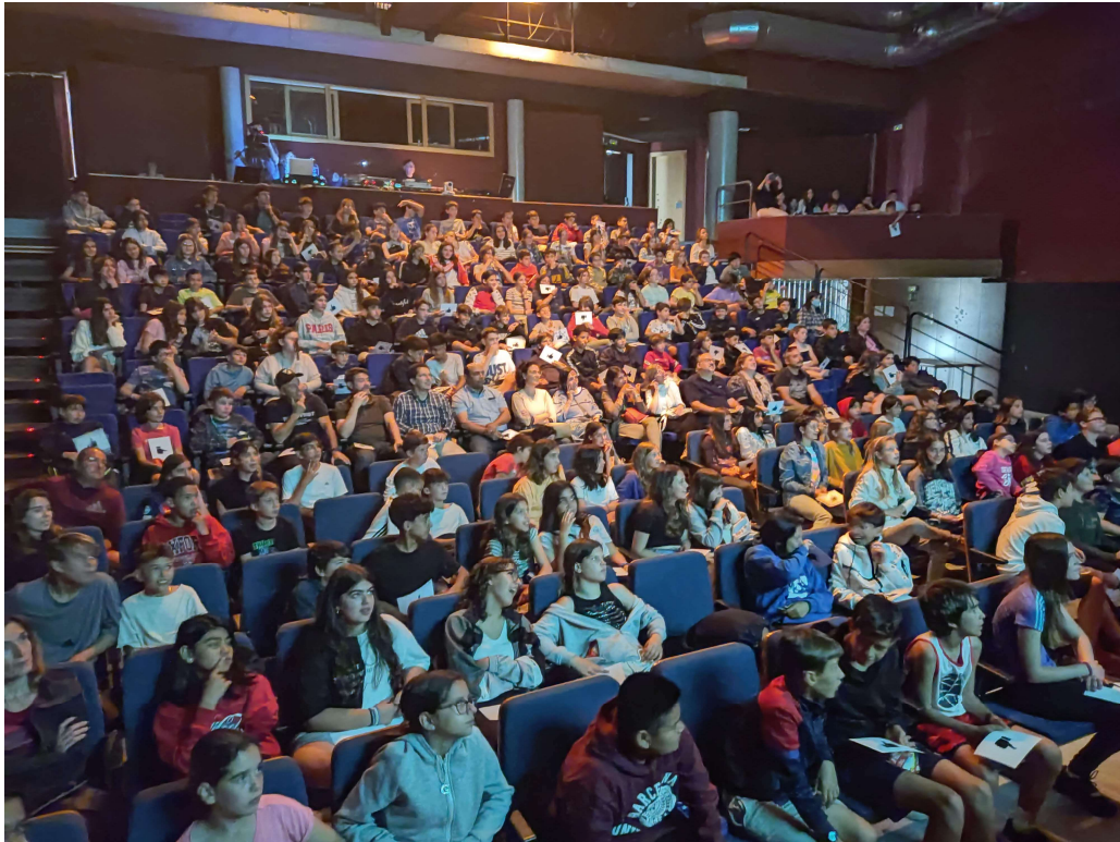
L'alumnat de sisè de totes les escoles assistint a la sessió plenària