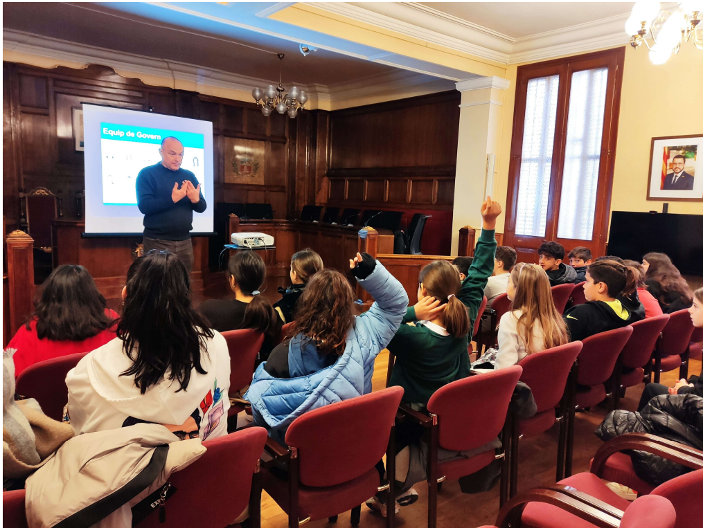
Un dels grups de 6è a la sala de plens a la xerrada sobre la democràcia i els acords