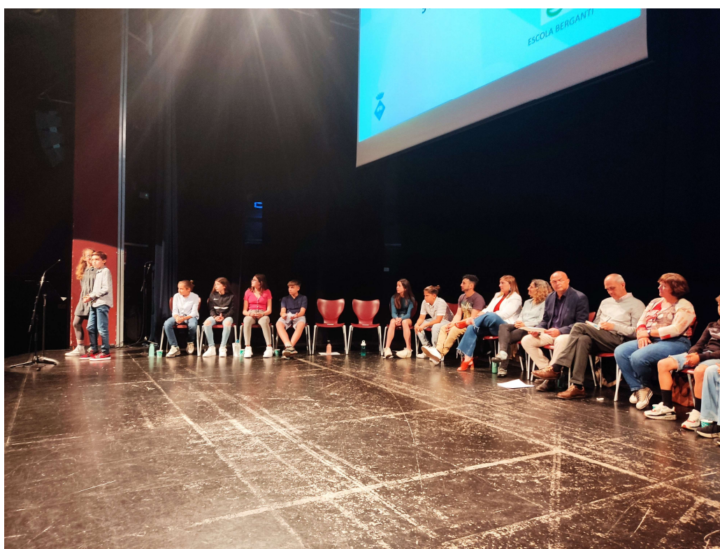
Imatge del desenvolupament de la sessió plenària, el 3 de maig de 2023