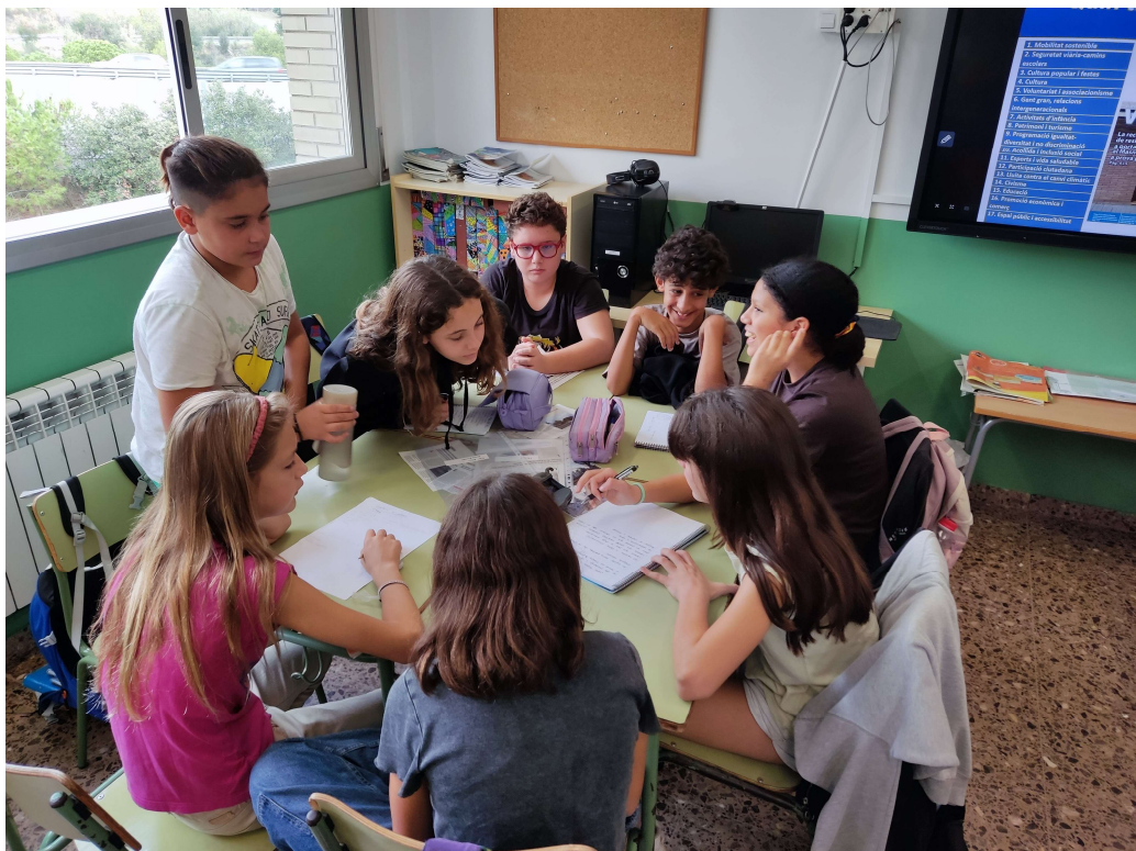
Anotació de primeres propostes i prioritització dels temes de treball