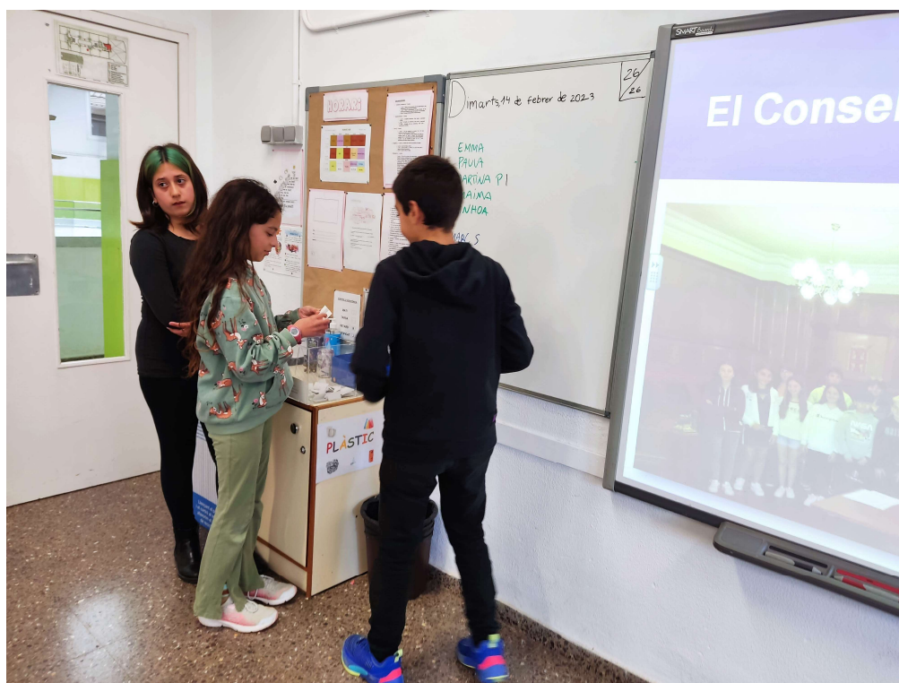
Recompte de vots