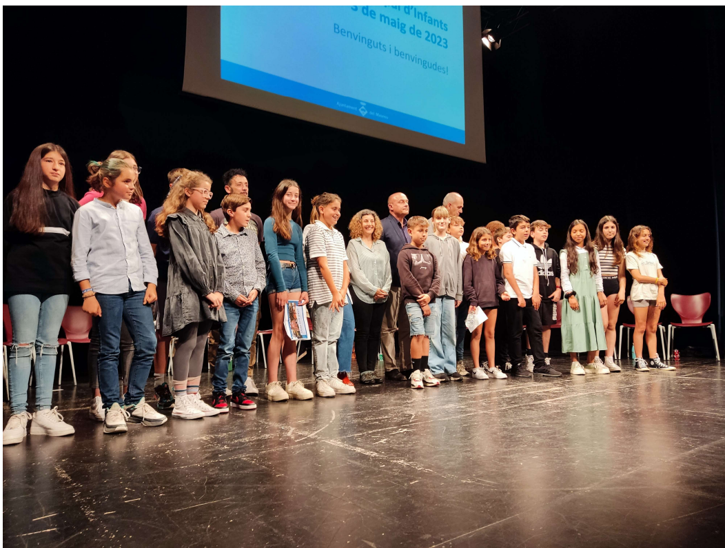
Foto final de les persones participants a la sessió plenària, el 3 de maig de 2023.