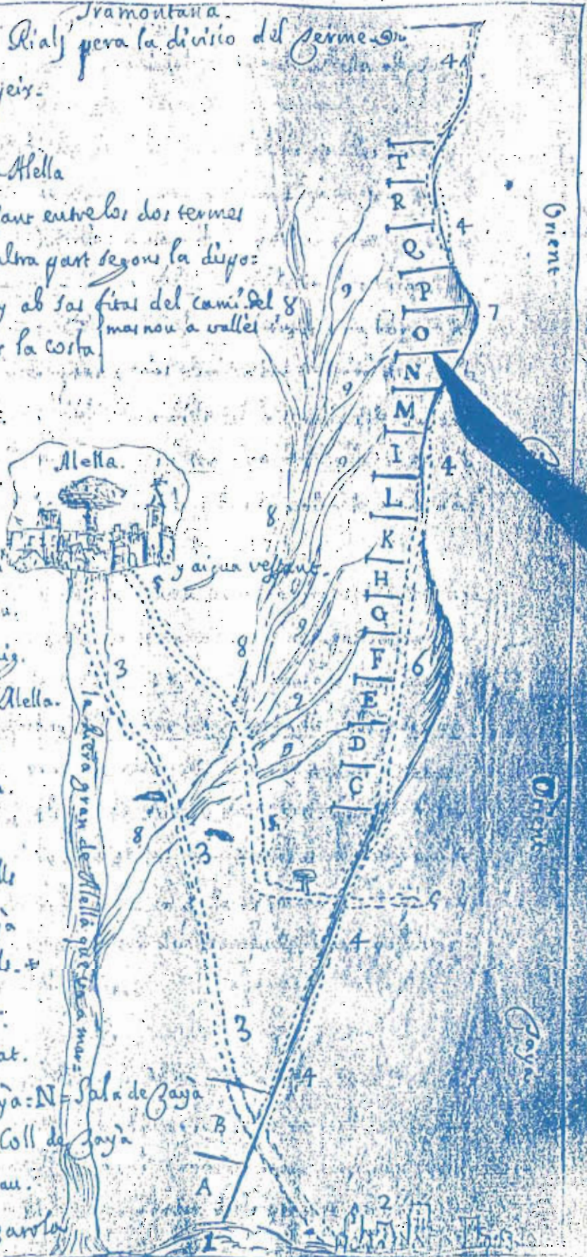
Plànol que acompanya un text manuscrit del rector d'Alella Francesc Riu (Manresa 1666 - Alella 1740).