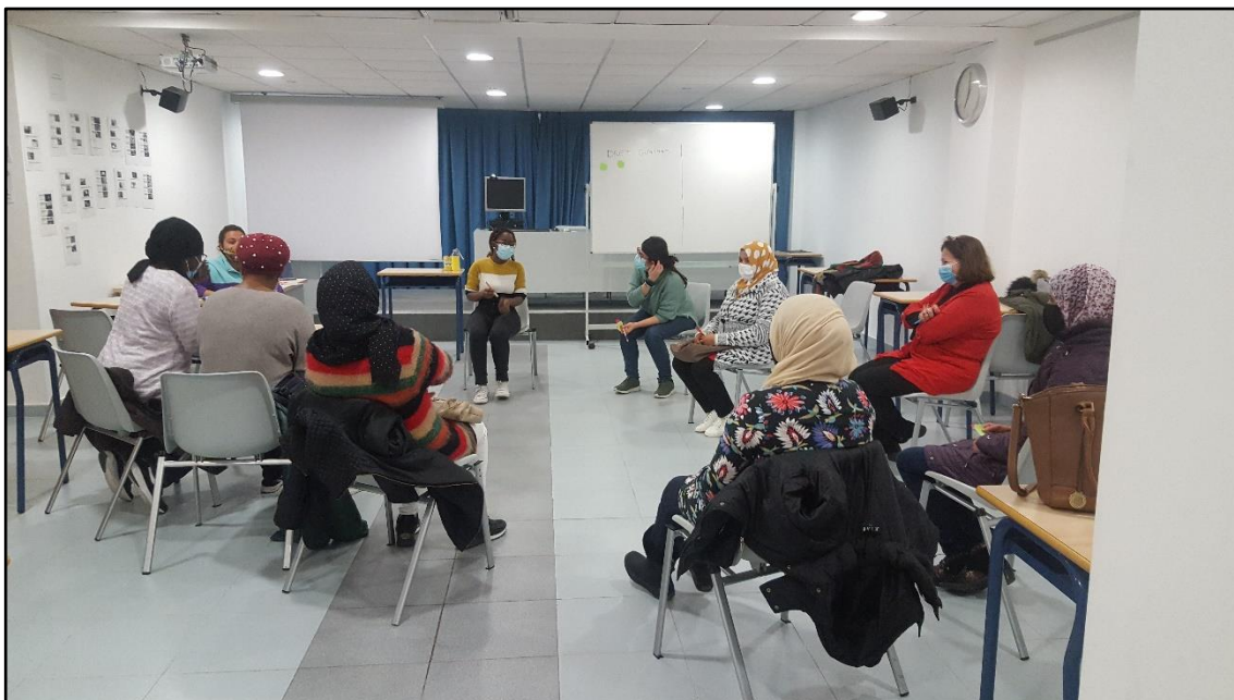
Les alumnes d'alfabetització del CFPAM en una de les sessions del Projecte Alfa (16/02/2021).

El Projecte Alfa es va concebre com una intervenció formativa en clau feminista, destinada a les nostres alumnes del curs d'alfabetització, un grup de dones caracteritzat pel seu origen magrebí, per ser musulmanes i provinents de zones rurals. Aquestes característiques fan que la discriminació de gènere sigui travessada per altres tipus de discriminació de caràcter religiós o ètnic. Totes aquestes discriminacions calia considerar-les com un tot, com un projecte feminista basat en la interseccionalitat.