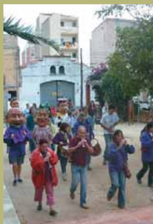
Un objectiu: la col·laboració entre diferents entitats.