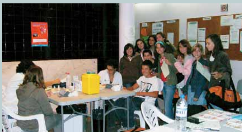
Els escolars del Masnou també van participar en la campanya.

Un total de 475 persones han pres part de la campanya de prevenció de malalties de risc cardiovascular "Curem-nos en salut" que es va dur a terme entre el 22 i el 26 d'octubre. Dins d'aquesta campanya es van oferir controls del colesterol, de la glucosa i la pressió arterial per a tota la ciutadania que s'acostés a un dels punts d'anàlisi. A més a més, es van repartir tot un seguit de díptics informatius sobre el colesterol, la pressió arterial i el sucre. També sobre l'activitat física, la dieta mediterrània i les activitats que s'ofereixen al Complex Esportiu Municipal. ■