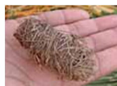
Capoll de morrut