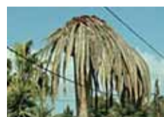
Palmera molt afectada