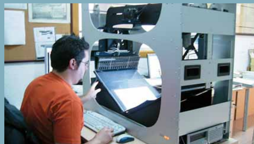
Un moment del procés de digitalització.

En el termini "d'un mes", les imatges digitalitzades de les actes es podran consultar a l'Arxiu municipal. ■