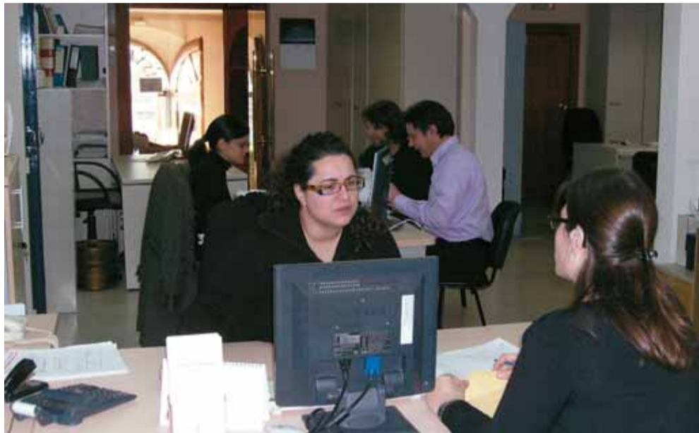
El Departament de Recaptació de l'Ajuntament es troba a l'edifici central.

La base impositiva de l'IBI se situa en el 0,92%, mentre que hi ha un augment generalitzat als impostos municipals del 2,7%