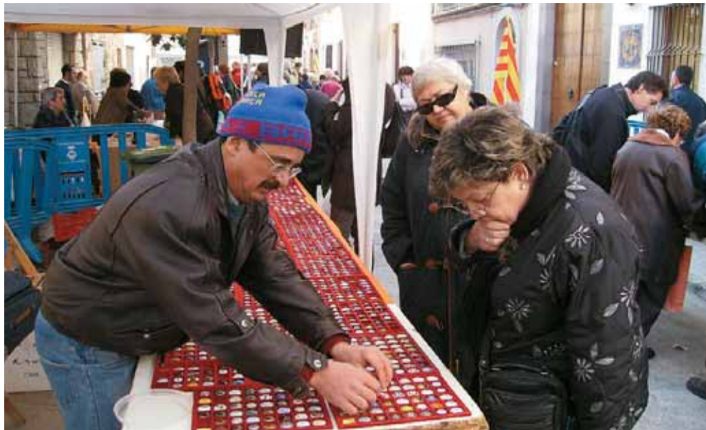
Una vintena de paradistes es van instal·lar al carrer de Pere Grau.

Una cinquantena de persones assisteixen a la visita guiada al cinema La Calàndria