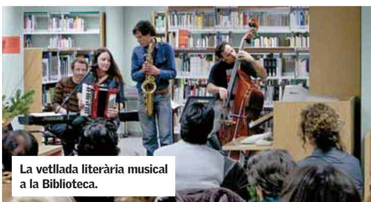
La vetllada literària musical a la Biblioteca.