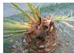
Palmera jove afectada