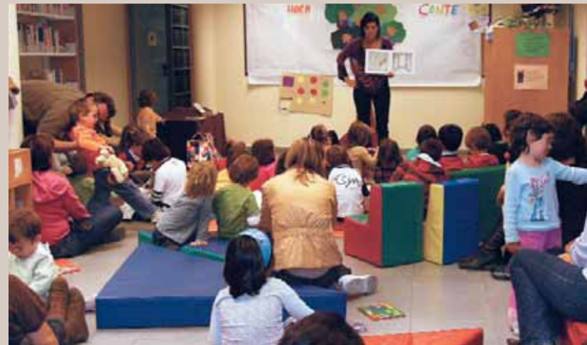
Contes d'Aquí i d'allà, una activitat amb molt èxit.

El Projecte educatiu d'entorn (PEE) continua creixent i ja ha fet un pas decisiu per consolidar-se. El 13 de novembre passat, la Comissió Local del PEE va aprovar el projecte i va decidir presentar-lo al Departament d'Educació de la Generalitat. La Comissió Local està formada per la direcció dels centres educatius, personal tècnic de l'Ajuntament, membres de l'EAP (Equip d'Assessorament Psicopedagògic), del CRP (Centre de Recursos Pedagògics), el CFAM (Centre de Formació d'Adults del Masnou), coordinadors LIC (Llengua, Innovació i Cohesió Social) i la Comissió Gestora del PEE , formada per l'inspector del Departament, el regidor delegat d'Educació, la tècnica d'educació, l'assessora LIC i el dinamitzador del PEE.