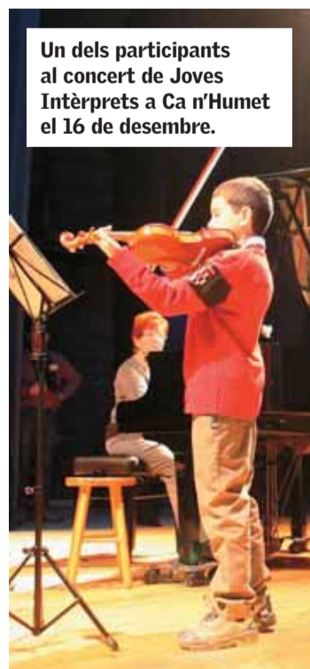
Un dels participants al concert de Joves Intèrprets a Ca n'Humet el 16 de desembre.