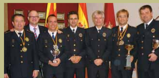
L'equip de tir de la Policia Local del Masnou.