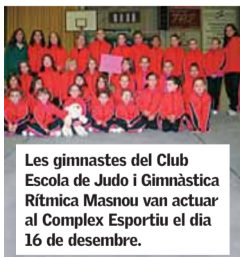
Les gimnastes del Club Escola de Judo i Gimnàstica Rítmica Masnou van actuar al Complex Esportiu el dia 16 de desembre.