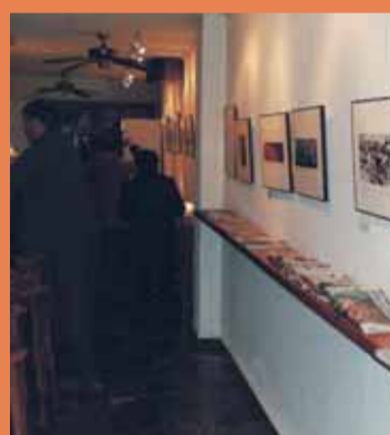
L'exposició es va poder visitar durant el mes de novembre.