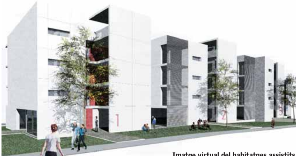
Imatge virtual del habitatges assistits.

Els habitatges assistits per a la gent gran del Masnou comencen a ser una realitat. Durant el tercer trimestre del 2007 ja han començat les obres al carrer de Josep Tarradellas, després que s'atorgués la llicència el 26 de juliol. En aquesta zona es construiran 20 dels 56 habitatges que es construiran. La resta s'ubicaran al carrer de Joan XXIII. Els pisos costaran aproximadament 4 milions d'euros, que seran a càrrec de la Generalitat.