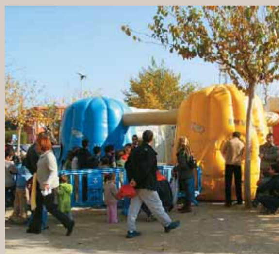
Hi va haver activitats molt diverses.

Una festa del reciclatge i animació infantil commemoren els dos anys de la iniciativa