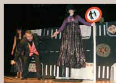
Un moment de la representació.

L'espectacle de màgia Passem-ho bé ha estat la cloenda dels tallers d'educació viària per a alumnes de 5è de primària que han dut a terme