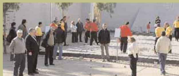
Partides a la inauguració del parc Esportiu Pau Casals.

El Club, amb 110 persones associades, competeix a la lliga provincial de la Federació Catalana de Petanca, a més de participar en diversos tornejos arreu de Catalunya. El mateix Club organitza un torneig el 23 de desembre. A més a més, l'entitat participa en actes destacats al municipi, com la Festa Major. ■