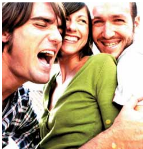
Els tres components del grup Facto Delafé y las Flores Azules.

Facto Delafé y Las Flores Azules, que compta amb un gran reconeixement al circuit musical català i de tot l'Estat espanyol, serà l'encarregada d'inaugurar, el 22 de desembre, les recents obres de millora dutes a terme a Ca n'Humet. El concert començarà a les dotze de la nit i serà un dels plats forts del calendari festiu.