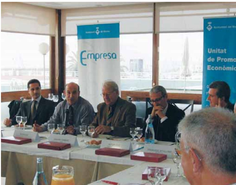
Bel, segon per l'esquerra, adreçant-se a l'empresariat local.

L'economista participa en una jornada del Cafè i Empresa