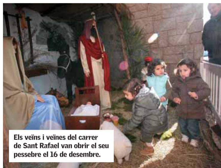
Els veïns i veïnes del carrer de Sant Rafael van obrir el seu pessebre el 16 de desembre.

la il·luminació del Monument a la Sardana, de Miquel Igual , amb una xerrada de l'assagista Lluís Subirana . D'altra banda, el diumenge 16, els veïns i veïnes de Sant Rafael van obrir el seu pessebre. Les propostes, fins passat Reis, es multipliquen per poder gaudir de les festes al municipi. Els dies 27, 28 i 29 de desembre, els infants podran gaudir dels jocs i les activitats del Nadalem, al Complex Poliesportiu, mentre que la gent jove també tindrà el seu Nadalem entre el 27 i el 29 de desembre i del 2 al 4 de gener, a Ca n'Humet.