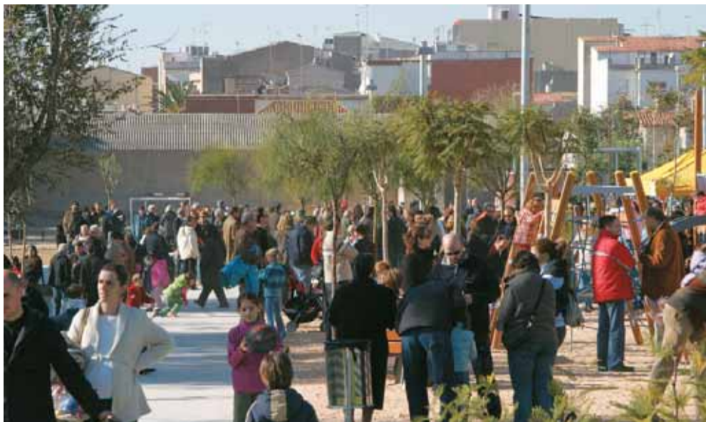
Unes 400 persones van assistir a la inauguració, el 18 de novembre passat.

La primera fase dels jardins dels Països Catalans ja és una realitat