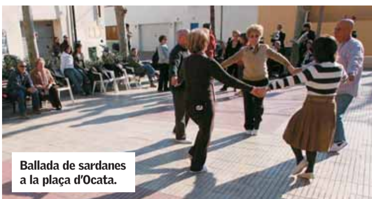
Ballada de sardanes a la plaça d'Ocata.