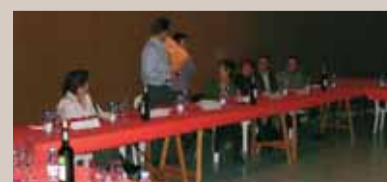
No van faltar els obsequis.

Més de seixanta persones pertanyents a la comunitat educativa del Masnou van participar en el sopar