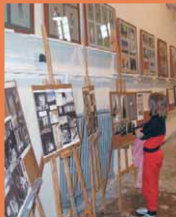
Carles Fontserè va ser una personalitat destacada al món de les arts.

L'entitat i escola d'arts Blancdeguix acull, fins a finals del mes de gener, la mostra "L'escenografia: relació entre pintura i teatre", basada en els dibuixos realitzats pel prestigiós creador Carles Fontserè (1916-2006) per a diversos muntatges teatrals. La mostra va ser inaugurada l'1 de desembre.