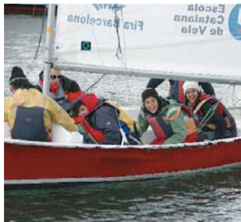
Participants en una de les activitats.

L'Escola de Vela del Club Nàutic està reconeguda per l'Escola Catalana de Vela de la Federació Catalana de Vela, fet que comporta unes garanties d'ensenyament i seguretat. La seva finalitat és donar a tothom la possibilitat de conèixer l'esport de la vela, des d'un bateig de mar fins a la possibilitat de formar part de l'equip de regates del Masnou.