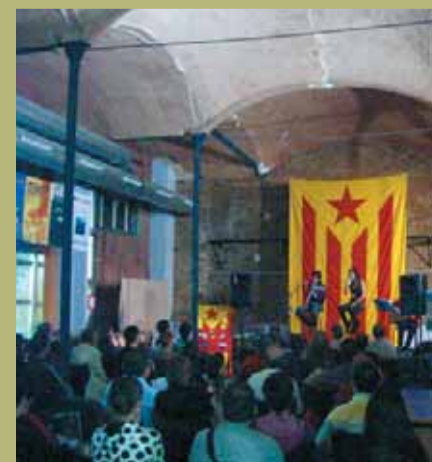
El Correllellengua va rebre una bona resposta per part de la ciutadania.