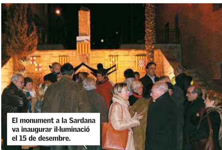
El monument a la Sardana va inaugurar il·luminació el 15 de desembre.