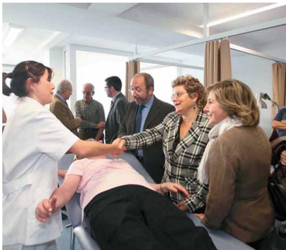
La consellera també va visitar el centre de rehabilitació Iriteb.

El centre podria entrar en funcionament durant el segon trimestre de 2008