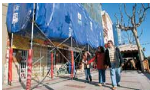
Els ajuts arribaran a un màxim de 4.000 euros per edifici i 400 per habitatge.

La Regidoria d'Habitatge de l'Ajuntament del Masnou, conscient de la necessitat de renovació del parc edificat al municipi, ha volgut impulsar mesures que contribueixin a fomentar-la i, per això, ha aprovat unes bases per a l'atorgament d'ajuts municipals. Segons aquestes bases, els ajuts arribaran a un màxim de 4.000 euros per edifici i 400 euros per habitatge.