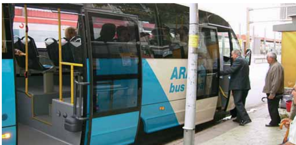
La signatura del nou conveni suposa millores en els vehicles i les parades.

El Masnou entrarà, a mitjan gener del 2008, a formar part de l'àmbit de l'ATM (Autoritat del Transport Metropolità), fet que suposarà la integració tarifària. La integració comporta que, durant una hora i mitja, els usuaris i usuàries d'autobús, tren i metro dels municipis inclosos en l'àmbit de l'ATM puguin canviar de mitjà de transport pagant només l'import d'un bitllet.