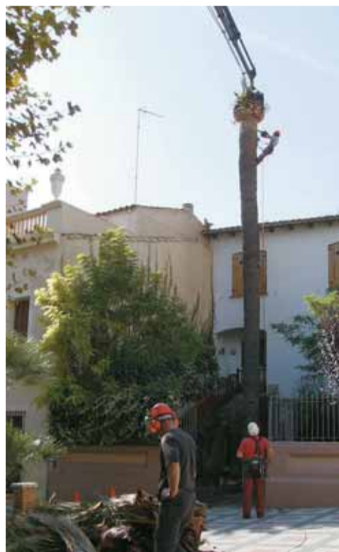
Operaris treballant en la tala d'una palmera afectada.

L'Ajuntament sol·licita a la Generalitat un pla d'actuació conjunta