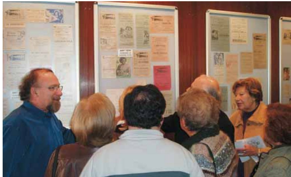
Visitants a la mostra de programes de mà antics a La Calàndria.

La trobada de plaques de cava organitzada per l'entitat Gent del Masnou , amb la col·laboració de l'Ajuntament, ja s'ha convertit en un punt de referència per a la gent que col·lecciona aquests objectes. Així ho va posar de manifest la bona resposta que va tenir la IX Trobada de Plaques de Cava del 25 de novembre. Prop d'un miler de persones va passar per la Trobada, al carrer de Pere Grau, on s'havien instal·lat una vintena de paradistes professionals de la venda de plaques.