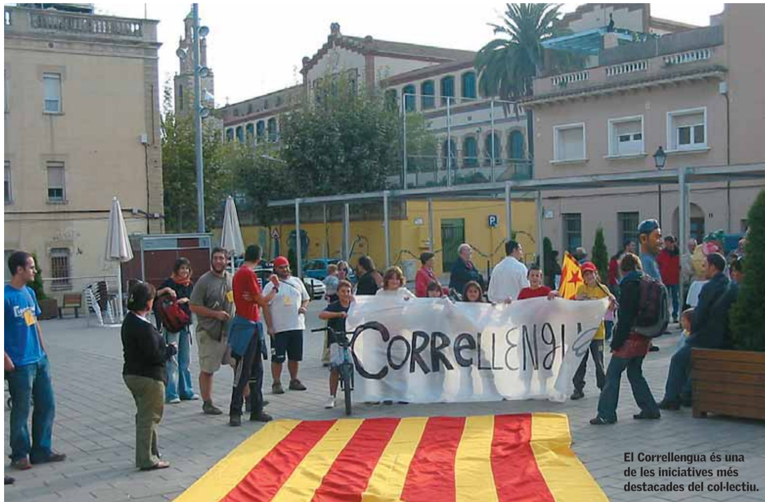
El Correllellengua és una de les iniciatives més destacades del col·lectiu.

El grup de joves vol dinamitzar el municipi i recuperar tradicions