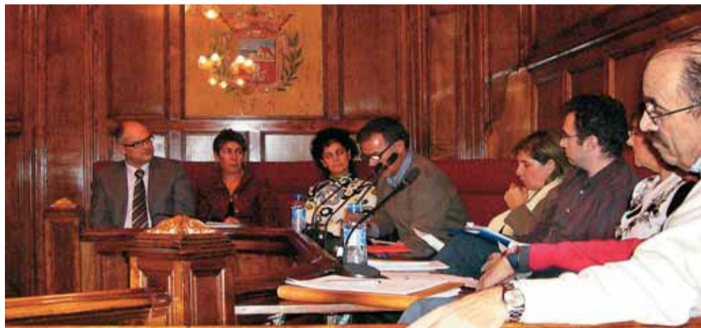
El Ple del mes de novembre va tenir lloc el dia 15.

Es presenten diverses mocions que reclamen el restabliment del servei de RENFE i per declarar el Masnou lliure de cultius transgènics