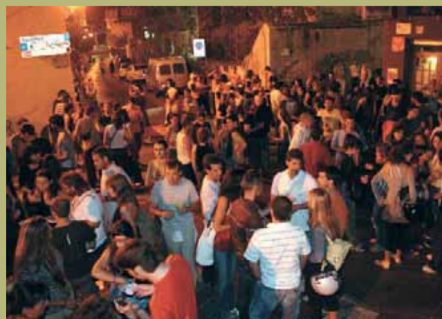
El Cercatasques va reunir unes 300 persones al mes de juny en el preàmbul de la Festa Major.