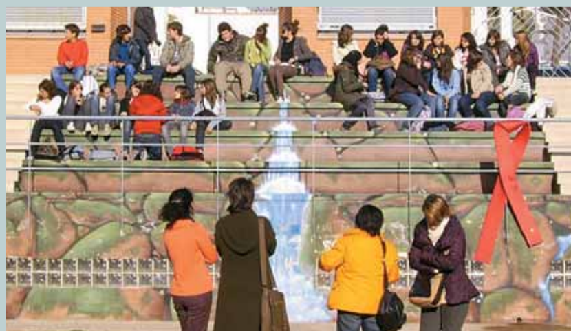
La campanya vol fer incidència en la importància de la prevenció.

Aquesta iniciativa teatral tradicionalment es fa coincidint amb les dates de la celebració del Dia Mundial contra la Sida. En d'altres ocasions, l'obra representada ha estat No em ratllis , amb la qual es treballa la prevenció de conductes de risc associades al consum d'algunes drogues, com l'alcohol, els porros o les drogues de síntesi, tot d'una manera amena i interactiva. També, coincidint amb el Dia Mundial Contra la Sida, la Regidoria va repartir llaços vermells com a mostra de solidaritat envers les persones afectades per aquesta malaltia. ■