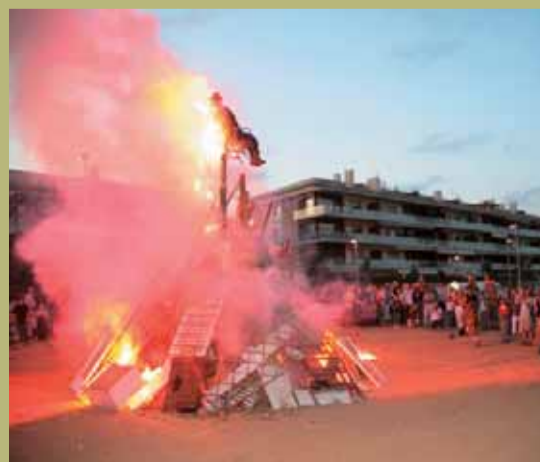
La Flama del Canigó va tornar per Sant Joan al Masnou.