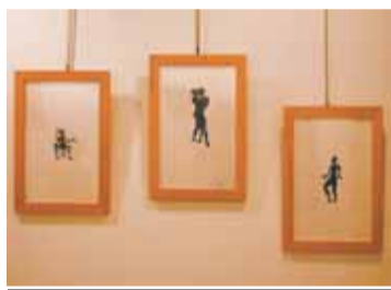
Obra de Núria Casalpeu