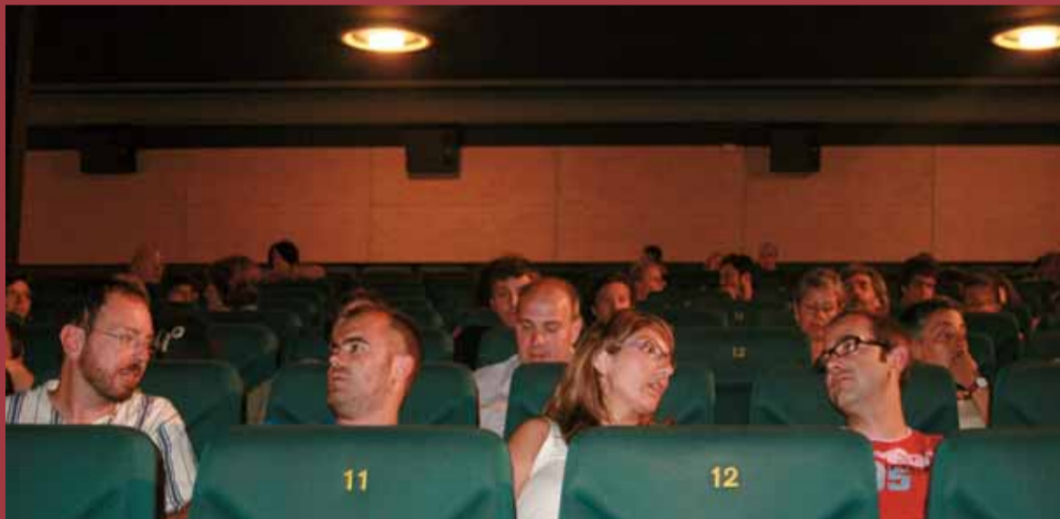
El cinema La Calàndria va acollir diverses projeccions.