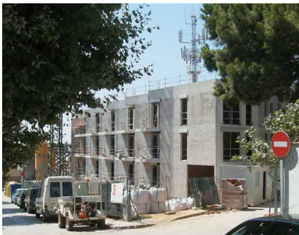
Abans de finalitzar l'any 2009, es lliuraran els 20 habitatges per a gent gran que s'estan construint al carrer de Josep Tarradellas.

Oficina Local d'Habitatge Av. de Prat de la Riba, 30 Tel. 93 540 91 38 habitatge@elmasnou.cat