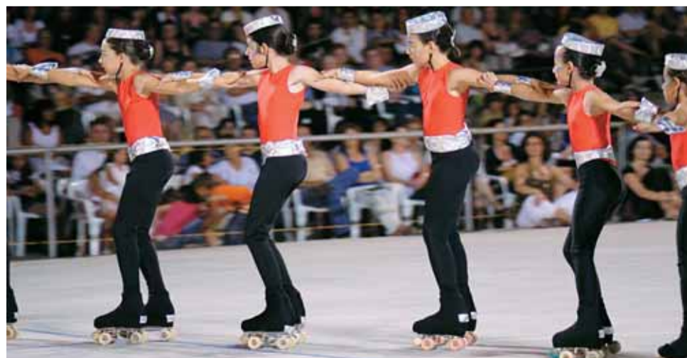
Les actuacions van incidir en la conscienciació ambiental.

El Club de Patinatge El Masnou va presentar l'espectacle "Preservar la Terra"