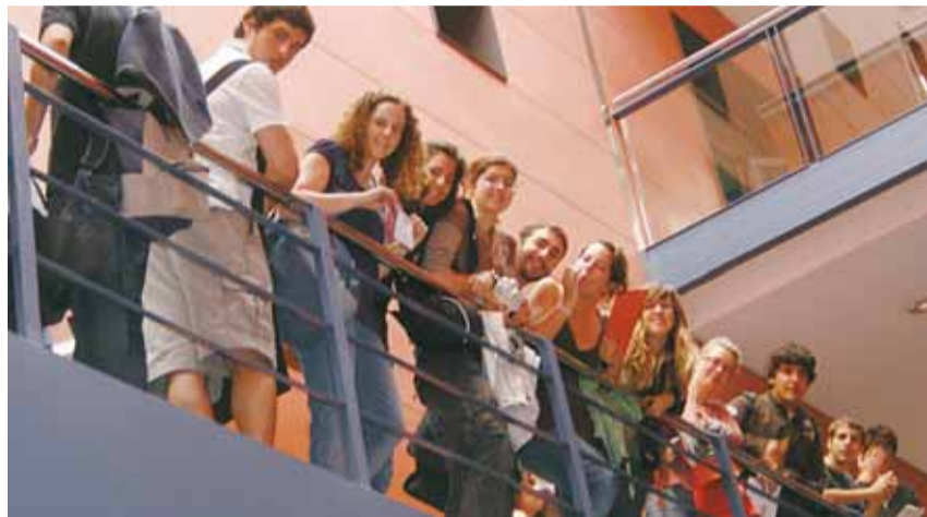
A l'esquerra, l'alumnat de l'IES Mediterrània als passadissos de la Universitat Pompeu Fabra. A la dreta, l'alumnat de l'IES Maremar just després d'acabar les proves de selectivitat.

Aquesta va ser l'última selectivitat tradicional, que consistia en una prova única per accedir a totes les universitats públiques de l'Estat i que es distribuïa en set exàmens al llarg de tres matins. L'any vinent s'aplicarà un nou model que, a dia d'avui, encara té força incògnites. ■