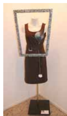
Obra d'Ànnia Aragonès