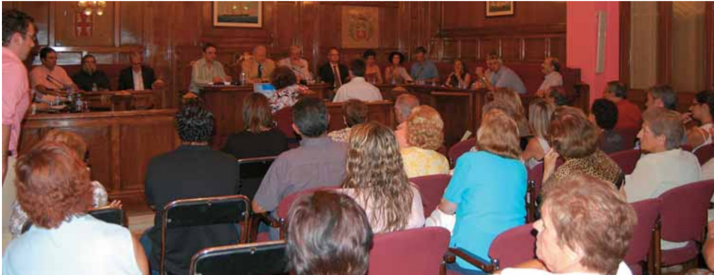
La sala de plens es va omplir de ciutadans i ciutadanes que volien manifestar la seva protesta.