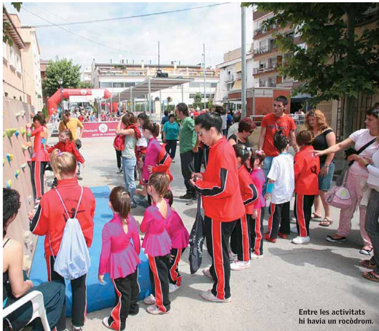
Entre les activitats hi havia un rocòdrom.

Entitats i clubs esportius mostren la seva feina en una jornada festiva