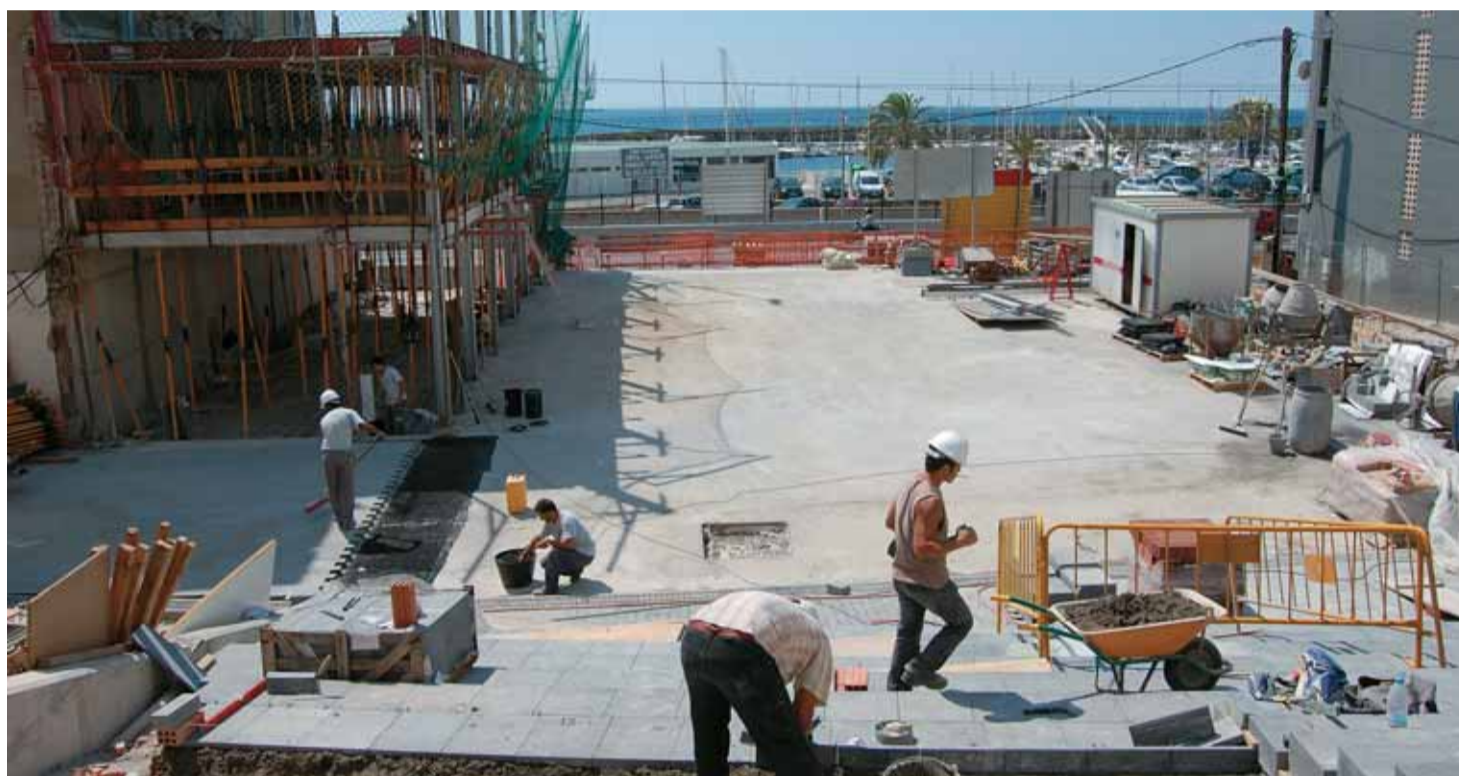
Els treballs continuen a bon ritme per complir el calendari previst.