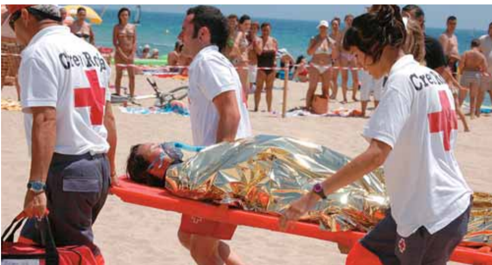
Un moment del simulacre del rescat aquàtic.

Un bon nombre de banyistes van presenciar les exhibicions i van participar a les activitats organitzades durant tot el dia de dissabte 5 de juliol a les platges d'Ocata i el Masnou per celebrar el Dia de la Creu Roja. Organitzada per aquest organisme internacional, amb la col·laboració de l'Ajuntament aquesta diada volia difondre la tasca dels voluntaris i voluntàries de la Creu Roja i contribuir a recaptar fons. Entre les activitats dutes a terme, la més