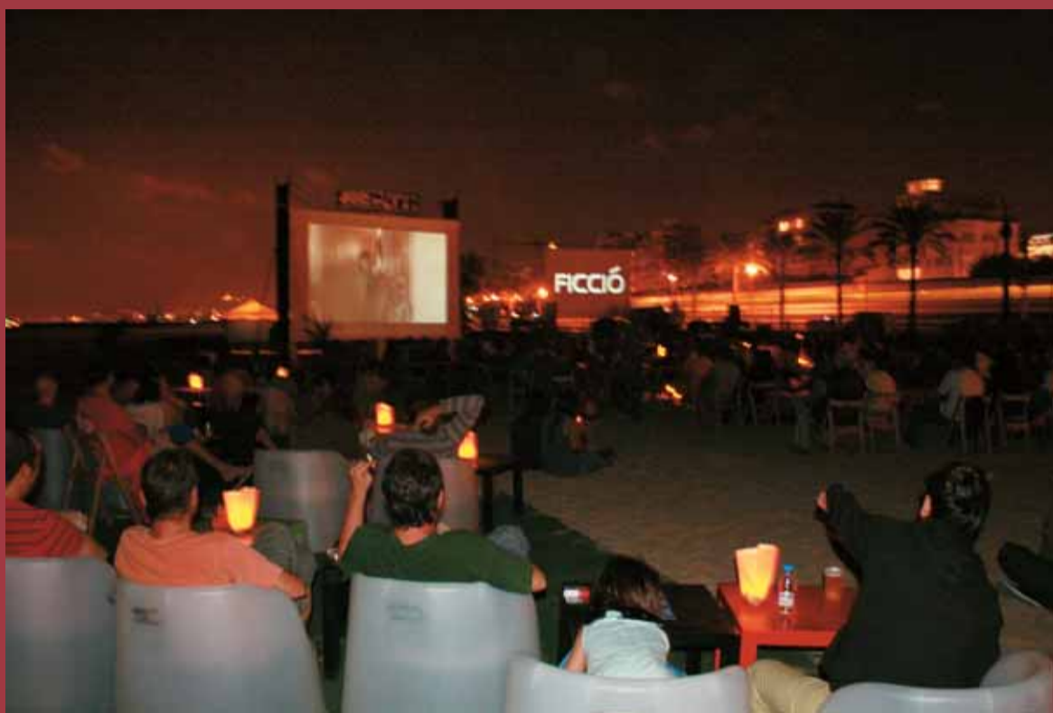
Les projeccions a la platja, un èxit.

'Mensajes de voz', de Fernando Franco, premi al millor curtmetratge de ficció