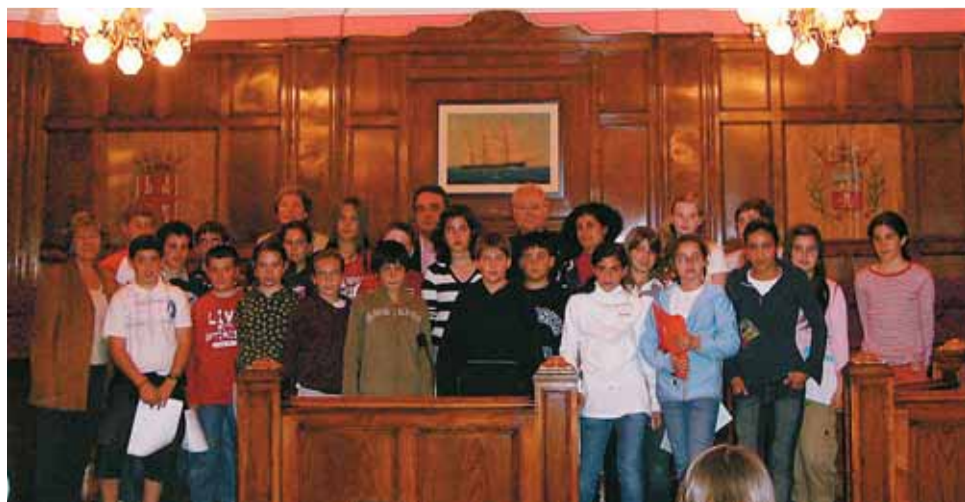
Fotografia de grup durant l'acte de cloenda amb representants del consistori.

L'últim Ple del Consell d'Infants, format per onze regidors i regidores i els suplents respectius, tots alumnes de 6è curs de primària de les escoles masnovines, va escollir el 22 d'abril com a propostes més votades d'enguany la construcció d'una pista d'skate amb parets per fer-hi grafitis, la programació d'un conjunt d'activitats per fer a Ca n'Humet els caps de setmana i l'eliminació de barreres arquitectòniques.