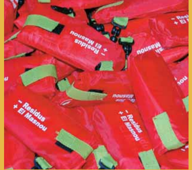
Bosses de compra reutilitzables.

El 3 de juliol, el Masnou va celebrar el Dia Lliure de Bosses de Plàstic, dins la campanya promoguda per la Fundació Privada Catalana de Prevenció de Residus i Consum Responsable. L'Ajuntament del Masnou va instal·lar un estand a l'Edifici Centre per informar sobre la campanya global per eradicar l'ús de les bosses de plàstic i conscienciar la població sobre la necessitat de la reducció de la utilització d'aquest material. Al llarg de tot el dia es va obsequiar amb una bossa reutilitzable de roba a tothom.