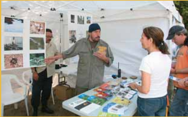
Un dels punts informatius al parc del Llac.

Al Masnou es van celebrar diversos actes amb motiu del Dia Mundial del Medi Ambient, el 5 de juny. El cicle es va iniciar amb la xerrada acompanyada d'una exposició sobre la presència del gamarús al Masnou. També dins la celebració d'aquesta diada, el diumenge 8 de juny, el parc del Llac va acollir una trobada d'entitats del municipi que treballen en temes relacionats amb el medi ambient. Hi va haver un punt informatiu sobre els residus al Masnou, es va inaugurar el sistema de recirculació d'aigua del parc i es va fer una demostració de com funcionen les cuines solars amb degustació de productes cuinats. A més a més, hi va haver jocs mediambientals per a la canalla i una actuació infantil.