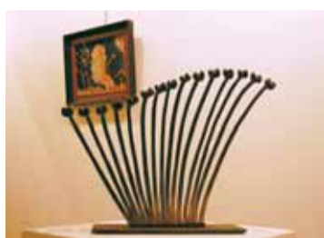
Obra de Pol Codina