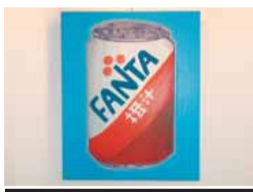
Obra de Toni Valdés