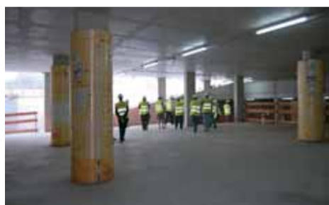
L'aparcament tindrà cabuda per a 45 vehicles.

Les obres han patit un retard de sis mesos respecte de la previsió inicial a causa de les complicacions que van sorgir al començament de la intervenció, quan es va comprovar que el nivell de les aigües freàtiques no es trobava a la cota prevista, sinó un metre més amunt. Aquest fet, a més de retardar el ritme de la intervenció, perquè s'havia de recalculer l'estructura de formigó, va provocar una reducció del nombre de places d'aparcament, de les 60 previstes a les 45 que s'hi han construït definitivament. Les obres tenen un pressupost d'adjudicació de 3,3 milions d'euros.