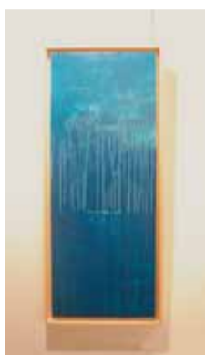
Obra de Yolanda Vives