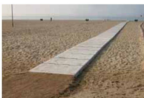
La nova passarel·la a la platja d'Ocata.

Algunes de les tasques d'aquests grups són: la pintura de tot el mobiliari urbà, el