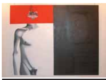
Obra de Xavier Rodríguez