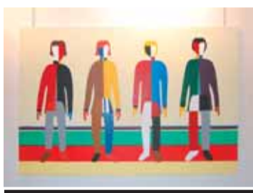
Obra de Teresa M. Aragó