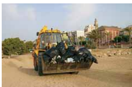
Maquinària recollint la brossa.

repàs de tots els serveis, el control dels jocs infantils i la jardineria. Quant a la neteja, es fa de dues maneres: mecànicament (amb llauradors de sorra) i manualment (a càrrec de vuit peons, sis dels quals són contractats per l'Ajuntament i dos per mitjà de plans ocupacionals de la Generalitat).