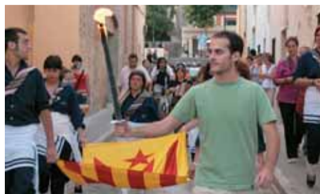
La flama del Canigó va passar pel Masnou de nou.

La nit del 23 de juny, el Masnou va celebrar la vigília de Sant Joan. Enguany també es va celebrar l'arribada de la flama del Canigó amb una passejada de la flama fins la plaça dels Països Catalans, on es va fer l'encesa de la foguera. Aquesta iniciativa va ser organitzada per l'Associació Cultural La Xalupa, Diables del Masnou, Gent del Masnou i Plataforma Cívica el Masnou 21, amb la col·laboració de l'Ajuntament del Masnou.