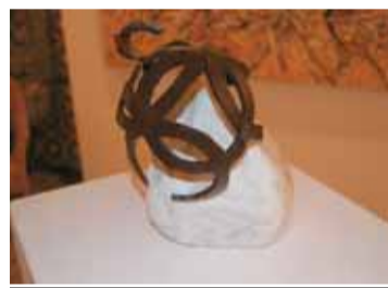
Obra d'Íngrid Ventura