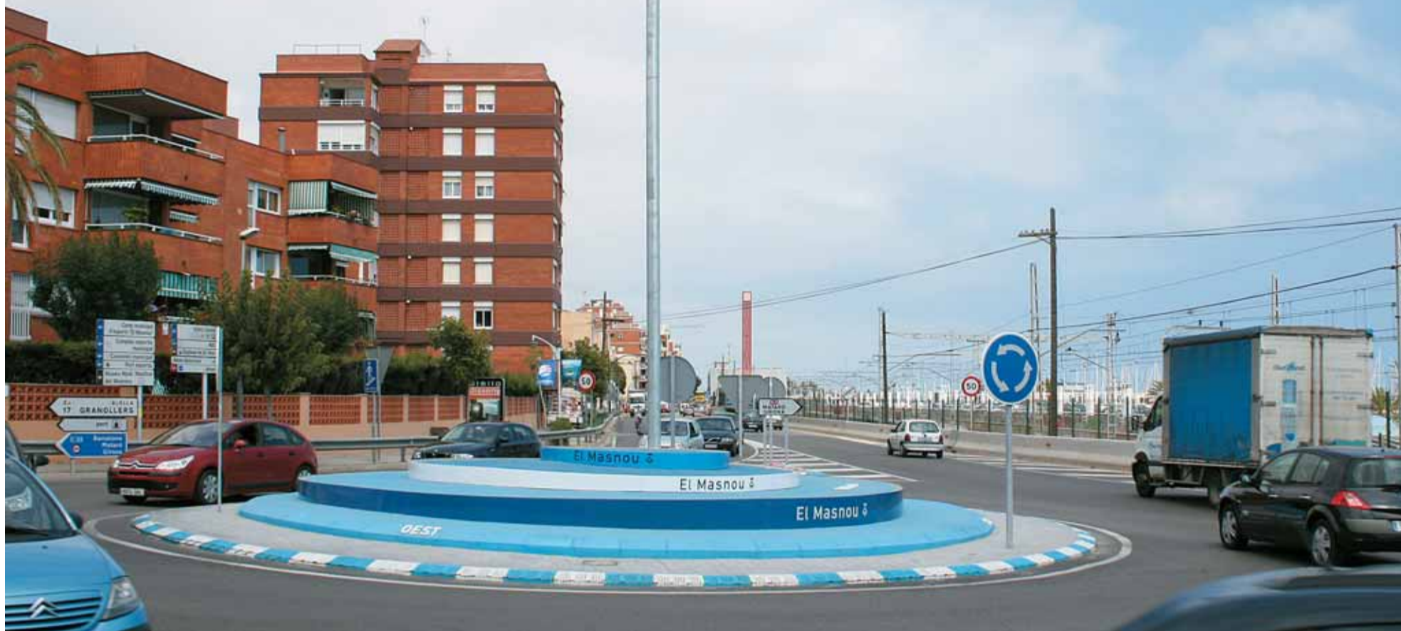
Les obres de la rotonda van acabar el mes de juny passat.