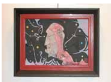
Obra de Gares (Pedro Espigares)