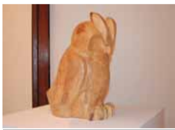
Obra d'Aleix Carreño