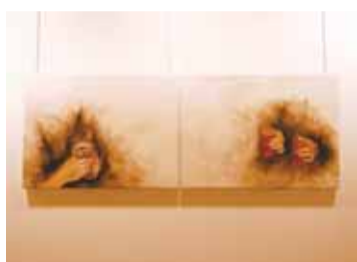
Obra de Cristina Camarero