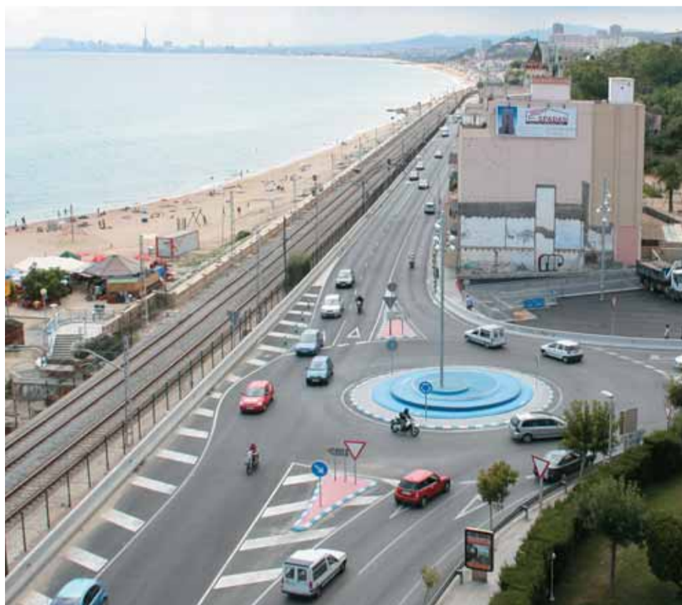
La rotonda ha contribuït a la pacificació de la Nacional II.