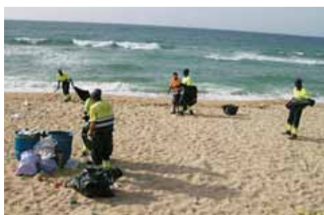
Una brigada de neteja.