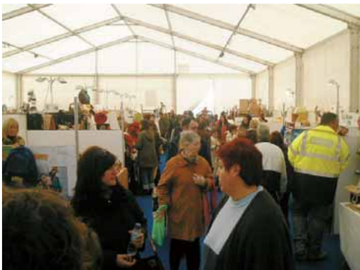
L'entitat organitza diverses fires per promoure el comerç local. A la dreta la Fira Comercial i Gastronòmica, a l'esquerra, la de Santa Llúcia.

La Federació del Comerç, la Indústria i el Turisme del Masnou es va crear l'abril de l'any 2000 com a entitat sense ànim de lucre i totalment apolítica amb l'objectiu de promocionar, ajudar i assessorar en la defensa dels interessos, i, en conjunt, sobre qualsevol altra activitat encaminada a la millora del comerç i la situació dels i les professionals d'aquest sector i de la indústria del Masnou. Va ser una iniciativa comuna de les sis associacions de comerciants que en aquella època estaven en funcionament al poble amb la finalitat de dur a terme el Pla de dinamització comercial, signat amb l'Ajuntament del Masnou i la Generalitat de Catalunya.