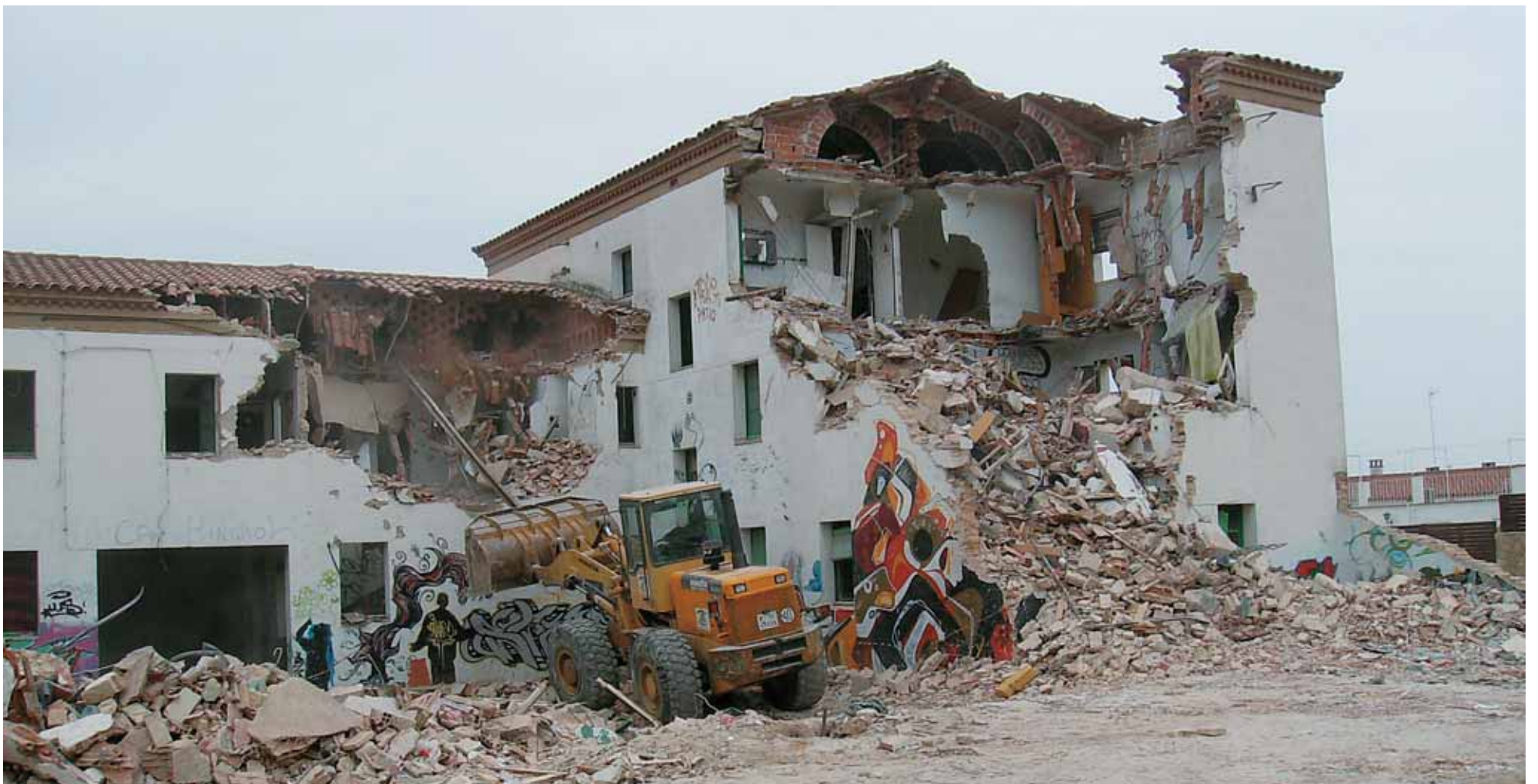
Els treballs d'enderrocament van començar el 23 de setembre i es van estendre fins a començament d'octubre.

El solar anirà destinat a la construcció de 40 habitatges socials