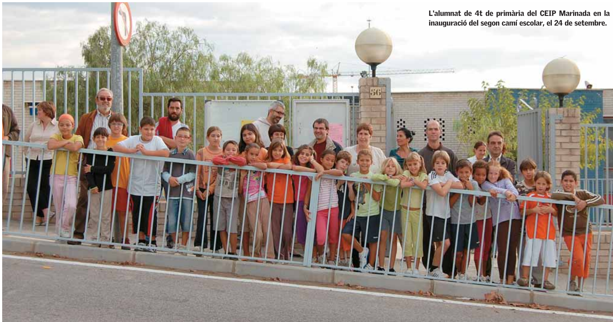
L'alumnat de 4t de primària del CEIP Marinada en la inauguració del segon camí escolar, el 24 de setembre.

Els centres educatius inicien el curs escolar 2008-2009 amb normalitat