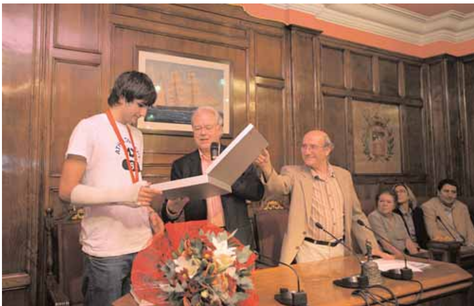
Ricky Rubio va rebre una placa commemorativa per part del consistori.