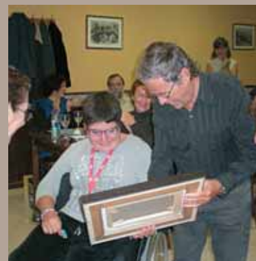
Al sopar del 4 d'octubre es van viure moments emotius.