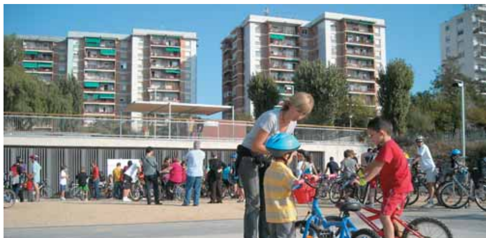
Les persones participants a la pedalada van recórrer 5 quilòmetres.

Amb el lema Aire net per a tothom , entre el 22 i el 28 de setembre es va celebrar la Setmana de la Mobilitat Sostenible i Segura al Masnou. La pedalada contra el canvi climàtic del dia 28 va ser el plat fort d'aquesta setmana, amb un recorregut amb bicicleta per la vila pen-