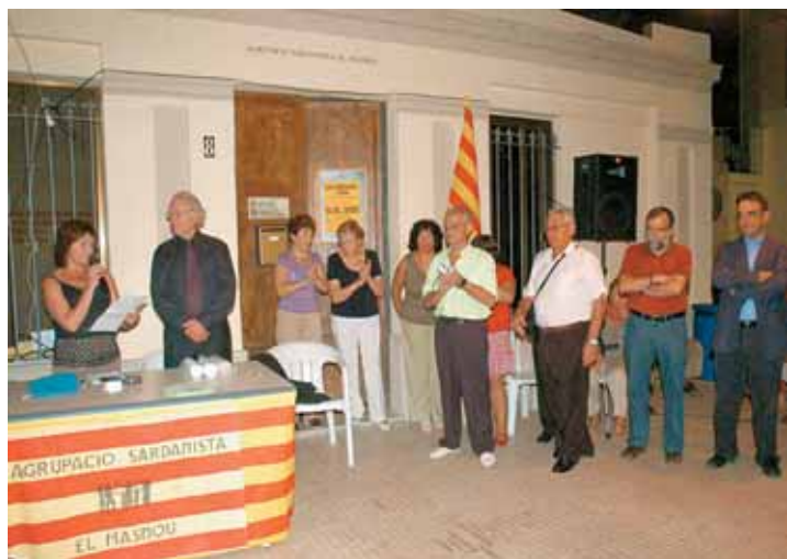
L'Agrupació va inaugurar les obres de remodelació del seu local el passat 10 de setembre, en el marc de la celebració de la Diada Nacional de Catalunya.