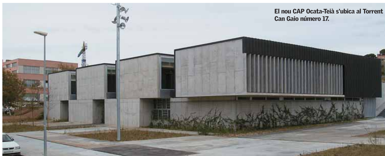
El nou CAP Ocata-Teià s'ubica al Torrent Can Gaio número 17.

La posada en marxa d'aquest nou CAP suposarà un desdoblament dels serveis d'atenció primària, en la qual actualment s'està treballant per acabar de definir el quadre mèdic resultant. Properament, els masnovins i masnovines rebran al seu domicili una notificació on s'indicarà quin