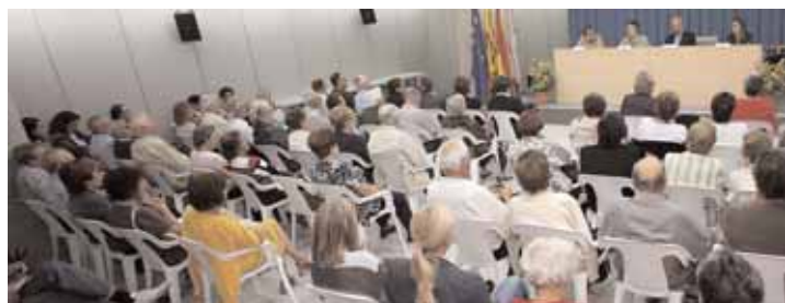
Un moment de la presentació de l'estudi que es va fer a Can Malet amb una bona assistència de públic.

La meitat de la població del Masnou amb més de 75 anys considera que la seva salut és bona o molt bona. A més, en aquest grup de població, un percentatge similar, superior al 50%, està compost de persones autònomes i que consideren que poden realitzar les principals activitats vitals –alimentació, higiene, mobilitat, etc.– per si mateixes. Aquestes són algunes de les xifres que aporta l'estudi sobre dependències de la gent gran elaborat per la Diputació i l'Ajuntament del Masnou que va ser presentat el 25 de setembre a Can Malet, en una sala amb públic, entre el qual es trobaven moltes persones que han participat en l'estudi.