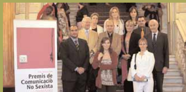
Tots els mitjans i institucions que van rebre el premi van posar a les escales del Liceu.