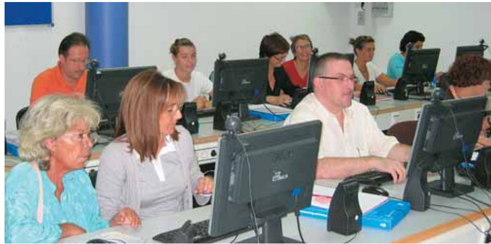
El Servei d'Ocupació aposta per la formació.

El Servei d'Ocupació posa a l'abast de la ciutadania un conjunt de recursos per a la inserció laboral