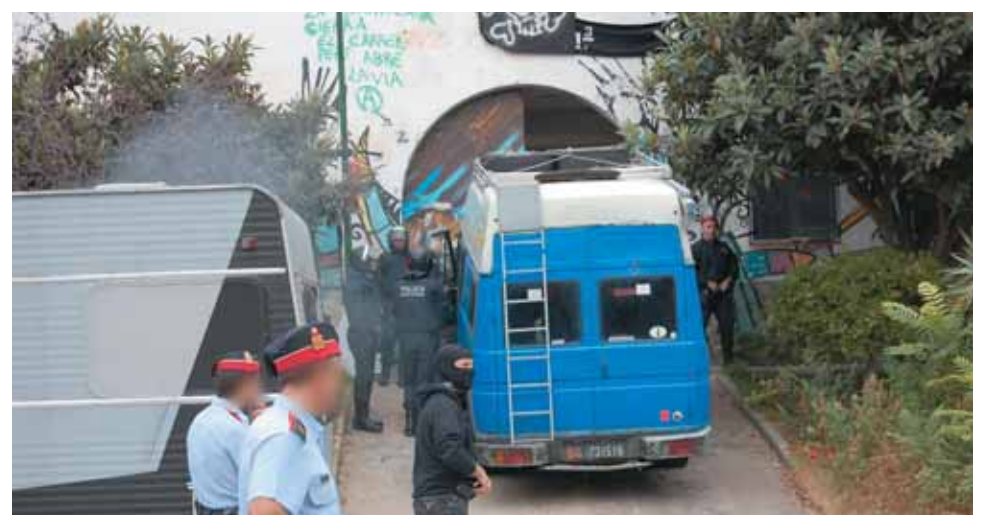
El desallotjament va començar a primera hora del matí del 23 de setembre.