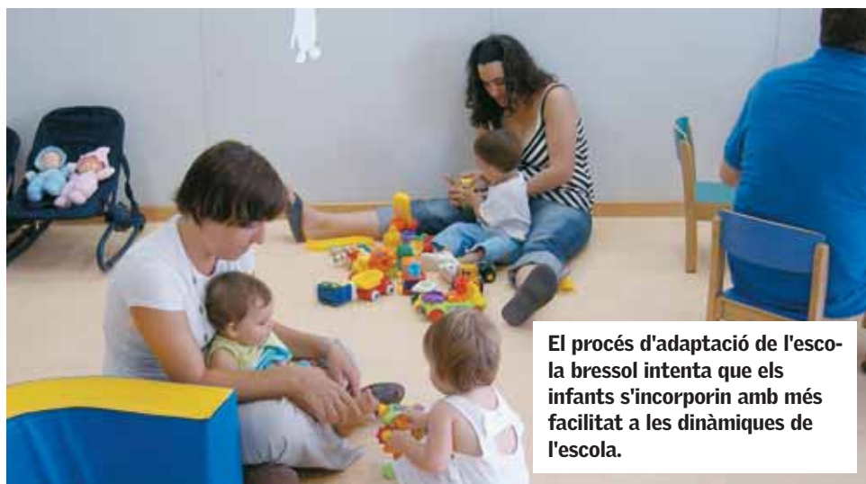
El procés d'adaptació de l'escola bressol intenta que els infants s'incorporin amb més facilitat a les dinàmiques de l'escola.

D'altra banda, des de fa mesos, la Regidoria està treballant conjuntament amb el Departament d'Educació per tal que es puguin atendre les demandes del CEIP Ferrer i Guàrdia i el CEIP Rosa Sensat. Simultàniament, continuen les actuacions del personal de Manteniment de l'Ajuntament per atendre les actuacions de menor dificultat. ■