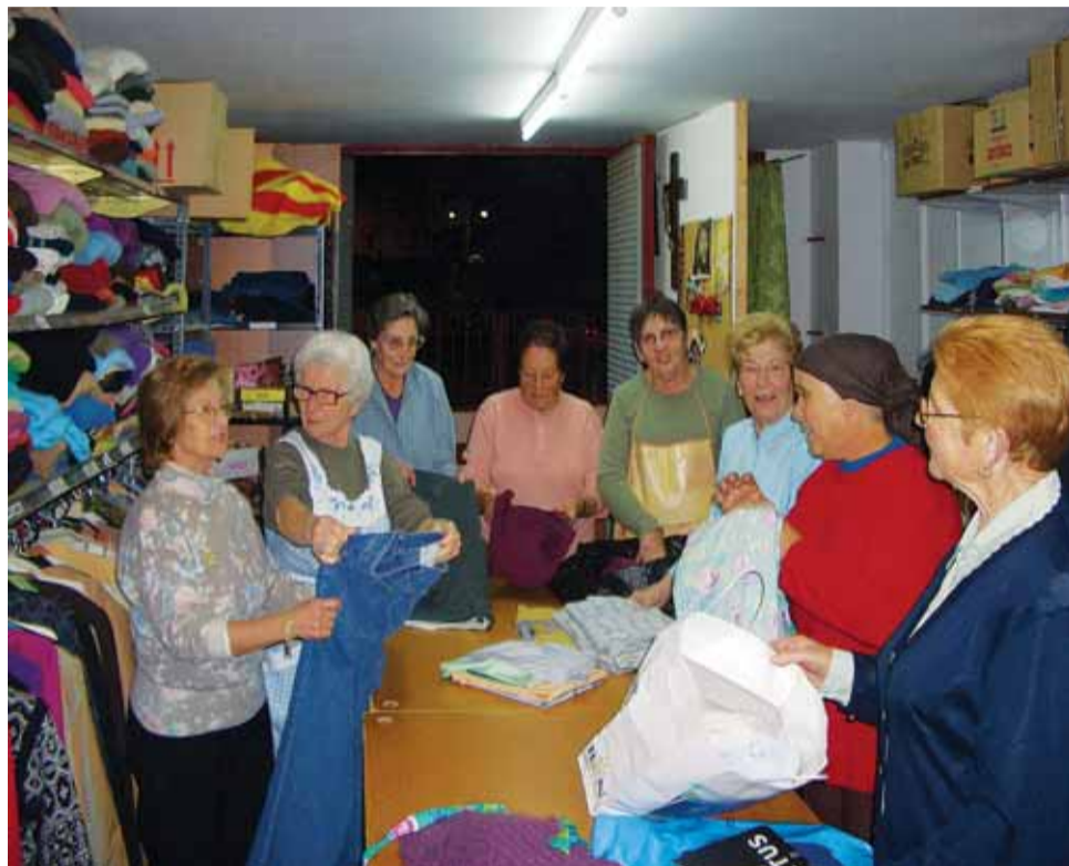
Càritas Parroquial del Masnou també fa recollida i lliurament de roba.

La xarxa Càritas, destinada a l'ajut i l'atenció de la gent més necessitada, forma part de l'organització de l'Església catòlica i és present en més de 154 països del món. Un dels seus lemes és que existeix Càritas on existeix una comunitat cristiana.