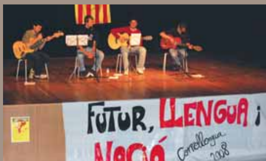
Moment de l'actuació musical del grup masnoví Caliu.

La pluja no atura la celebració reivindicativa del Correllengua