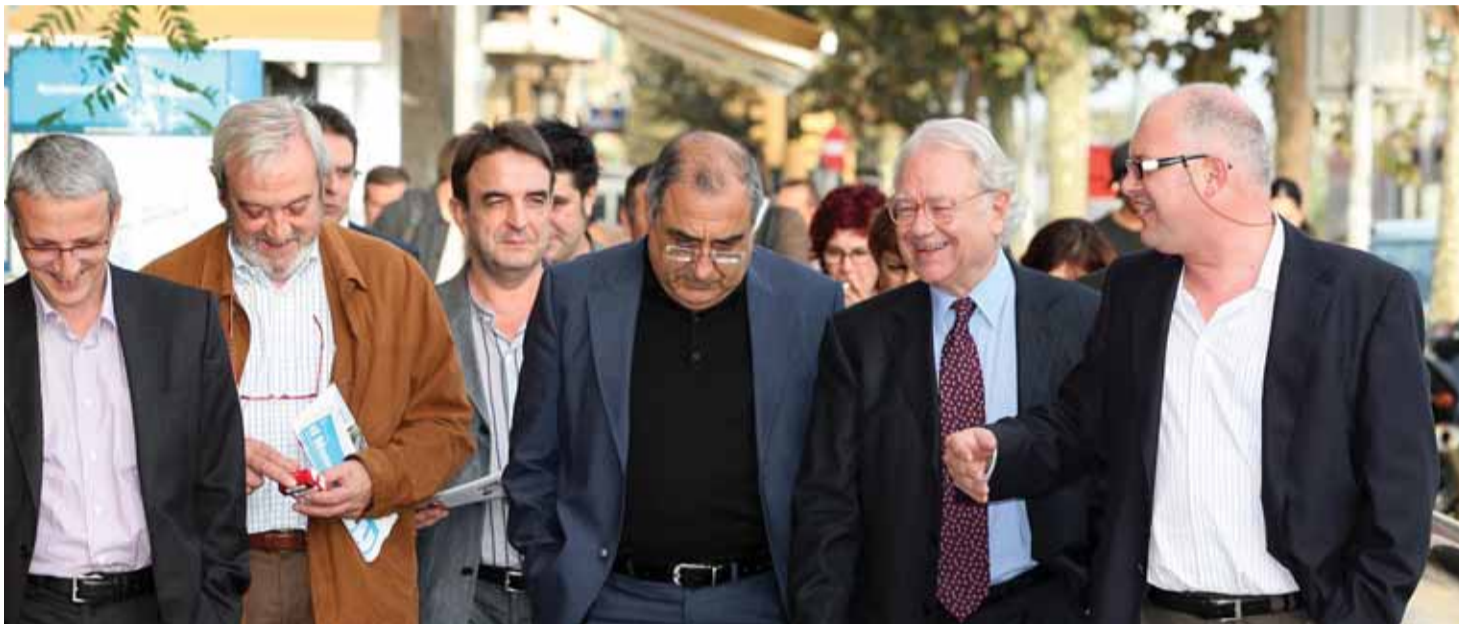
Nadal va ser acompanyat per les autoritats municipals durant la seva visita.

Nou termini de finalització de les obres del Mercat Vell