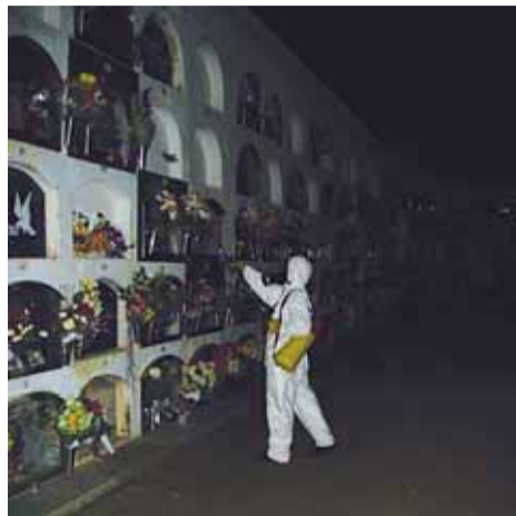
Un dels operaris al cementiri.

L'Ajuntament del Masnou, des de la Regidoria de Salut Pública, continua la lluita contra el mosquit tigre. L'últim capítol