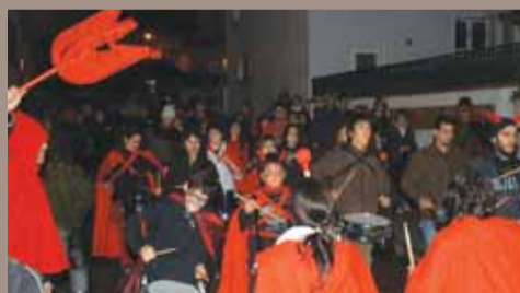
La Colla de Diables del Masnou durant la cercavila.

Un any més, la Colla de Diables del Masnou va organitzar, per la vigília de Tots Sants, el Castanyot, "Festa de la Nit Fosca", una castanyada popular. La concentració va començar a la plaça d'Ocata, des d'on va sortir la cercavila que va recórrer els carrers del municipi. Després, va ser el torn de la castanyada popular. A més a més, els dies 29, 30 i 31 d'octubre, al carrer de Pere Grau hi havia una parada de castanyes i moniatos, muntada per l'Associació Lúdica d'Amics Pere Grau, i el dia 31 d'octubre, se'n va muntar una altra al carrer de Sant Rafael a càrrec de l'Associació de Veïns del Carrer de Sant Rafael. ■