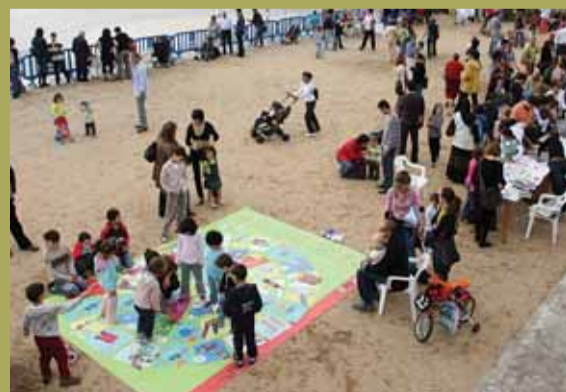
La jornada va incloure jocs i tallers.

El 19 d'octubre passat, el Masnou va celebrar amb una festa els tres anys des de la implementació de la recollida selectiva de la brossa orgànica. Durant el matí, a la pista esportiva de Pau Casals, hi va haver un punt informatiu sobre la recollida de l'orgànica, es van fer tallers i el joc de prevenció de residus. També hi va haver un espectacle a càrrec de les patinadores del Club Patinatge el Masnou. A més a més, es va oferir una xocolatada a totes les persones assistents.