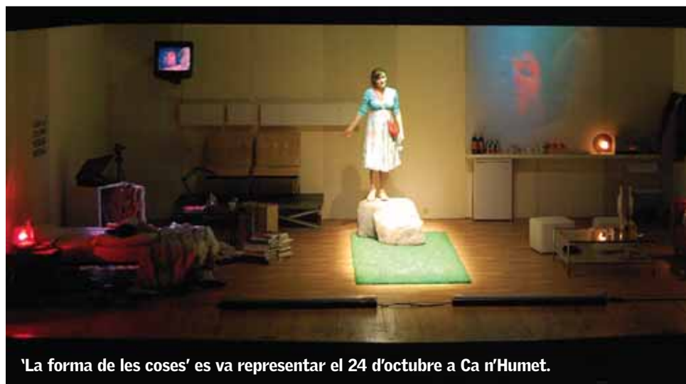
'La forma de les coses' es va representar el 24 d'octubre a Ca n'Humet.

La Cia. la Tal i Leandre expliquen la vida dels pallasos quan deixen de ser-ho