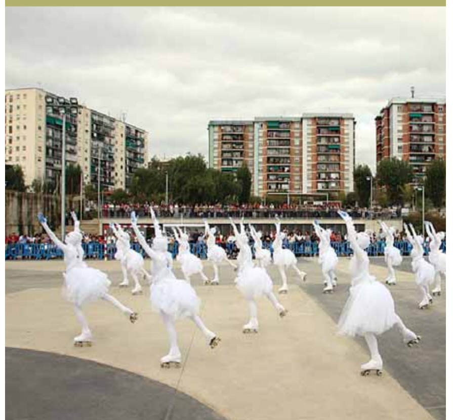
Actuació de les patinadores a la pista de Pau Casals.

Entre el 8 i el 22 de novembre, se celebra el Mundial de Patinatge a Taipei, capital de Taiwan. L'Ajuntament del Masnou desitja molta sort a l'equip de xou del Club de Patinatge El Masnou, que hi participarà, i aprofita per felicitar tot el treball d'aquesta entitat (patinadors i patinadores, equip tècnic i directiu, i pares i mares), perquè,