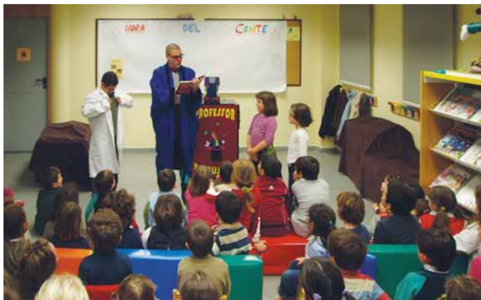
Les activitats infantils sempre tenen molt bona acollida.

La Biblioteca Pública Joan Coromines, inaugurada l'any 1998, celebra el desè aniversari de la seva ubicació a l'Edifici Centre. L'equipament municipal, que ocupa un espai de 695 metres quadrats, va ser remodelada i millorada l'any 2006 i,