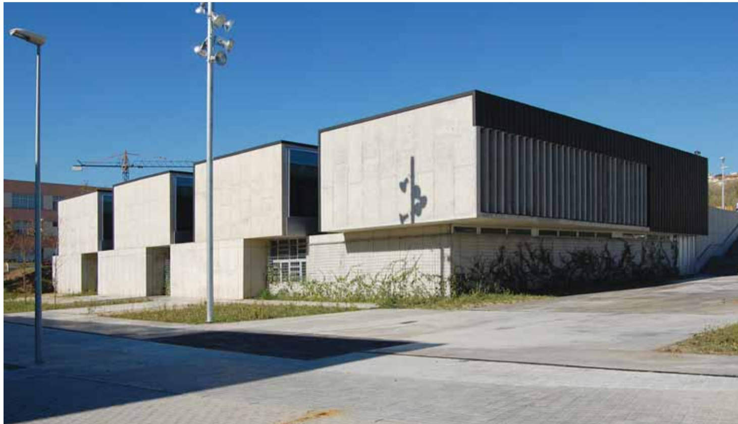
Les instal·lacions del nou centre, entre el carrer de Mèxic, el Camí del Mig i el Torrent Can Gaio, a punt.

L'equipament acollirà el PASSIR i el CAP de Salut Mental, i oferirà els serveis d'ecografia, retinografia digital per a persones diabètiques i odontologia