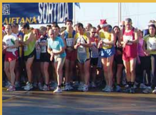
Participants d'una edició anterior.

(nascuts i nascudes a partir de l'any 1994) començarà a les 11 h, i la de persones adultes, mitja hora més tard. ■