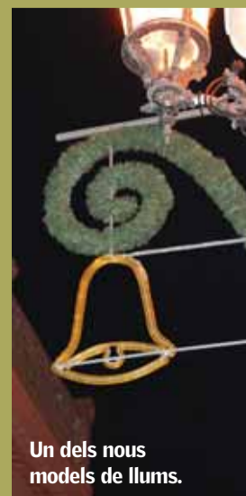
Un dels nous models de llums.

Aquest any, el Masnou té gairebé 300 garlandes noves per il·luminar i ambientar les nits nadalenes en 26 carrers, avingudes i places del municipi. El lloguer d'aquests llums de Nadal, que s'estan instal·lant des del mes d'octubre passat i fins a mitjan de novembre, és de 20.000 euros. Per fer front a aquesta despesa i les relacionades en concepte d'instal·lació i manteniment de les garlandes del port esportiu i del passeig Marítim, l'Ajuntament compta amb el suport de l'empresa Promocions Portuàries. El nou sistema d'enllumenat substitueix les bombetes tradicionals per díodes electroluminescents (LED), que suposaran un estalvi de més de 10.000 euros (en concepte de bombetes i de consum d'electricitat) i de 171 kilowats. És previst que les noves garlandes s'encenguin entre el 15 de desembre i el 7 de gener. ■