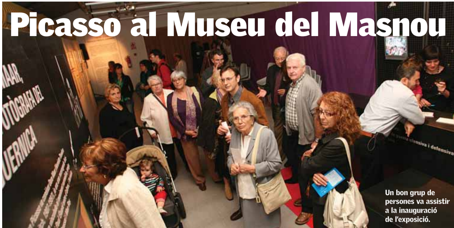
Un bon grup de persones va assistir a la inauguració de l'exposició.