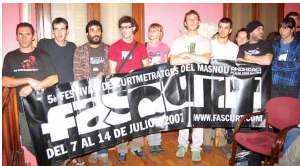
Un grup nodrit de joves es va manifestar a favor de les propostes culturals.

L'Ajuntament, reunit el 16 d'octubre passat, va aprovar les taxes i ordenances per a l'any 2009. Segons va explicar el regidor de Finances, Artur Gual , la característica principal és que l'augment lineal dels impostos s'establirà sobre el 3,3%, una xifra que s'ha volgut establir per sota de l'IPC, tenint en compte la situació de crisi que es viu actualment i la que es preveu per al 2009.