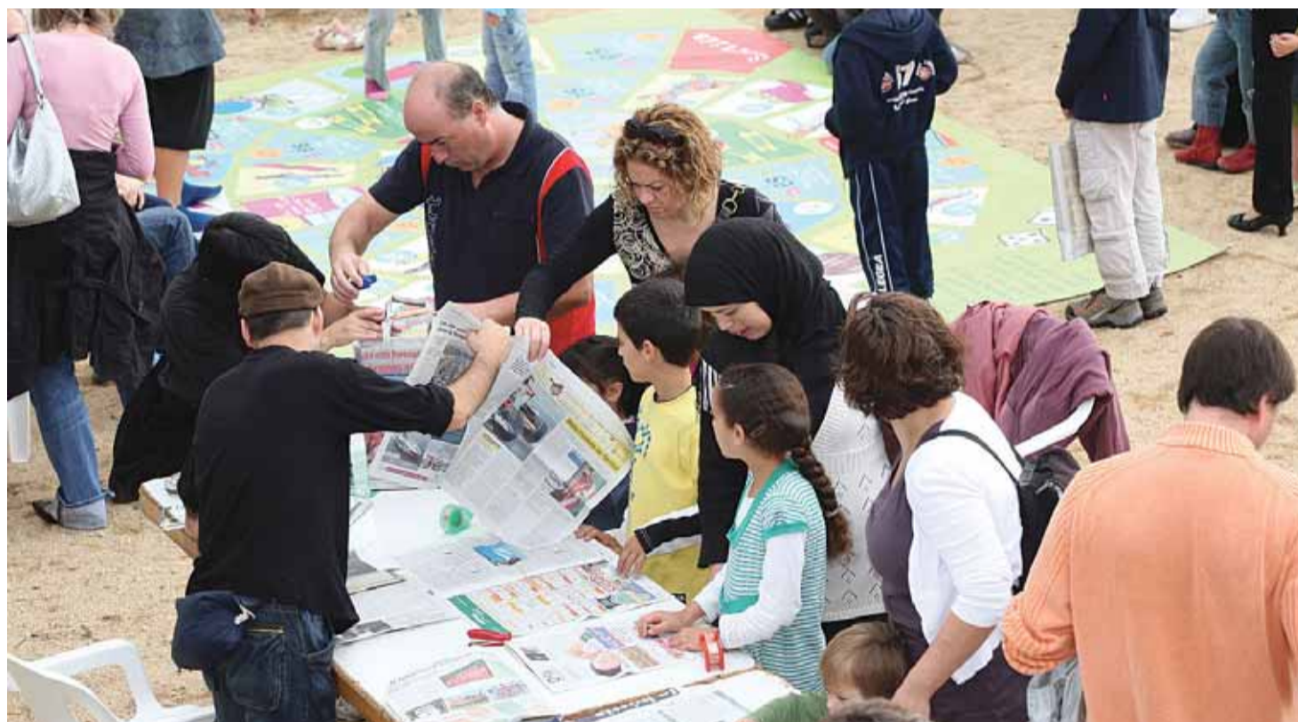
Un dels tallers de reciclatge a la festa del 19 d'octubre.

Per al 2009, s'han preparat diverses festes, amb "L'inflable, per reciclar saltant!", tallers destinats als infants i un punt informatiu sobre la recollida orgànica: l'1 de febrer (a la plaça de Marcel·lina de Montveys), el 19 d'abril (al parc del Llac), el 7 de juny (als jardins de Països Catalans), el 28 de juny (a la platja) i el 19 de juliol (a la plaça de la República).