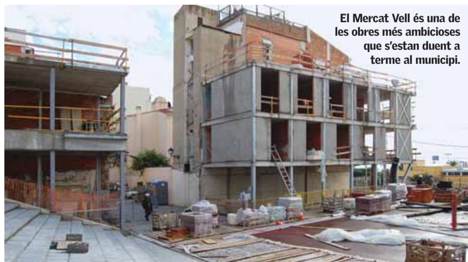
El Mercat Vell és una de les obres més ambicioses que s'estan duent a terme al municipi.

El Govern central fa una aportació a fons perdut als municipis per combatre la crisi