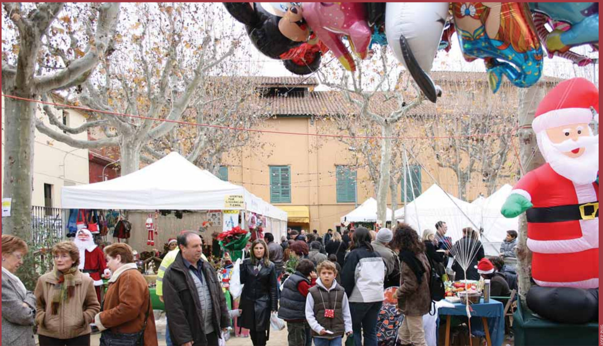
La Fira de Santa Llúcia es va celebrar entre el 6 i el 8 de desembre al pati del Casino.

A continuació, us oferim els actes programats per a aquests dies, amb propostes per a tothom. També hi trobareu un repàs dels actes que ja s'han dut a terme al municipi per celebrar el Nadal.