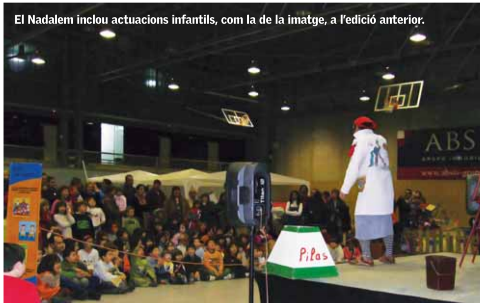
El Nadalem inclou actuacions infantils, com la de la imatge, a l'edició anterior.

el Nadalem es comunicarà amb l'envelat, on els carters reials recolliran les cartes de tots els infants del Masnou. A les tardes, un trenet unirà el Complex Esportiu Municipal amb la zona esportiva de Pau Casals, on s'instal·laran els envelats.