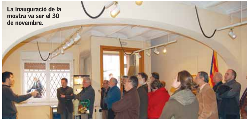
La inauguració de la mostra va ser el 30 de novembre.

Una exposició, una xerrada i una moció al Ple reivindiquen la figura de Vicenç Albert Ballester