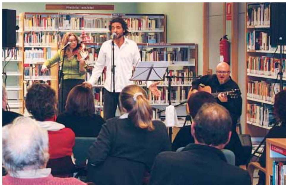
La Biblioteca va celebrar el desè aniversari amb una vetllada musical.

La nit del dissabte 20 de desembre, la parròquia de Sant Pere viurà, a partir de les 22 h, el prelude del Nadal amb el tradicional Concert de Nadal, a càrrec de la Coral Xabec de Gent del Masnou, que oferirà un repertori de nades populars catalanes.