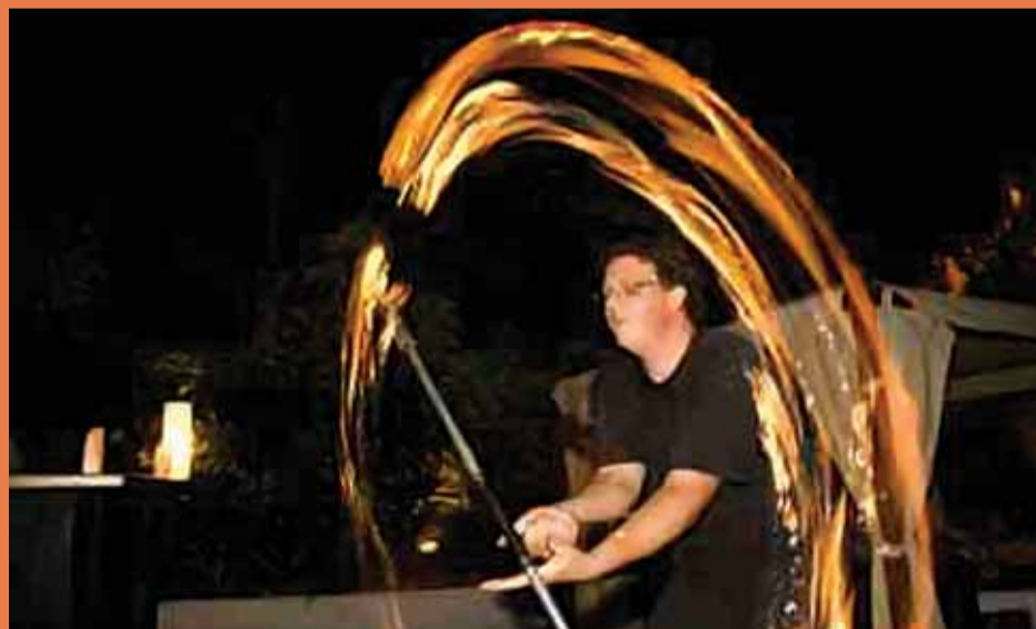
El taller de malabars és una de les grans apostes del Nadalem Jove.

Un gran envelat de circ és una de les novetats més destacades d'enguany