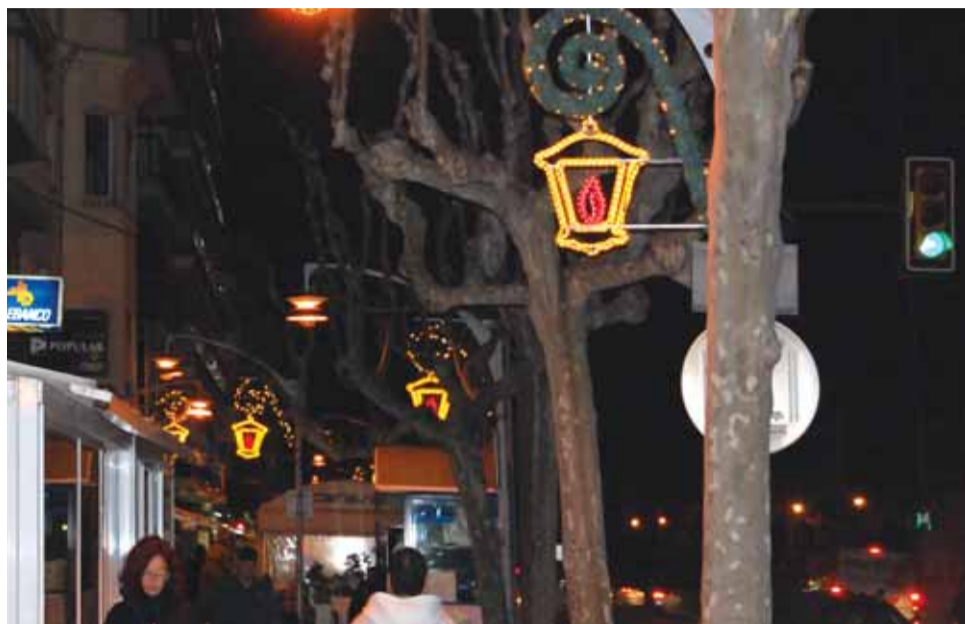
Els llums de Nadal es van encendre el 5 de desembre.