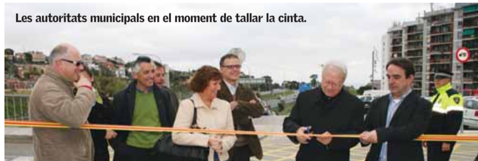
Les autoritats municipals en el moment de tallar la cinta.

La inauguració va comptar amb l'actuació d'un grup d'animació. ■