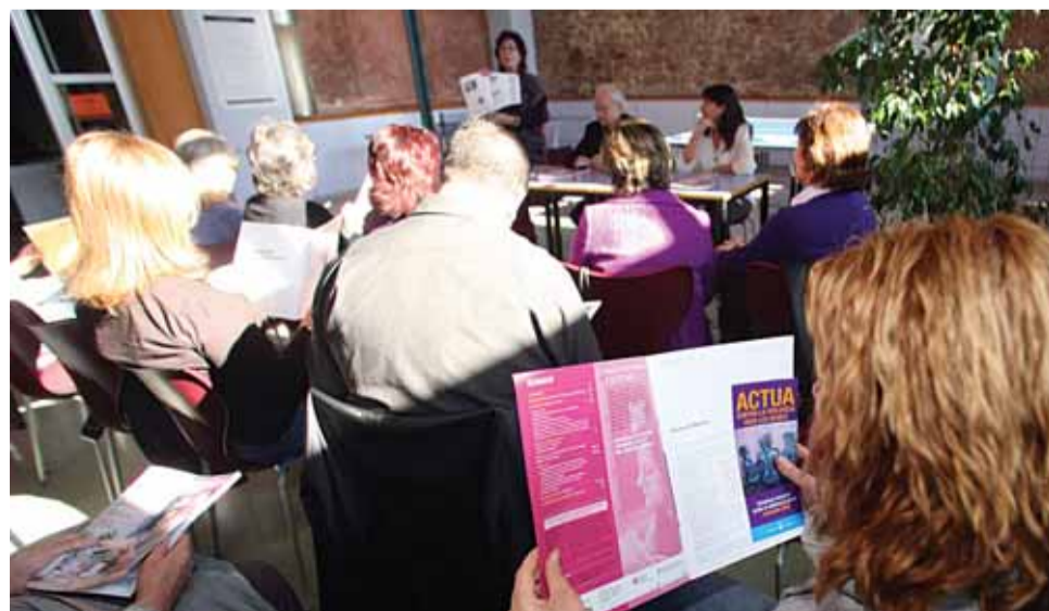
La publicació 'Mar de dones' es va presentar públicament el diumenge 16 de novembre.