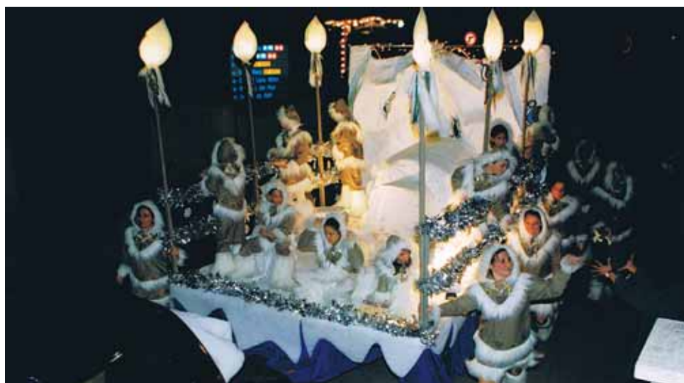
La Colla de l'Hort prepara amb especial dedicació les carrosses per a la cavalcada de Reis.