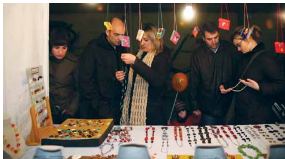
La Fira d'Artesania ha esdevingut una cita esperada i celebrada per la ciutadania.