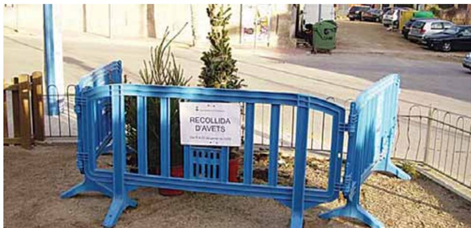
Un dels espais de recollida d'arbres de la campanya anterior.

Entre el 7 i el 22 de gener, s'instal·laran punts de recollida dels arbres