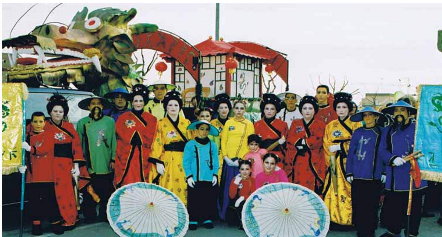
Les disfresses per Carnaval són un dels punts forts de l'entitat.

Animació sociocultural amb denominació d'origen del Masnou