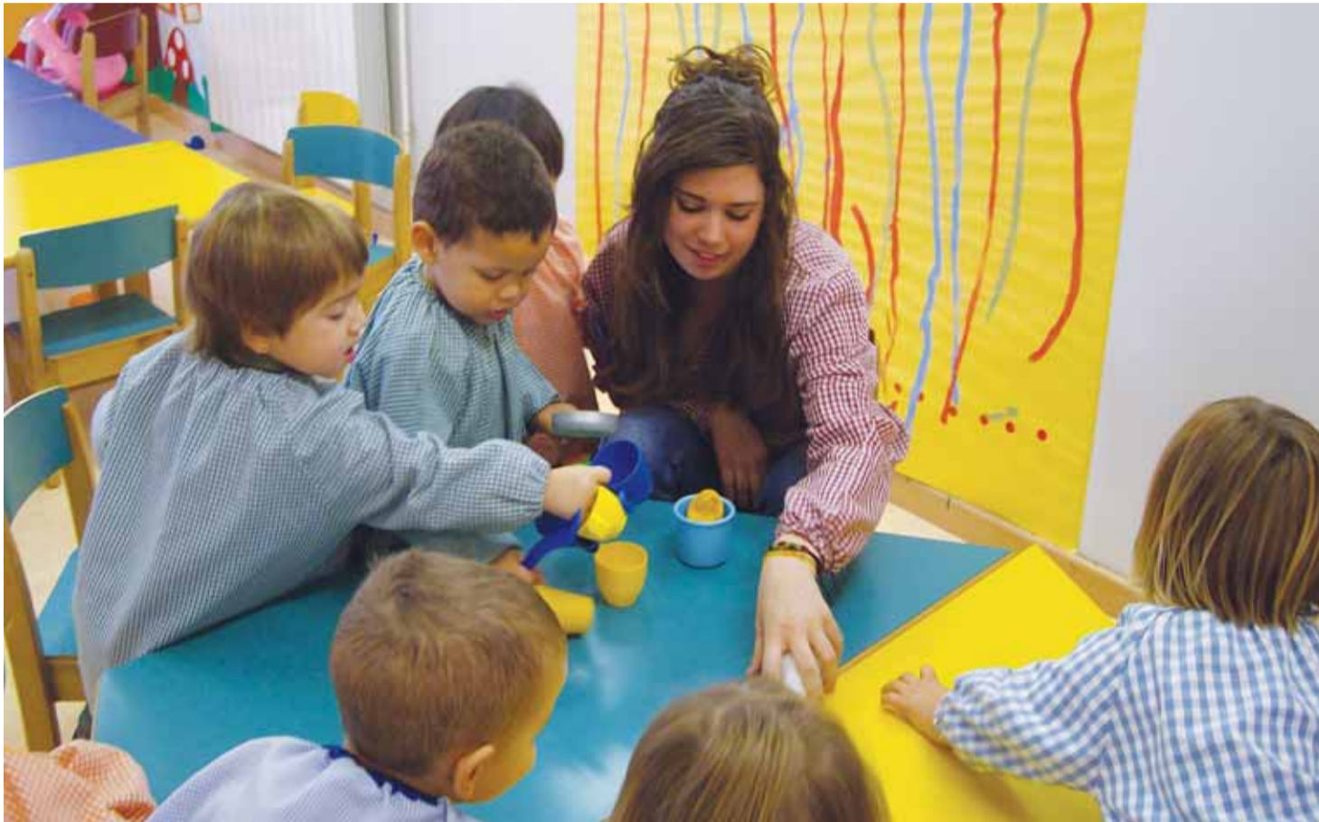
L'escola bressol municipal és un dels llocs on els i les estudiants poden fer les seves pràctiques.

La iniciativa persegueix la integració al sistema educatiu de l'alumnat de secundària en situació d'exclusió i risc social