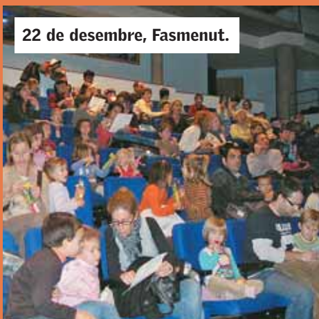
22 de desembre, Fasmenut.