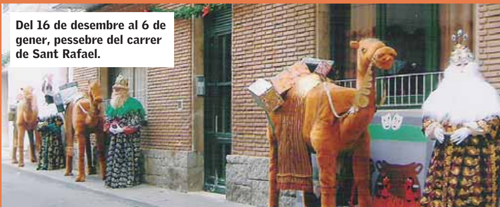
Del 16 de desembre al 6 de gener, pessebre del carrer de Sant Rafael.