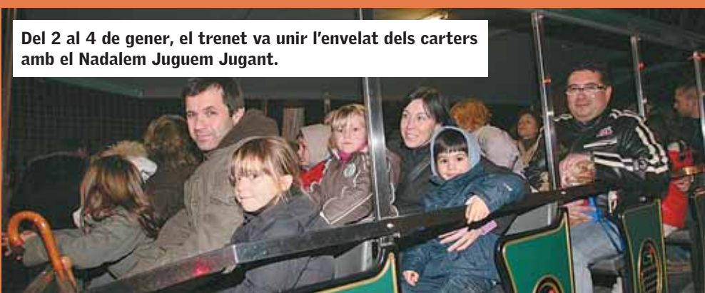
Del 2 al 4 de gener, el trenet va unir l'envelat dels carters amb el Nadalem Juguem Jugant.