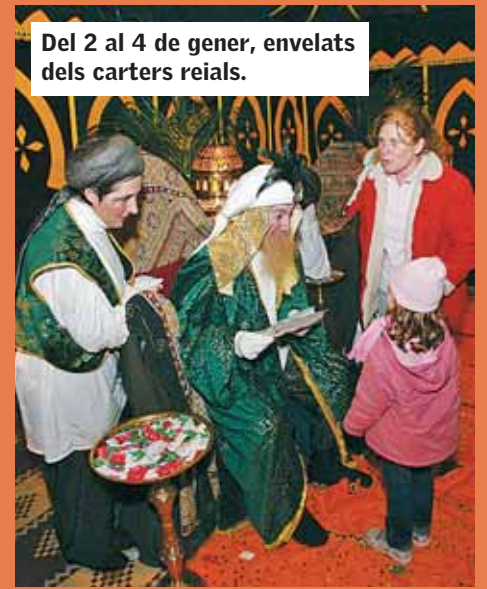
Del 2 al 4 de gener, envelats dels carters reials.