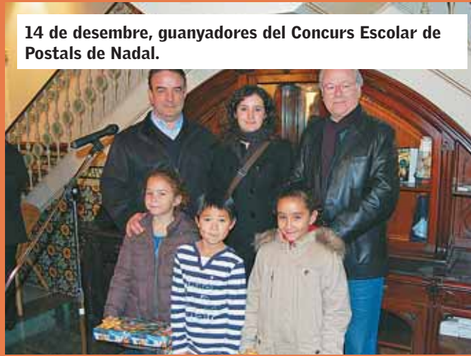
14 de desembre, guanyadores del Concurs Escolar de Postals de Nadal.