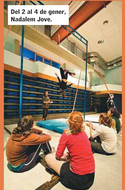
Del 2 al 4 de gener, Nadalem Jove.