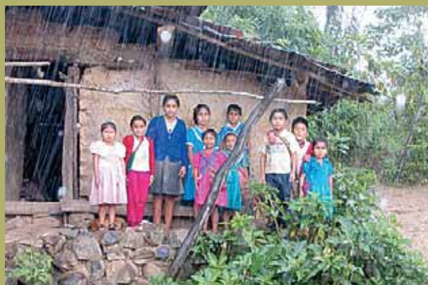
El Perú és un dels altres llocs on actua l'ONGD Educació sense Fronteres amb programes de cooperació.

Higienització del convent de Nuestra Señora de Belén i rodalies de l'Havana Vella (Cuba), 4a fase. Subvenció: 6.000 euros. Barri popular de l'Havana on la gent no té accés a recursos higiènics en quantitat suficient, atès el règim de bloqueig que pateix l'illa caribenya. La població més afectada és la població de major edat, aproximadament unes 15.000 persones.