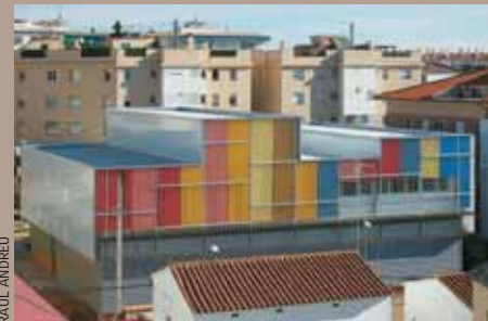
Davant de l'edifici dels Vienesos (a la imatge) s'urbanitzarà de nou l'espai lliure existent.