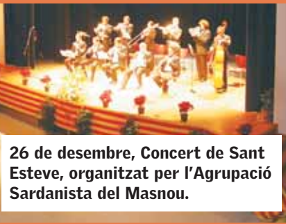
26 de desembre, Concert de Sant Esteve, organitzat per l'Agrupació Sardanista del Masnou.