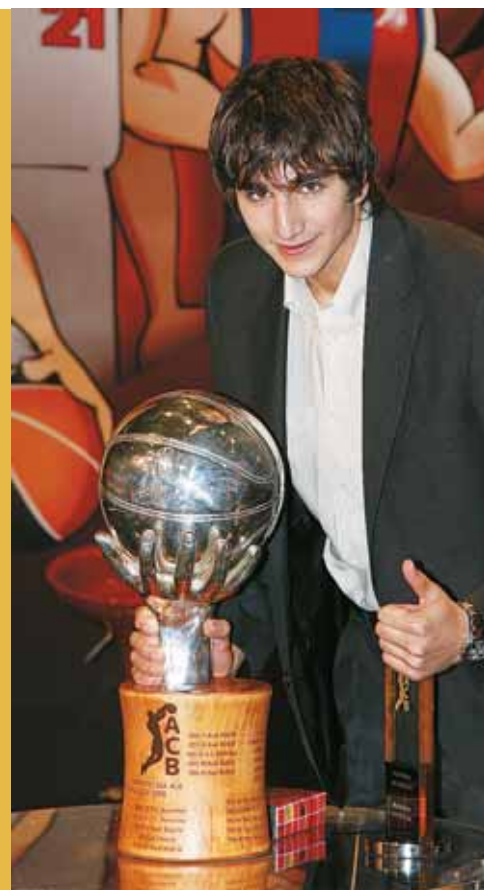
El basquetbolista masnoví, quan va ser escollit com a jugador del quintet ideal de l'ACB al maig del 2008.

Cada any, la Federació Internacional de Bàsquet (FIBA) concedeix uns premis als millors jugadors i jugadores joves de l'any. El basquetbolista masnoví Ricky Rubio ja va guanyar aquest guardó l'any passat, però enguany es presenta com a preferit per revalidar aquest títol. ■