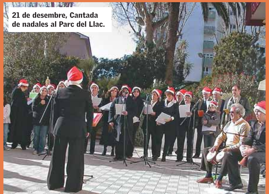
21 de desembre, Cantada de nadesals al Parc del Llac.