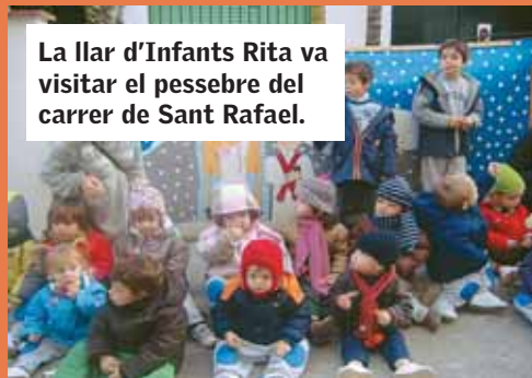
La llar d'Infants Rita va visitar el pessebre del carrer de Sant Rafael.