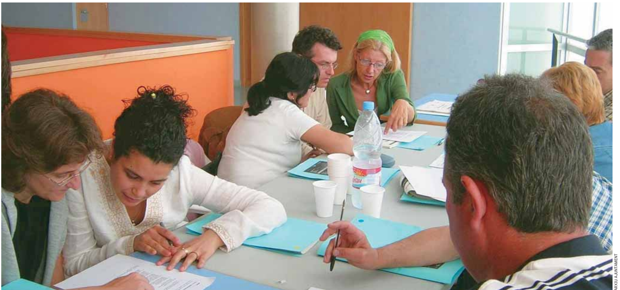
Algunes de les persones assistents al primer Fòrum d'Educació Local, al mes de maig de 2006.

El dissabte 31 de gener, a les 11 h, a Ca n'Humet, se celebra la primera Jornada d'Educació al Masnou, dedicada al Projecte educatiu del Masnou (PEM)