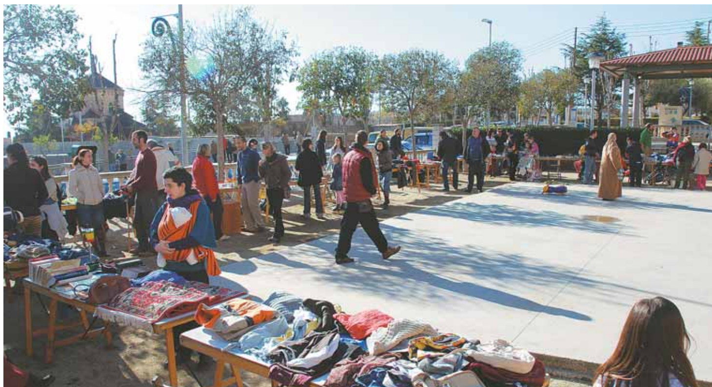
Per la setena edició del Mercat d'Intercanvi, que va tenir lloc el diumenge 11 de gener, hi van passar més d'un centenar de persones.

Ara fa aproximadament vuit anys, un col·lectiu de persones preocupades per la dimensió de diversos problemes socials i dedicades a l'activisme pacífic de denúncia va fundar l'Assemblea Atzavara al Masnou. L'entitat pretén ser una eina de discussió participativa promotora de diverses activitats adreçades a informar, conscienciar, actuar i transformar, en l'àmbit local, el que consideren "incongruències" globals.