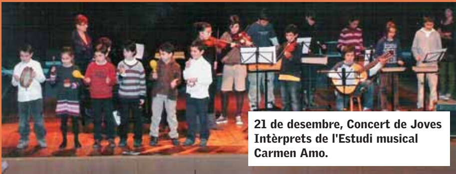
21 de desembre, Concert de Joves Intèrprets de l'Estudi musical Carmen Amo.