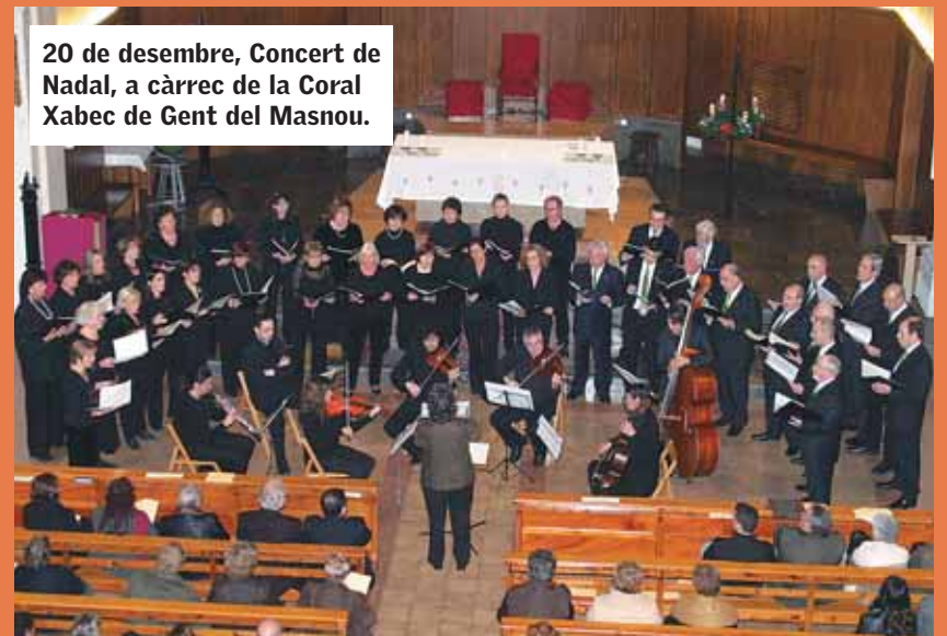
20 de desembre, Concert de Nadal, a càrrec de la Coral Xabec de Gent del Masnou.