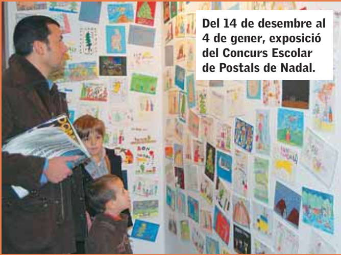
Del 14 de desembre al 4 de gener, exposició del Concurs Escolar de Postals de Nadal.