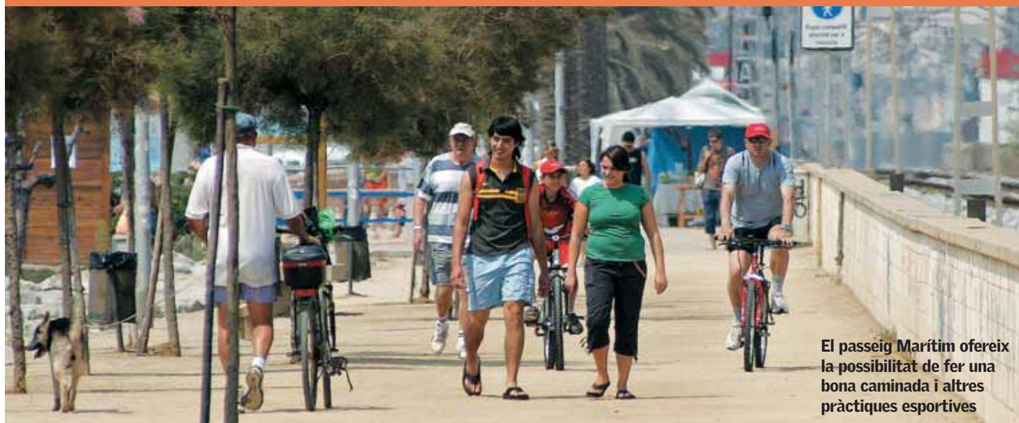
El passeig Marítim ofereix la possibilitat de fer una bona caminada i altres pràctiques esportives