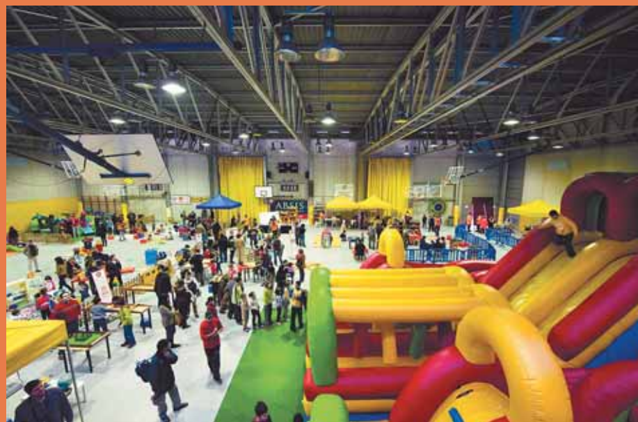
Del 2 al 4 de gener, el Complex Esportiu va acollir el Nadalem Infantil Juguem Jugant.