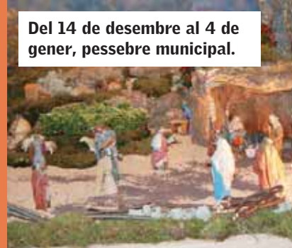
Del 14 de desembre al 4 de gener, pessebre municipal.