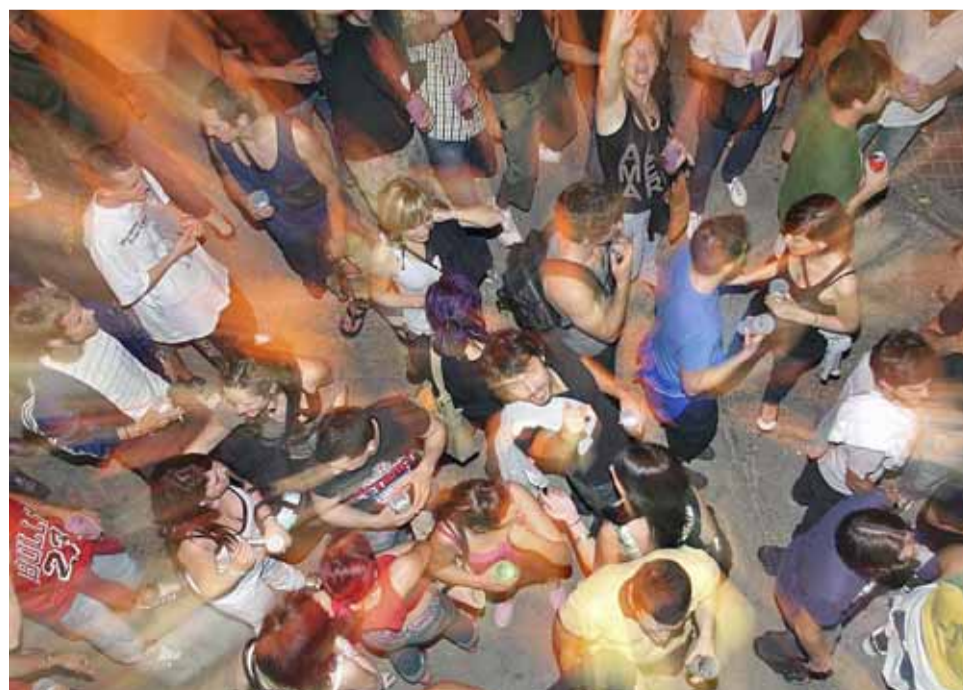
Imatge d'arxíu d'una celebració per a la gent jove a la Festa Major.

En primer lloc, s'han repartit 196 qüestionaris entre els 5 centres d'educació secundària del Masnou. A més, s'han tingut en compte les ofertes fetes des de l'Institut d'Estadística de Catalunya, les publicades per l'Observatori Català de la Joventut i l'informe realitzat pel Consell Comarcal sobre les realitats juvenils del Maresme. A partir de tota aquesta infor-