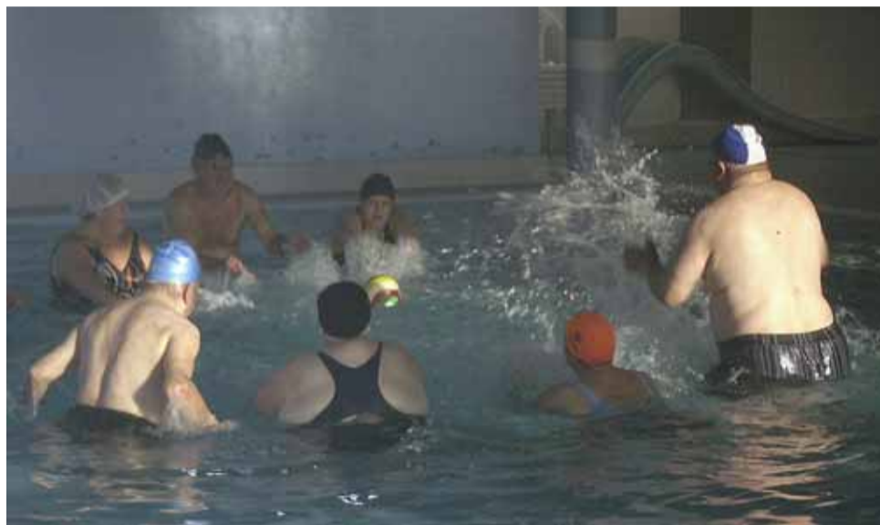
El programa està coordinat per les Regidories d'Esports i Salut Pública.