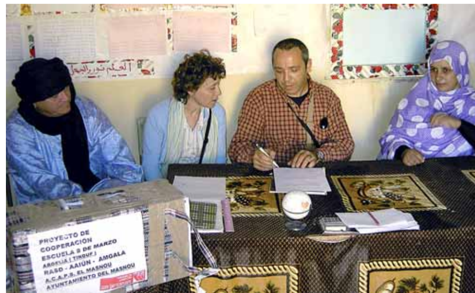
Signatura del protocol de cooperació amb una escola de primària sahrauí.