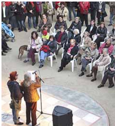
Imatge d'arxiu d'una de les activitats organitzades el 2008