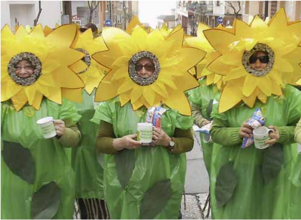
La rua és un dels actes centrals del programa de Carnaval.

Entitats i consistori organitzen un nodrit programa d'activitats per celebrar el Carnaval al municipi