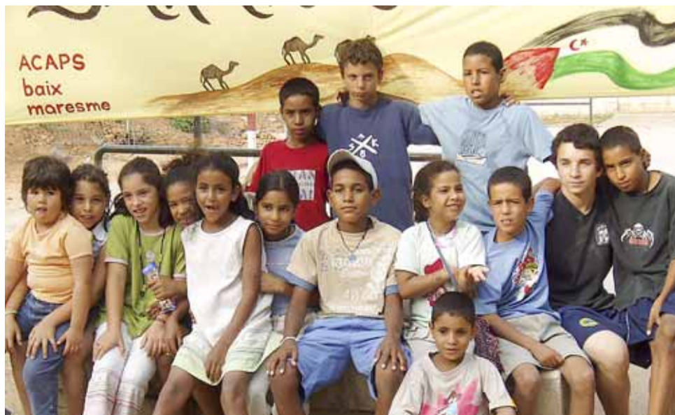
Infants sahrauís durant les colònies d'estiu al Maresme.