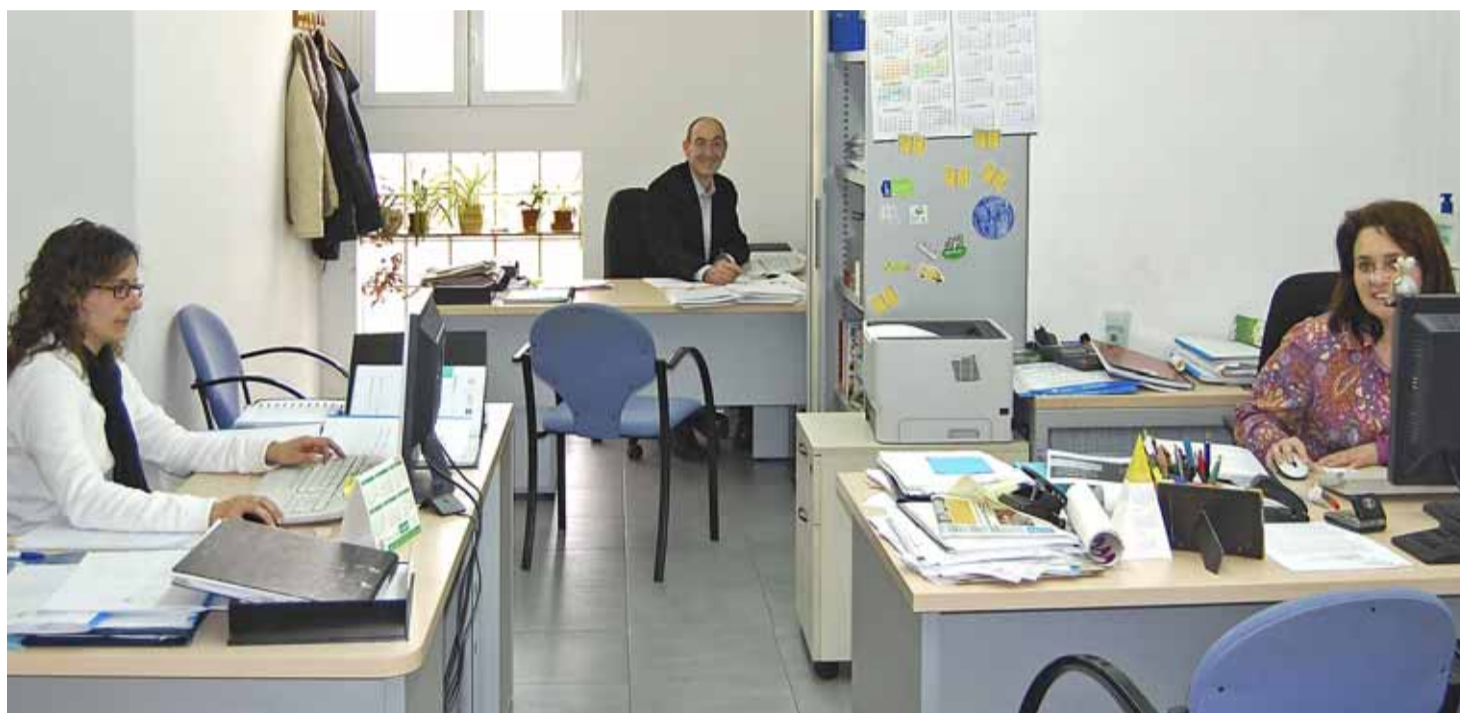
L'Oficina Municipal d'Informació de Consum del Masnou es troba a l'Edifici Centre.

L'organisme atén més de 450 consultes durant el 2008