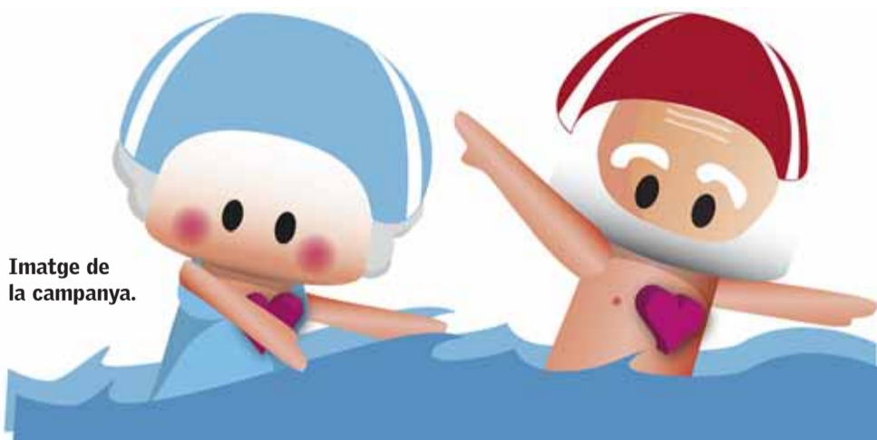
Imatge de la campanya.