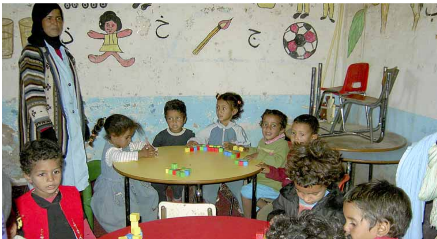
Llar d'infants del campament de refugiats.

Era l'any 1998 quan les famílies masnovines que acollien els infants sahrauís durant les colònies d'estiu van decidir formar l'ACAPS El Masnou, una secció de l'Associació Catalana d'Amics del Poble Sahrauí (ACAPS), després que l'entitat que havia gestionat el projecte anteriorment deixés de fer-ho. L'ACAPS és una organització no governamental nascuda a Catalunya amb l'objectiu de col·laborar activament en la consecució de la independència del poble sahrauí i en el seu posterior desenvolupament com a país.