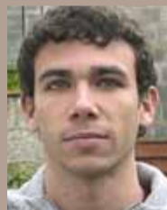
mi, a provar-ho. Vam saber que a Alella hi havia un club d'atletisme i, de mica en mica, m'hi vaig anar aficionant.