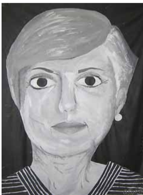
Una de les obres que es podran veure a la mostra

Des del mes de juny de 2008, es du a terme al Masnou el projecte Relacions en joc. Aquesta iniciativa, promoguda per la Regidoria de Cultura, el Patronat Municipal i la Regidoria de la Dona, amb el suport de la Diputació de Barcelona i l'Institut Català de les Dones de la Generalitat, ha estat coordinada per l'escola Blancdeguix. El seu objectiu principal és analitzar i mostrar el paper de la dona en l'entramat social per arribar a confirmar una hipòtesi de sortida: que és la figura femenina qui sustenta les relacions familiars i socials.