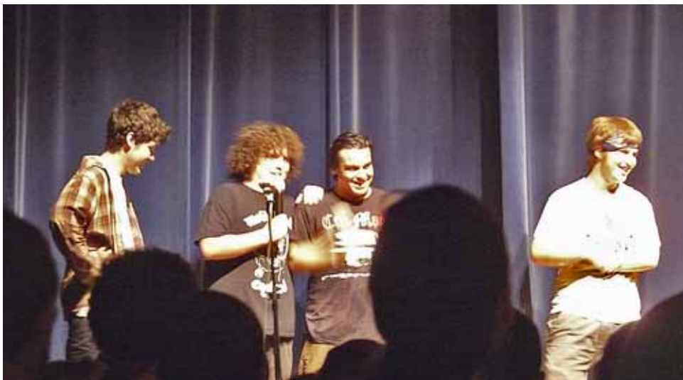
Els membres del grup que ha obtingut la beca musical.