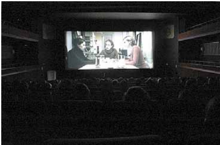
La Calàndria va ser un dels escenaris per a les projeccions.

‘Cómo conocí a tu padre’, d'Àlex Montoya, premi al millor curtmetratge de ficció