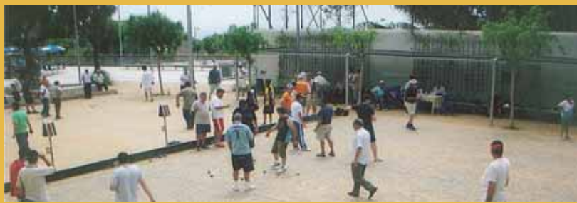
CLUB DE PETANCA RAMÓN Y CAJAL

quals es trobava el Club de Petanca Ramón y Cajal del Masnou. Durant el torneig es van fer vuit grups i el club masnoví va aconseguir ser sotscampió en dos. ■