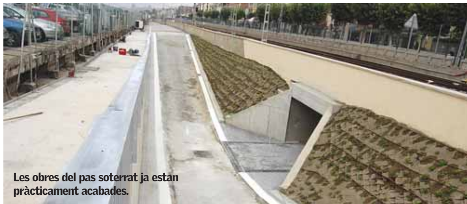
Les obres del pas soterrat ja estan pràcticament acabades.