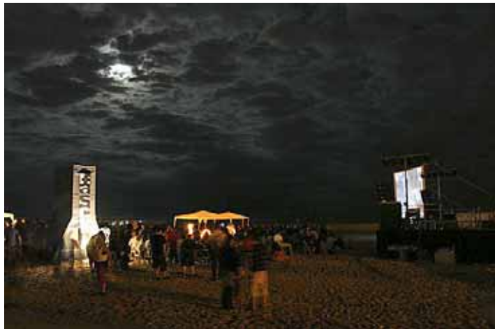
La combinació del cinema i la platja és un dels atractius del certamen.

El Festival de Curtmetratges Fascurt ha tornat a donar mostres de la seva maduresa com a festival i de la seva plena consolidació. Entre el 9 i l'11 de juliol, a la platja d'Ocata i al cinema La Calàndria, aquesta iniciativa va oferir un programa format per 56 curts a les seccions oficials de Ficció, Animació, Xperiment Visual i Undercurt. A més a més, s'ha completat l'oferta amb seccions no oficials dedicades a temes específics (Del Curt al Llarg, Telescopi, Un Dia