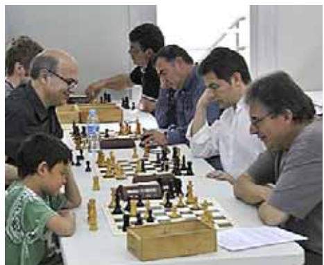
CLUB D'ESCACS EL MASNOU