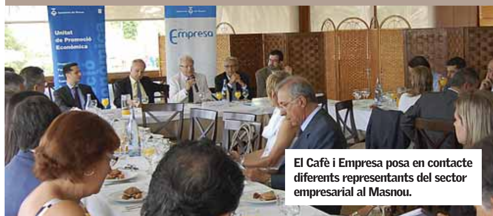
El Cafè i Empresa posa en contacte diferents representants del sector empresarial al Masnou.

actual, el dimarts 7 de juliol, durant la darrera sessió del cicle Cafè i Empresa, organitzat per la Unitat de Promoció Econòmica de l'Ajuntament. ■