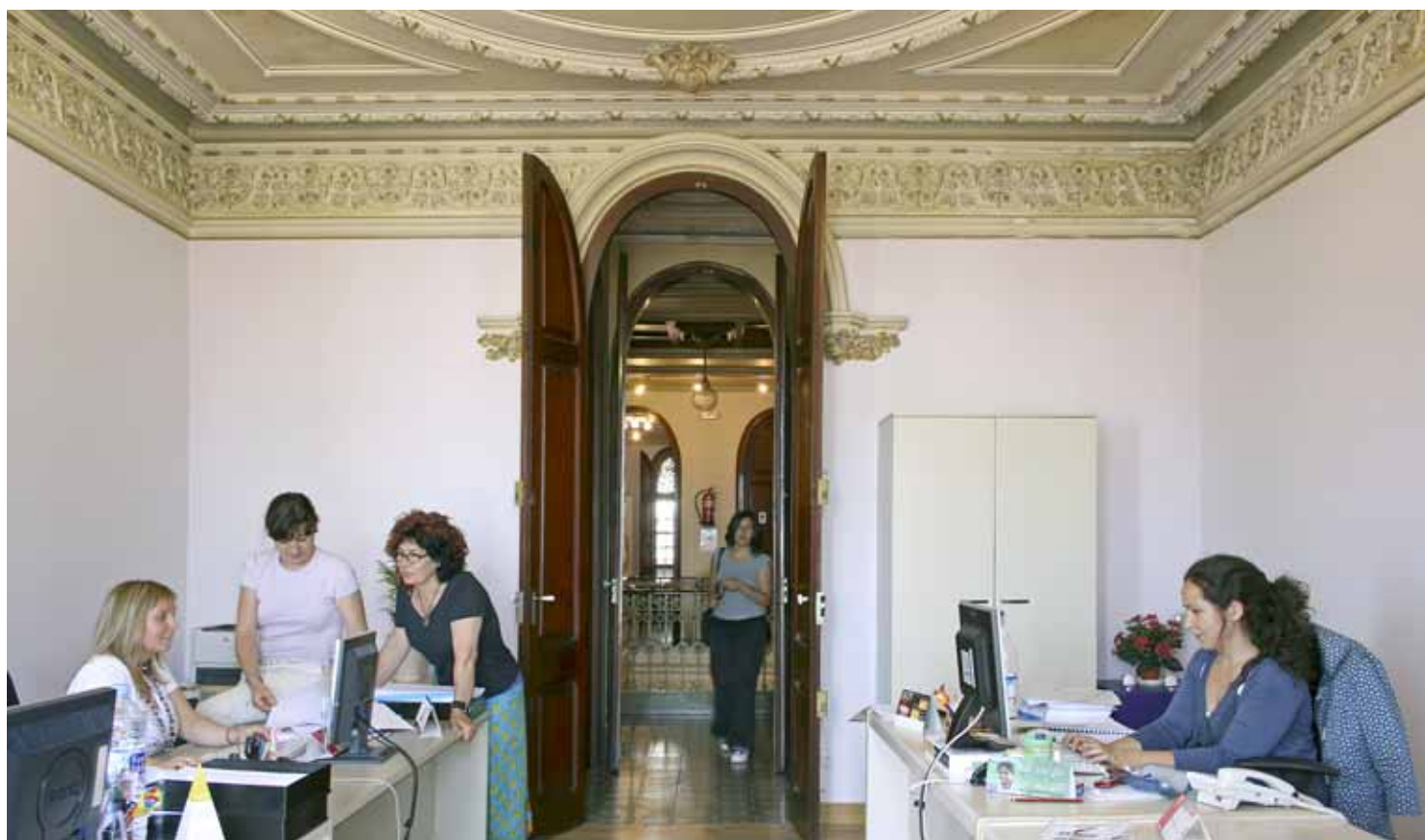
El servei es va inaugurar al mes de març, coincidint amb la celebració del Dia Internacional de la Dona.

per raó de sexe, i potenciar la implicació i la participació activa de les dones en diferents àmbits de la nostra societat. El CIRD ja és un servei de referència per a les dones. Així ho demostren les 87 visites rebudes (entre acollida i seguiment). Com a resultat d'aquestes visites, s'han obert 60 expedients, 21 dels quals s'han pogut tancar en data d'avui després d'haver donat resposta a la demanda plantejada.