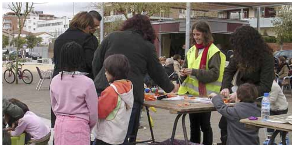
Un dels tallers per a infants realitzats al novembre de l'any passat.

Aquests actes compten amb la col·laboració del CAP del Masnou, Criança Dolça, El Cullerot i les entitats Agrupació Sardanista del Masnou, Associació UNESCO del Masnou, la Jove Orquestra de Cambra del Masnou i Lleureka. ■