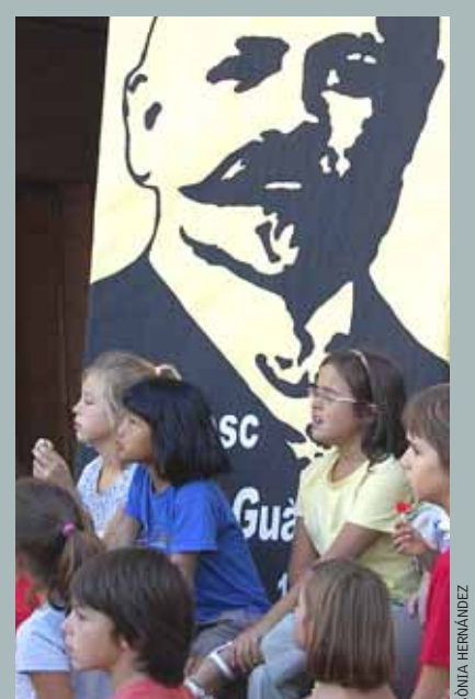
Els escolars van recordar Ferrer i Guàrdia.