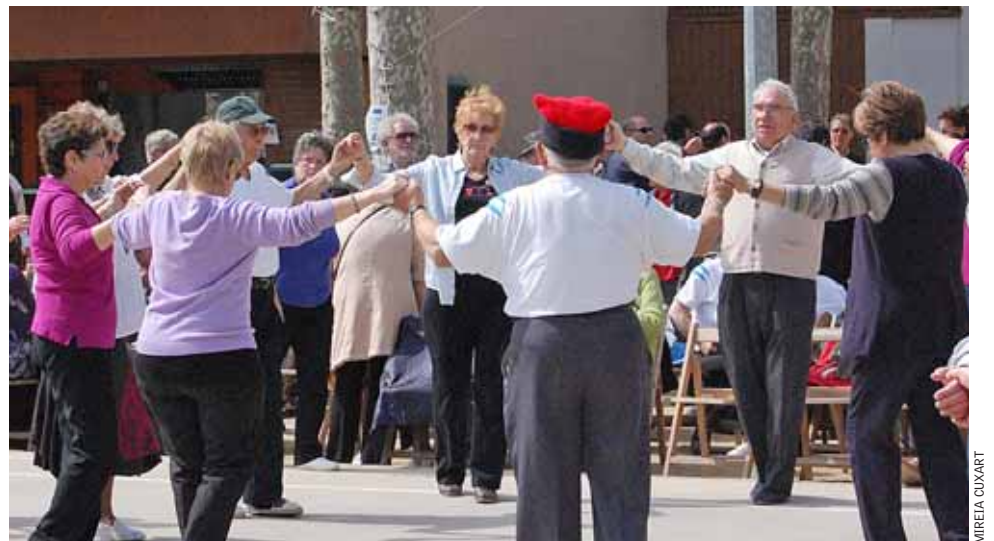
Sardanistes ballant durant l'Aplec.

AQUESTA FIRA D'ART VOL PROMOURE LA TASCA DUTA A TERME PER ARTISTES DEL MUNICIPI