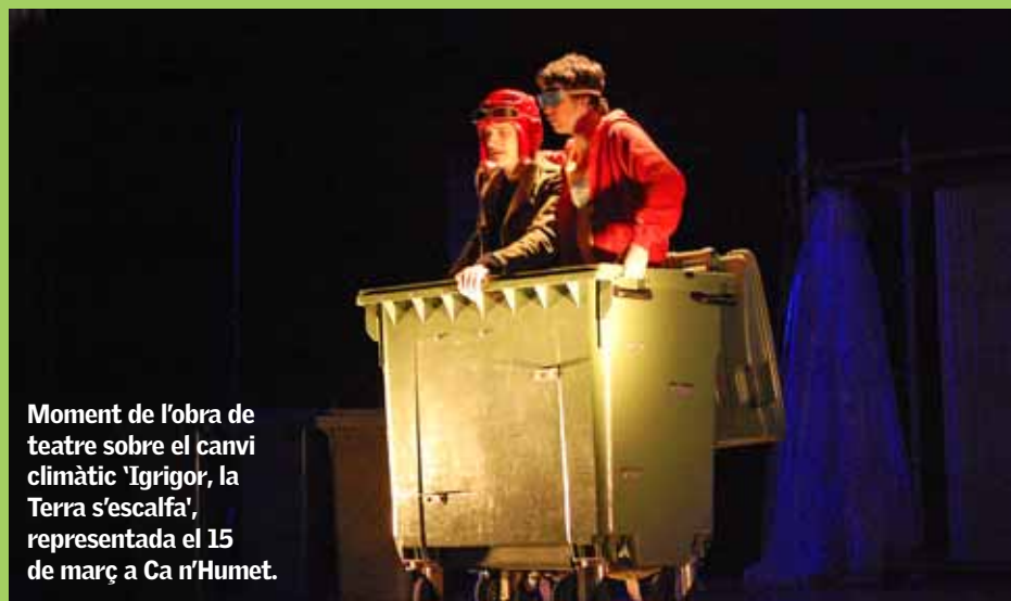
Moment de l'obra de teatre sobre el canvi climàtic 'Igrigor, la Terra s'escalfa', representada el 15 de març a Ca n'Humet.

L'Ajuntament s'ha adherit al Pacte d'alcaldes i alcaldesses per promoure l'energia sostenible