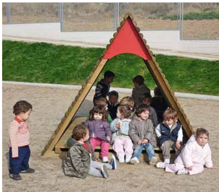
Grup d'infants a l'escola bressol La Barqueta.

S'ha fet pública l'oferta de places per al curs 2010-2011 de les escoles bressol municipals. La Sol Solet té 8 places per a infants de 4 mesos a 1 any, 5 places per a infants d'1 a 2 anys i 7 places per a infants de 2 a 3 anys. La Barqueta comptarà amb 8 places per a infants de 4 mesos a 1 any, 6 places per a infants d'1 a 2 anys i 14 places per a infants de 2 a 3 anys. El total de places de l'escola bressol Sol Solet és de 41 i el de La Barqueta, 61. El període de preinscripcions per a les escoles bressol municipals és del 3 al 14 de maig, a l'Oficial Municipal d'Escolarització, i el 20 d'abril, a les 18 h, a Ca n'Humet, hi haurà una reunió informativa per a les famílies amb infants en edat d'anar a les escoles bressol. L'oferta pública del municipi es completa amb les llars d'infants privades: Ca la Rita, que té capacitat per a 61 alumnes, El Petit Vailet, amb capacitat per a 89 alumnes, i Bambi, amb capacitat per a 61 alumnes. ■