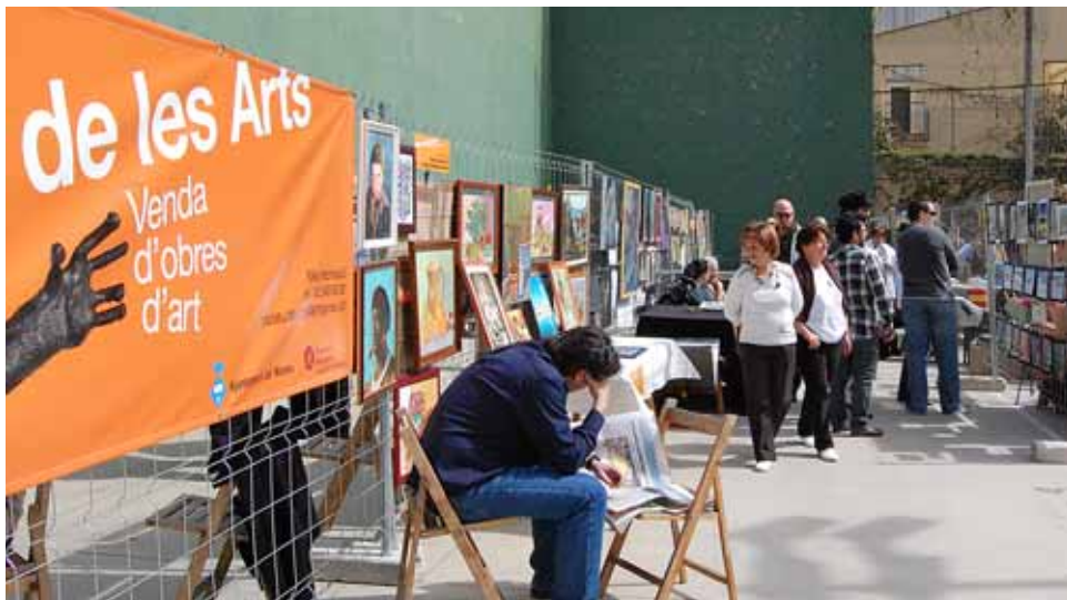
El Mercat de les Arts se celebrarà tres cops a l'any.

El primer Mercat de les Arts, una fira organitzada per l'Ajuntament i que vol promoure la feina dels i les artistes locals i on es van poder adquirir les seves obres, va tenir lloc el diumenge 28 de març, al pati del Casino, coincidint amb el 38è Aplec de la Sardana, organitzat per l'Agrupació