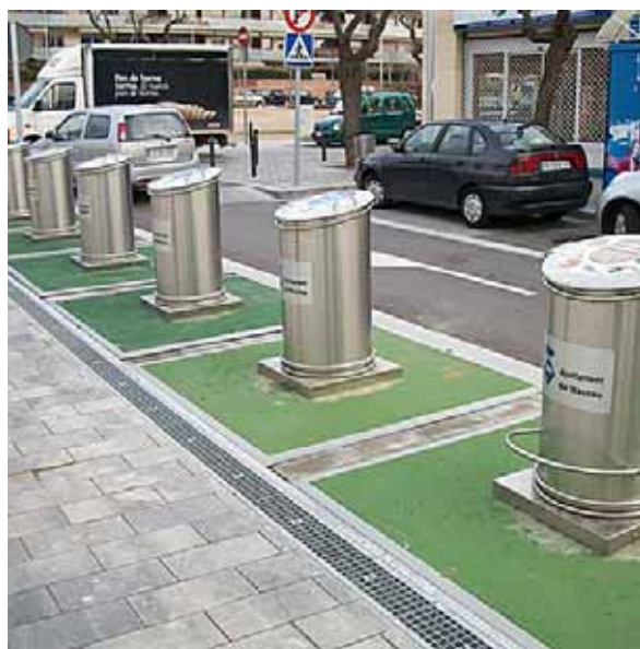
Els nous contenidors del carrer del Brasil.

A més de concentrar en un sol punt els contenidors per a cada tipus de residu, el sistema s'adapta als diferents ritmes de vida, perquè no hi ha límit horari per dipositar-hi les escombraries. D'altra banda, en ser una instal·lació estanca, també es redueixen les males olors, i és un sistema net i accessible, amb facilitat d'obertura i deposició. Amb tot plegat, es millora la qualitat de l'espai urbà. ■