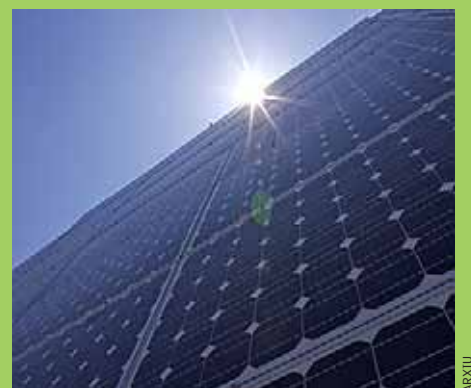
Plaques solars. Està previst instal·lar-ne a l'Edifici Centre al llarg del 2010.