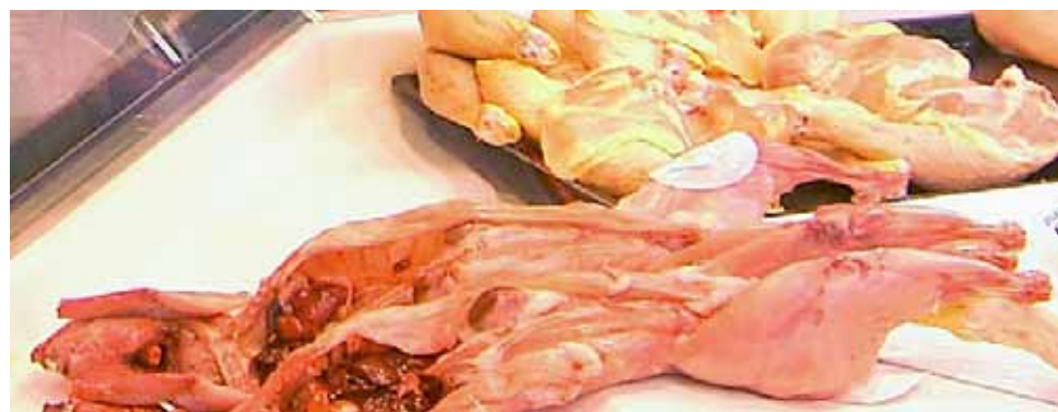
Un dels establiments de venda de carn que han de complir la normativa.

L'Ajuntament informa sobre la normativa que han de complir els establiments i en controla el compliment