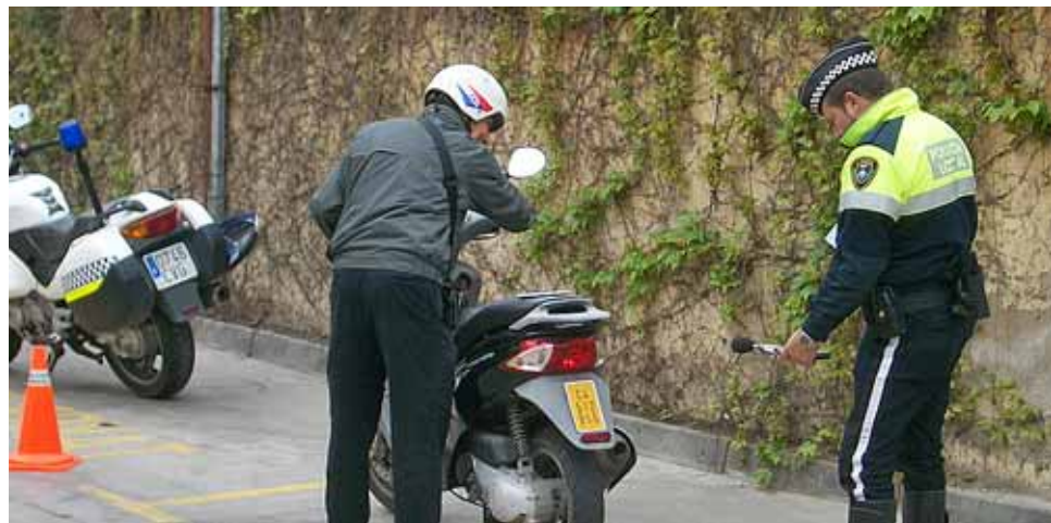
Un agent de la Policia Local controla el soroll d'una motocicleta.

La Policia Local ha posat en marxa una campanya de control del soroll que emeten els vehicles en circulació per reduir la contaminació acústica de la localitat, principalment en l'època de primavera i estiu, que és quan més incidència té aquesta problemàtica en el descans nocturn. En el cas que es detecti un vehicle circulant que produeixi un soroll per sobre dels límits permesos, la Policia citarà la persona que el condueix per mesurar, amb les condicions adequades, el soroll amb el vehicle aturat al dipòsit municipal. Si d'aquest mesurament resulta que el vehicle emet sorolls superiors als límits establerts a la normativa d'aplicació, serà immobilitzat fins que es repari en un taller mecànic designat per la persona titular del vehicle. Un cop arreglades les anomalies existents, serà lliurat a la persona titular. En el cas de reiteració, es propo-