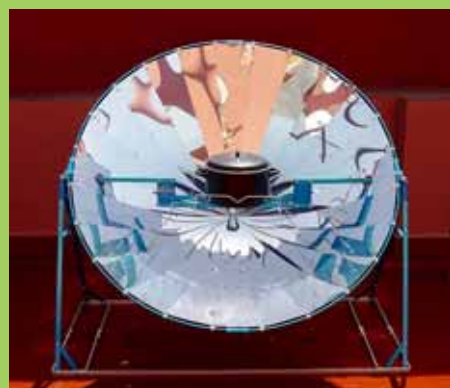
Una cuina solar similar a la que ofereix l'Ajuntament en préstec a escoles i entitats.

Per aconseguir aquests objectius, l'Ajuntament ha de redactar un pla d'acció d'energia sostenible, on es presentaran accions concretes que s'han de portar a terme al municipi. ■