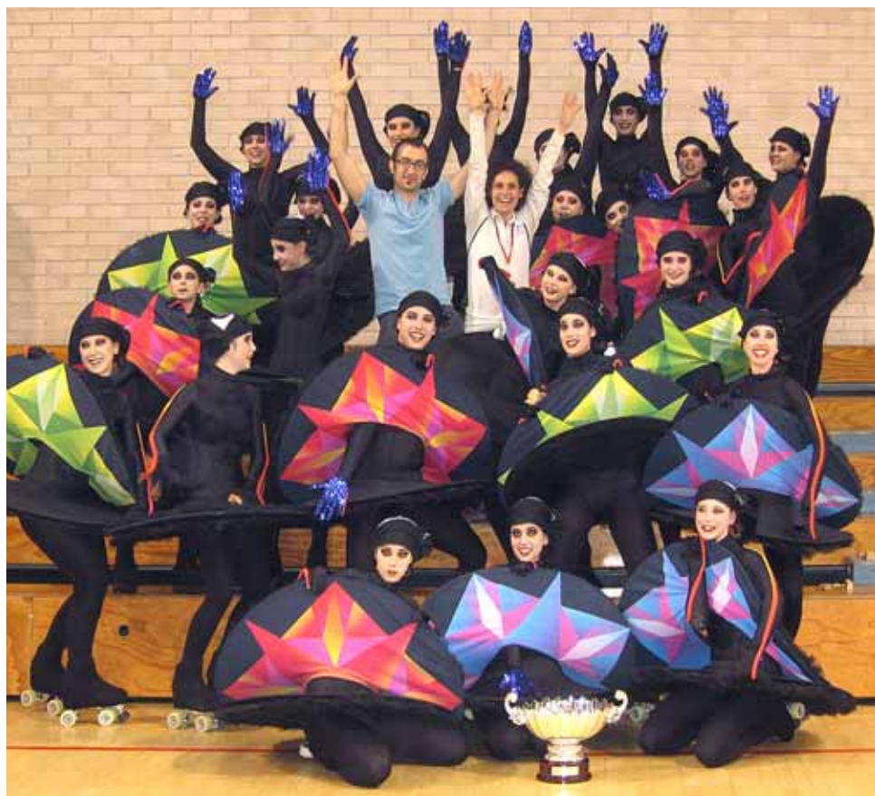
CP EL MASNOU