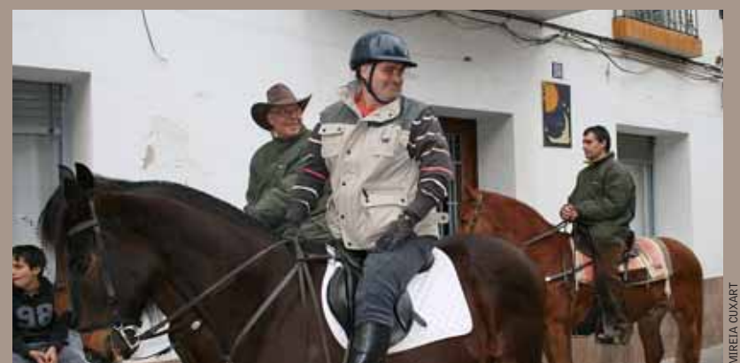
Els cavalls van desfilat per alguns carrers del municipi.

La tradicional festa dels Tres Tombs i la benedicció dels animals es va dur a terme, amb un gran èxit de participació, el 7 de març passat al carrer de Sant Rafael. Les activitats es van iniciar a les 12 h amb el recorregut de la comitiva dels Tres Tombs, en què van desfilat cavalls. Acte seguit, el