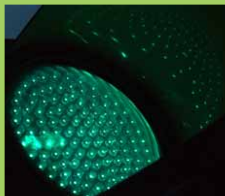
El sistema LED que s'ha instal·lat a tots els semàfors de la població.