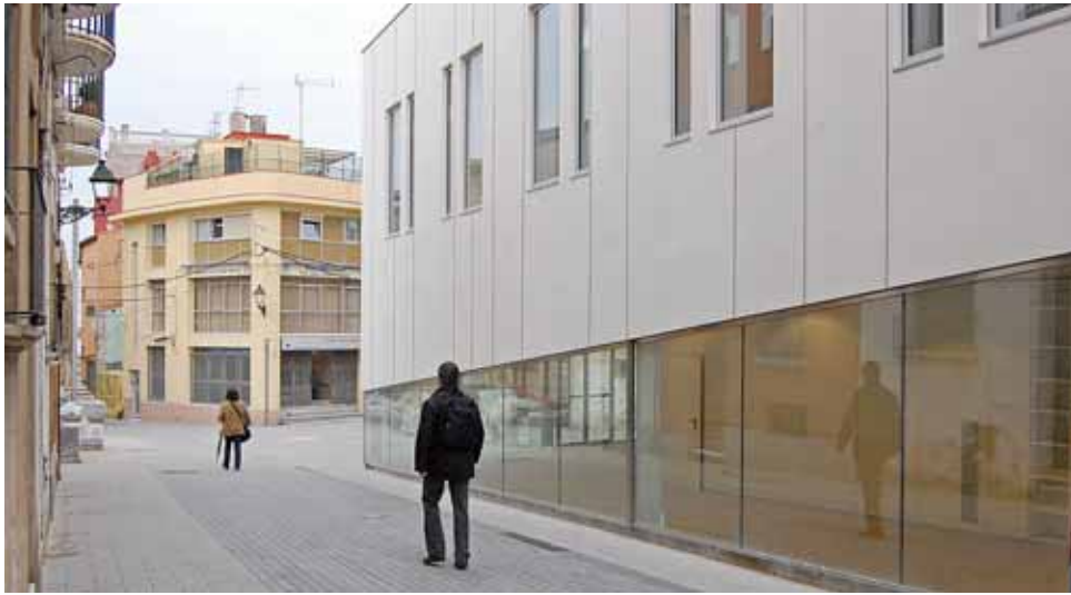
Façana del nou edifici municipal.

Està a punt de donar-se per acabades les obres del nou edifici municipal construït al solar on es trobava l'antiga seu de Correus, després d'haver enderrocat i traslladat l'es-