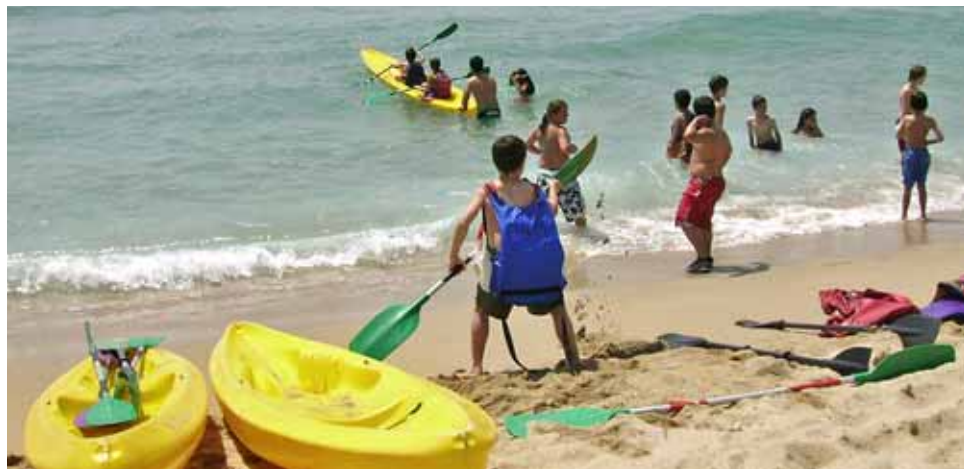
Activitat de caiac durant un Campus Esportiu anterior.

El programa d'activitats d'estiu Fakaló 2010, amb el Campus Esportiu i el Casal d'Estiu Infantil, organitzat per l'Ajuntament, ja és a punt per a les preinscripcions. Com l'any passat, es faran sense cues, ja que l'ordre d'entrega no donarà prioritat a tenir la plaça. Estar empadronat al Masnou donarà avantatge en el llistat d'inscripcions i, si la demanda és superior a l'oferta, es farà un sorteig entre totes les persones preinscrites.