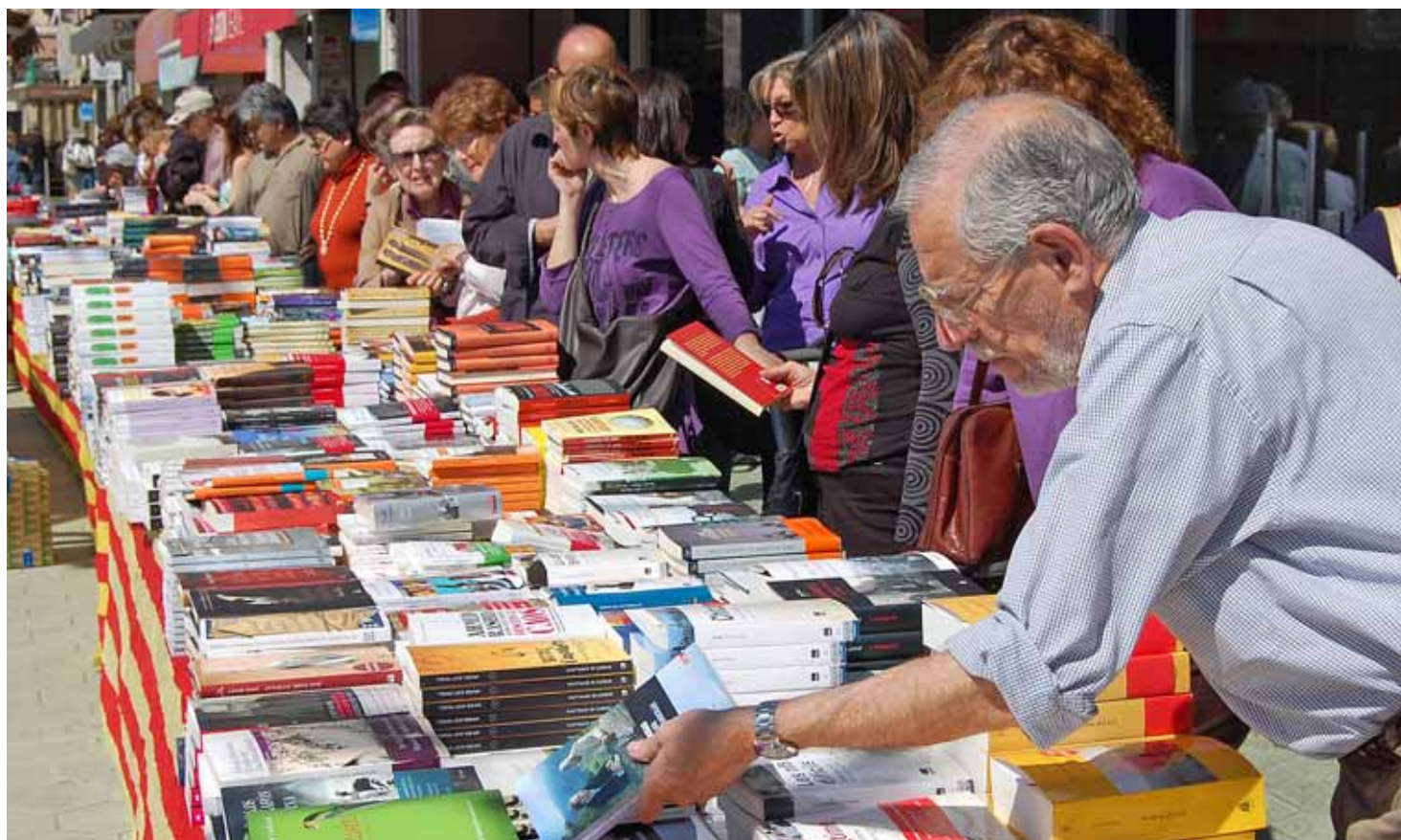
Les parades s'omplen de gom a gom de lectors i lectores que busquen el llibre més idoni per regalar.