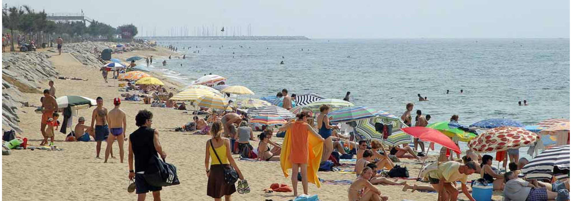
La platja és un dels escenaris més utilitzats a l'hora de gaudir de l'oci al municipi.