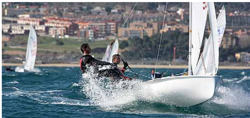
CP EL MASNOU