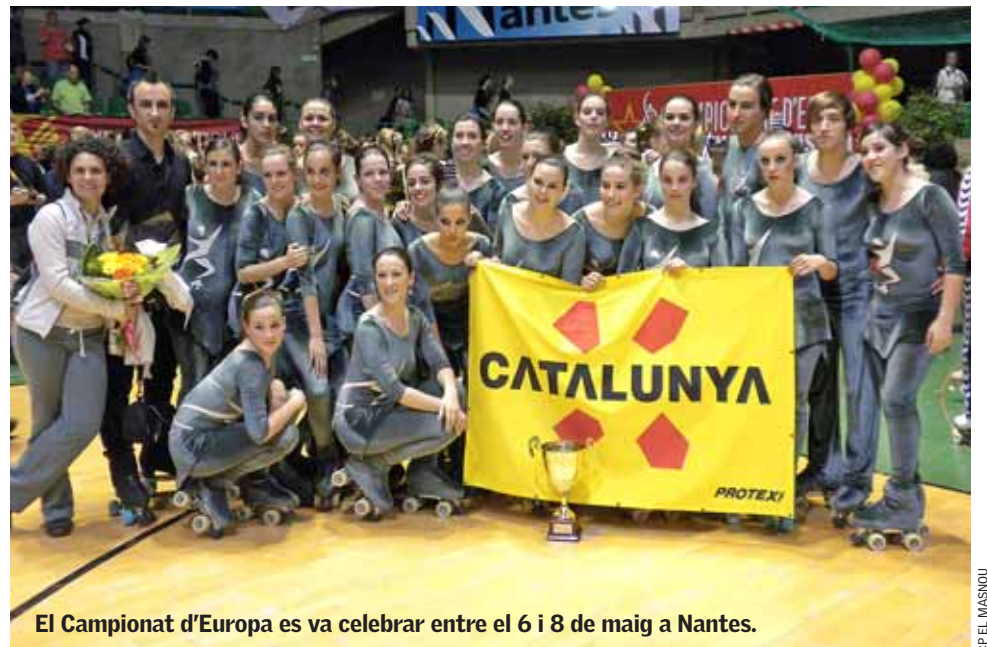
El Campionat d'Europa es va celebrar entre el 6 i 8 de maig a Nantes.

maig. El grup va executar el programa Mou-me i mira'm , que va aconseguir que el públic que omplia el pavelló restés expectant i que, en finalitzar el número, esclatés una gran ovació. ■