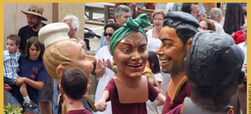
Els capgrossos acompanyen els gegants durant la Festa Major.

Per anar preparant la Festa Major, l'Ajuntament i la Colla Gegantera del Masnou han organitzat un taller de confecció del vestuari dels gegants del Masnou, que es completa amb un altre de restauració dels capgrossos, i que van començar a finals