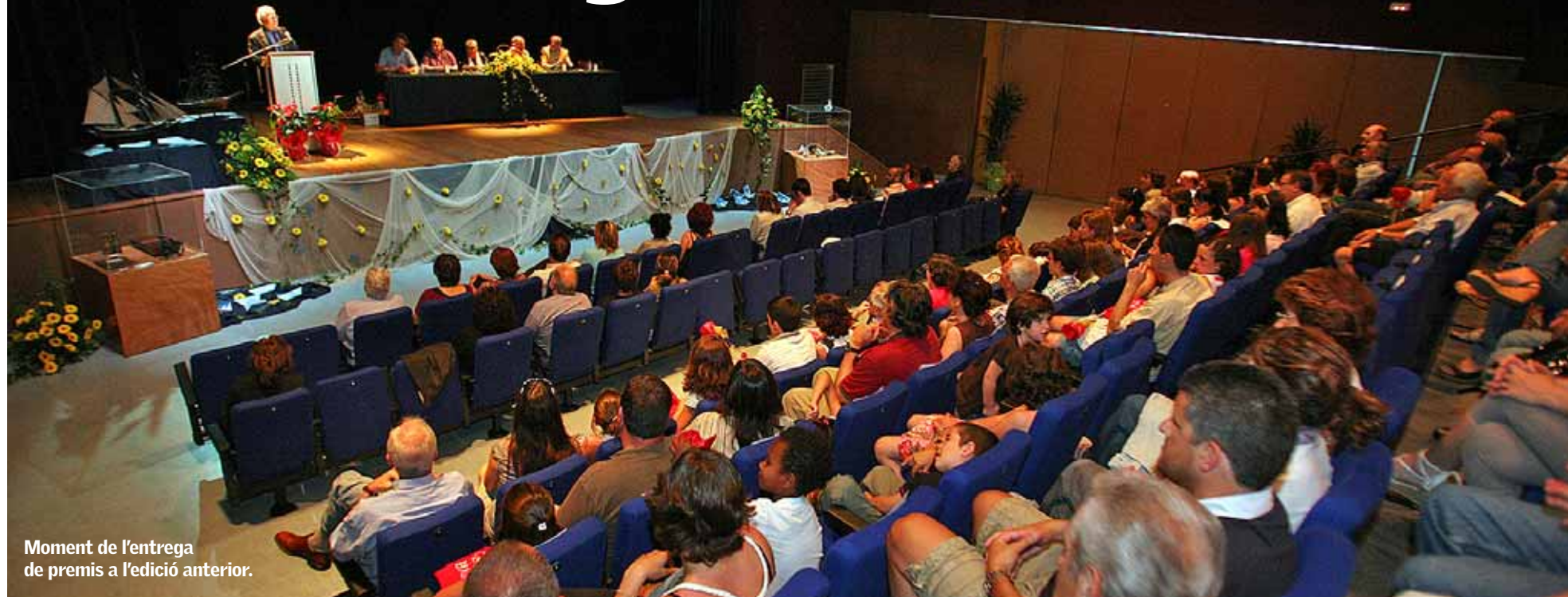
Moment de l'entrega de premis a l'edició anterior.