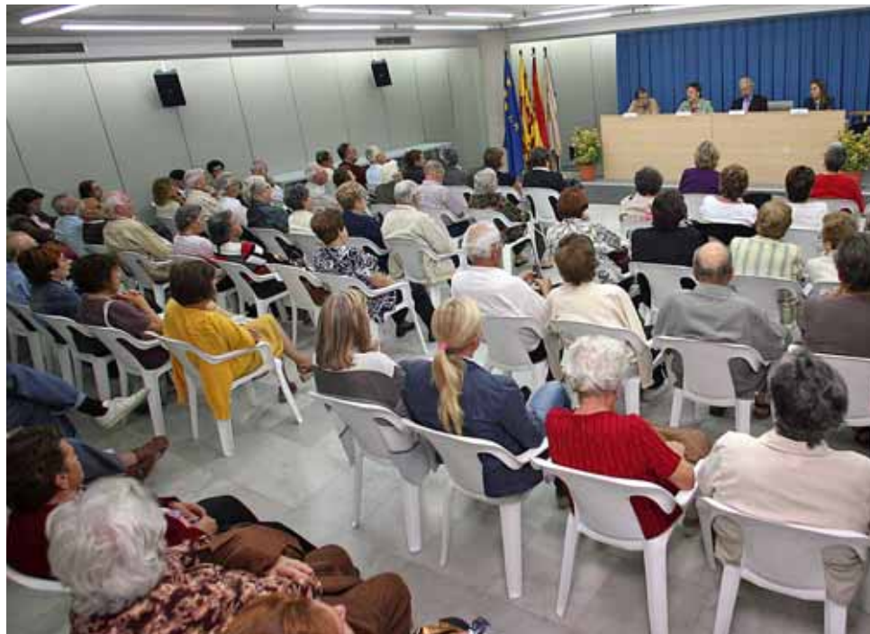
Imatge d'una xerrada a Can Malet.

La Regidoria d'Educació presentarà l'oferta de xerrades abans de l'estiu per promoure'n les inscripcions