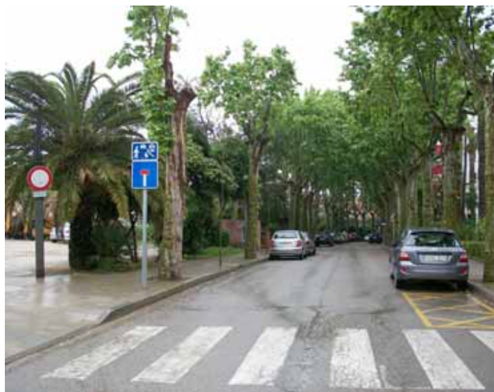
Se soterraran els contenidors dels carrers d'Almeria i Joan Carles I.