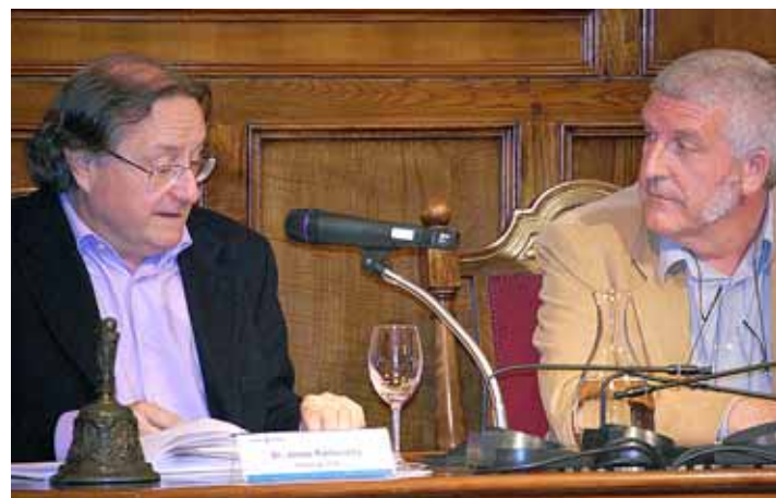
El director del CCCB va ser l'encarregat d'inaugurar el cicle.