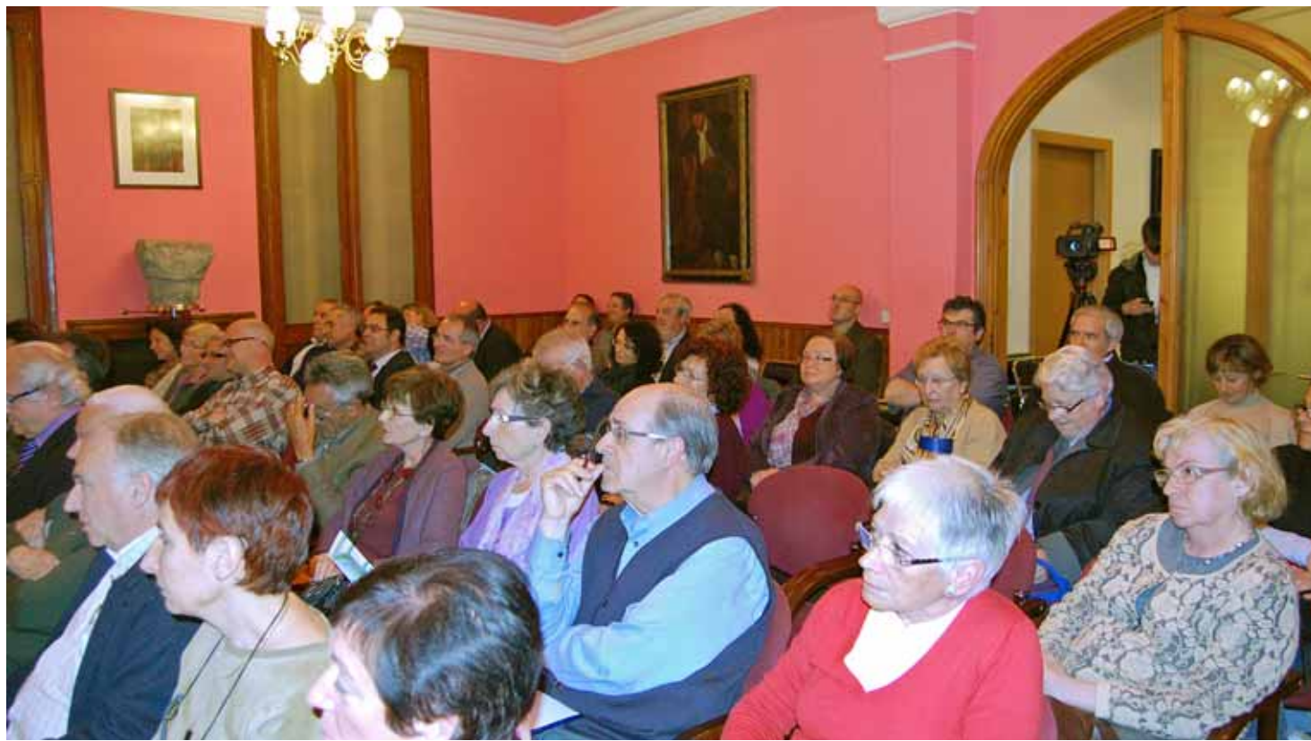
Les dues sessions que s'han fet fins ara han aconseguit omplir la sala capitular de l'Ajuntament.

El cicle de conferències 'Cap on anem?' proposa reflexions sobre el present i el futur d'aspectes com l'educació, la igualtat o la salut