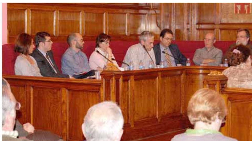
El Ple del mes d'abril va tenir lloc el dia 22.