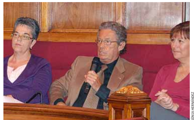
Es produeix un diàleg actiu entre la ciutadania i el conferenciant.

El filòsof Josep Ramoneda va ser l'encarregat d'iniciar, aquest dilluns 3 de maig, el cicle de xerrades Cap on anem? , que s'està duent a terme durant tots els dilluns del mes de maig –excepte el dilluns 24, que és Pasqua Granada, i serà substituït pel dimarts 25 de maig– a la sala capitular de l'Ajuntament. Aquesta iniciativa té una doble intenció: d'una banda, dinamitzar el debat públic, obert, crític i respectuós del Masnou, i, de l'altra, fer-ho obertament, portant al Masnou les reflexions d'intel·lectuals de prestigi reconegut a Catalunya.