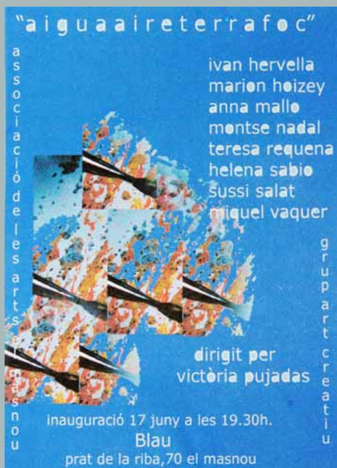
Cartell de l'exposició.