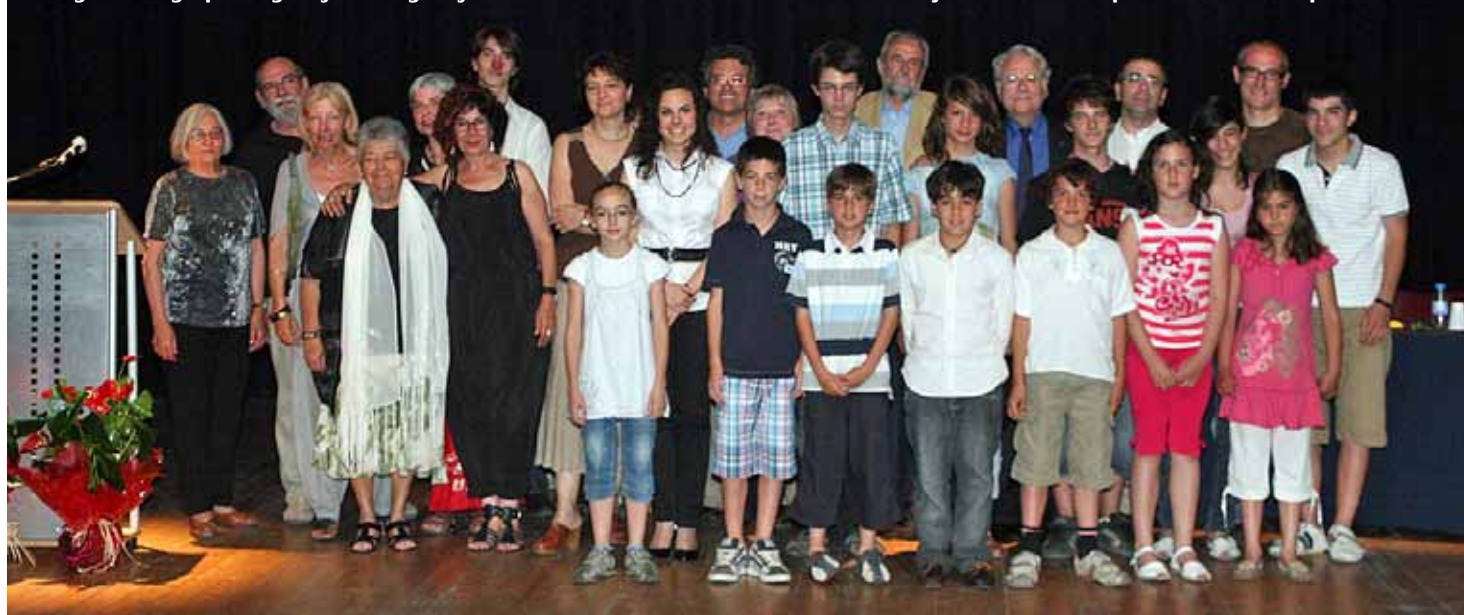
Fotografia de grup dels guanyadors i guanyadores de la darrera edició amb membres del jurat i diversos representants municipals.