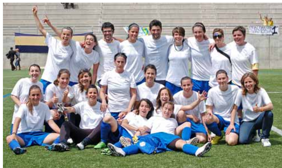
Les jugadores del Club després d'aconseguir la victòria.

L'equip femení de l'Atlètic Masnou es va formar amb la intenció de crear una secció femenina al Club després d'estar uns quants anys absent. Així doncs, com un grup d'amigues, van començar a jugar i, a