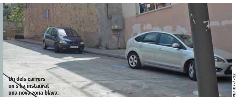
Un dels carrers on s'ha instaurat una nova zona blava.

Aquesta ampliació respon a la demanda creixent d'aparcament perquè els clients i les clientes dels establiments comercials puguin deixar el cotxe mentre fan compres i gestions, alhora que facilita als veïns i veïnes l'aparcament a partir de les 20 h, de dilluns a dissabte i durant tots els diumenges i festius ■