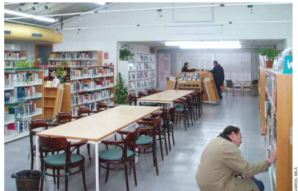
La biblioteca provisional es troba a la Sala d'Actes Municipal mentre durin les obres d'ampliació.

Per la seva banda, l'alcalde del Masnou, Eduard Gisbert , va assenyalar en la seva intervenció de cloenda que l'aprovació del pressupost per al 2010 havia estat un procés complicat, però alhora reeixit, i va lamentar que no s'hagués pogut tancar abans. L'alcalde va insistir que el pressu-