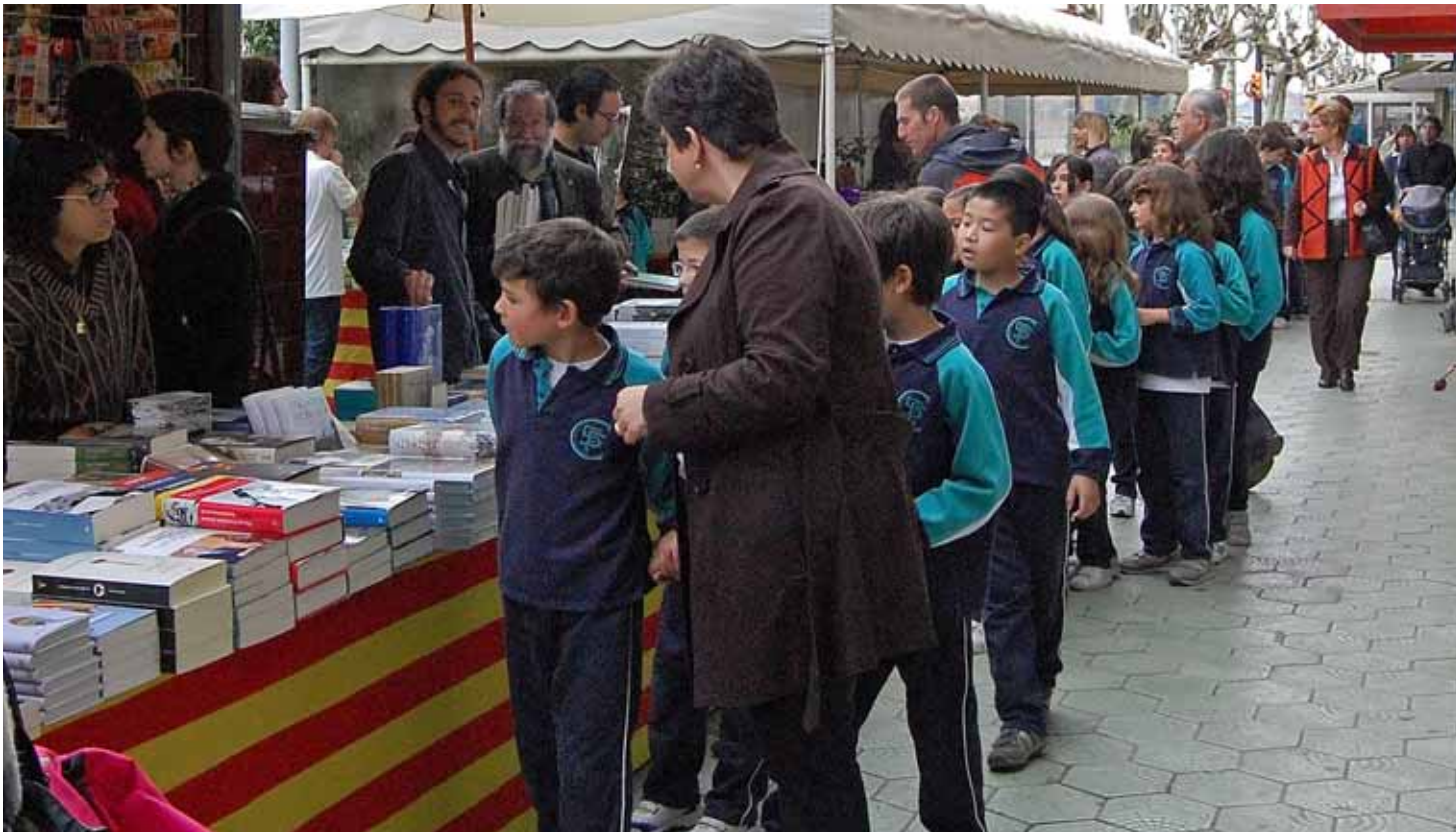
Els escolars van sortir al carrer per participar a la diada de Sant Jordi.

Durant tota la diada de Sant Jordi, els carrers del municipi es van omplir de parades de venda de llibres i roses. Juntament amb les diferents propostes lúdiques i culturals organitzades per les entitats i el consistori, la diada de Sant Jordi va ser una gran festa, i els masnovins i masnovines van sortir al carrer per participar en aquesta celebració.