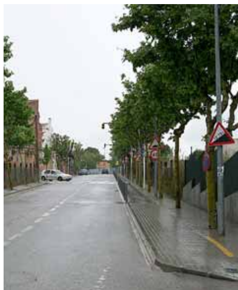
Es finalitzarà l'arranjament de l'accés al CEIP Marinada.

D'altra banda, també s'hi han inclòs projectes de millora d'equipaments socials i esportius, com l'ampliació i la millora del casal d'avis de Can Mandri, que preveu un nou edifici de 172 metres quadrats de planta baixa amb una sala polivalent i tres sales més petites. És previst que aquesta actuació es liciti i s'adjudiqui durant els propers mesos de juny i juliol. També s'ha previst l'adequació i la millora de les instal·lacions del Complex Esportiu i la reposició de la gespa artificial del camp de futbol del Masnou. ■