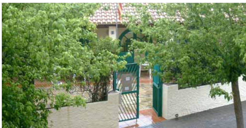
Aquest any és prevista una ampliació del Casal.

L'objectiu principal del Casal és aconseguir incrementar el benestar de la gent gran, per al qual treballen promovent les relacions socials amb la participació comunitària. Distreure's, divertir-se i passar-s'ho