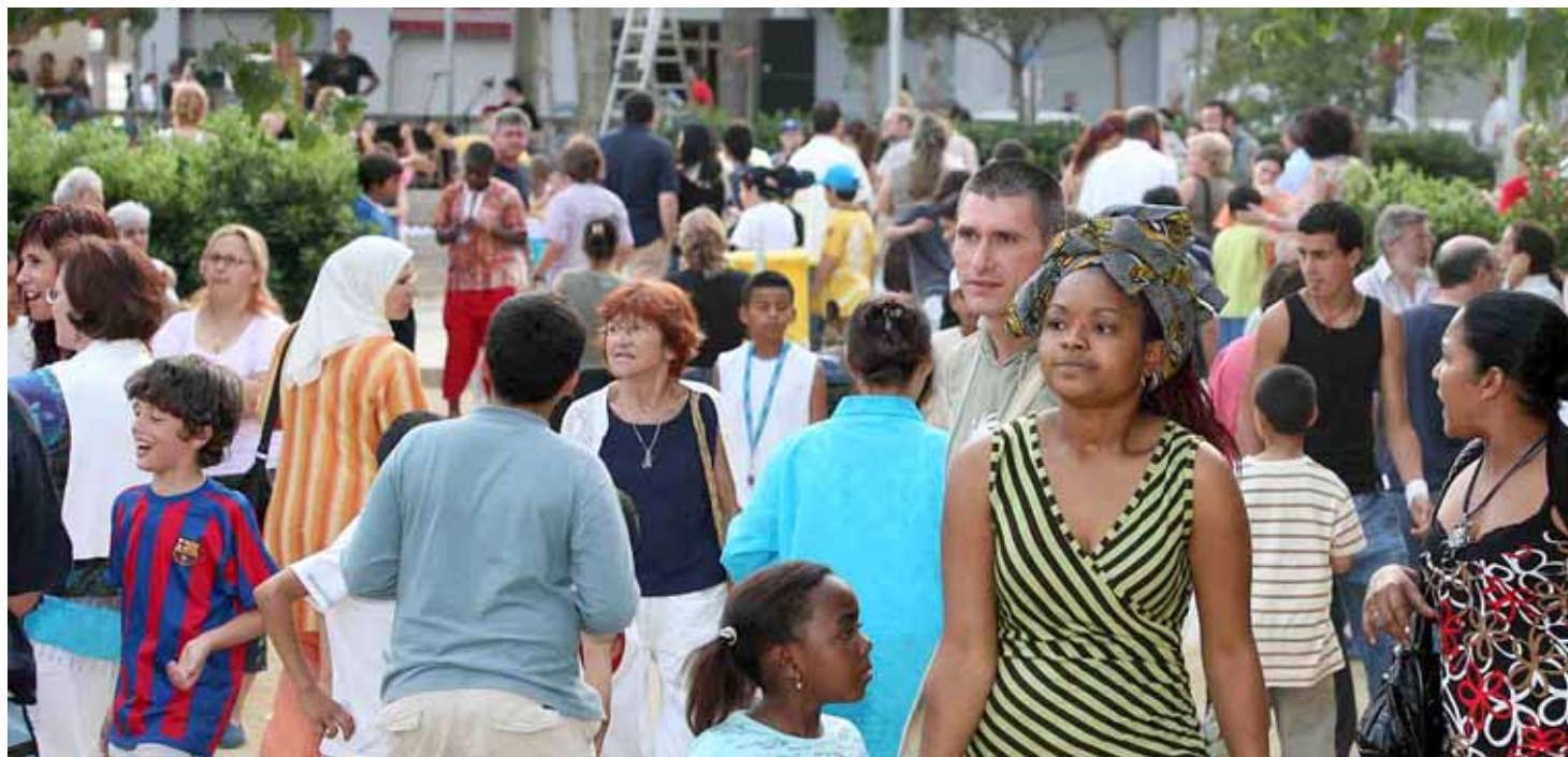
La convivència de persones de procedències diferents no es percep com un problema.

La tercera entrega de les conclusions extretes de l'enquesta de satisfacció ciutadana de les persones que viuen al Masnou, feta per la Diputació de Barcelona a 600 persones, permet traçar un perfil de la població del Masnou segons els seus hàbits culturals.