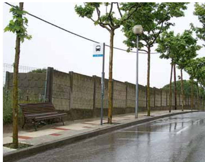
S'instal·laran marquesines noves i adaptades a les parades d'autobús més concorregudes.