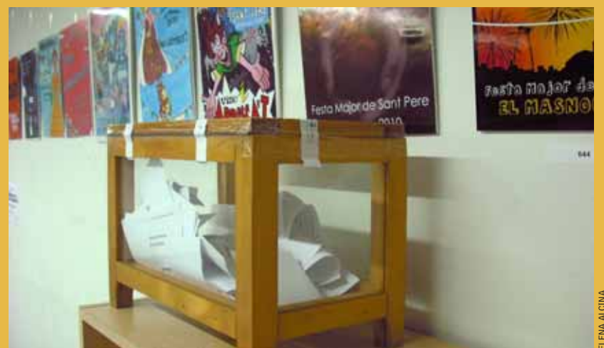
Urna on es poden dipositar els vots.

Enguany, per primer cop, es triarà la millor obra per votació popular