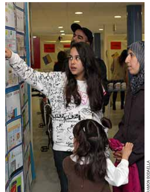
Una exposició va mostrar els cartells participants.

bril. Durant el lliurament de premis, l'alcalde va destacar la importància de contribuir a un consum més responsable i just, i també va agrair la col·laboració de les escoles en aquesta iniciativa.