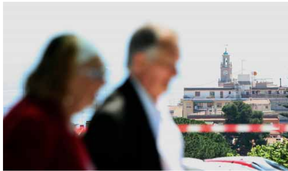
La Llei de dependència preveu diferents graus segons les necessitats de la persona sol·licitant.