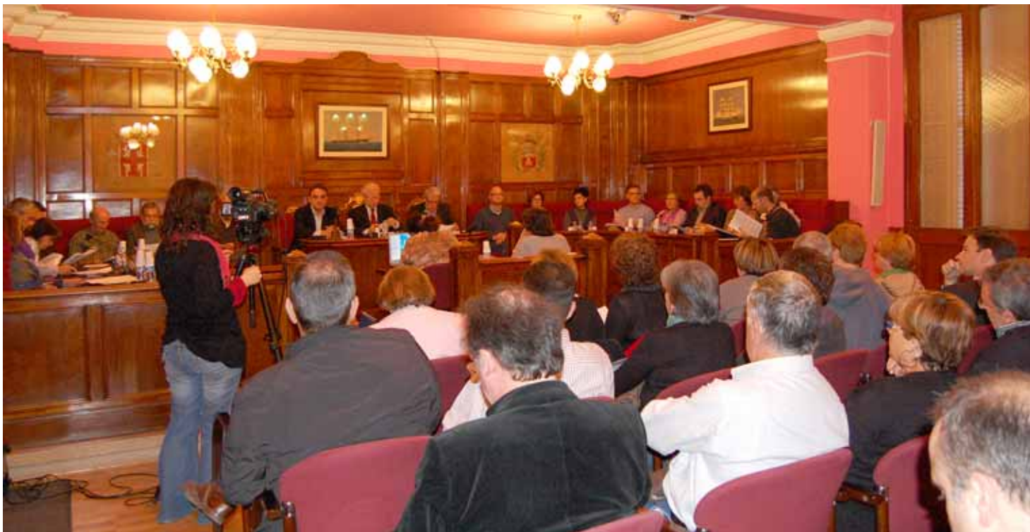
El Ple extraordinari de pressupostos va tenir lloc el 6 de maig passat.