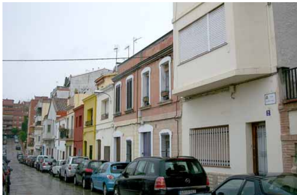
Es canviarà l'enllumenat públic exterior del carrer dels Ametllers (fotografia de l'esquerra) i del carrer de Buenos Aires (fotografia de la dreta) i Fontanills.

Ja estan en marxa deu dels onze projectes que l'Ajuntament del Masnou va adscriure al Fons Estatal per a l'Ocupació i la Sostenibilitat Local (FEOSL), creat pel Govern estatal com a continuació del Fons Estatal d'Inversió Local (FEIL), per promoure l'ocupació i ajudar els ajuntaments a superar la crisi amb una injecció econòmica d'1,9 milions d'euros al municipi per a actuacions i 478.000 per a despeses directes en Serveis Socials. Les inversions es dediquen prioritàriament a la modernització de l'Administració i l'estalvi energètic, i s'hauran de dur a terme al llarg d'aquest any. En aquest segon pla, es podrien ocupar unes 56 persones al Masnou.