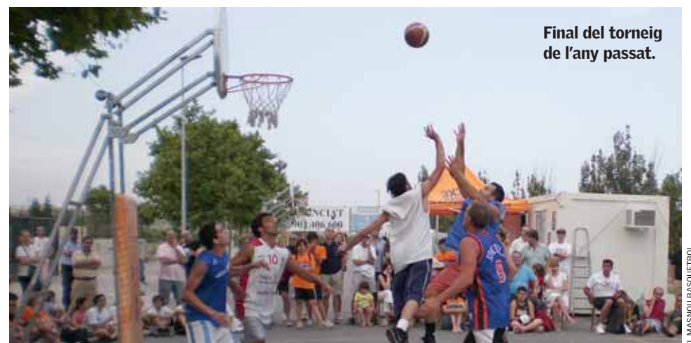
Final del torneig de l'any passat.

Per a més informació o per formalitzar la vostra inscripció en línia , podeu consultar els webs: www.elmasnoubasquetbol.com , www.elmasnoubasquetbol.cat o www.3x3.cat , o bé podeu passar per les oficines del Masnou Basquetbol al mateix Complex Esportiu Municipal, els dilluns, dimecres i divendres a partir de les 17.30 h.