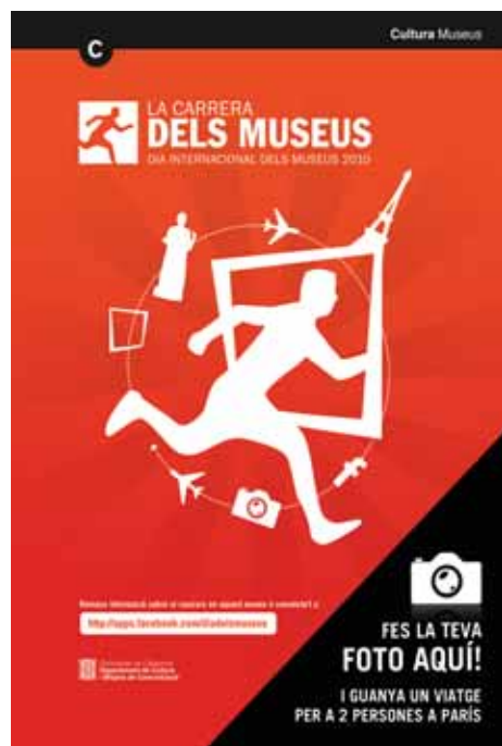
Cartell del concurs.

• Cal fer-se una foto amb el cartell de la "La Carrera dels Museus". En el cas del Masnou, el cartell estarà ubicat al vestíbul del Museu Municipal de Nàutica (per accedir-hi no cal fer la visita ni pagar entrada). ■