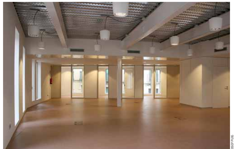
El nou equipament acollirà una cinquantena de treballadors i treballadores.

dable mitjançant la col·locació de nou mobiliari urbà i arbrat al voltant de la font. Alhora, s'ha potenciat el pas cap a les escales i les vistes, amb la qual cosa s'ha volgut convertir aquest racó en un dels més atractius del nucli urbà del Masnou. ■