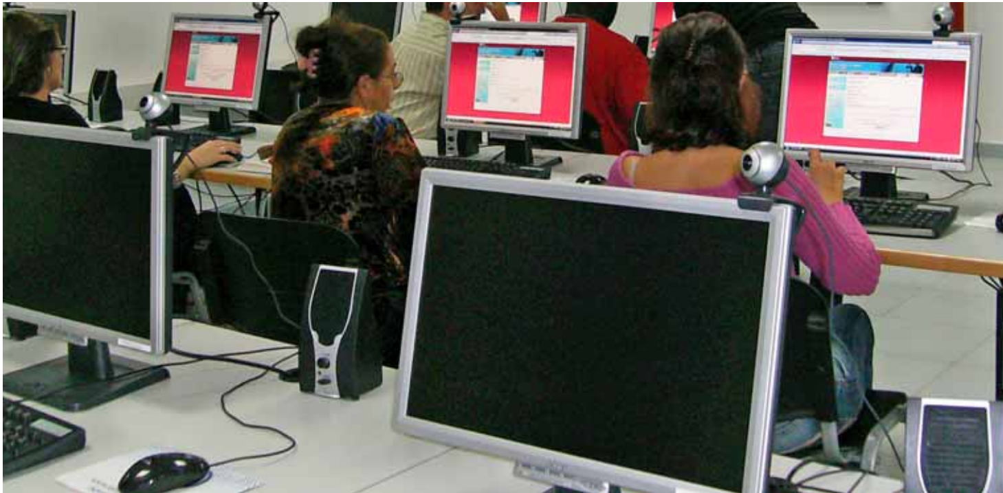
Els tallers tenen per objectiu que les dones puguin aprendre a navegar per Internet.

La Regidoria de Dona ofereix xerrades i tallers perquè les dones no quedin marginades de la xarxa