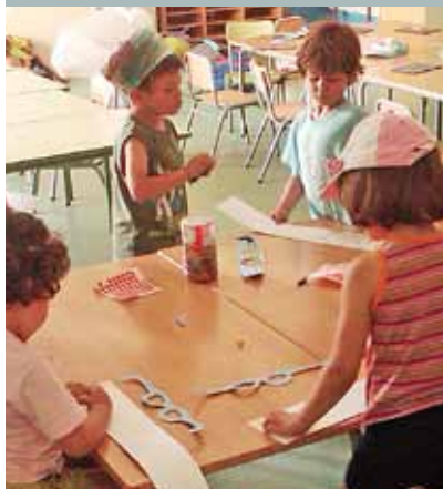
El Casal ofereix una sèrie d'activitats diverses.

Aquest any, un total de 142 nens i nenes participen en el Casal d'Estiu Infantil, iniciat el 27 de juny, i que finalitzarà el 29 de juliol. El casal té un fil conductor: la vida i els treballs dels gran científics. Durant el casal es desenvoluparan tot un seguit d'activitats: tallers, sortides, jocs i esports, destinades a assolir els objectius d'afavorir la participació activa dels nens i nenes en les activitats; crear un clima de companyonia i convivència; gaudir de l'espai de lleure que ofereix el casal; potenciar l'aspecte educatiu a través de les activitats intergrupals i potenciar el coneixement dels recursos del nostre entorn. A més a més, les activitats permetran, als nens i nenes, descobrir fórmules enginyoses. ■