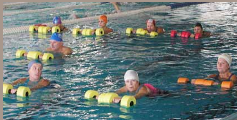
Una classe d'un dels cursets intensius.

Segons els responsables de la Regidoria d'Esports, aquest any hi ha hagut una bona acceptació de l'oferta per als cursets intensius de natació. Una mostra n'és que, en el transcurs del mes de juny, el nombre d'inscripcions ha estat superior al de l'any anterior, mentre que el mes de juliol s'han mantingut les inscripcions respecte a les fetes l'any 2010.