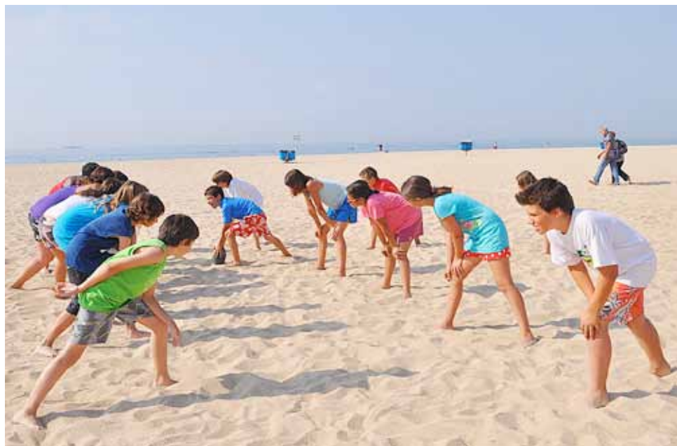
El Campus realitza diferents activitats esportives.

La iniciativa compta amb 270 inscripcions distribuïdes en dos torns