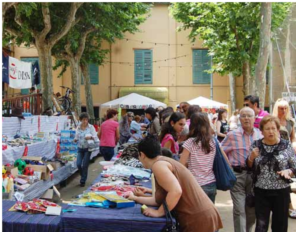
La celebració es va dur a terme al pati del Casino.

El diumenge 5 de juny, el pati del Casino va acollir el Festival pro Disminuïts Psíquics del Masnou, que com cada any celebra l'entitat DISMA, amb la col·laboració d'entitats, artistes i escoles del Masnou, per tal d'unir el poble per a una bona causa. Durant tota la jornada, es van fer diferents activitats