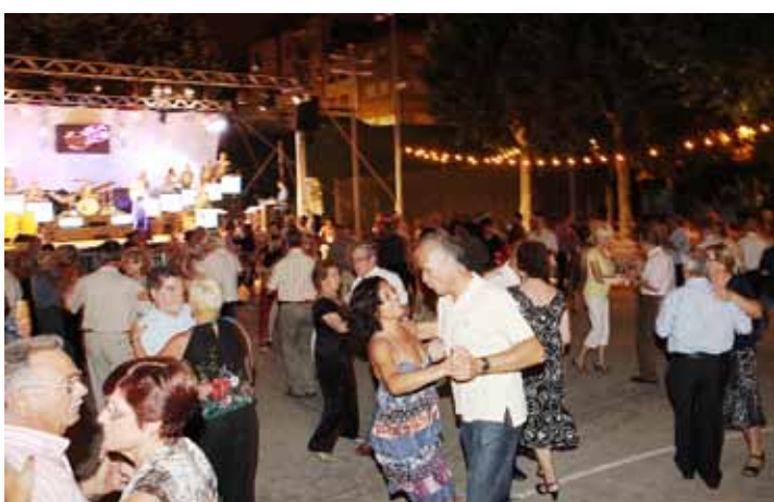
Ball tirat de Festa Major.

La Festa Major d'enguany ha comptat amb una gran participació per part dels masnovins i les masnovines. Una Festa Major que ha transcorregut amb total normalitat i sense incidents. Voldria valorar el conjunt d'activitats fetes per les entitats del Masnou i l'esforç i el treball que han dut a terme per fer-les realitat. Potser caldrà revisar el format massa llarg per adaptar-lo al nou calendari de l'any que ve. I voldria, també, donar les gràcies al conjunt de treballadors i treballadores municipals que amb la seva col·laboració han fet possible l'èxit d'aquesta Festa Major.