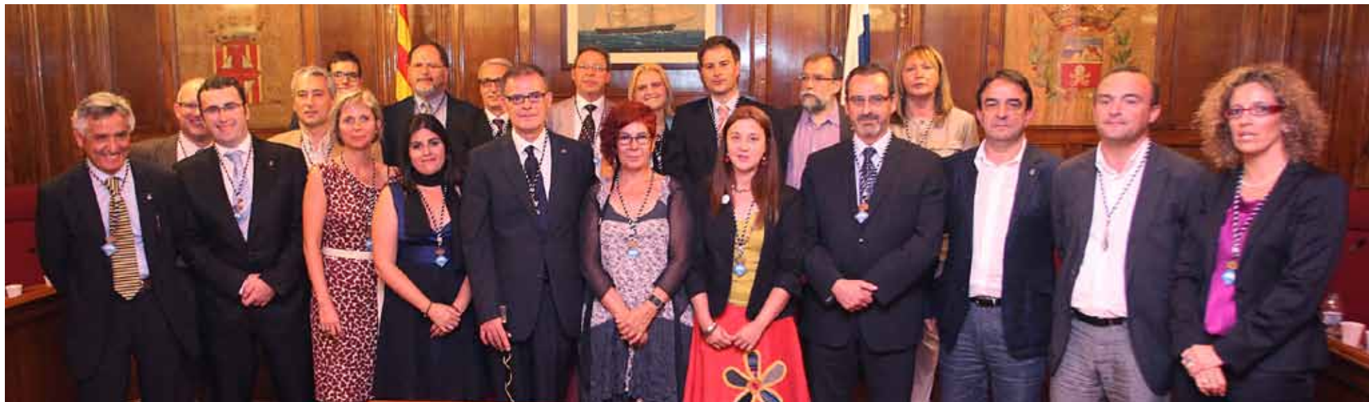
L'alcalde i els regidors i les regidores que compondran el nou consistori.

litat. Parés es va comprometre a treballar molt durament, perquè "desitjo ser un digne representant vostre". També la crisi econòmica i la desafecció política van ser presents en el seu parlament, i va assegurar que el seu Govern s'esforçarà per aconseguir majories àmplies en temes de tanta importància com els esmentats.