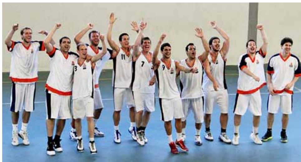
EL MASNOU BASQUETBOL

El Sènior "A" celebra l'ascens aconseguit a Copa Catalunya.