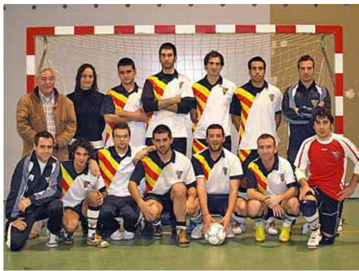
EQUIP SÈNIOR A