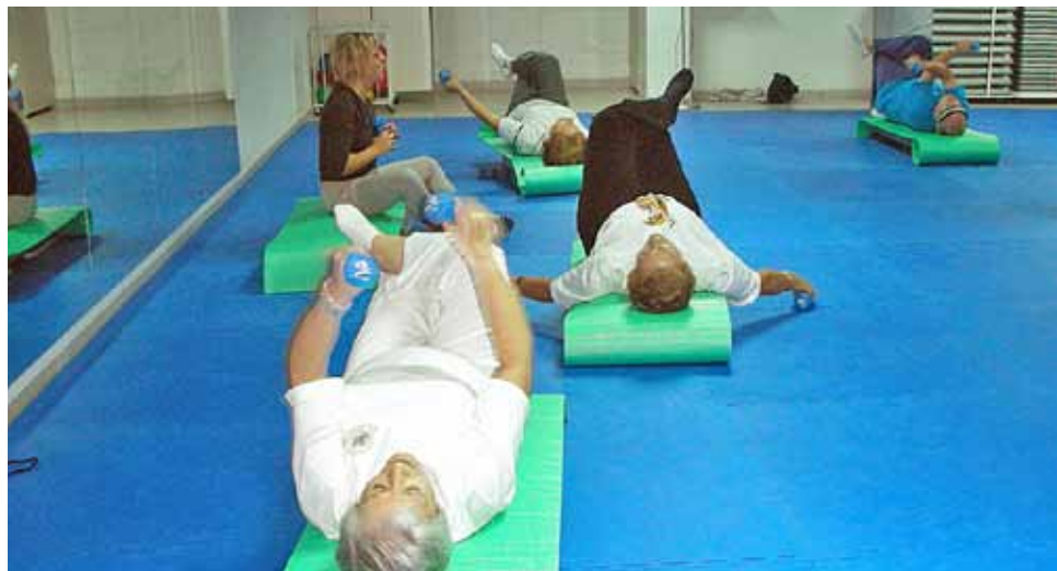
Les activitats es fan al col·legi Rosa Sensat i al Complex Esportiu.

Les activitats dirigides a les persones adultes començaran el proper 19 de setembre amb sessions de portes obertes per donar a conèixer el contingut i les característiques d'aquestes, els horaris, les instal·lacions... Després, en el transcurs del mateix mes, s'iniciaran les inscripcions per al primer trimestre de la temporada 2011-2012. Les activitats que s'ofereixen són tai-txi, aeròbic, manteniment, tonificació-GAC i pilates. Per a aquest nou curs s'ha previst ampliar dos mesos més la durada de l'activitat, així es començarà al mes de setembre i s'acabarà a finals de juliol.