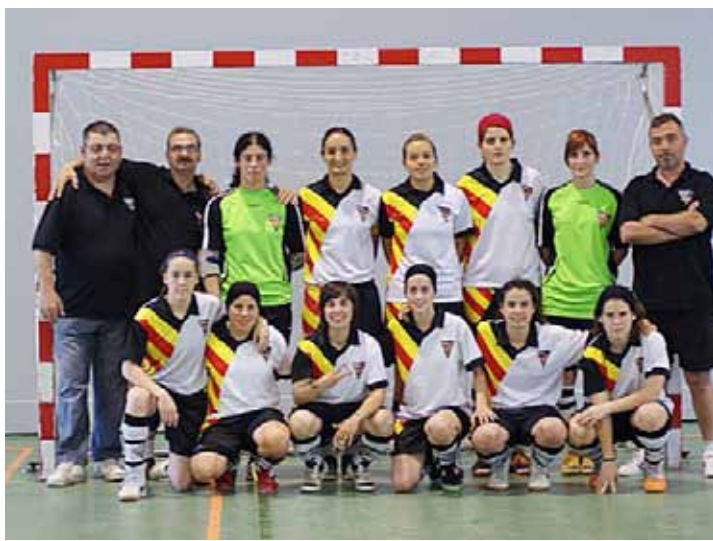
EQUIP FEMENÍ A