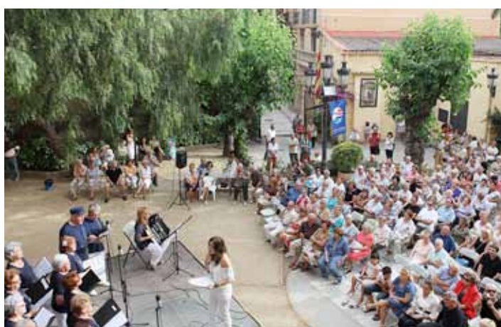
Concert als Jardins de Can Malet.