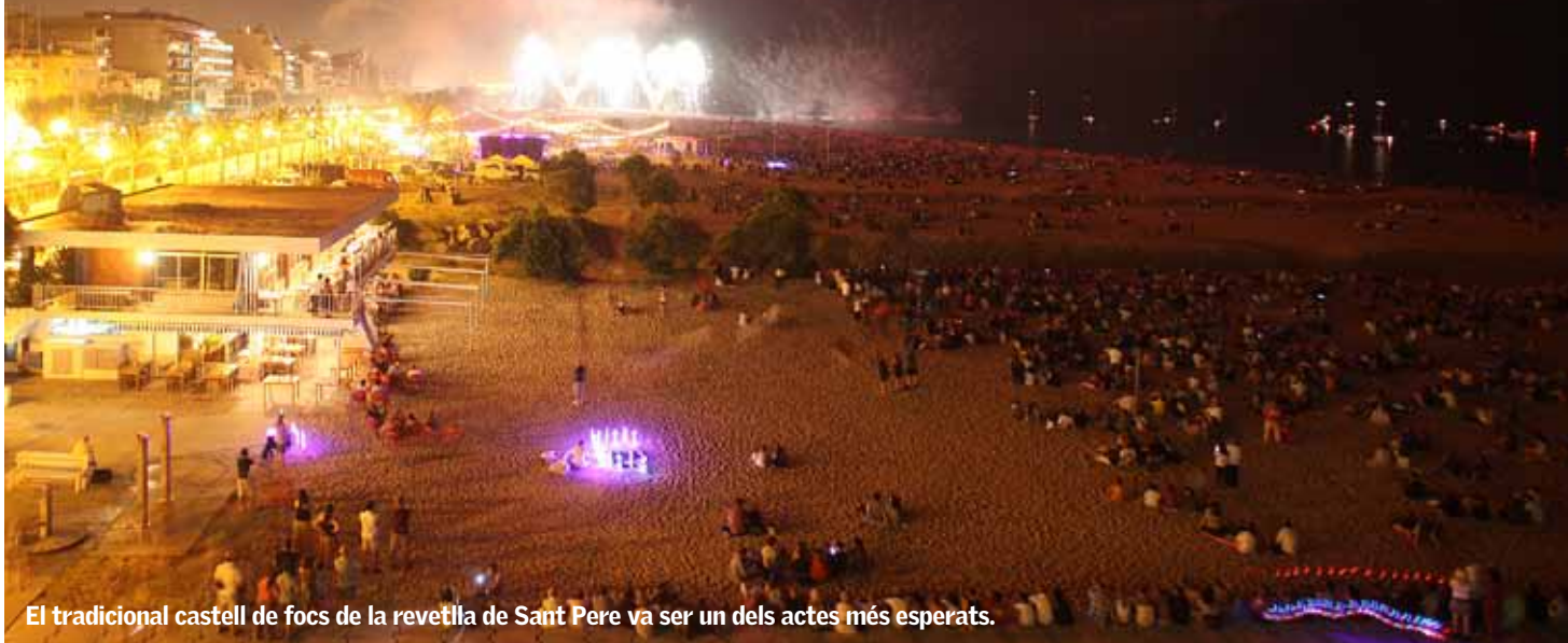
El tradicional castell de focs de la revetlla de Sant Pere va ser un dels actes més esperats.

El regidor de Cultura valora positivament la participació i l'esforç realitzat en l'organització de la Festa Major per part de les entitats