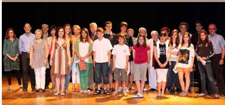
Guardonats i membres del jurat als premis literaris Goleta i Bergantí.

El veredictes de la XXXIII convocatòria dels Premis Literaris Goleta i Bergantí es va fer públic el dissabte 28 de maig, a la sala polivalent de Ca n'Humet, durant la cerimònia de lliurament dels premis. S'hi havien presentat un total de 145 obres en les modalitats de narrativa i poesia, dividides en diferents categories segons l'edat dels autors i autores. El Grup Amateur de Teatre (GAT) va fer una lectura dramatitzada de fragments de les obres guanyadores i també hi va haver una actuació de la Jove Orquestra de Cambra del Masnou . ■