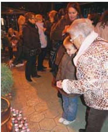
L'encensa d'espelmes sempre compta amb molta participació.

Durant el mes de novembre, i amb motiu de la celebració del Dia Internacional contra la Violència de Gènere (25 de novembre), l'Ajuntament del Masnou i diverses entitats del municipi han preparat diversos actes per mostrar el seu rebuig a qualsevol forma de violència de gènere. El dijous 24 de novembre (19.30 h, a la segona planta de Can Malet), tindrà