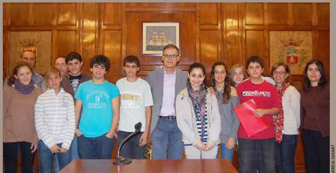
Els escolars van visitar l'Ajuntament el 20 d'octubre per entrevistar l'alcalde.

El Col·legi Sagrada Família participa en el projecte Connecting Classrooms des de principis del curs passat. Aquest projecte, promogut des del British Council amb la col·laboració del Departament d'Ensenyament, pretén construir llaços de participació entre escoles de seixanta països d'arreu del món. L'objectiu és promoure escoles culturalment inclusives.