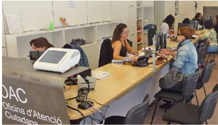
Els usuaris han valorat positivament el servei.