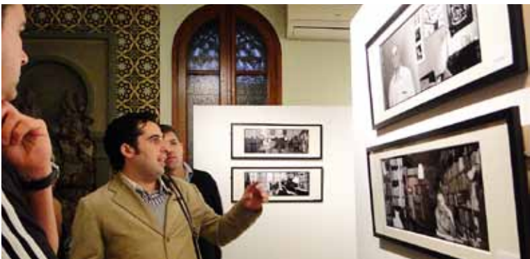
Les exposicions es poden visitar fins al 20 de novembre.