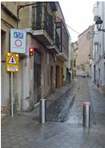
La piona del carrer de Josep Llimona.

El 20 d'octubre, es va posar en marxa la piona pneumàtica del carrer de Josep Llimona (cantonada amb la Nacional II) per tal de regular l'accés de vehicles en aquesta zona. Durant la setmana anterior, se'n van atorgar els comandaments a les persones autoritzades per tal que puguin accedir al carrer de Josep Llimona, la plaça de Jaume Bertran i el carrer de Sant Josep, i puguin estacionar als guals o efectuar la càrrega i descàrrega a prop dels seus domicilis.