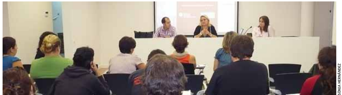
El curs de prevenció de conductes de risc s'adreça a persones que treballen i conviuen amb joves i adolescents.

L'enquesta va ser un dels punts clau del Pla, que s'ha dissenyat perquè es desenvolupi en sis fases: la primera, l'aprovació de la decisió de fer un pla municipal de prevenció; la segona, la creació de la comissió política de seguiment,