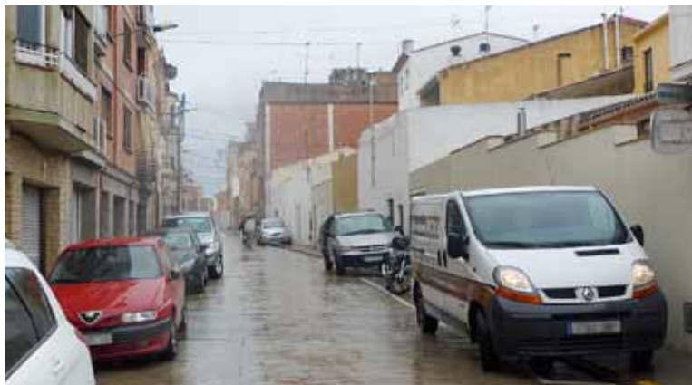
Exemple d'actituds incíviques dels vehicles.