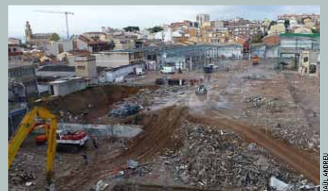
La fàbrica ocupava uns terrenys amplis al centre del municipi.

bre, el projecte es troba en període d'exposició pública. Es pot consultar a la Unitat d'Urbanisme de l'Ajuntament del Masnou (carrer de Tomàs Vives, 2, 2a planta), en horari d'atenció al públic, de dilluns a divendres, de 8.30 a 14 h, i també a la pàgina web municipal: www.elmasnou.cat . ■