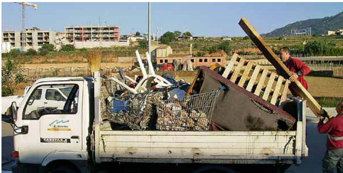
Per al bon manteniment del servei, cal seguir el protocol establert per a la recollida d'andròmines.

En tot cas, cal tenir molt present que la deixalleria mancomunada del Masnou, Alella i Teià és oberta de dimarts a dissabte, de 10 a 14 h i de 16 a 19 h, i els diumenges, de 10 a 13 h. El telèfon és el 93 555 86 99.