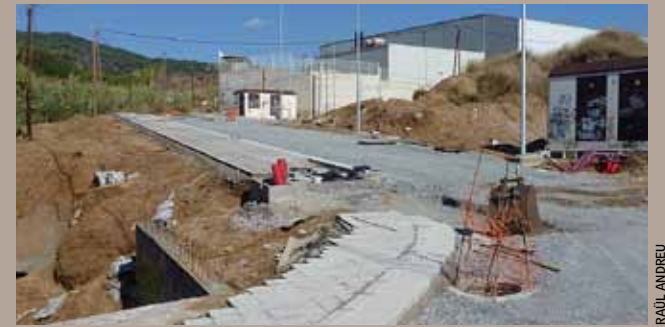
Una zona del sector afectat.