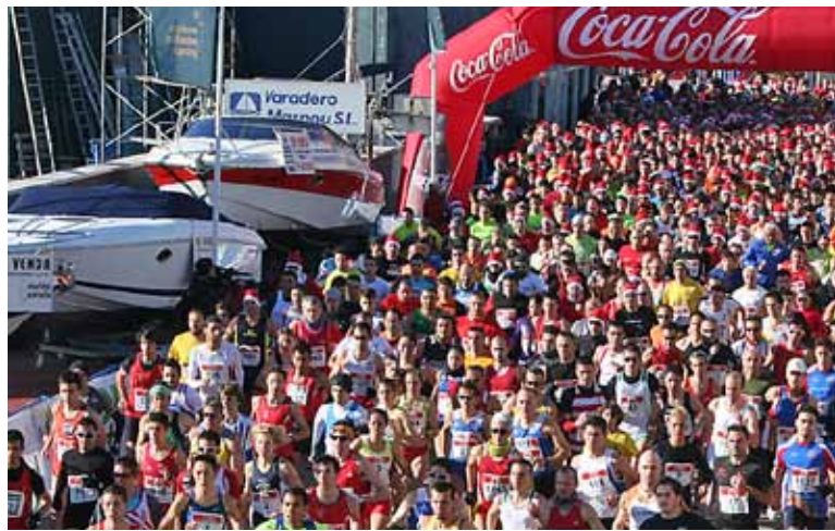
La darrera edició va comptar amb una participació de més de mil persones.

La pàgina web oficial de la cursa ( www.santsilvestredelmasnou.com ) anirà informant progressivament de totes les novetats. Com l'any passat, el recorregut popular serà de cinc quilòmetres i també es farà la cursa infantil. ■