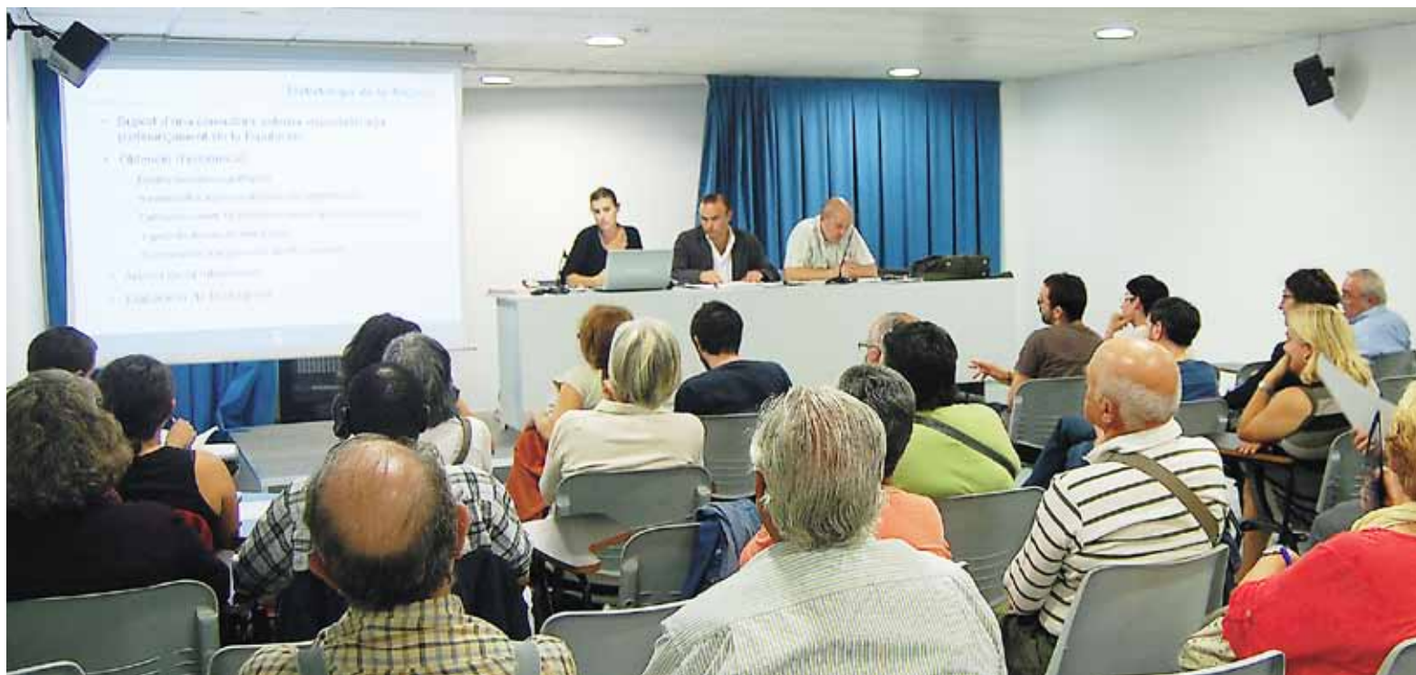
El dimarts 18 d'octubre es va organitzar una reunió de treball entre representants de l'Ajuntament i entitats i col·lectius del municipi.