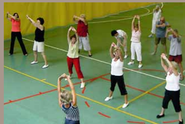
Encara és possible inscriure's a alguna de les activitats del Complex Esportiu.

Aquest curs 2011-2012, les activitats dirigides van engegar, entre el 19 al 30 de setembre, amb unes jornades de portes obertes, perquè tothom pogués provar les diferents modalitats i els esports que es fan en diverses instal·lacions municipals. Les activitats de tonificació GAC, Pilates i aeròbic tarda han tingut tan bona acollida que totes les places dels grups oberts han quedat cobertes. A més, a demanda de les persones usuàries, s'ha obert un altre grup nou de