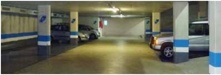
Vehicles a l'aparcament del Mercat Vell.

El dissabte 1 d'octubre va començar a funcionar amb normalitat l'aparcament del Mercat Vell. A les plantes 0 i 1 hi ha 25 places d'aparcament de zona blava, mentre que el nivell -1 disposa de 17 places que han estat adjudicades en règim d'abonament a veïns i veïnes de la zona.