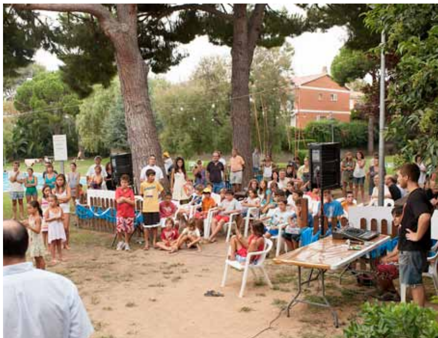
Al llarg de l'any organitzen diverses activitats coincidint amb el calendari festiu.