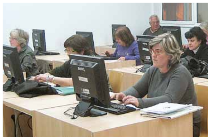
El CFPAM és una aposta destacada del consistori, que vetlla per la formació.

La Regidoria d'Ensenyament té les competències municipals, entre d'altres, de la participació en el procés d'escolarització, la cooperació en la construcció i el manteniment dels centres docents, la intervenció en els òrgans de participació escolar (Consell Escolar Municipal del Masnou) o l'organització d'activitats pedagògiques destinades a alumnes del Masnou d'una àmplia varietat, amb el suport d'altres regidories.