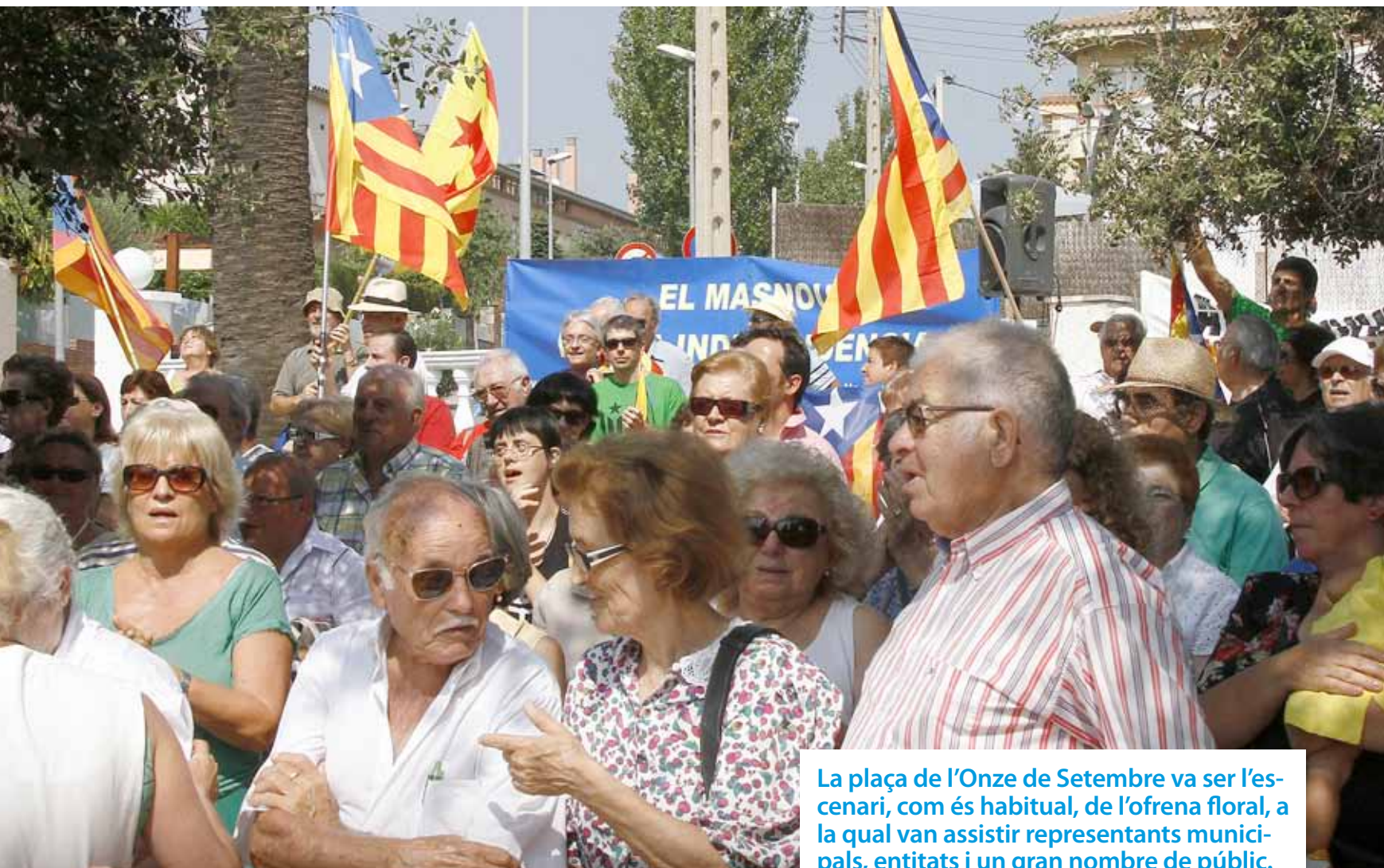
La plaça de l'Onze de Setembre va ser l'escenari, com és habitual, de l'ofrena floral, a la qual van assistir representants municipals, entitats i un gran nombre de públic.