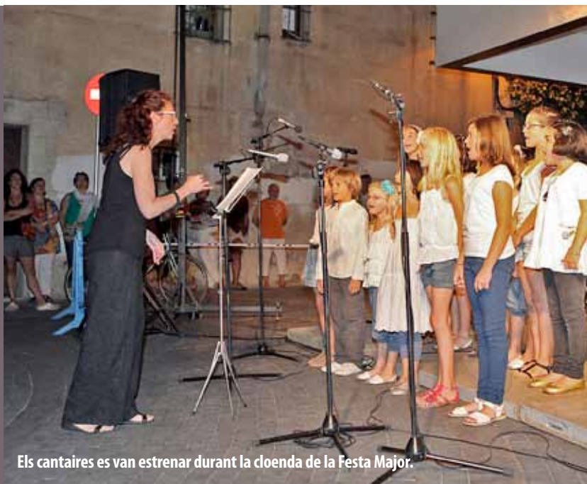
Els cantaires es van estrenar durant la cloenda de la Festa Major.

El diumenge 8 de juliol, a les 22 h, va actuar en públic, per primer cop, la coral infantil de l'Associació UNESCO El Masnou, amb motiu de la cloenda de la Festa Major del municipi. Aquesta coral, formada per una dotzena d'infants, i dirigida per una mestra i una pianista, va interpretar sis cançons, quatre de les quals en llengües estrangeres. Van ser temes curts, alegres, divertits, amb un ritme trepidant, que van fer moure cantants i públic. La coral de l'Associació UNESCO El Masnou es troba per assajar cada dissabte, de 10 a 12 h, a les instal·lacions d'Els Vienesos. Se'n pot trobar més informació a la seva pàgina web: http://www.masunesco.org .