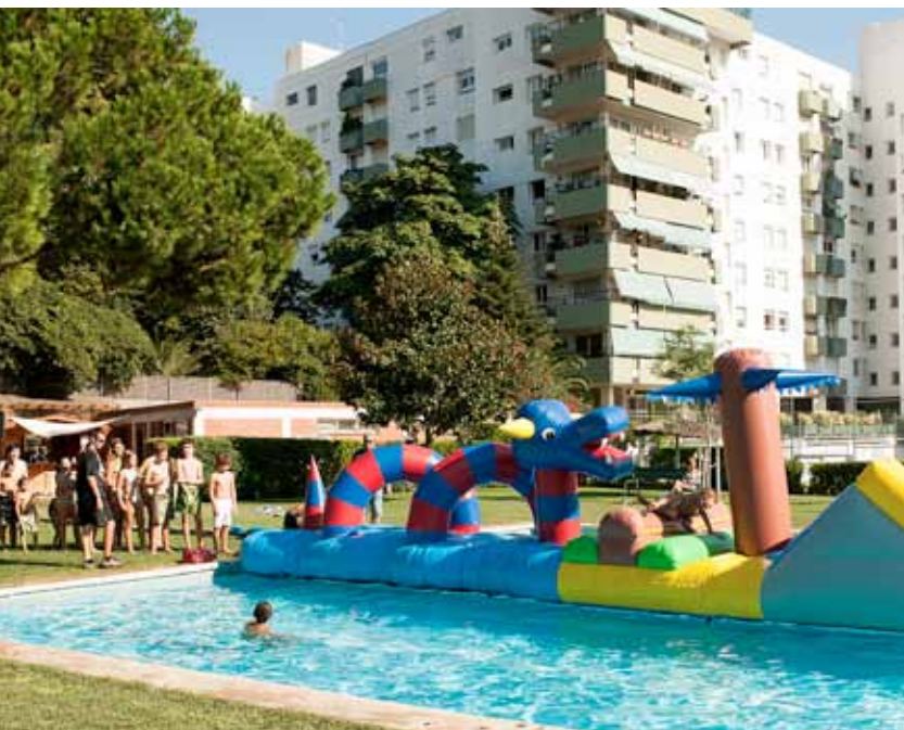
L'entitat vol fomentar la convivència entre els veïns del barri.