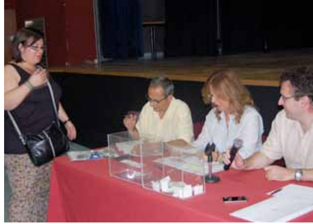
El sorteig dels pisos que havien quedat buits es va fer el 30 de juliol, a Ca n'Humet.

Entre les 118 sol·licituds admeses, d'aquest sorteig públic van