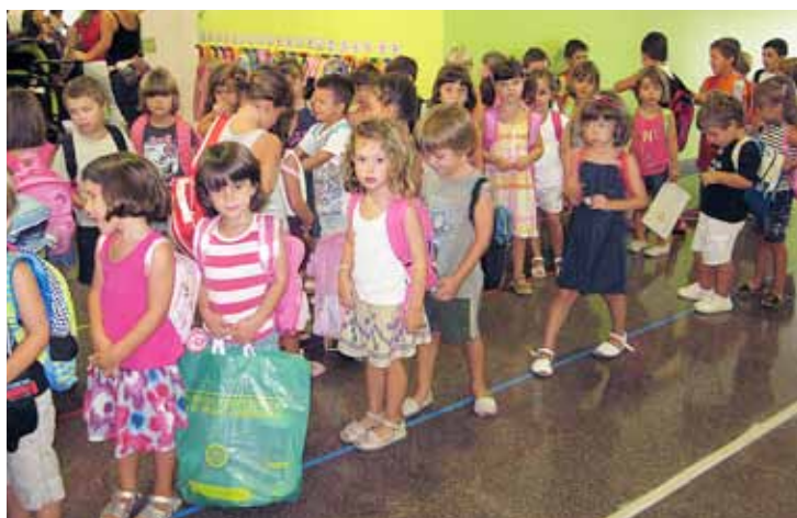
Aquest Departament segueix de prop el desenvolupament dels centres.

Amb Manteniment, aquest departament s'encarrega de la conservació i les millores estructurals i funcionals dels centres públics