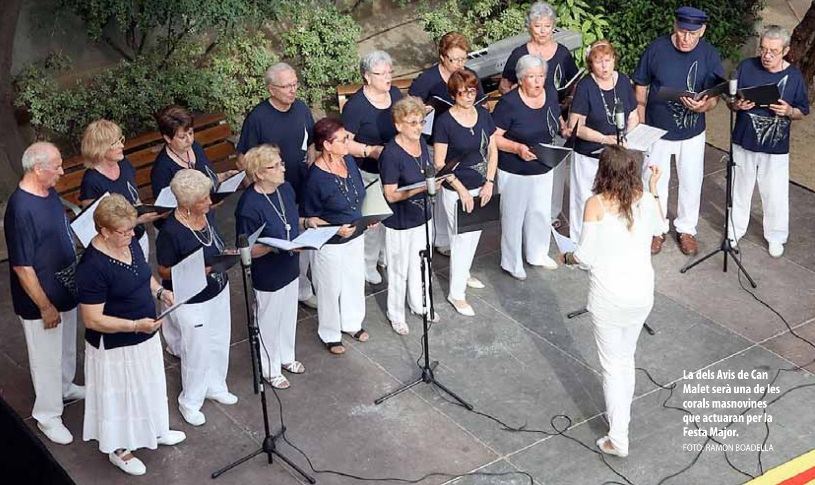
La dels Avis de Can Malet serà una de les corals masnovines que actuaran per la Festa Major.