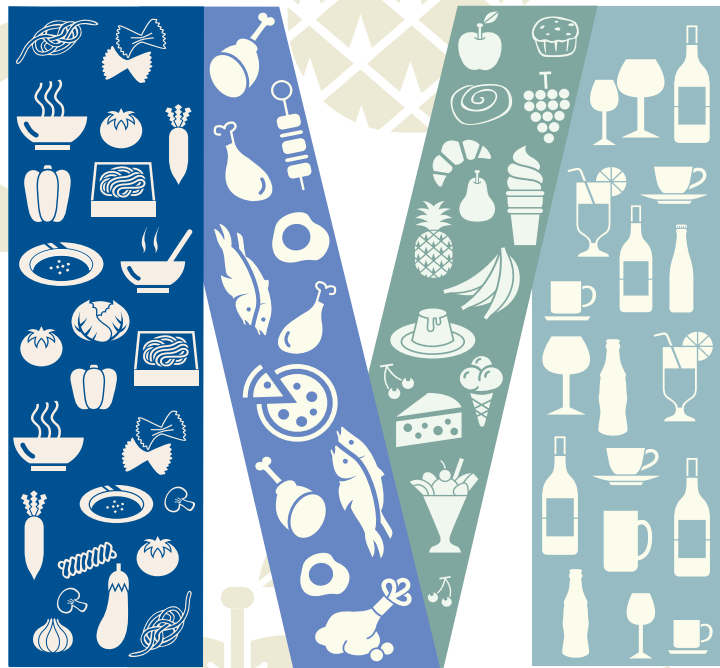
Trobareu aquest símbol en els restaurants col·laboradors.

El plat s'ofereix per dinar i per sopar.