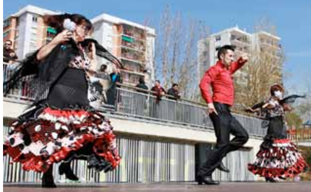
Una actuació del Centre Cultural Luz del Alba durant la celebració del Dia d'Andalusia 2013

El Festival porta cada estiu a la platja d'Ocata la projecció de molts projectes audiovisuals, la majoria curtmetratges.