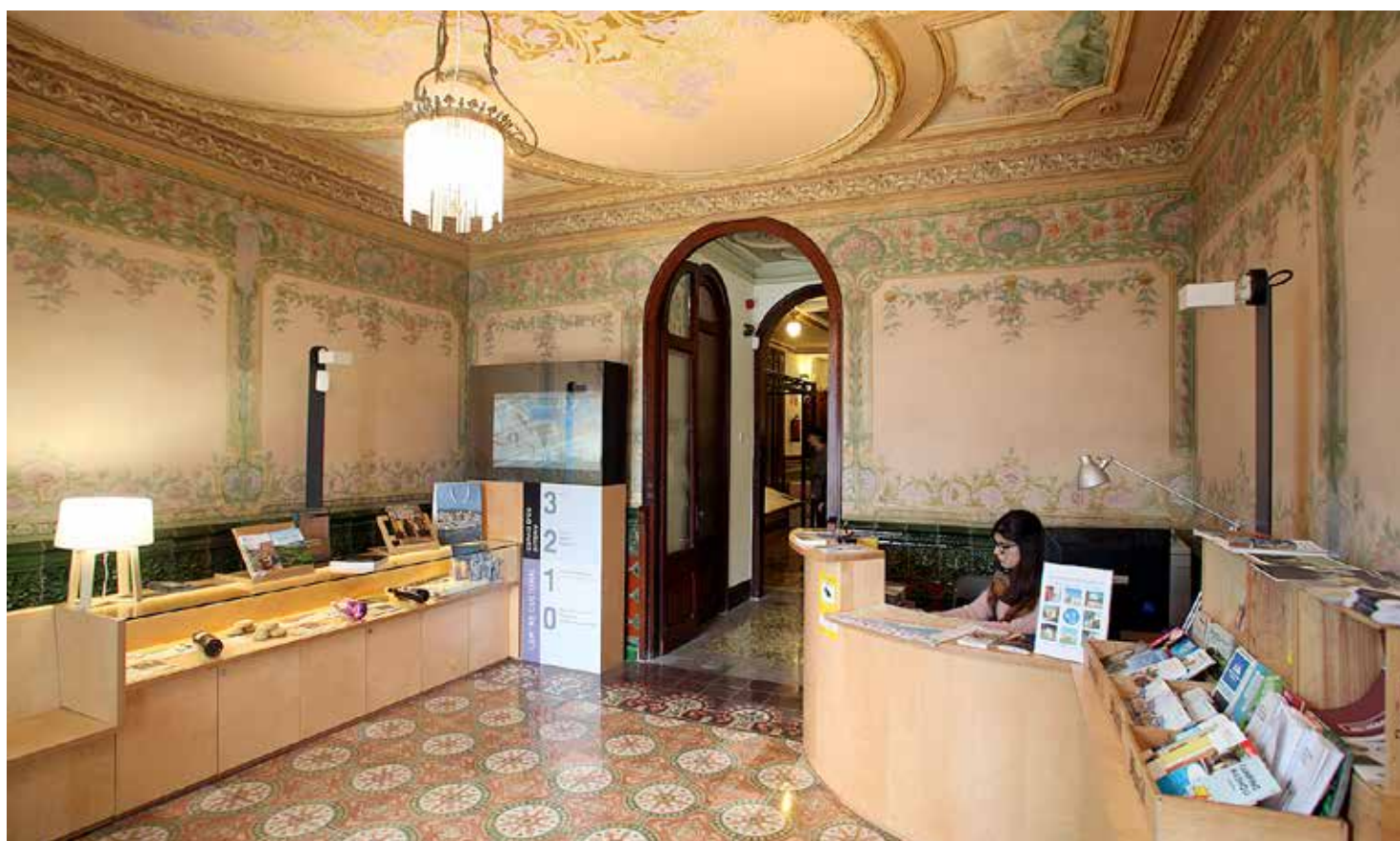
L'Oficina de Turisme està situada a la Casa de Cultura, que va ser reoberta a finals de març del 2015.

L'equipament va rebre 2.300 visites entre els mesos de març i desembre del 2015