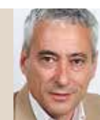
La diagnosi del Pla de Mobilitat Urbana i Sostenible va precedir dues activitats que volen recollir les aportacions de la ciutadania.