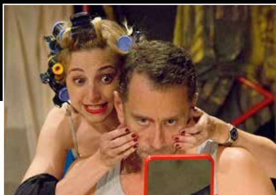
You say tomato.