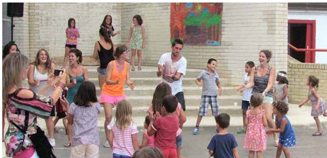
El Fakaló acostuma a finalitzar amb una festa en què les famílies són convidades.

Un Fakaló amb presència destacada de l'esport i de l'art El Fakaló és el programa de lleure