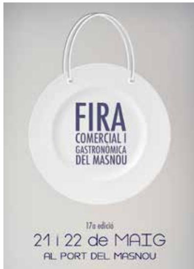
El cartell de promoció de la Fira.

Entre la setantena d'expositors que es preveu que hi participaran, hi ha els alumnes de 5è de l'Escola Ocata, que presentaran la seva cooperativa,