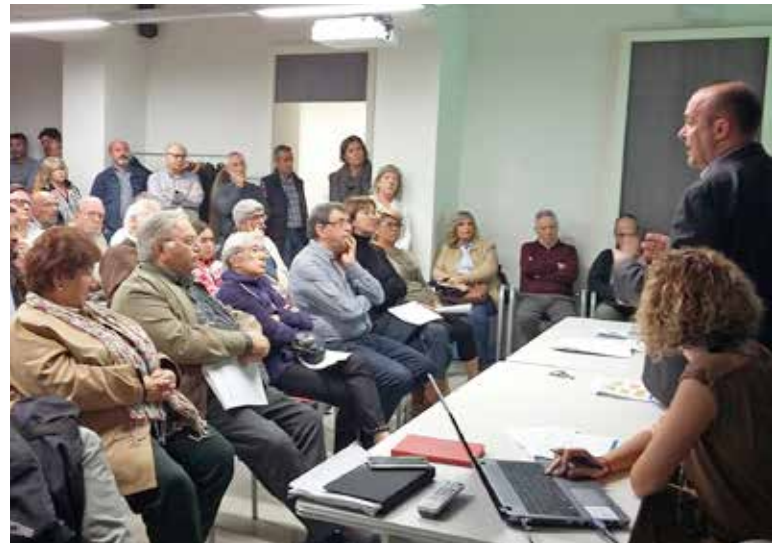
AJUNTAMENT DEL MASNOU