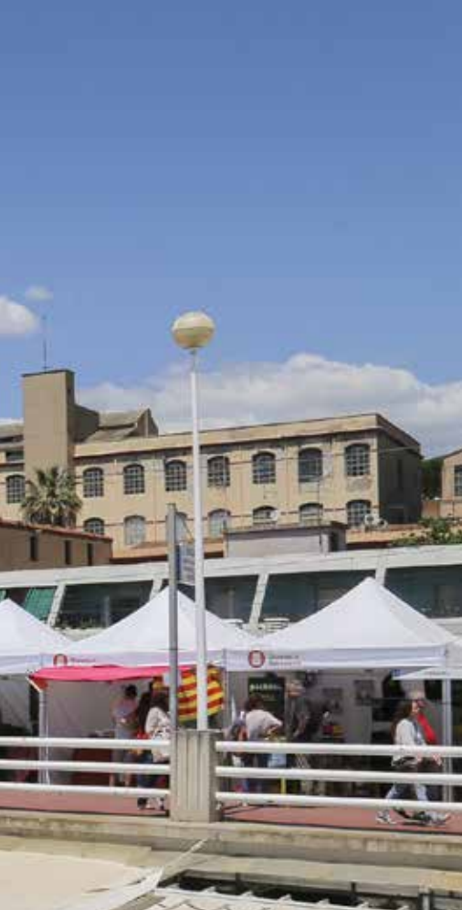
El Port Esportiu s'ha revelat com un espai idoni per a la ubicació de la mostra.

Al Masnou tenim de tot, i aquests espais serveixen perquè tots ens coneguem i siguem conscients dels nostres recursos”.