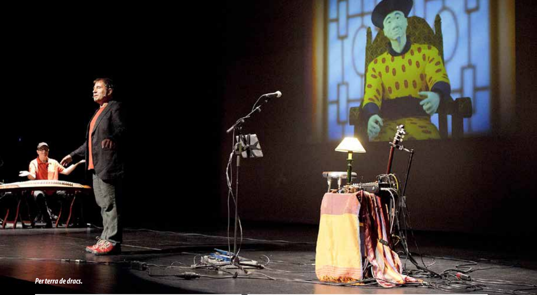
Per terra de dracs.