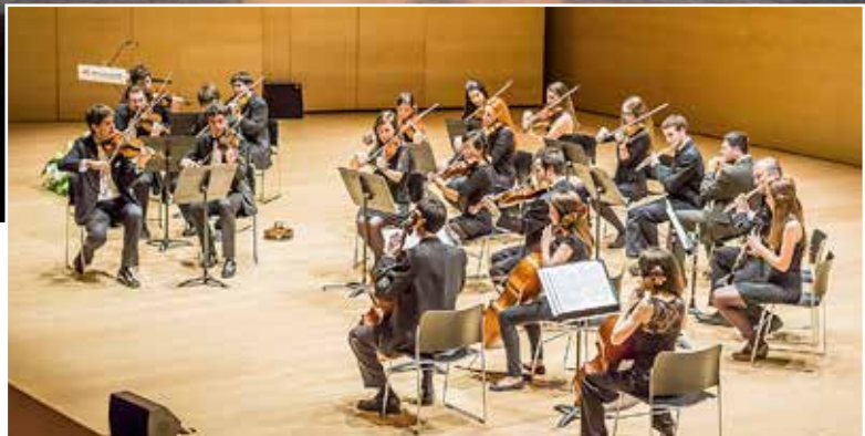
Jove Orquestra de Cambra del Masnou.

del GAT, el cap de setmana del 21 i el 22 de maig, portaran a la sala municipal el muntatge Mitch & Murray ( Èxit a qualsevol preu ), un acostament a les pressions que les empreses exerceixen sobre els seus treballadors en la recerca de resultats positius.