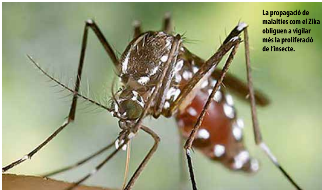
La propagació de malalties com el Zika obliguen a vigilar més la proliferació de l'insecte.

També s'han realitzat nombroses inspeccions, tant als espais municipals com a dins d'habitatges particulars que tenen jardí o pati, i s'ha fet difusió a les empreses i establiments de risc sobre les mesures de prevenció i control. Segons dades del Servei de Control de mosquits del Baix Llobregat, entitat especialista i capdavantera en l'estudi i control del mosquit tigre, el 80 % del punts de cria es troben a dins dels habi-