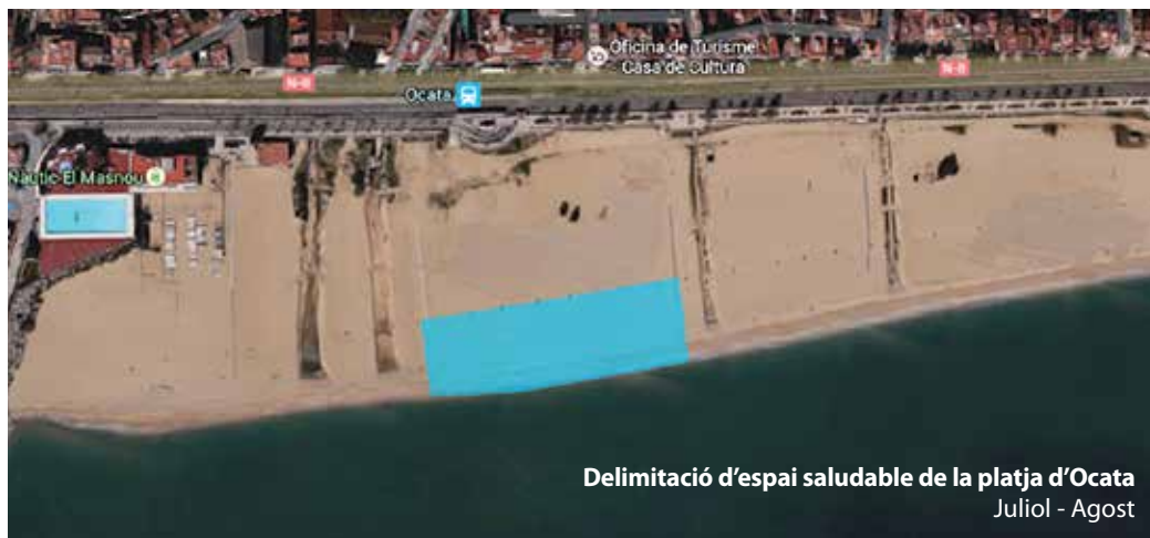
Delimitació d'espai saludable de la platja d'Ocata Juliol - Agost