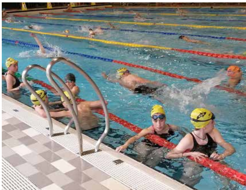
CLUB NATACIÓ EL MASNOU