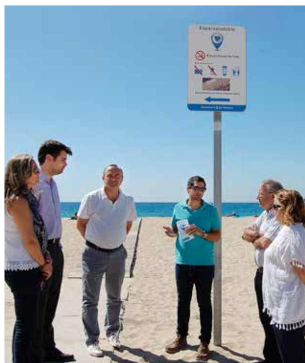
Regidors i regidores, acompanyats de representants dels establiments col·laboradors, van visitar l'Espai Saludable el 15 de juliol.

Entre tots, fem de la platja un espai més saludable