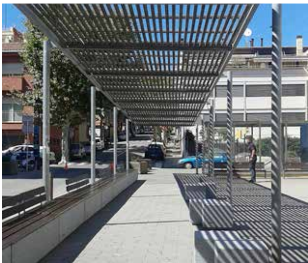
Els nous bancs de la plaça de Marcel·lina de Monteys.

Millorar els espais comuns, renovar la via pública i actuar a les zones d'esbarjo infantil a parcs i places són accions de dignificació dels espais públics que formen part del Pla d'Actuació Municipal. Ens satisfà començar a veure el fruit d'algunes d'aquestes actuacions perquè confiem que milloraran la qualitat de vida de la ciutadania. Alhora, continuem treballant per impulsar altres actuacions en els espais públics en un futur immediat.