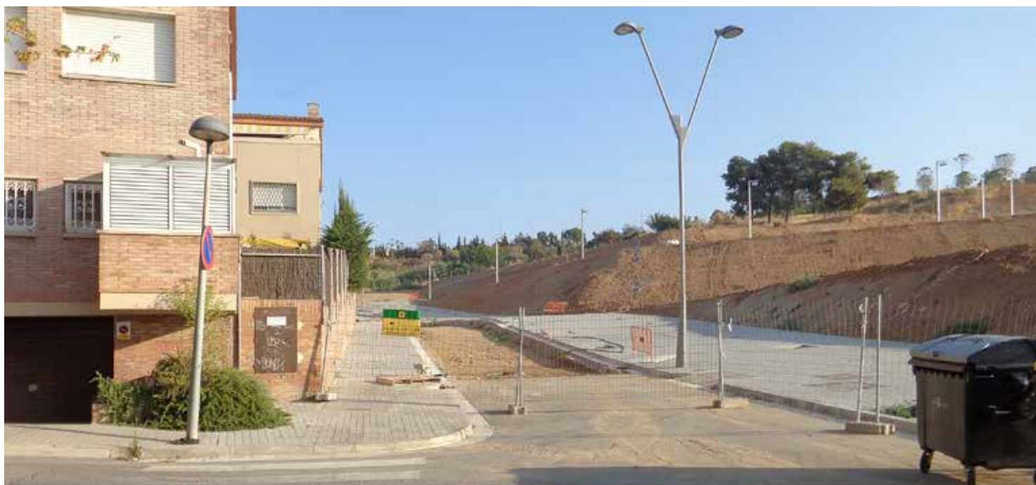
La intervenció al Torrent Vallmora està pressupostada amb més de 326.220 euros.

La urbanització del darrer tram del Torrent Vallmora, la inversió més urgent segons la ciutadania