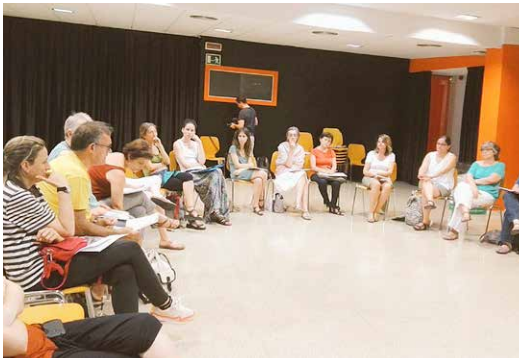
Una de les activitats de l'entitat.

SAÓ es dedica, principalment, a organitzar formació de formadors. Des dels seus inicis, organitza una escola d'estiu anual per a formadores i formadors de persones adultes, i també han fet tallers, seminaris, cursos o jornades. D'altra banda, col·laboren amb ajuntaments oferint serveis de formació bàsica, com ara aprenentatge de llengües, alfabetització, orientació i activitats formatives per a joves i adults.