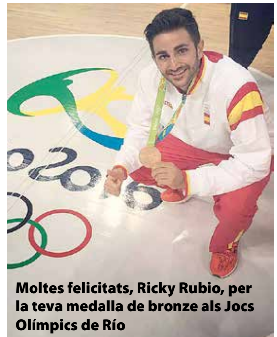
Moltes felicitats, Ricky Rubio, per la teva medalla de bronze als Jocs Olímpics de Río

També s'ha aprofitat per instal·lar-hi nous penjadors: uns a les dutxes, que començaven a rovellar-se, per uns de nous especials de piscina amb tractaments anticorrosió i uns altres a les parets del voltant de la piscina, per tal que els usuaris puguin penjar-hi les tovalloles en lloc de deixar-les al banc, així com al voltant de la piscina petita, on no hi ha bancs i hi mancava espai per deixar les coses a prop. ■