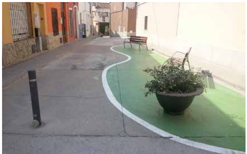
L'espai que han guanyat els vianants a la zona d'Ocata.