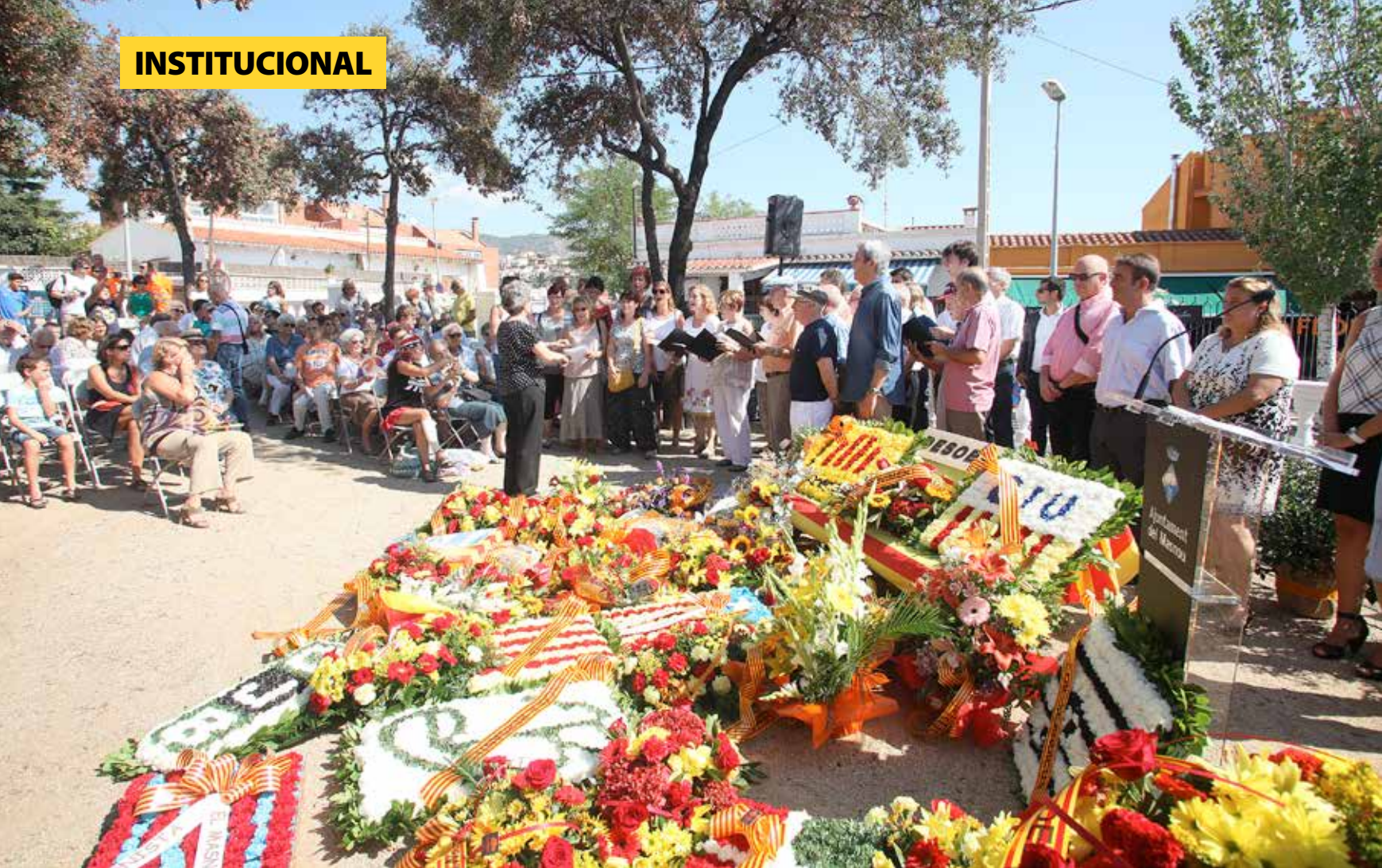
La Coral Xabec de Gent del Masnou, com és habitual en la celebració, va actuar després de l'ofrena floral.