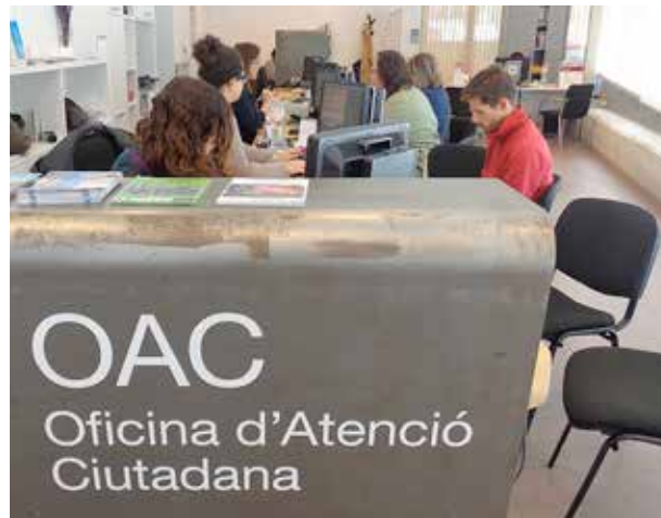
A la imatge, les oficines de l'OAC, que es troben al carrer de Roger de Flor, 23.

El conveni té com a objectiu acordar la col·laboració entre