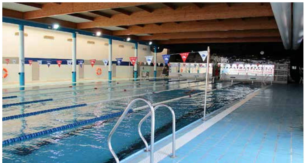
Aspecte actual de la piscina municipal després de les tasques de manteniment d'aquest estiu.

A l'agost, aprofitant que és una feina que s'ha de fer quan no hi ha làmina d'aigua, s'han substituït els miralls que hi havia antics a la piscina, ja que estaven molt afectats per la humitat. Els nous tenen un reforçat anticorrosiu del clor i donen més llum i netedat a l'espai. Aquests treballs permeten mantenir en les condicions idònies el Complex i, especialment, la piscina, un equipament utilitzat diàriament per unes 1.000 persones.