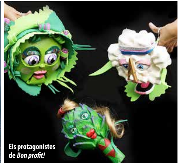
Els protagonistes de Bon profit!