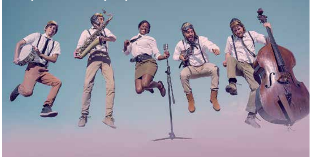
The Swing Air Force actuarà a la Swing Out Night.