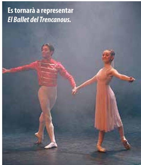
Es tornarà a representar El Ballet del Trencaous .