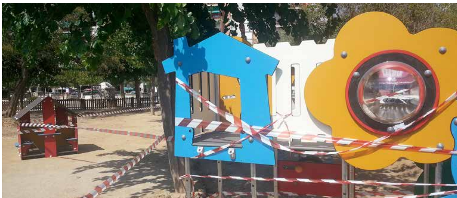
La substitució dels jocs infantils als parcs de la vila va començar el 12 de setembre, a la plaça de Ramón y Cajal.

Aquesta tardor es renoven les àrees de joc infantil de diversos parcs del municipi