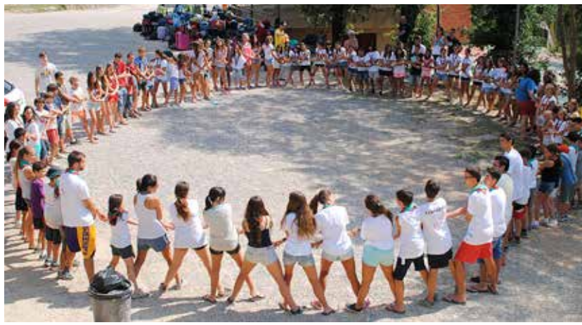
ESPLAI SANT PERE DEL MASNOU