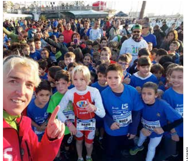
En l'edició del 2015, van arribar a meta 1.900 persones.