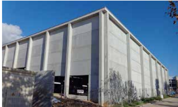
Actualment, ja s'ha executat el 50 % de l'obra.

L' empresa responsable de les obres de construcció del nou pavelló esportiu, Romero Gamero, SAU, va sol·licitar, a finals del mes de novembre, la suspensió dels treballs i que es procedeixi a la resolució del contracte. Romero Gamero va ser l'empresa a qui la Junta de Govern Local de l'Ajuntament va adjudicar el contracte el 12 de març de 2015 per a la construcció del nou equipament i la reforma del pavelló actual, per un import d'1.793.127,16 euros, IVA inclòs.