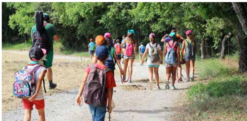
ESPLAI SANT PERE DEL MASNOU

Molts dels nens i nenes de l'esplai continuen després com a monitors.