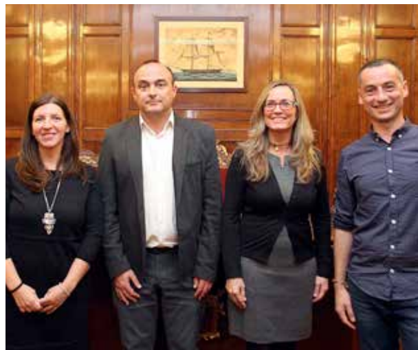
Els autors de la monografia, amb l'alcalde i la regidora al mig.

No era el primer cop que Roig i Rico resultaven guanyadors d'aquesta Beca. La tercera edició va recaure també en ells, donant com a resultat la publicació El cementiri, un museu a l'aire lliure , una obra que va recollir el parc escultòric de l'equipament i que també va incloure l'obra funerària de l'arquitecte Bonaventura Bassegoda i Amigó. Però el cementiri no va ser on va deixar només empremta aquest