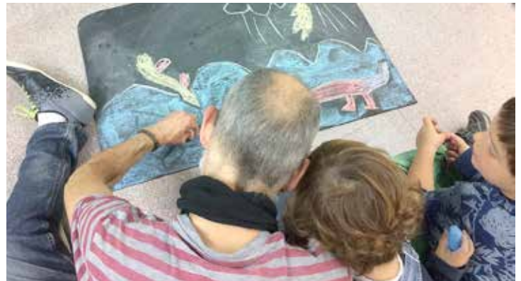
Es van reivindicar i compartir els jocs tradicionals.

D urant aquest mes de novembre, l'Ajuntament i diverses entitats locals han programat un ampli ventall d'activitats per commemorar els dies internacionals per a l'eliminació de la violència vers les dones i el dels drets dels infants amb l'objectiu de conscienciar la ciutadania sobre el rebuig de la violència i la discriminació i sobre els drets dels menors.