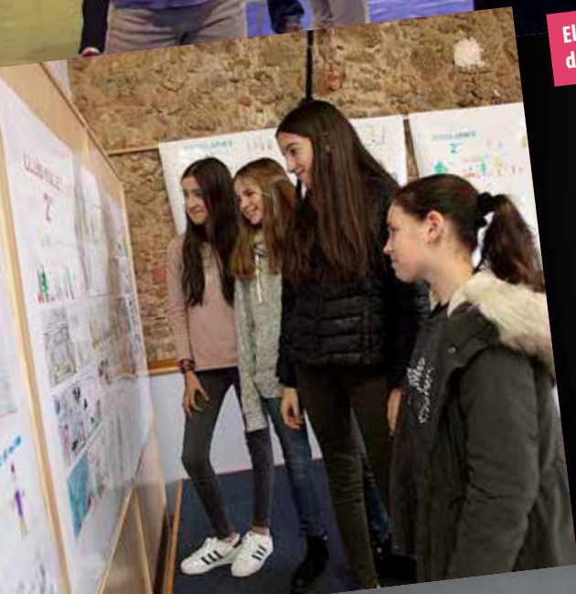
Concert del Cor Scandicus.