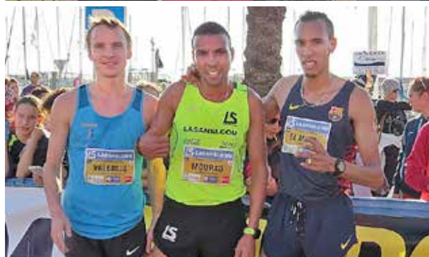
Les guanyadores i els guanyadors d'aquesta edició.

que van assolir la cursa s'apropava als 1.600. La del Masnou és una de les més seguides si es fa una comparativa amb d'altres curses de similars característiques que es realitzen a Catalunya, com la de Riu Ripoll (amb 647 arribats) o la de Riudellots (amb 575 arribats). Entre les curses de Cap d'Any, la Sant Silvestre masnovina es troba, amb 2.100 esportistes, entre les convocatòries catalanes amb més participants, rere les conegudes Cursa dels Nassos de Barcelona i la Sant Silvestre barcelonesa i al mateix nivell de la Sant Silvestre gironina i la cursa de Cap d'Any de Sabadell, unes poblacions de molts més habitants que el municipi masnoví.