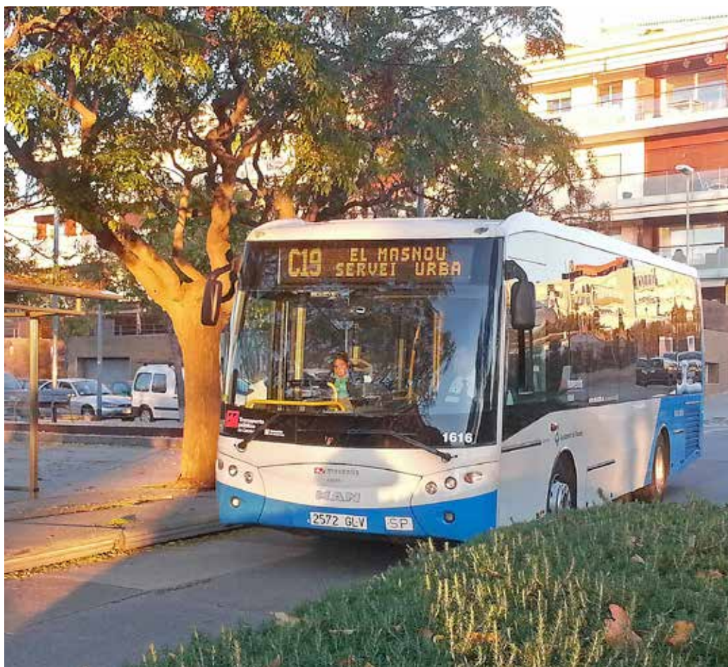
El transport urbà municipal és fonamental per a una mobilitat més sostenible.

Per contribuir a una millor comunicació i mobilitat dintre del municipi, s'ha ampliat, des de l'1 de gener, l'horari del transport urbà municipal, que ha passat a funcionar tots els diumenges i festius de 9 a 22 h.