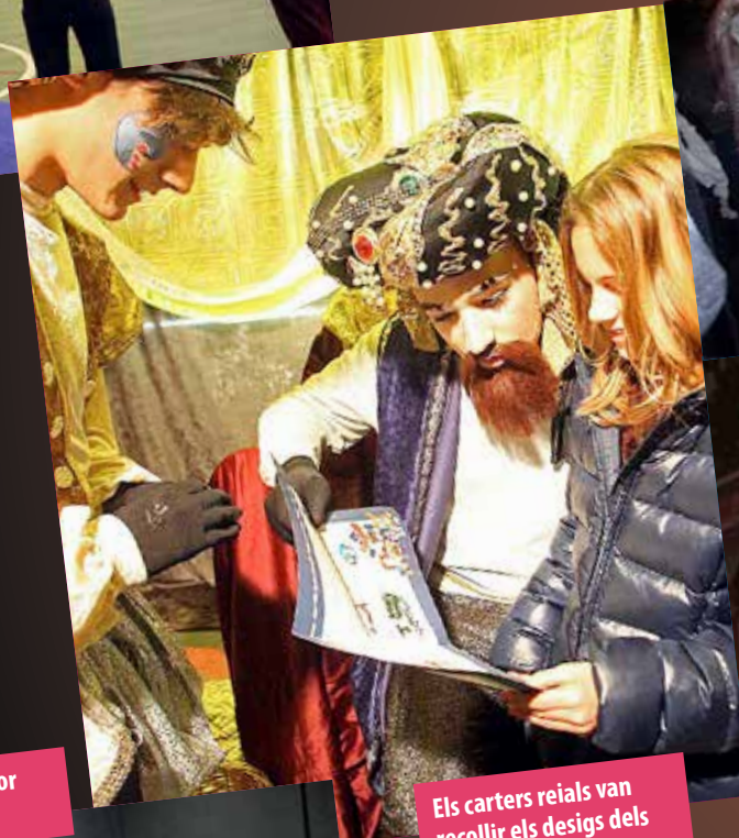
Els carters reials van recollir els desigs dels infants.