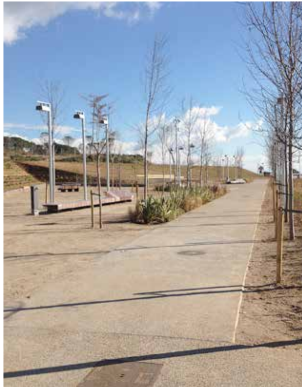
Aspecte dels treballs finalitzats al desembre.

La segona fase del parc, l'execució de la qual es preveu que comenci durant l'any 2017, suposarà una ampliació de la zona urbanitzada de més de 5.500 metres quadrats, amb un pressupost de 474.610,79 euros. En aquesta fase, es crearà un gran parc d'esbarjo infantil i juvenil, amb jocs per a totes les franges d'edat, com grans tobogans, tirolina o zones esportives, entre d'altres. També es farà l'ampliació de l'enjardinament amb arbusts als talussos i la plantació d'arbrat a totes les plataformes, en consonància amb la part executada en la fase anterior. ■