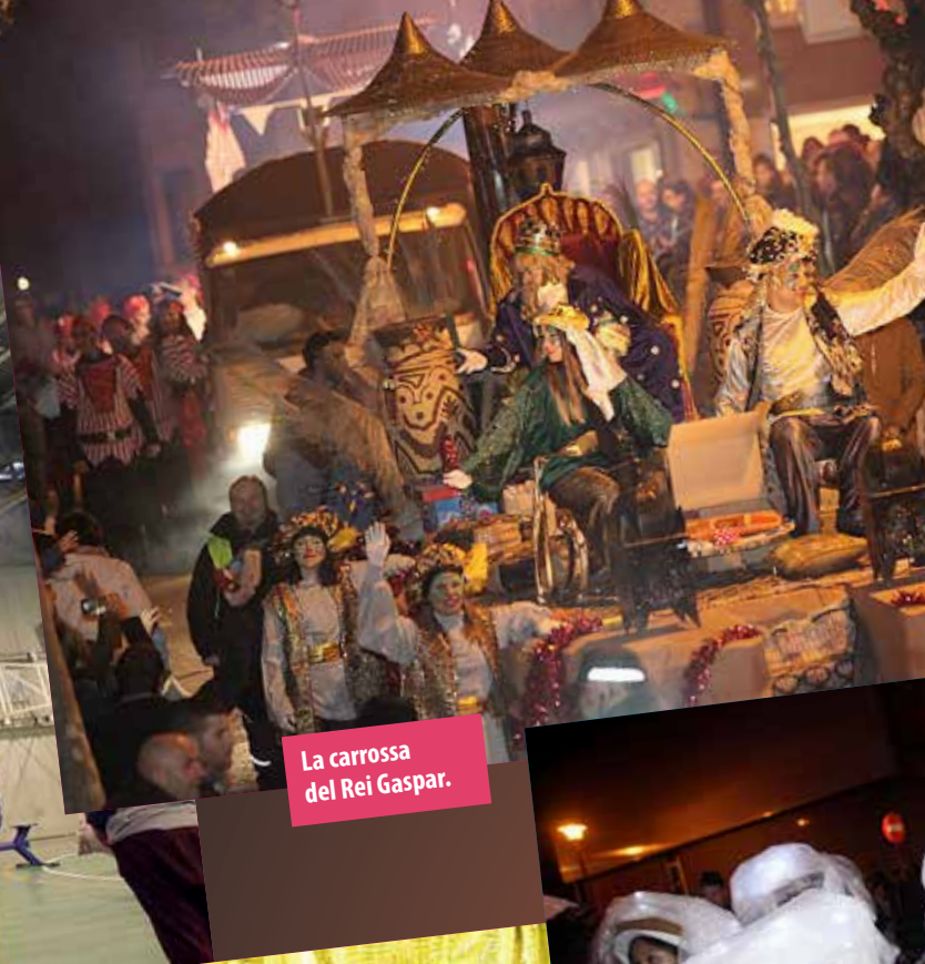
La carrossa del Rei Gaspar.