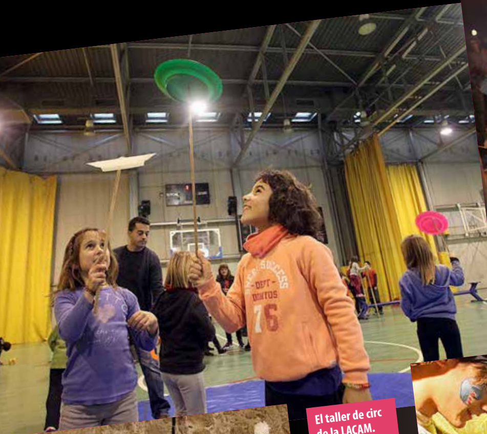
El taller de circ de la LACAM.