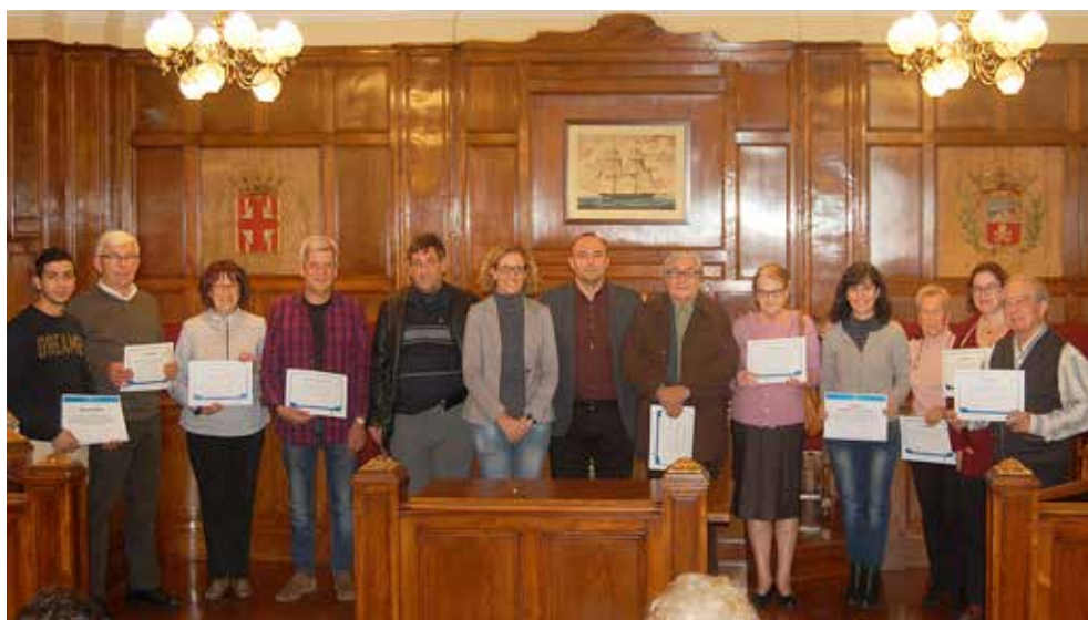
Guanyadors dels vals de 300 euros i del concurs d'aparadors, amb l'alcalde i la regidora.

Una altra de les novetats d'enguany ha estat la creació de la mini sèrie audiovisual Queda't la sèrie, a càrrec de l'Associació Juvenil de Teatre del Masnou (AJTEM). Les vivències d'una família masnovina que decideix quedar-se al Masnou a passar el Nadal ha captat l'atenció del públic, ja que ha assolit les 7.500 visualitzacions. ■