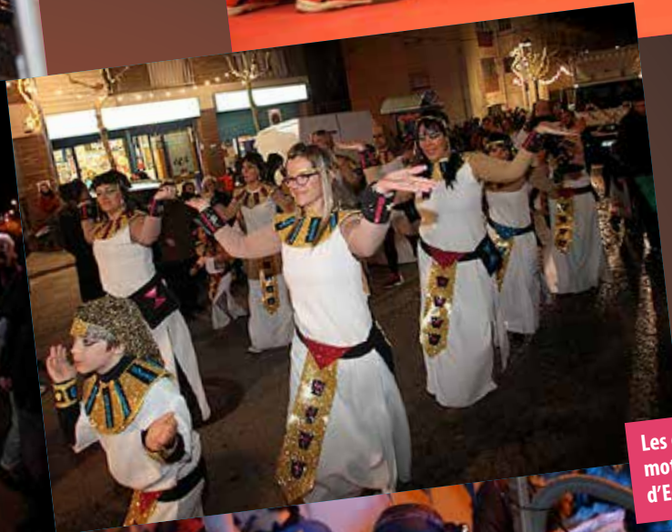
Les entitats van optar per motius diferents, des d'Egipte als Picapedra.