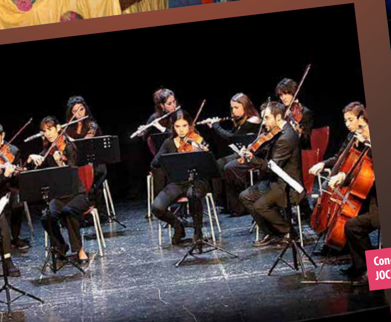
Concert de la JOCEM.