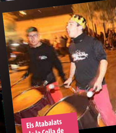
Els Atabalats de la Colla de Diables també hi van ser presents.