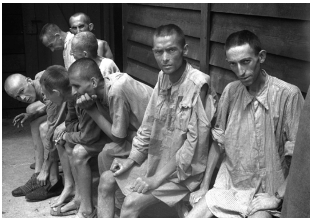
Una de les imatges que es veuran a l'exposició.

Divendres, de 17 a 20 h; dissabtes, d'11 a 14 h i de 17 a 20 h, i diumenges, d'11 a 14 h. Fins al 5 de març.