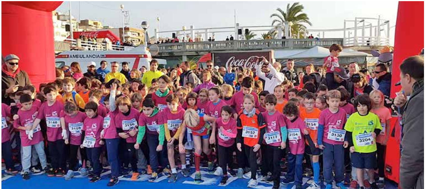
Prop de 300 nens i nenes van prendre part a les curses infantils.

La cursa masnovina és una de les més seguides entre les de característiques similars