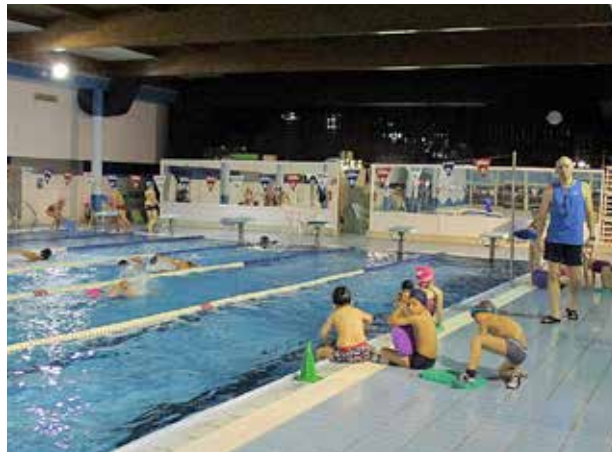
La pista esportiva, la piscina i les diferents instal·lacions de l'equipament municipal.

entitats esportives realitzen els entrenaments de les seves disciplines esportives. Els dilluns, dimecres i divendres es practica el bàsquet i els dimarts i els dijous és el torn del judo, la gimnàstica rítmica i el futbol sala.