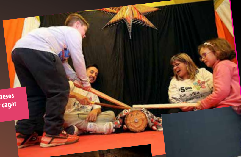
Concert de la coral infantil MARUNESCO.