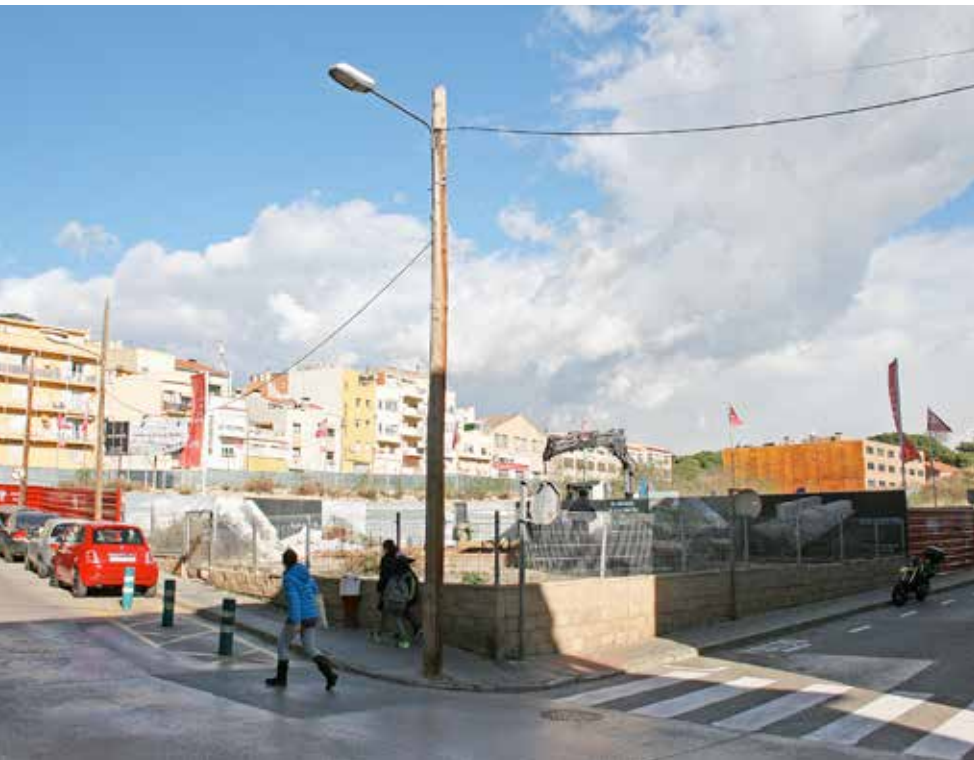
Els terrenys es troben delimitats pels carrers de Roger de Flor, Itàlia, Pintor Domènech Farré i Flos i Calcat.

La creació d'una plaça, amb aparcament públic, comerços i habitatges és clau per al desenvolupament urbanístic del municipi