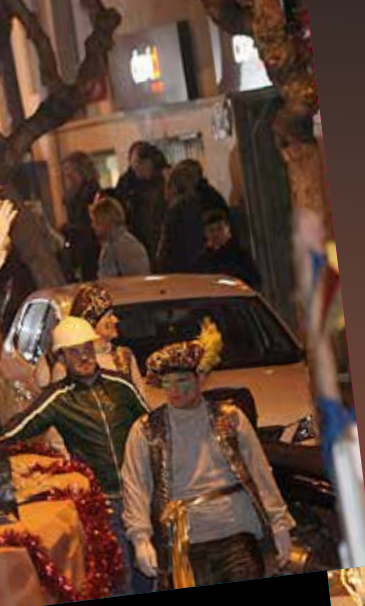
A Els Vienesos es va fer cagar el tió.