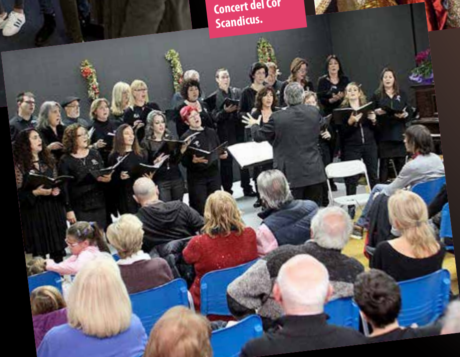
El resultat dels tallers de Ca n'Humet es va exposar.