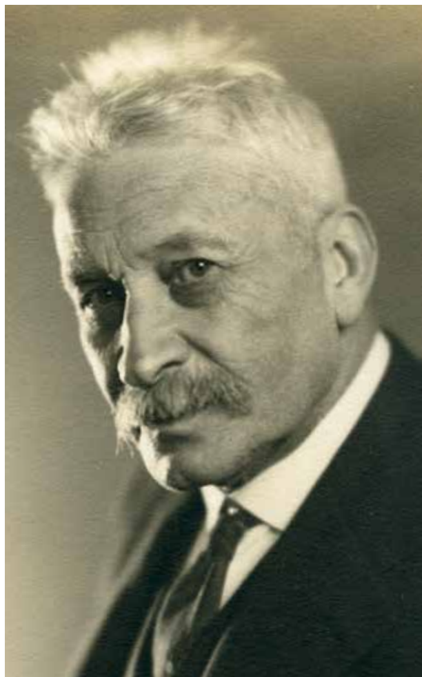
El mestre Lluís Millet va néixer al Masnou al 1867.

La presentació de l'Any Millet es farà a començament del mes de març. Un avançament del programa festiu ja es va viure amb la presentació del veredicte de la VII Beca de recerca local de l'Ajuntament, dedicada a les contribucions de Lluís Millet i que han guanyat Núria Vilà i Maria Villanueva i que s'editarà a finals d'any. Per conèixer la biografia i l'obra del mestre Millet, la Casa de Cultura i el local de Gent del Masnou acollir-