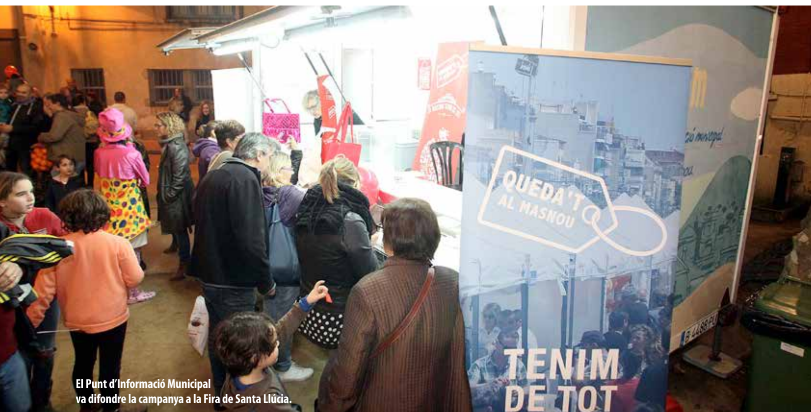
El Punt d'Informació Municipal va difondre la campanya a la Fira de Santa Llúcia.

Durant tot el mes de desembre es van repartir gairebé 3.300 bosses del "Queda't al Masnou"