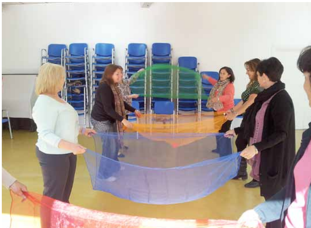
Les activitats que organitza l'entitat serveixen per ajudar a millorar els símptomes provocats per la fibromiàlgia.

Afibromare es va fundar a finals de l'any 2005 –tot i que va ser el 2012 quan es va donar l'empenta decisiva a l'entitat– amb l'objectiu d'informar i donar suport a les persones afectades de fibromiàlgia. En aquest sentit, la seva activitat consisteix a organitzar i realitzar activitats que tinguin com a finalitat la millora de la qualitat de vida de les persones malaltes i de les seves famílies, així com difondre informació sobre les activitats de l'entitat per tal que la ciutadania vagi adquirint el grau de coneixement necessari sobre aquestes malalties.