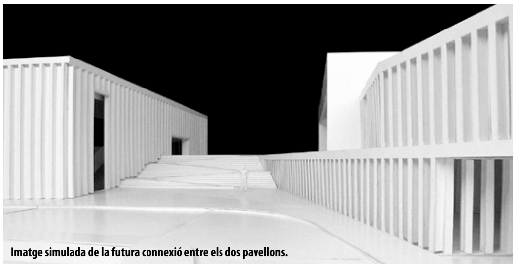
Imatge simulada de la futura connexió entre els dos pavellons.

El nou pavelló ha estat una reivindicació ciutadana des de fa temps i que hauria de suplir les mancances en equipaments esportius que pateix el