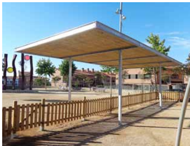
La nova pèrgola ha creat una zona d'ombra a la plaça.

E ls darrers mesos, a la plaça de la República, situada entre els carrers de Joan Llampallas, de Pompeu Fabra i del Capità Salvador Maristany, s'hi han fet obres de millora de l'espai públic, amb la instal·lació d'una pèrgola. La pèrgola instal·lada crea una zona d'ombra en una plaça on, fins ara, era pràcticament impossible trobar-ne. Properament s'hi col·locaran una sèrie de bancs que acabaran de completar la intervenció. Les obres d'instal·lació de la pèrgola van finalitzar a finals del mes de setembre. ■