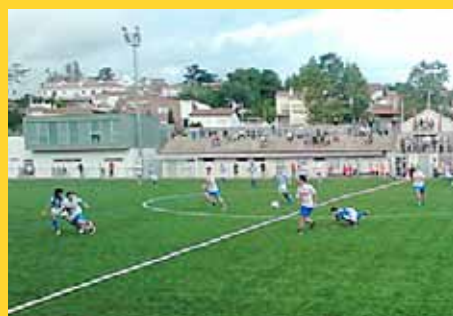
Partit del primer equip disputat l'11 de setembre al camp municipal davant el Figueres.

El CD Masnou torna a Tercera Divisió, quart nivell del futbol espanyol i categoria amb equips del prestigi de l'Europa, el Figueres, el Terrassa, el Cornellà o el Palamós. Ja s'ha estrenat la tretzena temporada del club en aquesta categoria, a la qual torna una temporada després d'haver-la perduda.