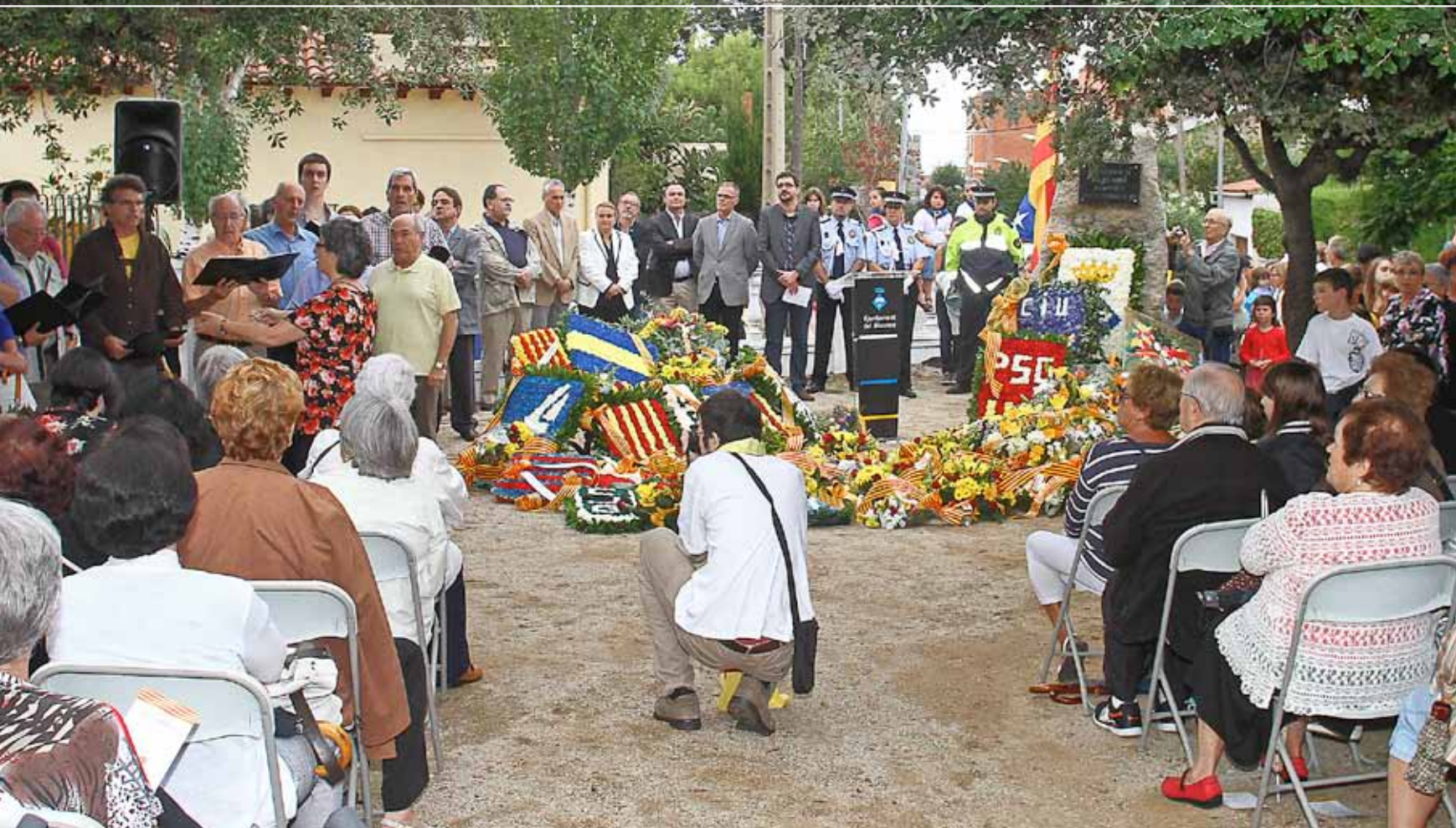
L'ofrena floral a la plaça de l'Onze de Setembre esdevé l'acte central de la celebració institucional.