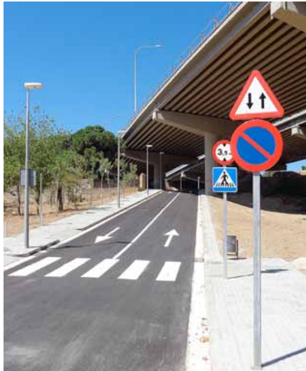
La construcció d'una vorera, la instal·lació de columnes d'enllumenat, l'asfaltatge del vial i la senyalització són les obres més visibles.

En el transcurs de l'obra, el tècnic responsable del seguiment de la Diputació de Barcelona, que és l'administració que té les competències sobre l'avinguda de Cusí i Furtunet, va condicionar l'obertura del carrer a la prohibició de fer el gir a l'esquerra, tant per als vehicles que es