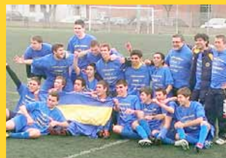
L'equip del juvenil A celebrant el campionat de la passada lliga.

L'equip juvenil A de l'Atlètic del Masnou inicia la temporada amb el repte de repetir l'excel·lent temporada anterior, en què va ser guardonat per la Federació Catalana de Futbol com a millor equip juvenil de Catalunya de Segona Divisió.