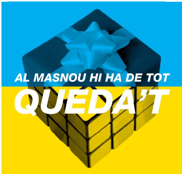
Una de les imatges de la campanya "Queda't" d'enguany.

Del 6 al 31 de desembre, per compres superiors a 50 euros, es rebrà una bossa de disseny i es participarà en el sorteig de 10 vals de regal de 300 euros