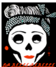
Logotip del projecte guanyador.

El jurat ha valorat la viabilitat dels projectes