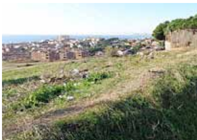
Els terrenys on s'ha començat la plantada.

L'actuació que s'ha posat en marxa ens permet avançar i anticipar la construcció del futur parc de Vallmora. Com que el projecte aprovat, amb un import de dos milions d'euros, destina gran part dels diners a obra civil, com el moviment de terres o la urbanització del torrent Vallmora, calia una acció per tal de donar caràcter de parc a la zona que tenim actualment, mancada de vegetació. D'altra banda, volíem fer partícips d'aquesta plantada, la més important que ha vist mai la nostra vila, els nostres infants i joves, com a mostra del paper preponderant que han de tenir en el desenvolupament futur de la nostra societat.