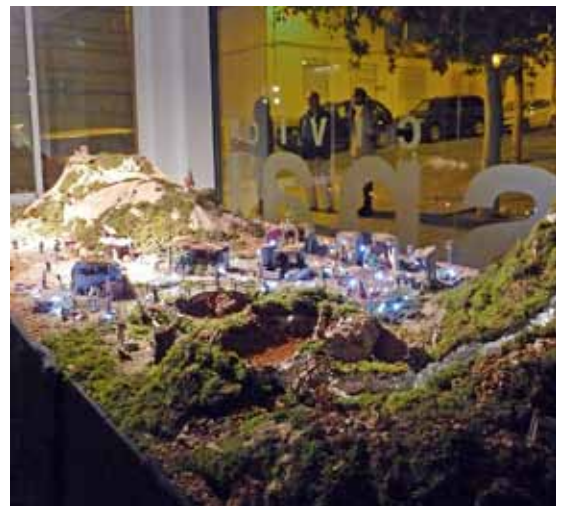
Pessebre que es va poder veure a Els Vienesos l'any passat.

El 21 de desembre, a partir de les 17 h, l'equipament obrirà portes perquè els nens i nenes puguin recollir els seus regals, després de picar ben fort i cantar la cançó del tió. A les 18 h, es picarà el tió; a les 18.30 h, es podrà berenar amb una xocolatada; i, a les 19 h, la Coral infantil de l'Associació UNESCO El Masnou oferirà un concert. ■