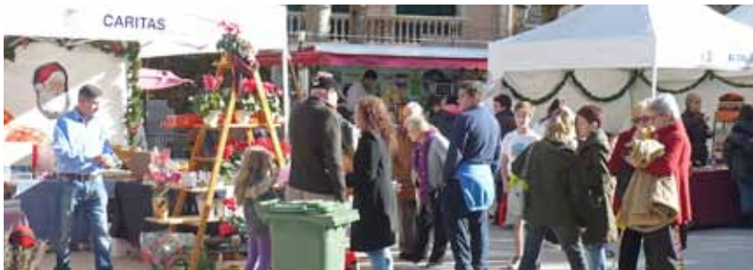
El pati del Casino sempre és a punt per acollir aquesta tradicional fira.

A rbres de Nadal, tions, pessebres, molsa, elements decoratius per a l'arbre, caganers, llums, figuretes, productes d'alimentació, productes per arribar a aquestes festes relaxats i amb ganes de gresca, joguines, caramels i tot allò que es necessita per a gaudir en aquestes festes nadalenques, es podrà trobar del 6 al 8 de desembre, de 10 a 14 h i de 17 a 21 h al pati del