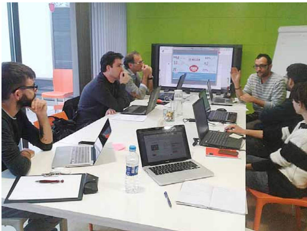
ASSOCIACIÓ COWORKING MARESME