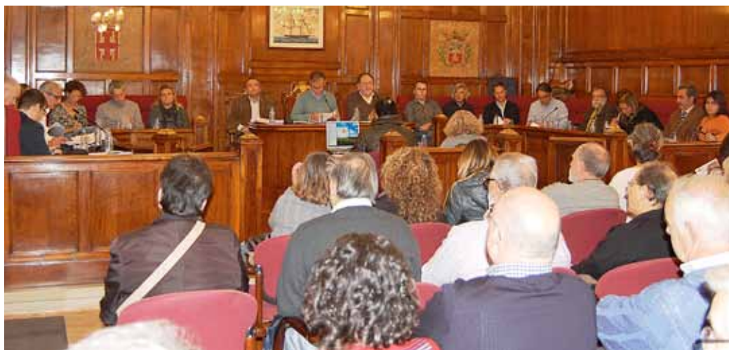
La Sala Consistorial es va omplir de públic per assistir al debat, el 21 de novembre.

Segons l'Equip de Govern, la publicació de les ordenances pot condicionar l'executivitat d'algunes de les taxes aprovades