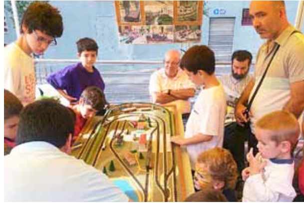
Totes les entitats van tenir un paper cabdal al llarg de la jornada.

Al migdia, per fer una pausa i agafar forces, es va fer una paellada popular a càrrec de la Colla de Diablers i hi van menjar més de seixanta persones.