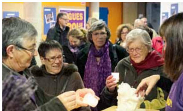
L'encesa d'espelmes sempre té una bona resposta.