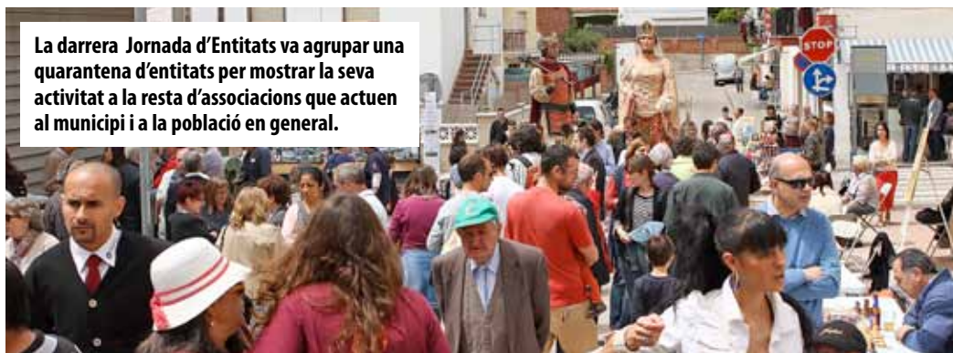
La darrera Jornada d'Entitats va agrupar una quarantena d'entitats per mostrar la seva activitat a la resta d'associacions que actuen al municipi i a la població en general.

Com que el principal objectiu de la regidoria és promoure la participació de la ciutadania, la informació és un exercici clau de la seva activitat, així com la formació dels membres de les entitats i associacions. En aquest sentit, s'organitzen cursos i tallers perquè els associats aprenguin alguns aspectes importants per a la gestió de les entitats, com ara la sol·licitud de subvencions o la comunicació i la projecció al seu entorn. Normalment, es fan cinc tallers per any que no només s'adrecen a les entitats, sinó que són oberts a qualsevol persona que hi es-