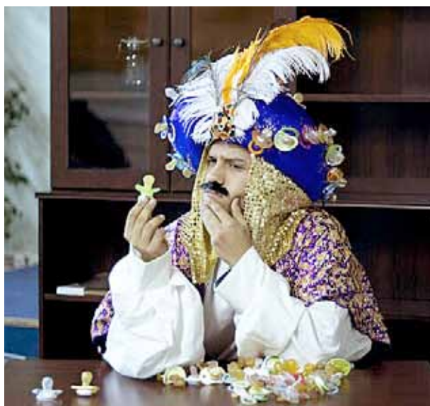
El patge Xumet recollirà els xumets dels més valents.

Un dies abans, els carters reials seran a diferents punts del municipi per recollir totes les cartes i els desitjos dels nens i nenes que s'hi apropin. El dia 2 de gener, a partir de les 17 h, seran a Els Vienesos i, els dies 3 i 4 de gener, de 10 a 13 h seran al Mercat Municipal i, a les 18 h, a la plaça d'Ocata. A més, es realitzaran