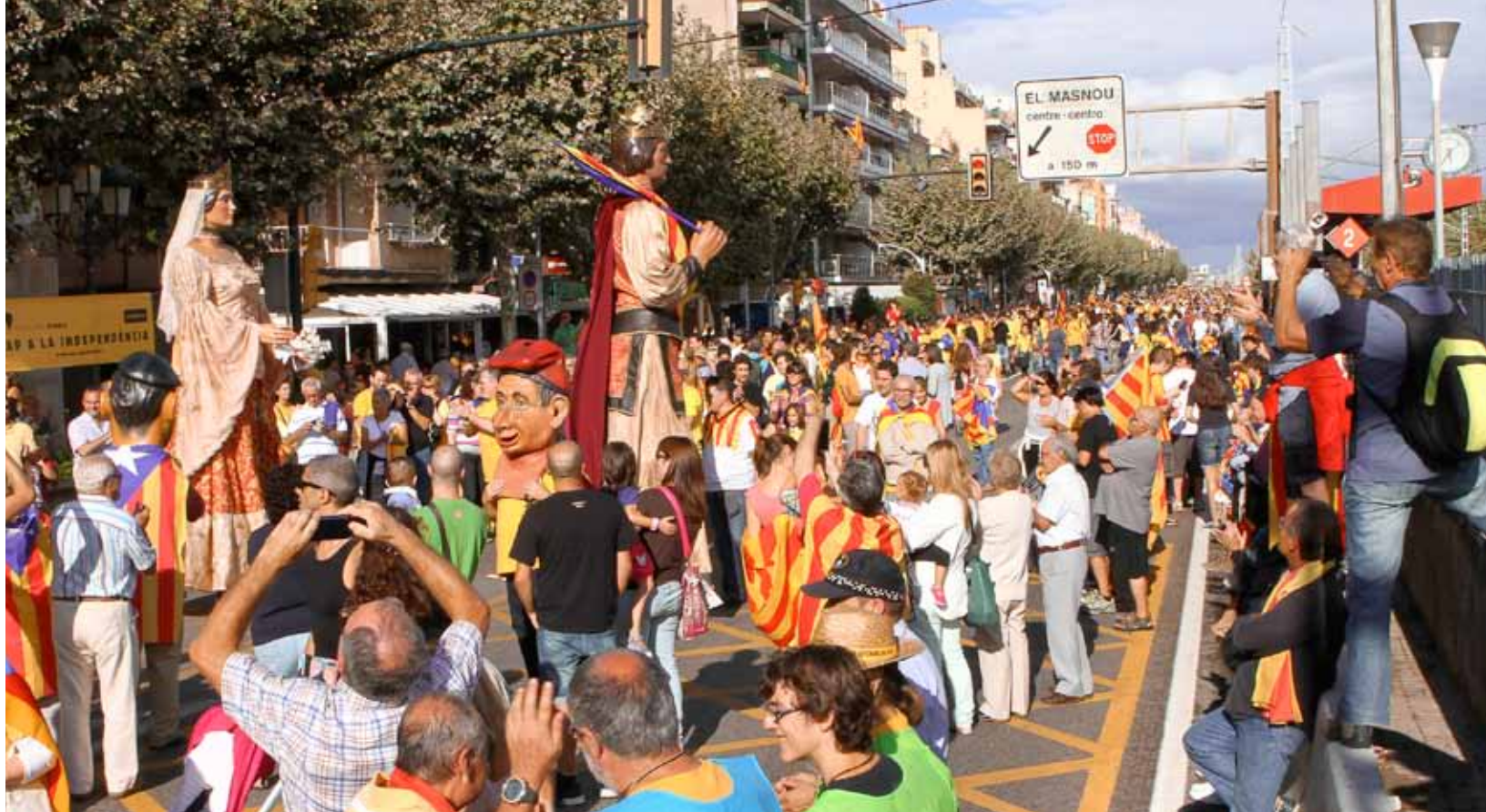
La Via Catalana va ser un dels esdeveniments més destacats de la celebració de la Diada del 2013.