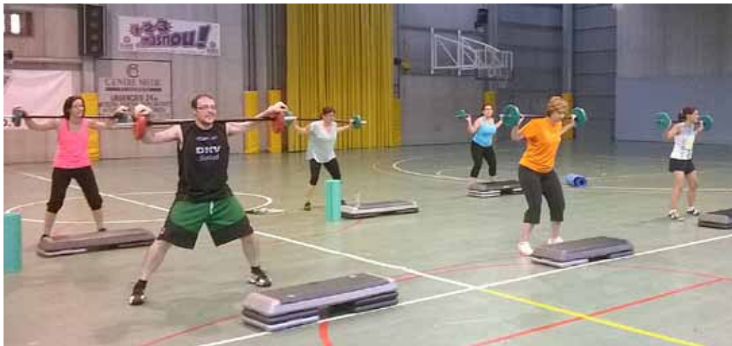
L'oferta d'activitats físiques per a persones adultes, que inclou pilates, aeròbic i, des de fa un any, body tono , es complementa amb la resta d'activitats aquàtiques ofertes des del Complex.

Augmenta l'oferta de body tono , amb una sessió matinal d'aquesta disciplina que combina la gimnàstica aeròbica amb exercicis de musculació