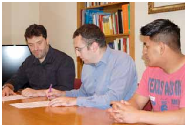
Moment de la signatura del contracte de lloguer.

El programa de la Borsa de Mediació per al Lloguer Social és un servei totalment gratuït que ofereix l'Ajuntament a través de l'Oficina Local d'Habitatge, que pretén mobilitzar els pisos desocupats a preus assequibles. Els principals avantatges per als propietaris que decideixen deixar el seu pis a la Borsa són, a part de la mediació de conflictes durant