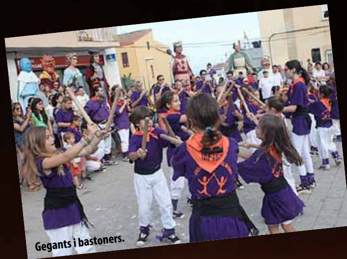
Gegants i bastoners.

Els dos festivals musicals, organitzats al parc de La Nimfa, i el campionat d' skate , celebrat a la plaça d' skate de Pau Casals, van aplegar un gran nombre de joves de la vila durant el cap de setmana. D'altres activitats complementàries celebrades prèviament a la Festa Major Jove van ser la dels carrers engalanats i la Jornada J de Jocs.