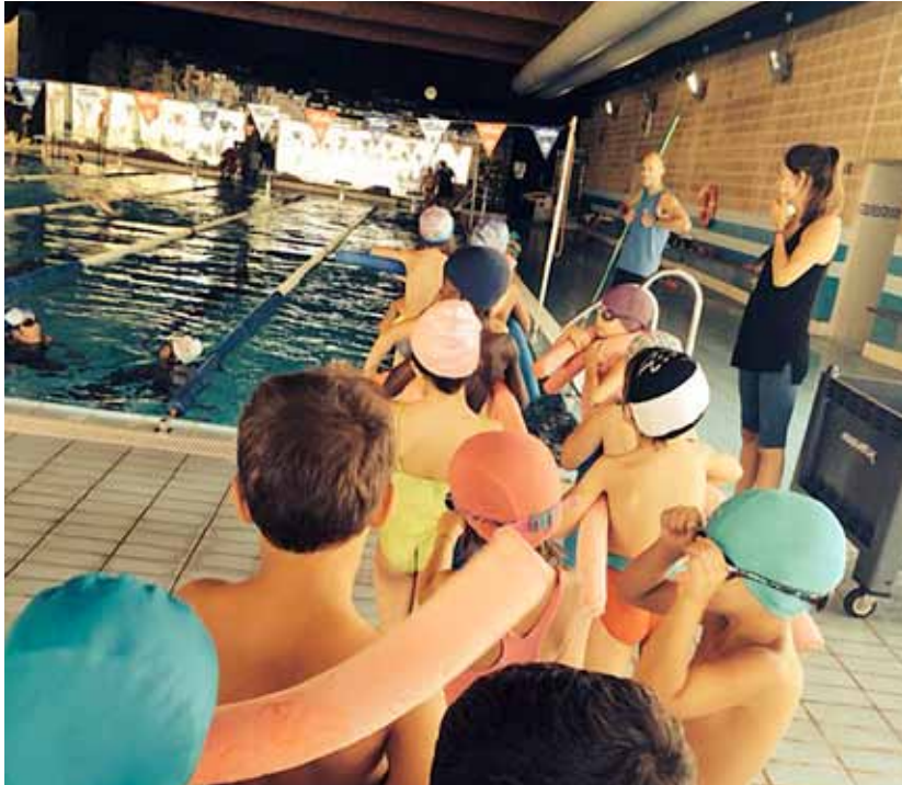
Els infants del Casal han comptat setmanalment amb l'activitat de piscina al Complex.

El Casal i el Campus continuen sent una referència per a l'oci de les vacances