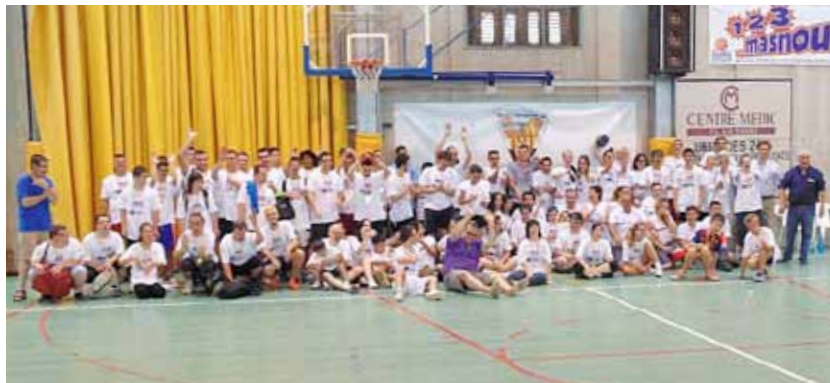
El torneig va comptar amb més d'una seixantena de participants, dels quals més de la meitat eren persones amb síndrome de Down.

El club promou la tercera diada de futbol sala de caràcter solidari amb Down Catalunya, que va repetir l'èxit dels anys anteriors.