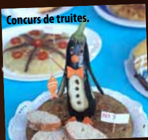
Concurs de truites.