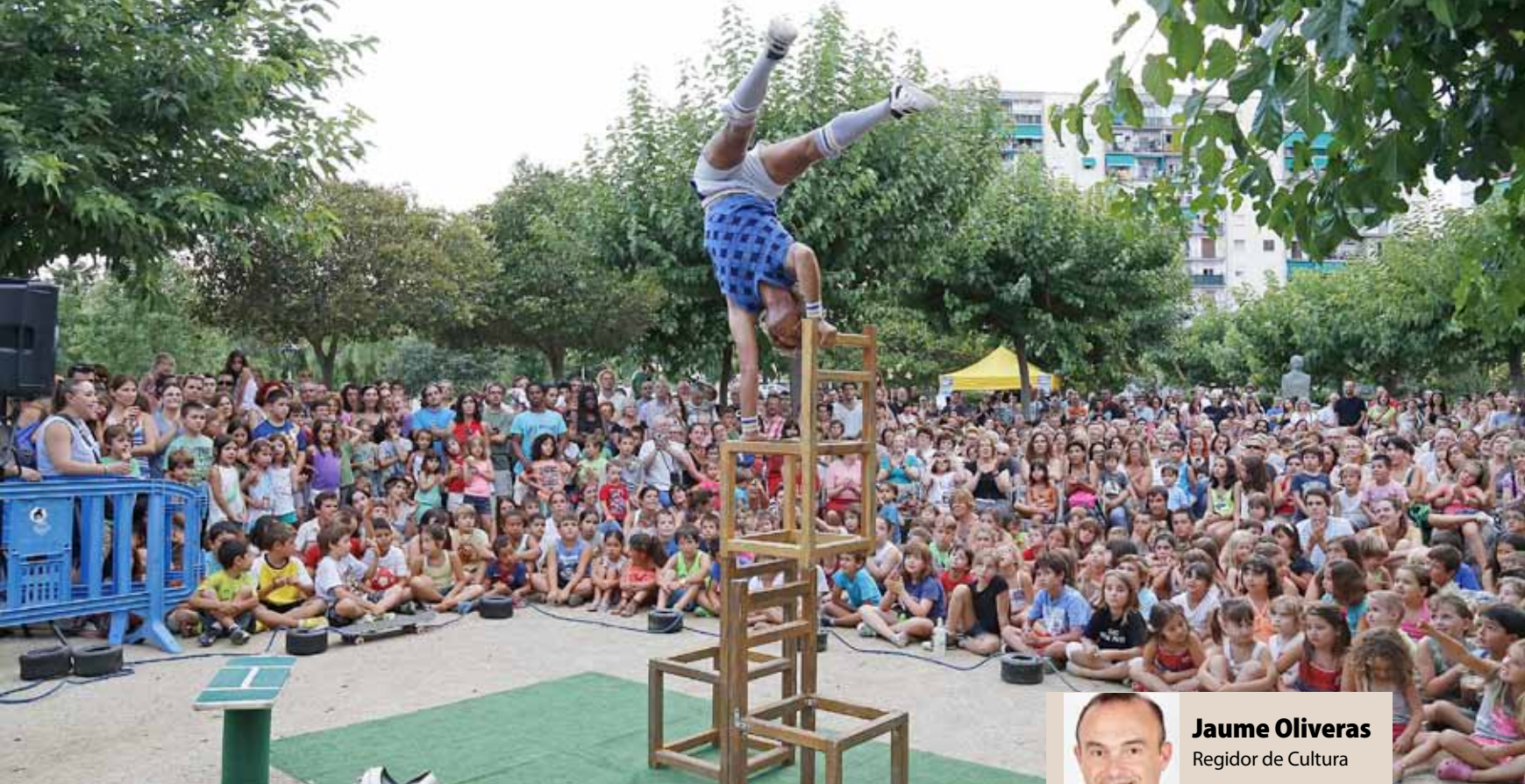
La plaça de Ramón y Cajal es va omplir de gom a agom per a l'actuació de La Mano Jueves.