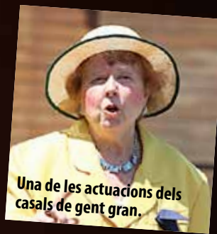
Una de les actuacions dels casals de gent gran.