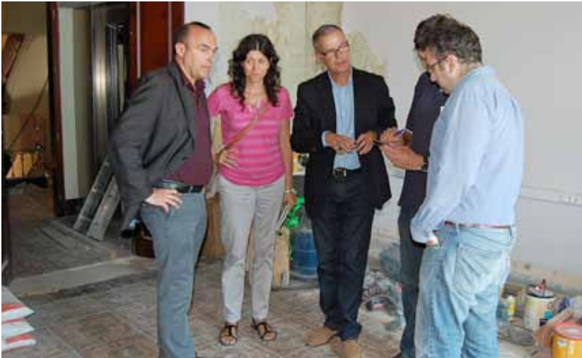
El 8 de juliol es va fer una visita d'obres a l'equipament.

La rehabilitació de l'immoble és l'actuació més destacada del projecte "Terra de Mar"