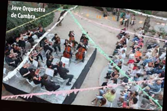
Jove Orquestra de Cambra.