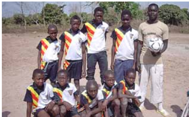
Els infants de Sare Bigi, a Gàmbia, amb l'equipament de l'entitat.

E l 5 de juliol, el club de futbol sala del municipi El Masnou Interdinàmic va tancar la temporada amb la tercera diada de futbol sala amb Down Catalunya, una jornada de caràcter solidari que va tenir el Complex Esportiu Municipal com a escenari. El torneig va comptar amb més d'una seixantena de participants, dels quals més de la meitat eren persones amb síndrome de Down de totes les edats, i va cloure amb una remullada a la piscina de l'equipament municipal. L'entitat vol donar les gràcies a totes les persones que van fer possible que aquesta jornada es tornés a repetir l'èxit dels anys anteriors.