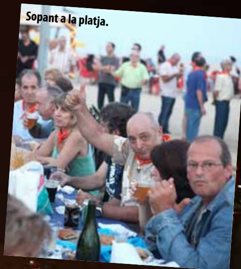
Sopant a la platja.