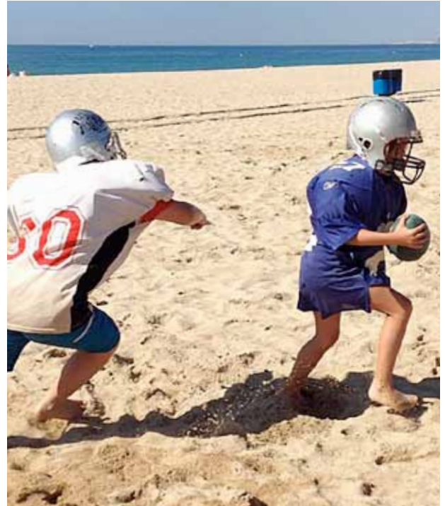
Esports com el rugby també han tingut cabuda al Campus.

E l Casal infantil i el Campus esportiu, emmarcats dins l'oferta d'activitats lúdiques d'estiu del programa Fakaló, continuen sent el referent per cobrir el temps d'oci dels infants i els joves de la vila.