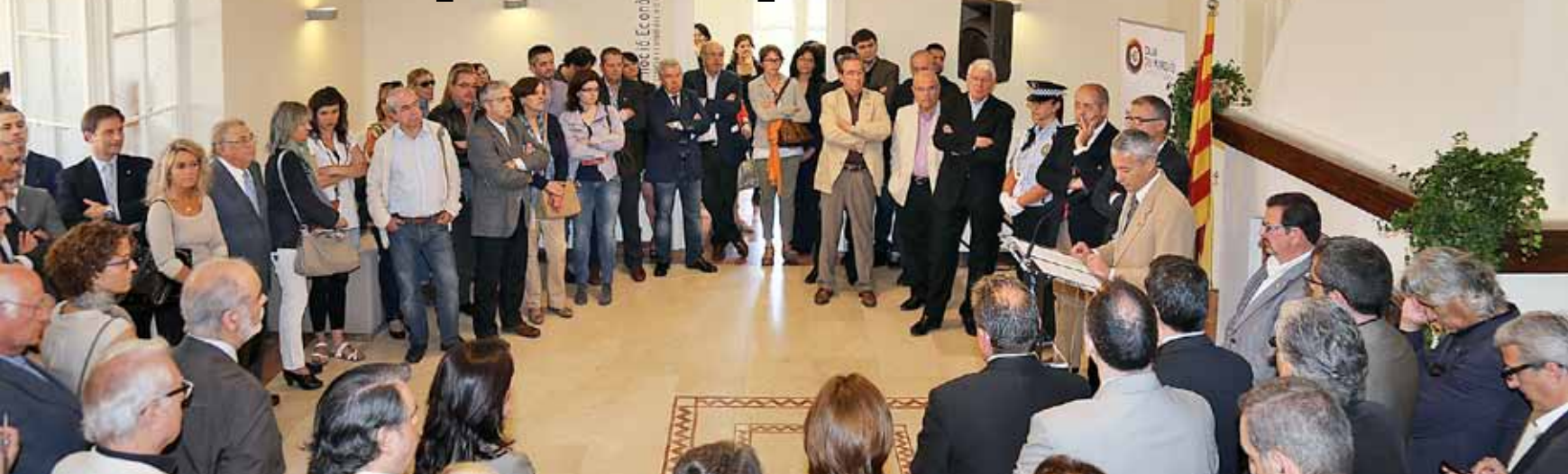
La inauguració, el 31 de maig, va marcar el tret de sortida de l'equipament.