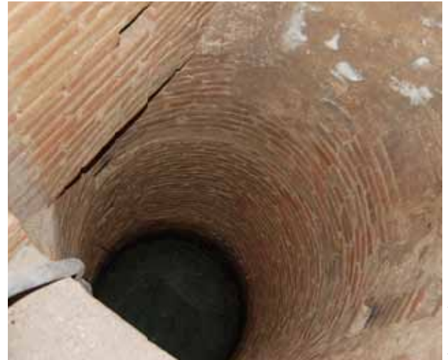
Les troballes arquitectòniques confirmen la riquesa patrimonial de l'espai.

L es obres de rehabilitació i restauració que s'estan duent a terme a la Casa de Cultura han tret a la llum, com acostuma a passar a les intervencions similars a aquesta, alguns elements arquitectònics i de disseny que constaten el valor patrimonial de l'immoble. A la planta baixa, s'ha trobat un pou a l'espai que originàriament s'havia dedicat a la cuina, i que torna a demostrar la riquesa de la xarxa de canals d'aigua subterrània de la vila. Altres troballes d'especial valor s'han produït a la sala de música i a la sala on es troba el cos de l'escala, on s'ha descobert un paviment de rajoles modernistes en bon estat de conservació. Les rajoles, que han aparegut després de retirar el terra que s'hi havia posat als anys setanta, s'han extret una a una per garantir la conservació del terra hidràulic i per netejar-les, numerar-les i comprovar-ne la qualitat.