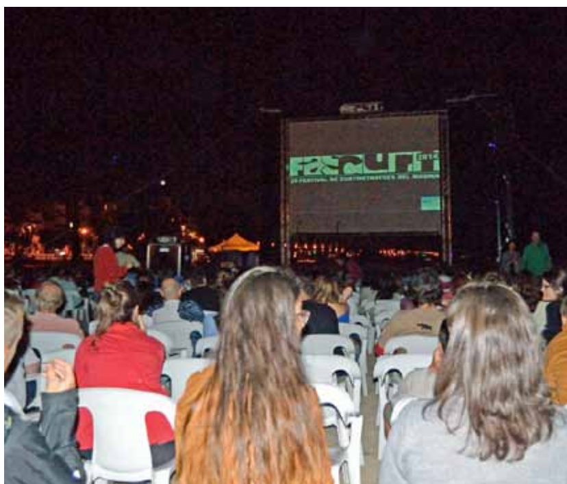
La proposta del festival sempre té molta bona acollida.

El Fascurt torna a ser una de les cites més interessants de l'estiu a la vila