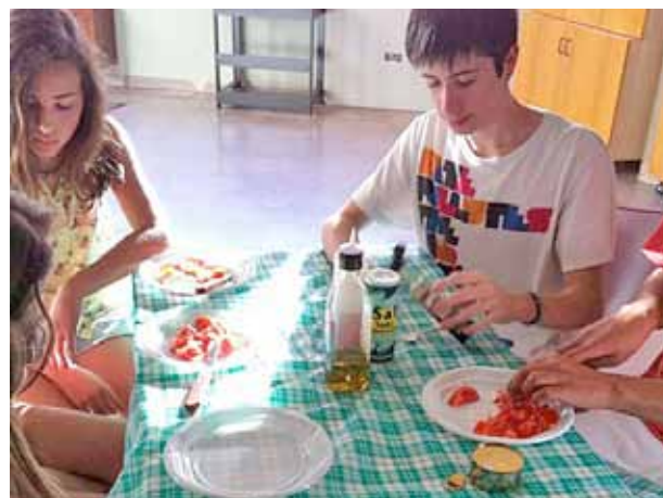
Joves preparant un dels plats que proposava el taller.

La resposta a la convocatòria, en què van participar 15 joves, de 14 a 19 anys, de les poblacions del Masnou i Alella, torna a demostrar l'interès que suscita la possibilitat d'aprendre a cuinar d'una manera sana i equilibrada, independentment de les persones adultes. La Regidoria de Joventut confia a tornar a oferir el taller el curs vinent, però mentrestant, dins la programació d'activitats d'estiu per a joves portats a terme a Ca n'Humet, s'han ofert dos tallers més de cuina, que tenen el màxim de participants. ■