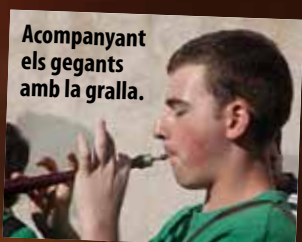
Acompanyant els gegants amb la gralla.