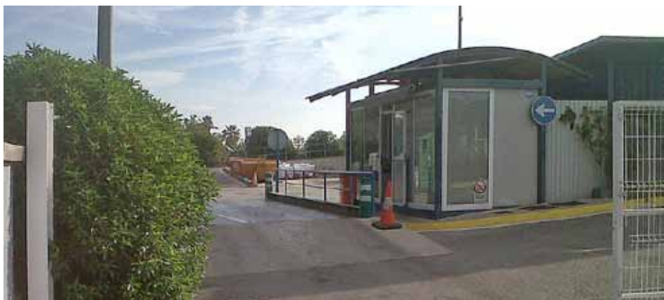
L'equipament del Masnou, Alella i Teià estarà tancat des de començament de gener fins al maig.