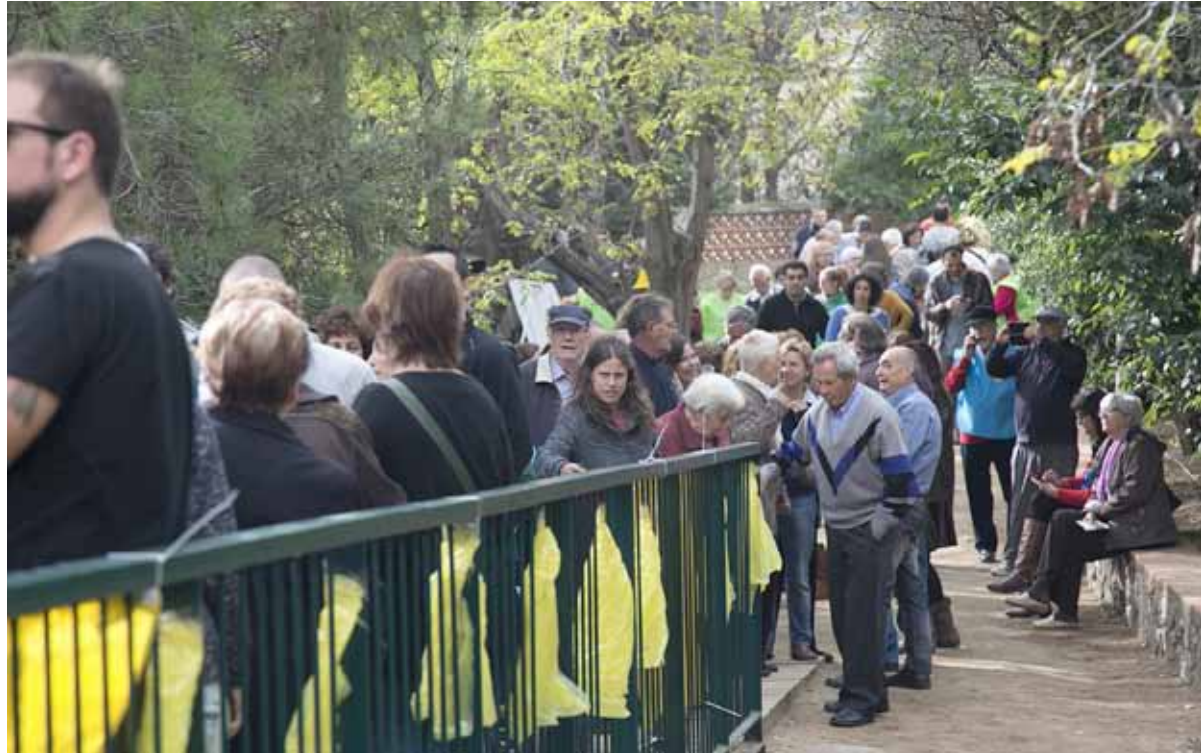
Als centres de votació es van formar cues durant la jornada. A la imatge, l'accés a l'Institut Maremar.

nia va comptar amb la presència de diversos observadors internacionals. Durant tota la jornada, i els dies previs, l'Ajuntament va donar suport al