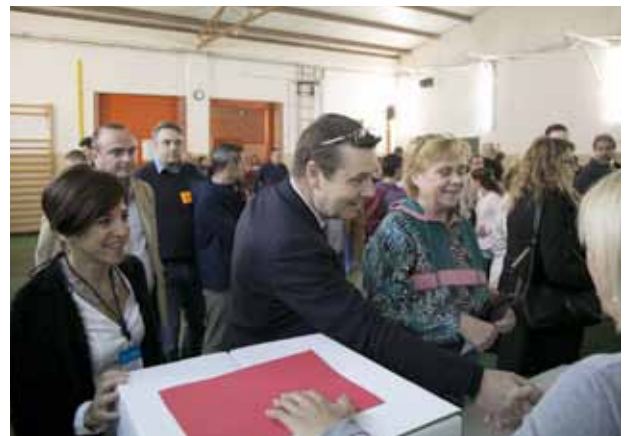
Un grup d'observadors internacionals va visitar el Masnou.

procés. Des de la Regidoria de Participació Ciutadana es va editar material informatiu sobre el sistema de votació. De la mateixa manera, altres regidories, com la de Seguretat Ciutadana i Mobilitat, van treballar per contribuir a un desenvolupament satisfactori de la jornada. Des de la pàgina web municipal es va fer un seguiment de l'actualitat, amb emissions en línia sobre com van viure els masnovins i masnovines el 9N, amb entrevistes a representants dels partits polítics presents a la vila, les entitats i a diverses autoritats municipals. ■