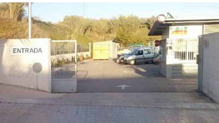
La deixalleria "La Suïssa" es troba al carrer del Gregal de Premià de Dalt.

Durant quatre mesos, els usuaris domèstics d'Alella, el Masnou i Teià tindran els mateixos serveis a la deixalleria "La Suïssa", de Premià de Dalt