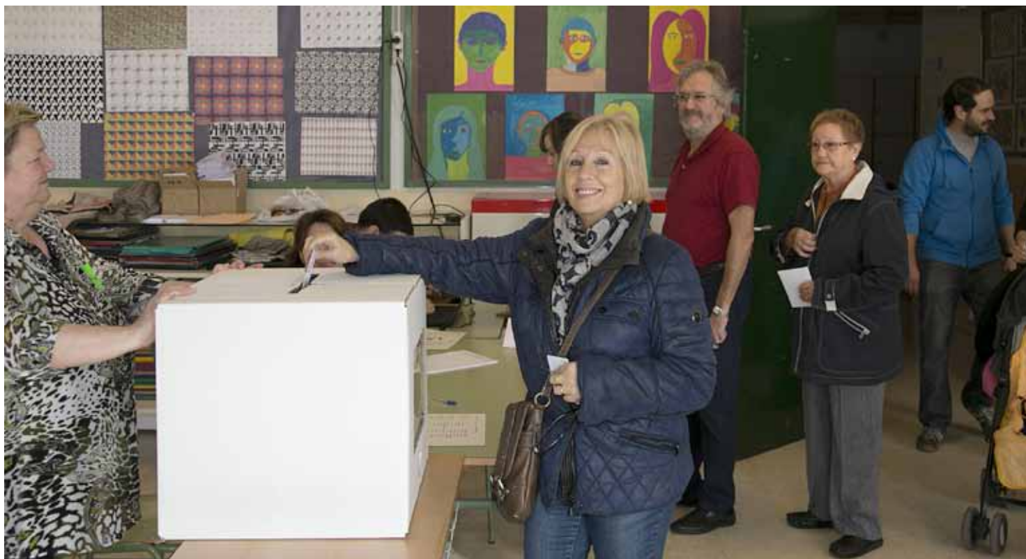
Els instituts Mediterrània i Maremar van ser els dos equipaments on es van dur a terme les votacions, sense incidents i amb entusiasme.

Diversos observadors internacionals van ser presents a l'Institut Mediterrània durant la jornada per copsar-hi l'ambient