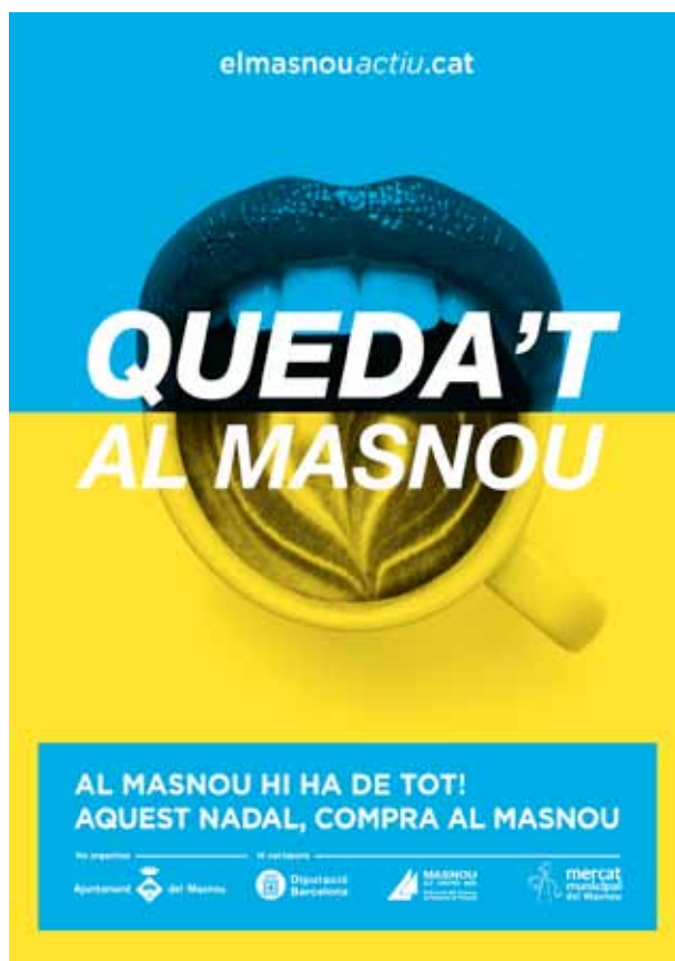
Una de les imatges de promoció de la campanya.