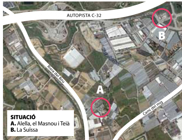
SITUACIÓ A. Alella, el Masnou i Teià B. La Suïssa

mancomunitat de serveis va posar en funcionament el servei de deixalleria mòbil. Els residus recollits a la deixalleria mancomunada es transporten a les plantes de gestió corresponents, on es reciclen i tracten amb la finalitat que tornin a entrar en el cicle productiu i de consum, així com per minimitzar la fracció de residus enviats a la incineradora. L'aportació de residus a la deixalleria comporta un important estalvi de recursos i d'energia, ja que la reutilització i el reciclatge d'un material és molt més barat, des del punt de vista econòmic, energètic i mediambiental, que produir-lo de nou.