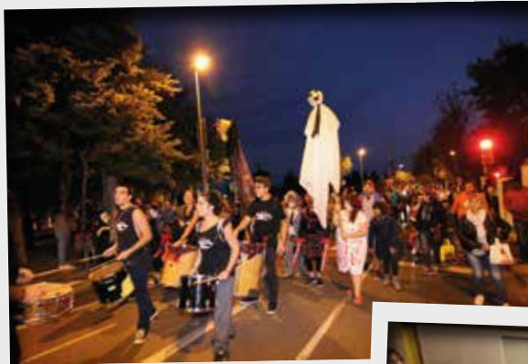
L'entitat Luz del Alba i l'Associació de Veïns del Masnou Alt van celebrar Halloween amb una rua, un concurs de disfresses i una xocolatada.

Els actes d'aquesta celebració ja s'havien iniciat durant el cap de setmana anterior, en què havien tingut lloc diversos tallers infantils al Mercat Municipal, així com un passatge del terror ambientat en un psiquiàtric al Masnou Alt. ■