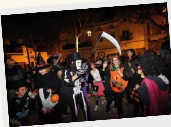
La Colla de Diables va organitzar una nova edició del Castanyot, en què la tradició de bruixots es va barrejar amb la de Halloween. Va tenir lloc una cercavila que va acabar a l'Altell de les Bruixes, on va continuar la festa, i es van coure castanyes i es van repartir.