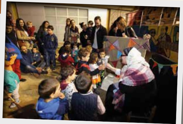
A Ca n'Humet, l'Ajuntament del Masnou i Lleureka Projectes Educatius van preparar una castanyada per als més menuts, amb la visita de la Maria Castanyera i balls tradicionals.