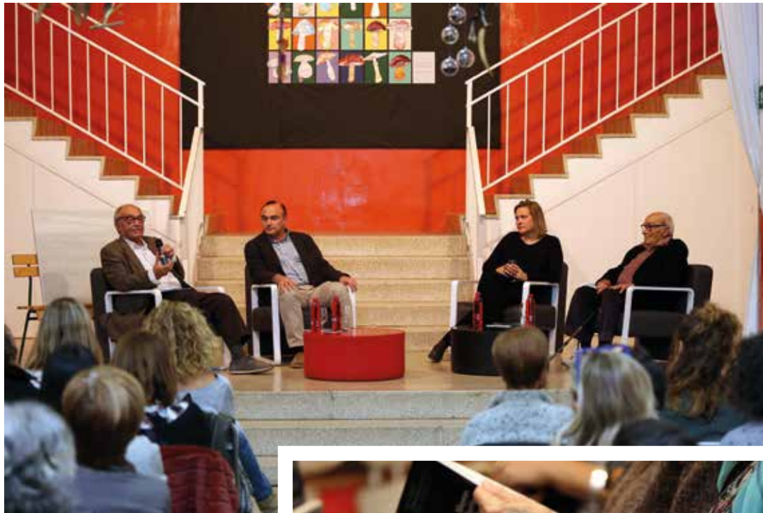
Moment de la presentació.

Precisament d'aquesta vocació per la seva professió, així com la de servei a la comunitat i l'entusiasme per l'ensenyament, en va parlar Hernández, per recordar "la importància i definitiva figura d'un mestre per a la formació de les persones". L'autora va repassar