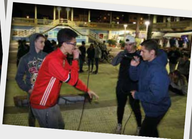
Els més joves es van citar a la plaça d'Europa (port esportiu), que va acollir el Combat de Galls Rhythm and Poetry, un concurs en què un grup de joves s'enfrontaven en una discussió dialèctica utilitzant paràmetres de rap i amb un temps limitat.