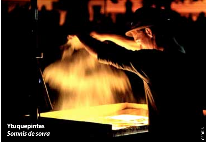
Ytuquepintas Somnis de sorra