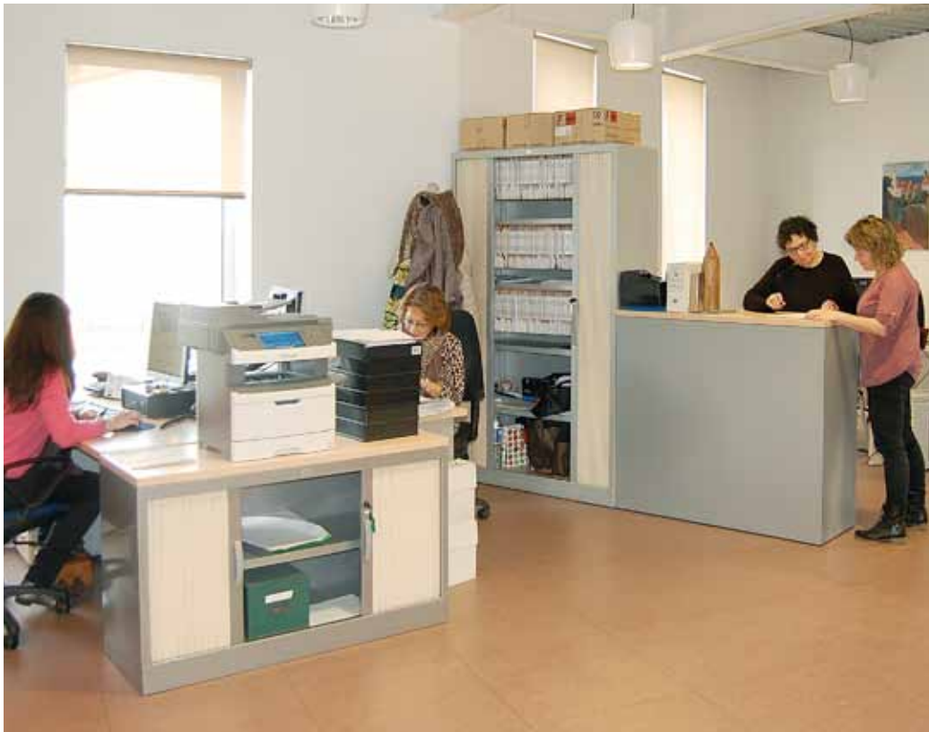
Part de l'equip de la Regidoria, ubicada a la segona planta de l'edifici de Roger de Flor.

El Servei Bàsic d'Atenció Social de l'Ajuntament està format per un equip tècnic de professionals, treballadores socials i educadores socials que tenen per objecte promoure els mecanismes per conèixer, prevenir i intervenir en persones, famílies i col·lectius, especialment si es troben en situació de risc social o d'exclusió.