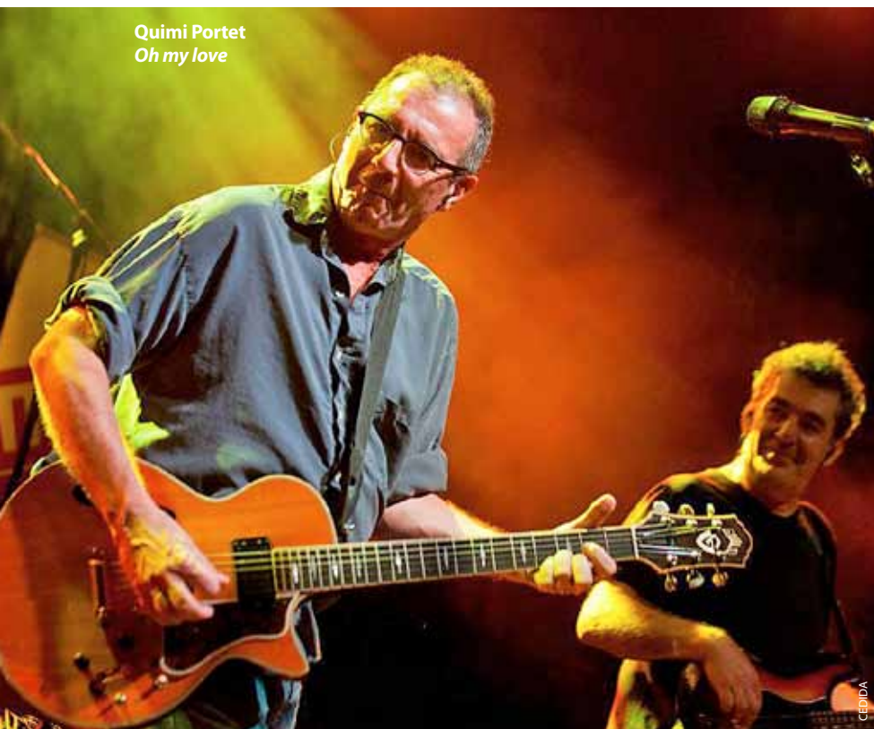
Quimi Portet Oh my love

Quimi Portet, amb la presentació del seu reeixit treball Oh my love , el 9 de març (22.30 h), serà l'encarregat d'iniciar la programació d'aquest trimestre a l'Espai Escènic Ca n'Humet. En l'apartat de noms populars amb espectacles garantits pels bons resultats a sales de Barcelona o altres municipis catalans, es troba l'espectacle No sé si... , de Marta Carrasco (20 d'abril, 22 h), i l'obra de teatre Cosmètica de l'enemic (4 de maig, 22 h), interpretada per una de les veus més reconegudes de Catalunya, Lluís Soler, i Xavier Ripoll, a partir d'un text de l'autora belga Amélie Nothomb i direcció de Magda Puyo. L'actriu establerta al Masnou Carme Pla oferirà una acció formativa per a adults majors de 16 anys per potenciar l'expressió i la creativitat a dalt de l'escenari (del dilluns 6 al divendres 10 de maig, de 18.30 a 21 h).