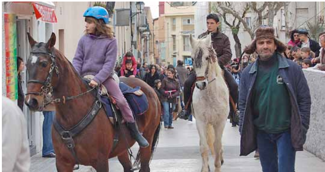
L'arribada dels cavalls a la festa és un dels moments més esperats.