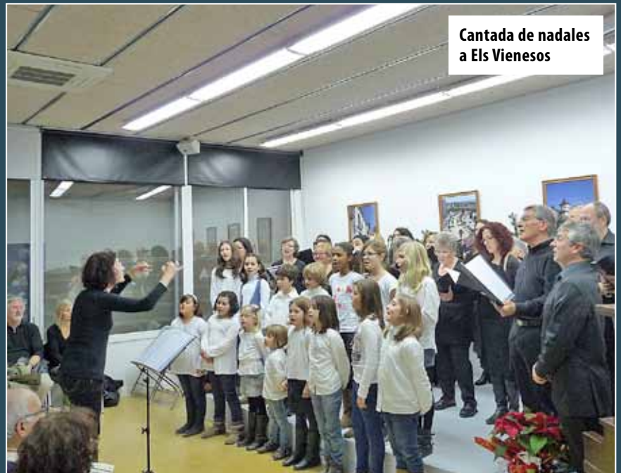
Cantada de nades a Els Vienesos