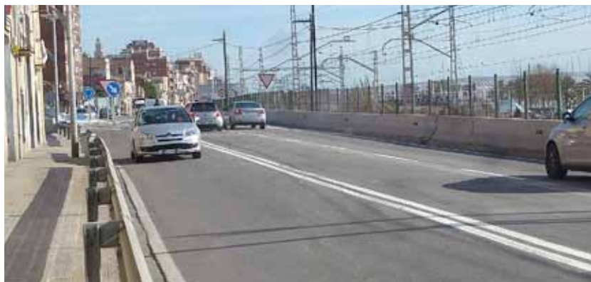
El restabliment dels carrils també ha servit per aplicar petites millores relacionades amb la seguretat en aquest tram.