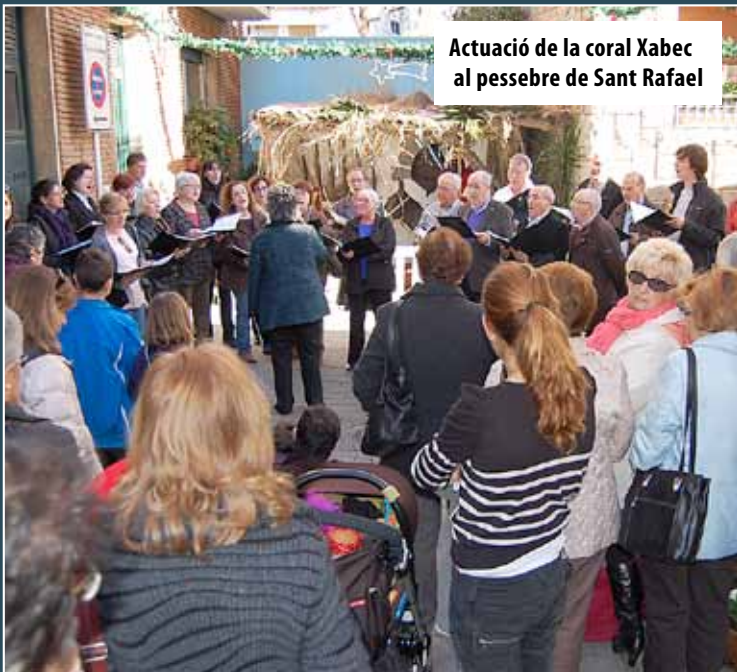
Actuació de la coral Xabec al pessebre de Sant Rafael