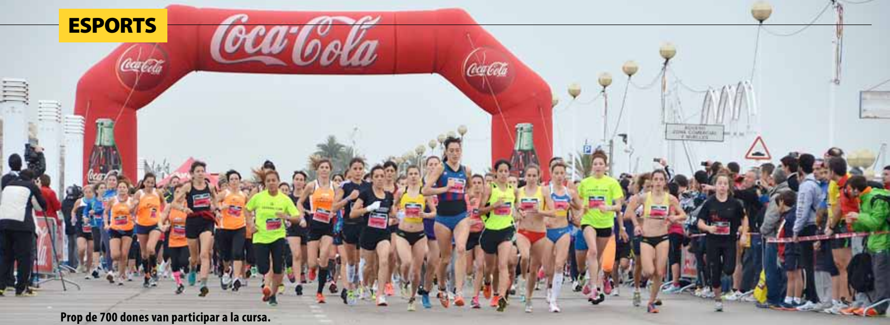
Prop de 700 dones van participar a la cursa.