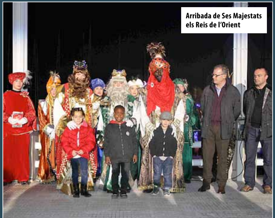
Arribada de Ses Majestats els Reis de l'Orient

El Nadal va deixar al municipi un recull d'imatges que mostren les diverses iniciatives amb què es van celebrar aquestes festes