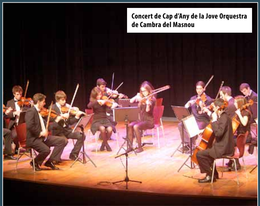
Concert de Cap d'Any de la Jove Orquestra de Cambra del Masnou