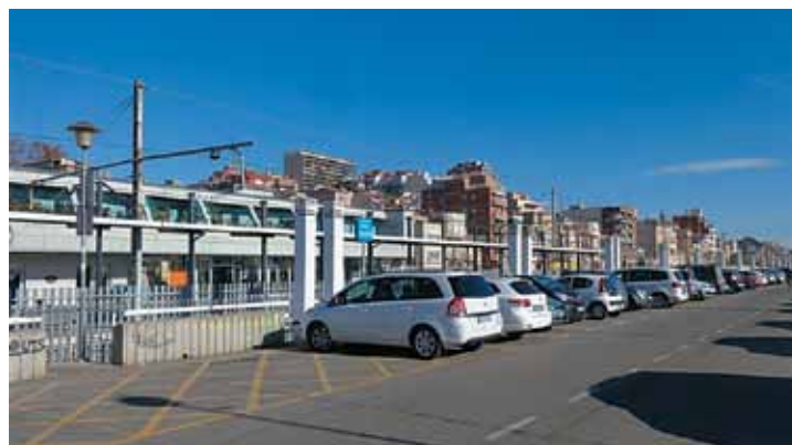
L'Ordenança del servei de taxi també es va modificar.

del Masnou també es va aprovar, tot i que va comptar amb l'oposició del grup d'ICV-EUiA-EA (2 vots).