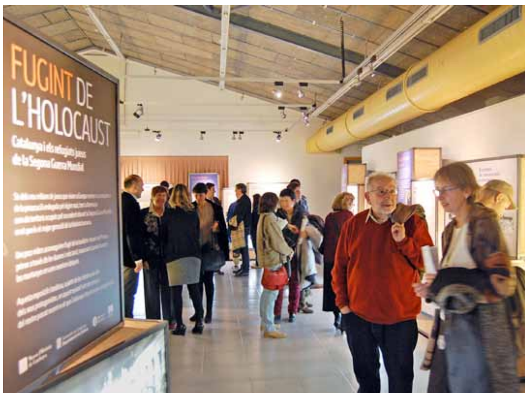
L'exposició es podrà veure fins al 5 de març.

Dory SontHeimer, autora del llibre Les set caixes , va oferir en primera persona el testimoni d'una família de jueus alemanys víctima del nazisme