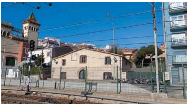
El Ple va aprovar la cessió de l'immoble de Can Targa a la Fundació el Maresme.