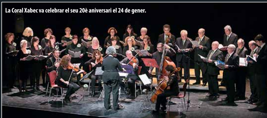
La Coral Xabec va celebrar el seu 20è aniversari el 24 de gener.