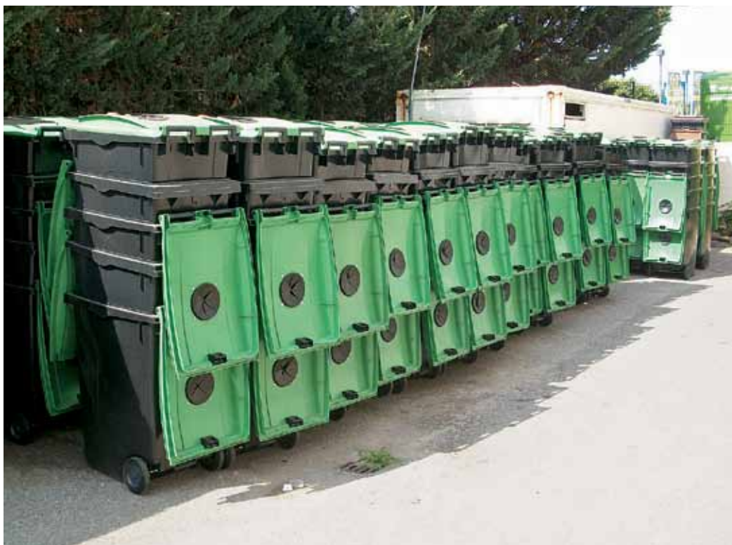
Els nous contenidors que es distribuiran per tot el municipi.

Per fomentar i facilitar el reciclatge, s'incrementen els punts d'aportació de residus i passen de 60 a 180