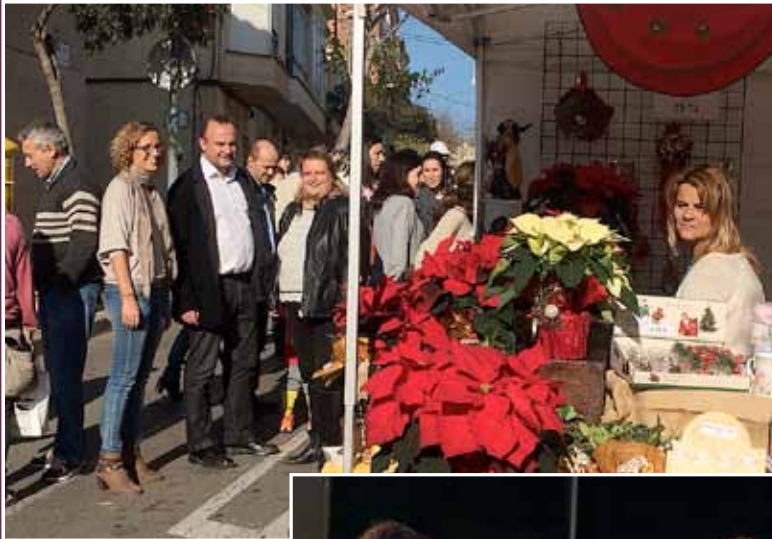
La Fira de Nadal a l'avinguda de Joan XXIII.