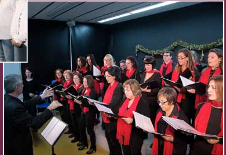
El cor Scandicus.