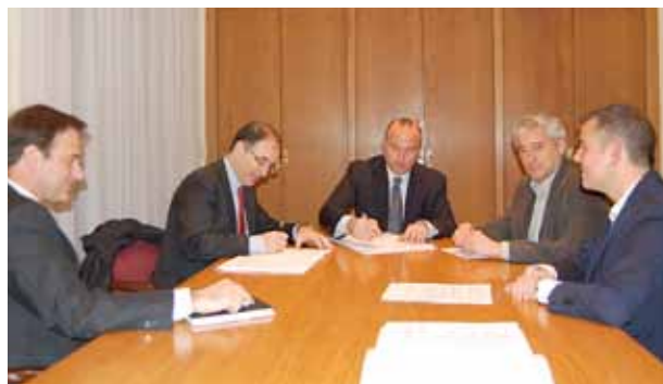
L'alcalde, regidors i representants de l'empresa CLD signant el nou contracte.

E l 15 de febrer és previst que entri en funcionament el nou servei de recollida de residus i de neteja viària. Després d'un procés de licitació que ha estat interromput per les impugnacions de les empreses CLD i Fomento de Construcciones y Contratas, que optaven a l'adjudicació del concurs, finalment entrarà en vigor el nou contracte, adjudicat a l'empresa CLD. La preservació de la via pública és