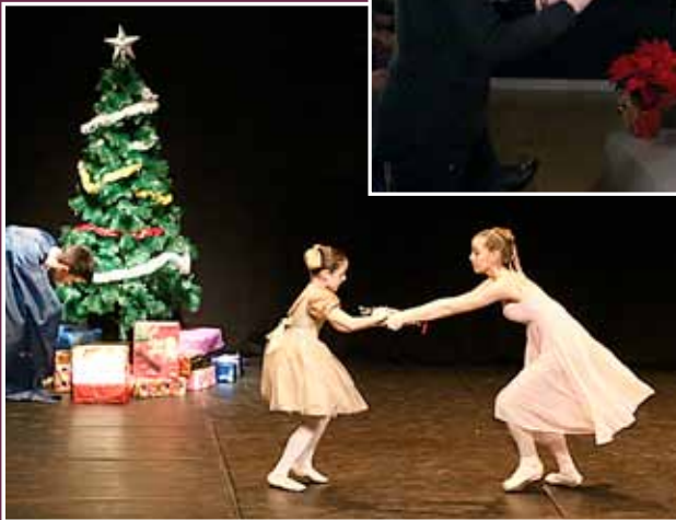
Representació d'El trencanous.