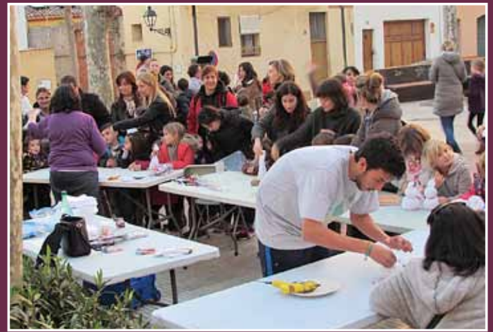
Tallers de Nadal a la plaça d'Ocata.