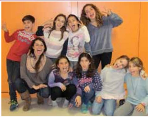
La inauguració del pessebre d'Els Vienesos.