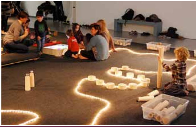
L'activitat Prohibit no tocar va sorprendre els participants.