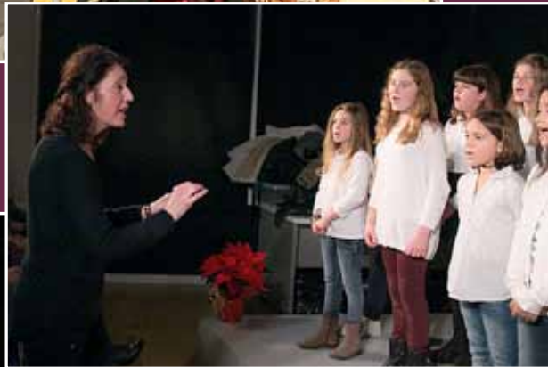
La coral de la UNESCO.