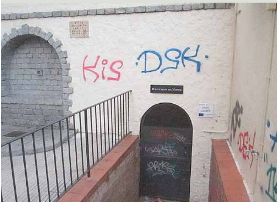
A la tardor del 2015 es va detectar un augment de les pintades.

Les multes als autors identificats i reincidents oscil·len entre els 100 i els 600 euros, segons la gravetat de la infracció