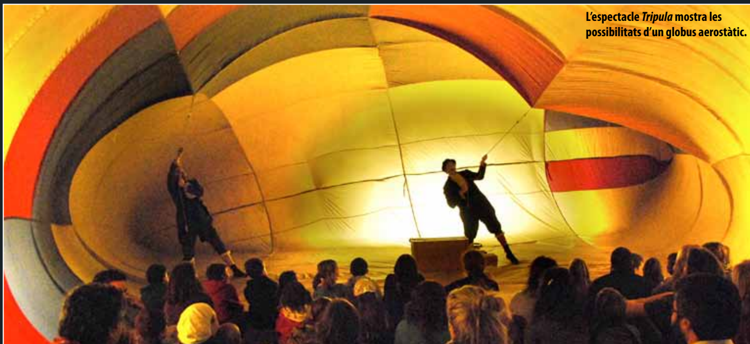
L'espectacle Tripula mostra les possibilitats d'un globus aerostàtic.