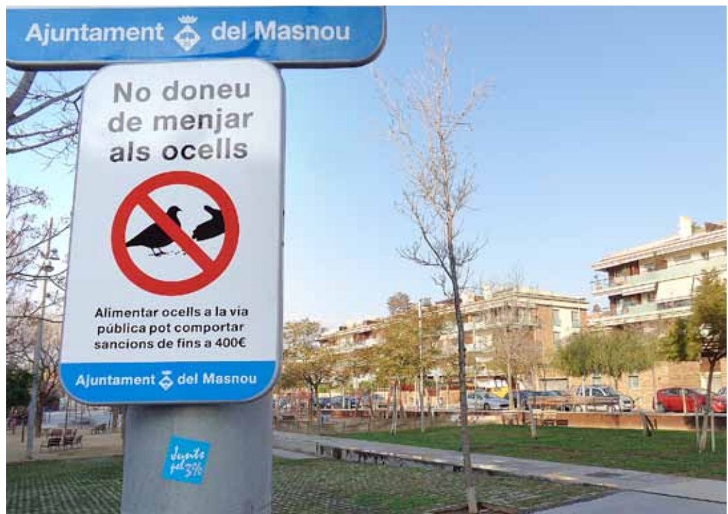
S'han col·locat cartells informatius als punts on s'han detectat persones que alimenten els ocells.

De moment, l'Ajuntament ha instal·lat mesures dissuasives als edificis municipals per evitar la concentració d'aus i ha començat a posar senyals, en alguns parcs, indicant la prohibició d'alimentar aquests animals. Es vol fer una incidència especial en la senyalització dels punts que esdevenen conflictius, perquè és on algunes persones alimenten aquestes aus. En aquest sentit, l'Ajuntament recorda que quan els ocells reben un excés d'aliment no marxen del municipi i es reproduïxen més fàcilment. Així, unit a la facilitat per trobar espais on fer el niu, fa que amb els anys hagi augmentat el nombre d'aus. Per tant, es prohibeix alimentar les aus per les conseqüències negatives que en té la proliferació. L'Ordenança reguladora de la tinença d'animals dins del terme del Masnou estableix una sanció d'en-