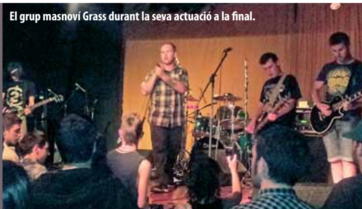
El grup masnoví Grass durant la seva actuació a la final.