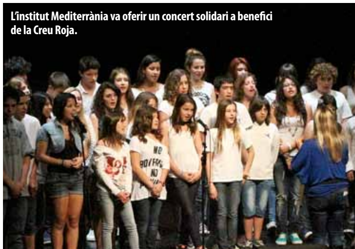
L'Institut Mediterrània va oferir un concert solidari a benefici de la Creu Roja.

A mb motiu de la festivitat de Sant Jordi, el dissabte 20 d'abril, l'escola Ocata va convidar tota la població a la festa que havia organitzat a la plaça de Marcel·lina de Monteyes. La celebració va seguir un fil argumental, "Una història d'amor", amb el qual es va reivindicar la riquesa d'aquesta escola com a patrimoni artístic i arquitectònic del municipi. S'hi van dur a terme diverses activitats,