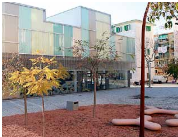
Els Vienesos ha esdevingut un punt de referència per a l'activitat de les entitats de la vila.

E l diumenge 26 de maig, l'equipament cívic Els Vienesos acull la I Jornada d'Entitats, que vol esdevenir un punt de trobada perquè les diverses associacions i col·lectius del Masnou donin a conèixer la seva activitat alhora que estableixen xarxes de connexió i col·laboració entre ells. Durant el matí, s'establirà la Mostra d'Entitats, amb un conjunt de parades, ubicades al final del carrer de la Segarra i en una part del carrer de la Pollacra Goleta Constança, on s'exhibirà la tasca i el funcionament de cada entitat participant. A més a més, les diferents associacions han proposat diverses