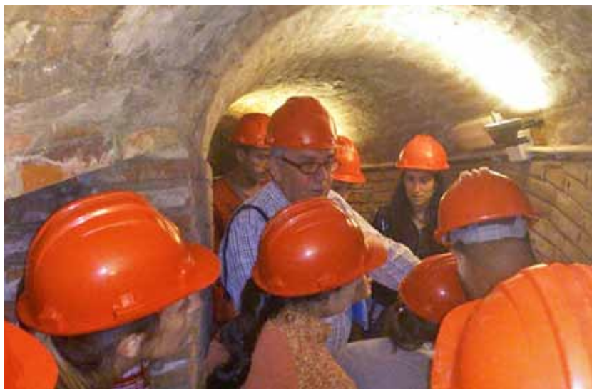
Els alumnes de català van poder visitar la Mina Museu.

El CPNL promou diverses activitats per aplicar el coneixement de la llengua a situacions socials reals