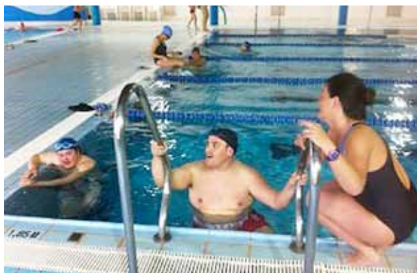
Els usuaris de DISMA van poder gaudir d'un bany a la piscina municipal.

El reconeixement i el suport amb què compta l'entitat de tota la ciutadania es fa evident, especialment, en