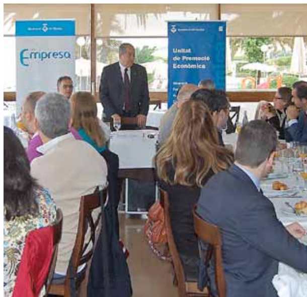
Puig va reflexionar sobre les circumstàncies que han de fer possible el ressorgiment polític i econòmic de Catalunya.

Segons Felip Puig, per superar la crisi econòmica que patim avui dia i recuperar l'economia, calen mesures que permetin regenerar la confiança en la política, i, especialment, una renegociació del pacte de la Constitució entre Catalunya i Espanya. Pel que fa a