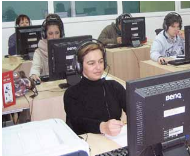
Al CFPAM s'ofereixen diversos ensenyaments per a persones en edat adulta.

A més del nou curs específic, al CFPAM es continuen oferint els ense-