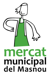
Moment de la presentació del nou logotip del Mercat i estrena de la campanya "Dijous groc".

de qualitat a un preu molt ajustat. El nou logotip del Mercat, que representa un paradista oferint els seus productes i serveis, s'ha posat el davantall groc per donar a conèixer aquesta campanya, que té per objectiu atraure l'interès de la ciutadania del Masnou. Tal com diu