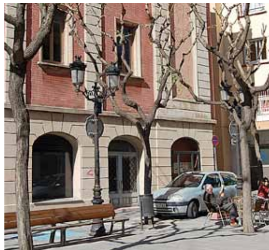
L'equipament s'ubicarà a l'edifici del Casinet.

El Centre de Recursos i Informació per a Dones (CIRD) inaugura noves instal·lacions al Casinet (carrer de Barcelona, 3). El centre és un punt d'atenció i de suport per a les dones que es trobin amb qualsevol problemàtica, així com per a les que volen informació o recursos per al seu desenvolupament personal i social. Es va inaugurar al mes de març de 2009, a la Casa de Cultura, d'on es va haver de traslladar, temporalment, a l'edifici de Roger de Flor, per diversos problemes estructurals de la casa. La inauguració de la nova seu serà el 7 de juny, a les 19 h. ■