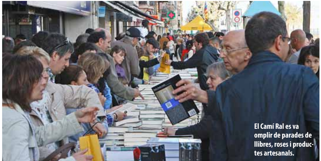
El Camí Ral es va omplir de parades de llibres, roses i productes artesanals.

Moltes entitats van voler donar a conèixer la seva tasca. Una de les parades que es va poder visitar va ser la de l'entitat Amnistia Internacional, en la