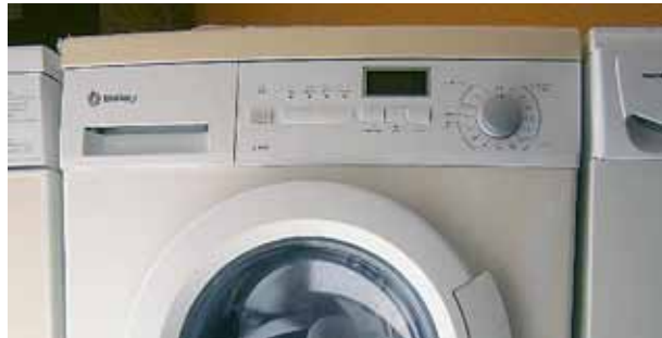
Les donacions aniran destinades a famílies que actualment ja reben l'ajut de Càritas.

L'única condició inexcusable és que tots els objectes esmentats estiguin en bon estat de conservació, per tal que puguin ser novament utilitzats. Aquest servei vol satisfer dues necessitats diferents: d'una banda, la de les persones que volen