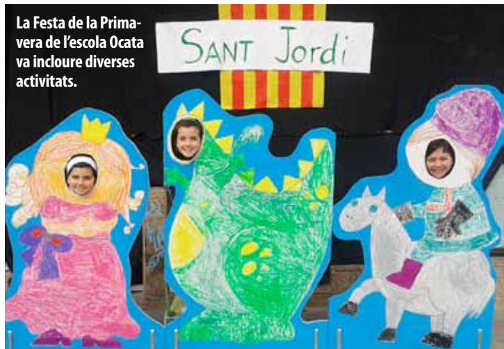
La Festa de la Primavera de l'escola Ocata va incloure diverses activitats.

L'escola Ocata celebra la Festa de la Primavera i l'Institut Mediterrània fa el concert de maig solidari