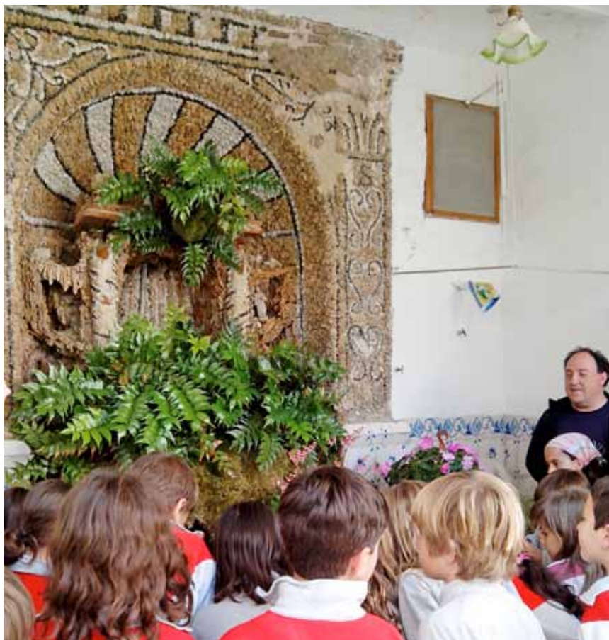
Les escoles de la vila i altres municipis han visitat la Mina i els safareigs que formen part de l'itinerari.

La Mina d'Aigua es va inaugurar el 17 de novembre del 2013, amb una gran expectació que va posar de manifest l'interès de la població de la vila per aquests espais. El segon diumenge de cada mes s'hi duen a terme visites guiades, que pràcticament sempre omplen les places ofertes. A més a més, altres col·lectius han conegut la Mina, com ara les escoles o altres grups d'adults. En total, des que es va reobrir, hi han passat més de 650 persones. L'activitat és possible gràcies a la col·laboració desinteressada de veïns com Jordi Milà, que hi fa de guia, i les famílies Cid i Garolera-Vinent, que mostren els seus safareigs. En aquest sentit, l'Ajuntament fa una crida a aquelles persones que tinguin un safareig i el vulguin mostrar perquè es posin en contacte amb el Museu Municipal de Nàutica.