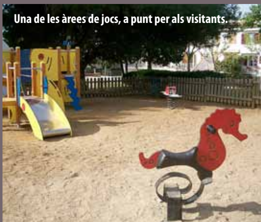
Una de les àrees de jocs, a punt per als visitants.

Durant els primers mesos del 2014, s'han fet treballs de manteniment i reparacions a totes les àrees de joc del municipi i s'han renovat els elements lúdics de l'àrea de jocs de Lluís Companys. Principalment, aquestes tasques han consistit a restituir peces trencades, deteriorades o absents, lubricar coixinets o reajustar peces d'unió. L'objectiu d'aquests treballs ha estat l'adaptació a la normativa europea pel que fa a les àrees de joc infantils. Igualment, s'ha renovat l'àrea de joc dels jardins de Lluís Companys. Atesa la reduïda superfície d'aquesta zona de jocs infantils, es va creure adient que fos destinada al grup de menys edat, d'1 a 6 anys.