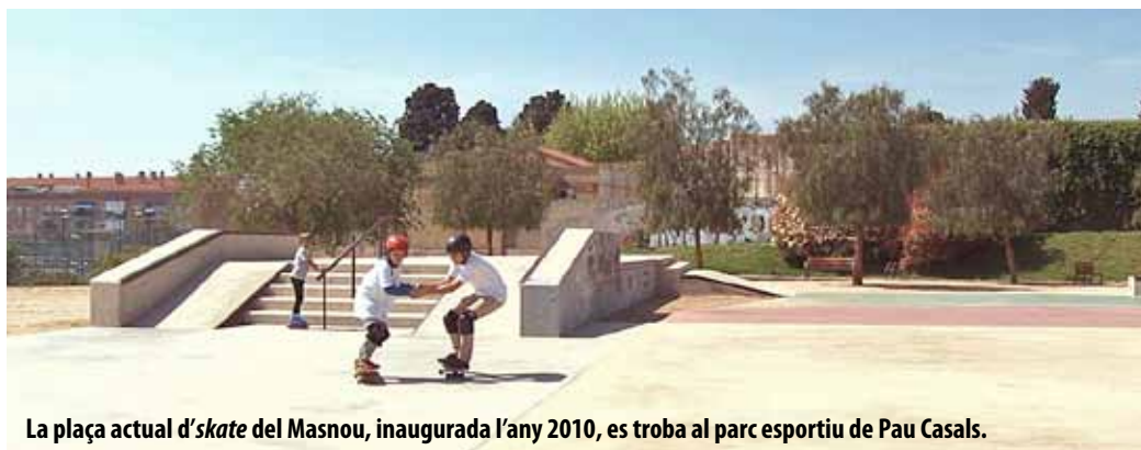
La plaça actual d' skate del Masnou, inaugurada l'any 2010, es troba al parc esportiu de Pau Casals.