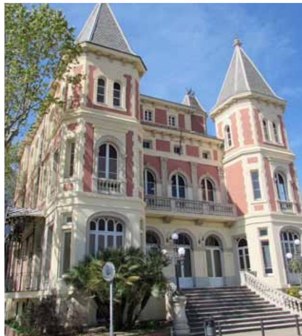
L'equipament ofereix diversos serveis, com allotjament, formació i informació, entre d'altres.

l'equipament vol esdevenir un punt de referència per proporcionar els recursos i el suport necessari a les persones emprenedores que volen engegar el seu projecte empresarial o que ja en tenen un. A més d'oferir el servei d'allotjament en les variants de despatxos, coworking i domiciliació, també es posen a l'abast dels usuaris altres recursos, com ara formació; informació sobre subvencions, ajuts i campanyes de suport de les diferents administracions; acompanyament en el desenvolupament dels projectes empresarials; organització d'esdeveniments dinamitzadors del teixit productiu; cessió de sales de reunió i aules de formació, i altres serveis en línia a través del portal web de la Casa del Marquès. Per poder oferir de la manera més efectiva tots aquests serveis, el Centre d'Empreses també acollirà el Servei de Creació i Consolidació d'Empreses de la Regidoria de Promoció Econòmica de l'Ajuntament del Masnou.