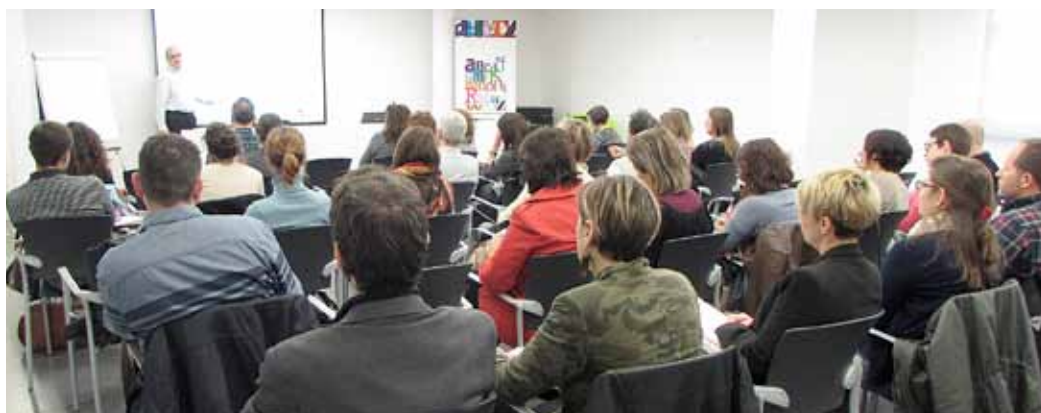
Un dels serveis que ofereix la Regidoria és el de formació a les persones emprenedores.

Dintre de l'objectiu general de fomentar l'activitat econòmica i l'ocupació al municipi, un dels sectors a què es dedica la Regidoria de Promoció Econòmica és l'empresarial. La posada en marxa del Centre d'Empreses Casa del Marquès és una fita important, ja que amb els serveis que s'hi oferiran es vol reforçar el suport a la iniciativa emprenedora i empresarial del nostre territori.