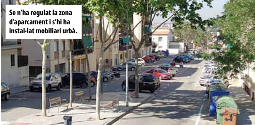
Se n'ha regulat la zona d'aparcament i s'hi ha instal·lat mobiliari urbà.