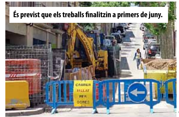
És previst que els treballs finalitzin a primers de juny.

Els veïns residents en el tram afectat pel tall poden accedir als seus guals des del carrer de Cristòfor Colom, en sentit contrari a l'habitual. L'Ajuntament els demana precaució per evitar incidents, ja que, fins a la finalització de les obres, el tram afectat serà de doble sentit de circulació per facilitar l'entrada i la sortida dels vehicles dels residents. ■