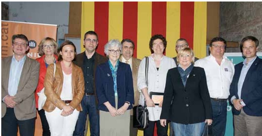
Presentació de la secció local a Alella, amb l'assistència d'autoritats municipals dels tres municipis i la presidenta, Muriel Casals.

Òmnium Cultural és una entitat catalana amb 53 anys d'existència i una llarga implantació a molts pobles de Catalunya. La reunió que es pot considerar germinal de la secció al Masnou, Alella i Teià es va produir a mitjans de gener de 2014, i al mes de març ja es va presentar la secció. Els canvis socials i el panorama actual que viu Catalunya i les seves manifestacions culturals fan que l'entitat es trobi en plena fase d'adaptació als nous reptes.