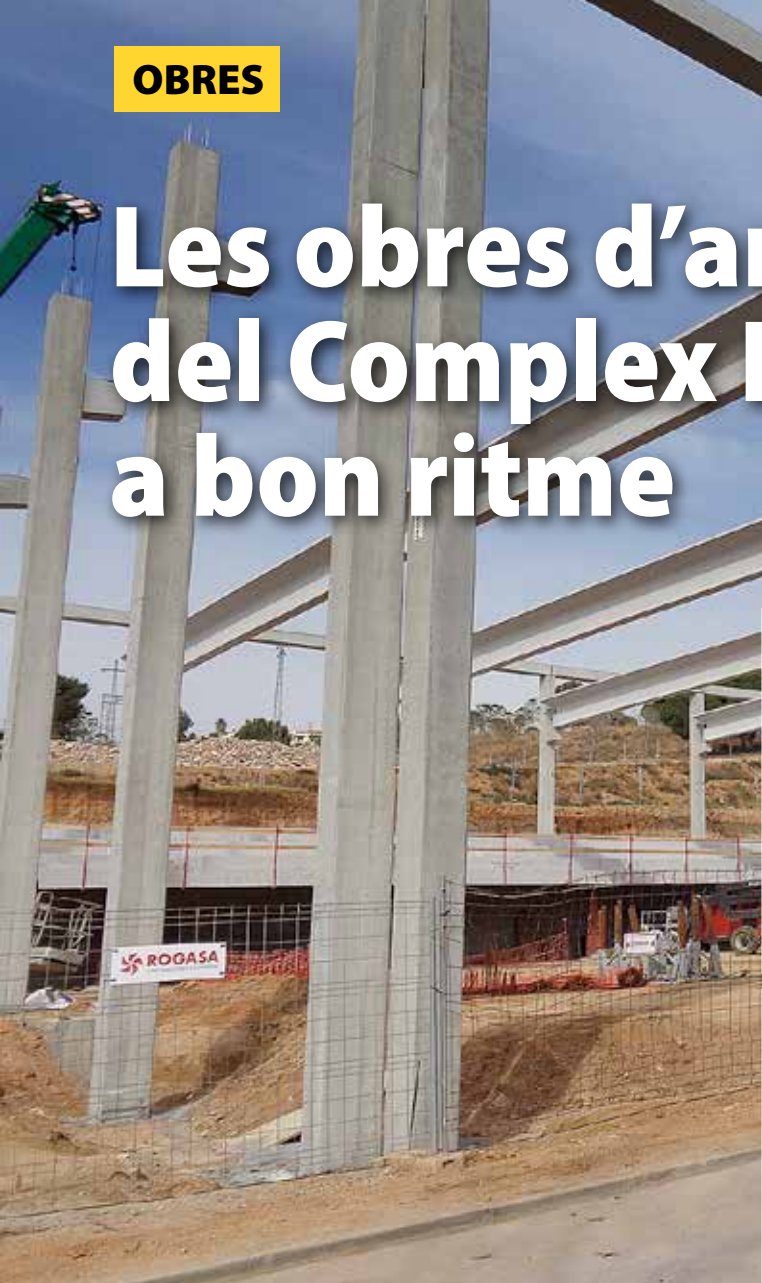
A dalt, els pilars i les bigues del futur pavelló ja instal·lades. A la dreta, imatges simulades de l'equipament acabat.