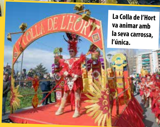
La Rua Diabòlica es va fer la nit del 6 de febrer.