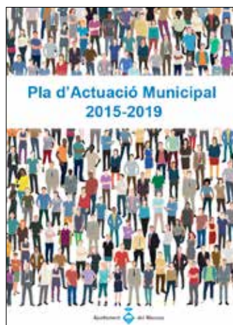
Portada de l'edició del PAM.