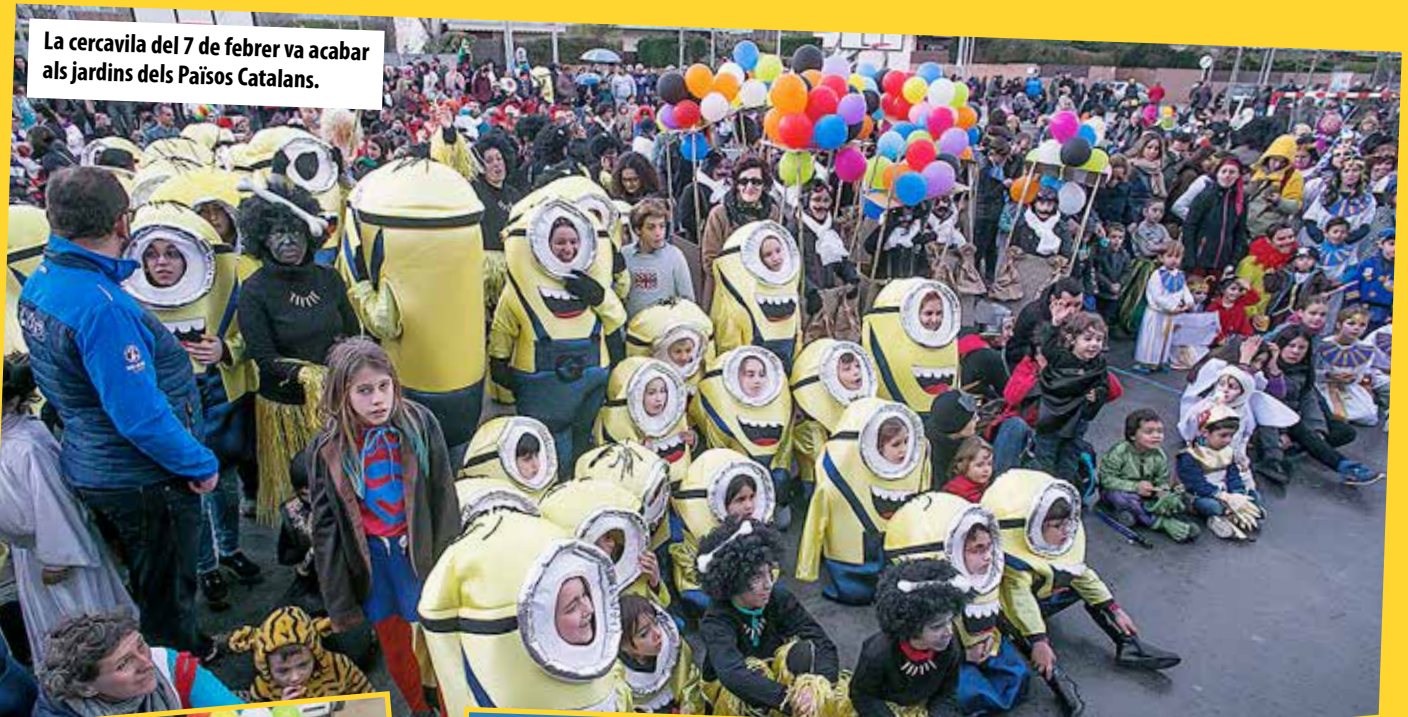
El grup de 'Viatge en globus' va aconseguir premi.