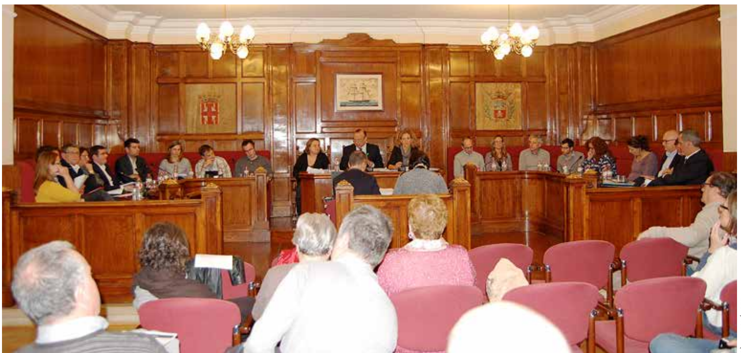
La sessió plenària del 18 de febrer va estar marcada pel contundent desacord amb el nou Reglament d'alguns partits de l'oposició.

Amb el nou ROM, les intervencions del públic al Ple es faran abans de la sessió