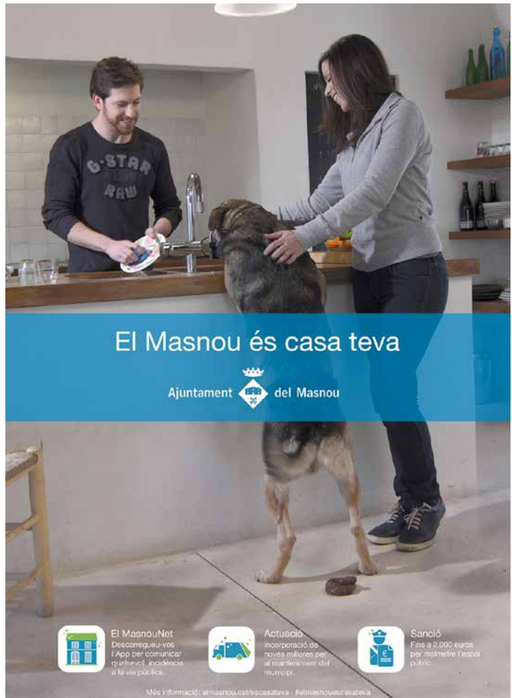
Una de les imatges en què es basa la campanya que reclama respecte pels carrers del municipi.

La campanya engegada, que porta per lema "El Masnou és casa teva", es basa en la necessitat de cuidar l'espai públic com si fos la pròpia llar, i ho fa mostrant quatre situacions quotidianes on succeeix un acte fora de context. Des de començament de febrer, s'han instal·lat 200 banderoles als carrers més concorreguts del municipi, s'han penjat 300 cartells i s'han distribuït 4 vídeos per fer incidència en la importància de cuidar i no malmetre l'espai on es viu. Els vídeos s'han distribuït per les xarxes socials i s'han projectat al cinema La