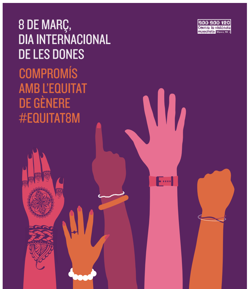
Imatge de la campanya d'aquest any.

S'espera que la llei de juliol del 2015 contribueixi a la igualtat