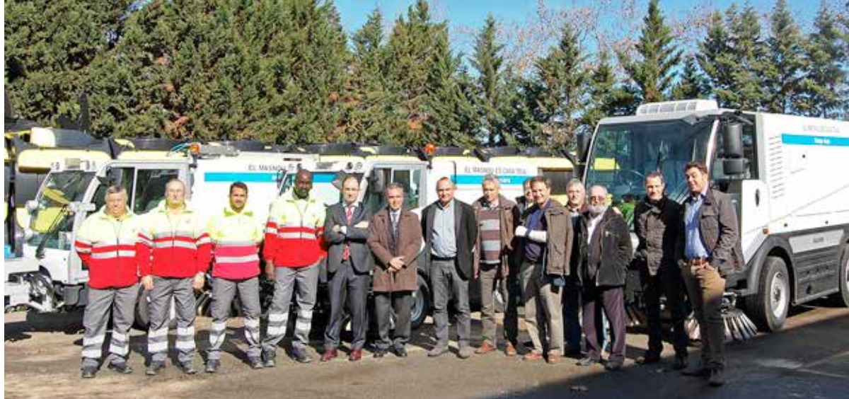
Autoritats municipals, directius de CLD i treballadors del servei de neteja el dia de la posada en marxa del nou contracte.