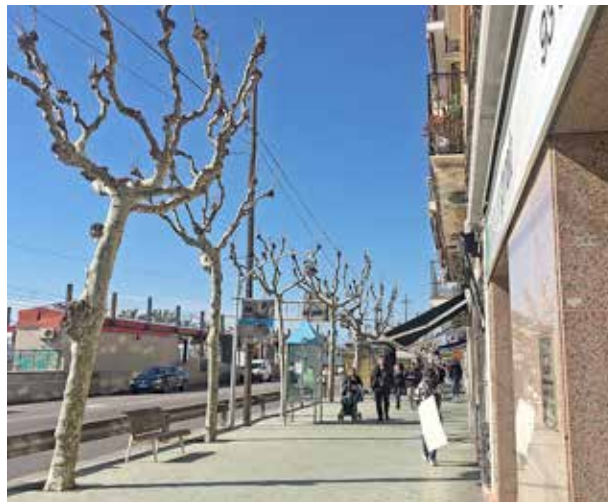
A la primera sessió del Consell es va presentar la campanya de civisme que està en marxa.

E l 4 de febrer, a la segona planta de Can Malet, es va reunir per primera vegada el Consell de la Vila, el màxim òrgan permanent de participació ciutadana de caràcter consultiu. Durant l'acte, l'alcalde va posar de manifest la importància de les aportacions de tothom. Després de repassar el procés que havia portat a la constitució del Consell, va recordar que "entre els objectius del Pla d'Actuació Municipal, es troba dur a terme accions per potenciar la participació ciutadana i la convivència cívica. En concret, l'actuació 152 se centra en la constitució del Consell de la Vila i la seva posada en funcionament d'acord amb el que estableix el seu reglament. De fet, és una funció pròpia del Consell de la Vila, entre d'altres, conèixer i debatre els projectes del PAM i del pressupost municipal, si bé aquesta vegada ja han estat aprovats i, per aquest motiu, en aquesta sessió d'avui se'n donarà compte i, en properes sessions, se'n farà el seguiment oportú". L'alcalde va estar acompanyat per la primera tinenta