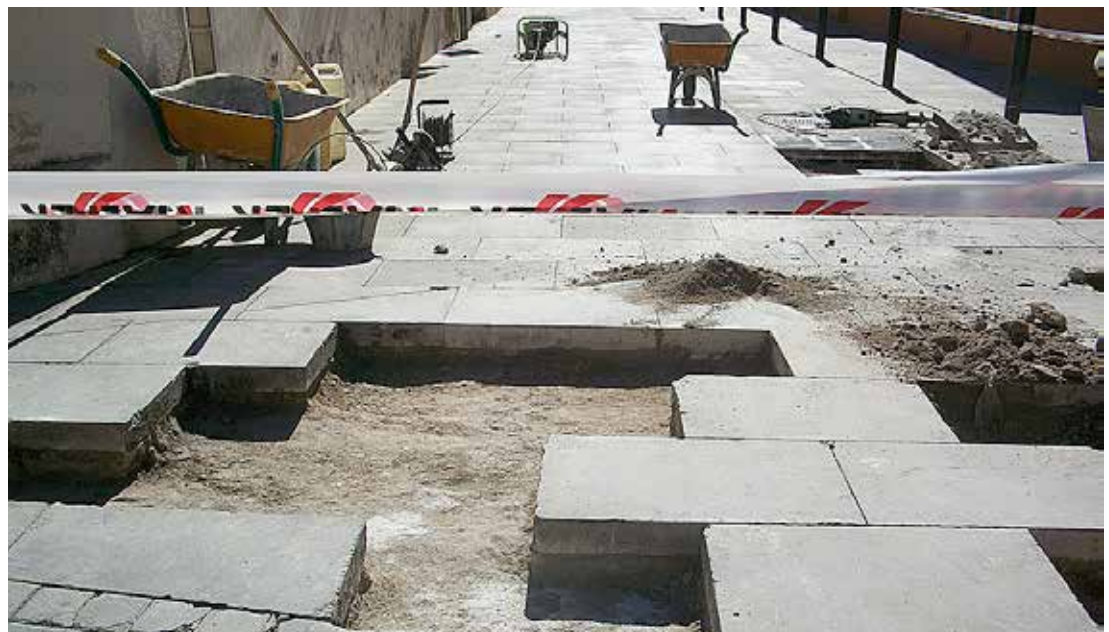
Des de la segona meitat del 2015, s'estan duent a terme treballs intensius de millora de voreres i asfaltat als carrers al municipi.