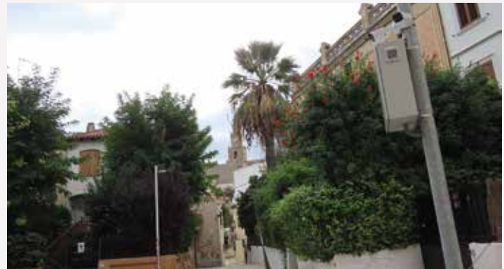
▲ Són les primeres càmeres de videovigilància al municipi. DOMÈNEC CANO

l'Ajuntament, juntament amb el suport de la col·laboració ciutadana. ■