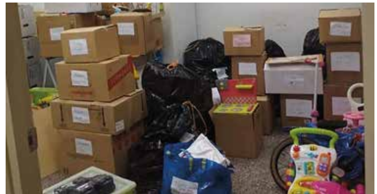
▲ Un dels objectius a curt termini és trobar un local per guardar-hi els objectes mentre no tenen sortida.