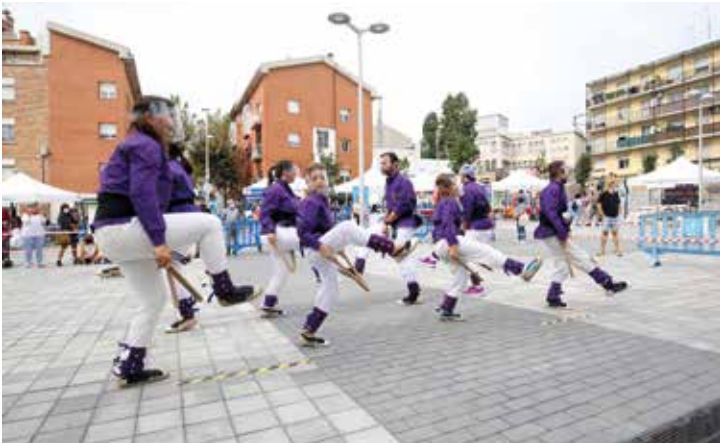
▲ Les persones assistents van poder gaudir d'una actuació de ball de bastons, una dansa popular.

actuacions, demostracions, exhibicions i tallers.