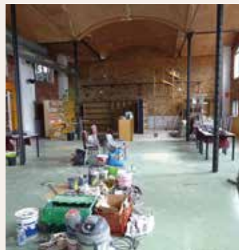
▲ Les obres s'han iniciat aquest mes d'octubre. RAÛL ANDREU

En concret, s'hi estan fent treballs de sanejament i impermeabilització de la coberta. Alhora, s'hi creen sis nous magatzems. Cinc estan vinculats als bucs d'assaig. L'altre, aprofitant l'espai disponible, se situa sota una escala. Es millora, a més, la il·luminació interior en diverses sales. Finalment, es pinta de nou tot l'equipament. La inversió que es dedica a aquestes millores