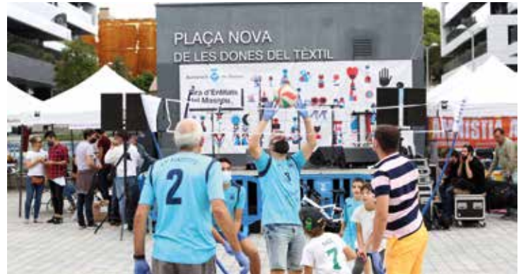
▲ L'esport també va tenir cabuda a la pl. Nova de les Dones del Tèxtil.