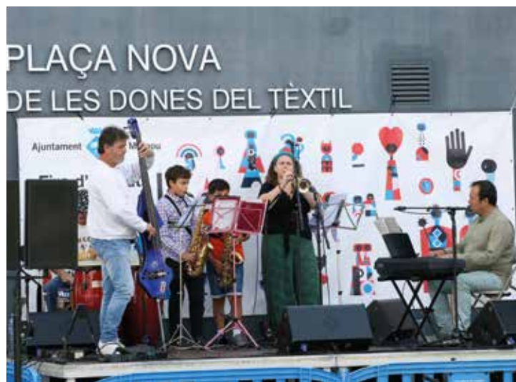
▲ La jornada va comptar amb diverses audicions musicals. RAMON BOADELLA

Aquesta va ser una edició atípica, per les mesures preventives contra la COVID-19 que es van establir perquè es pogués dur a terme amb seguretat