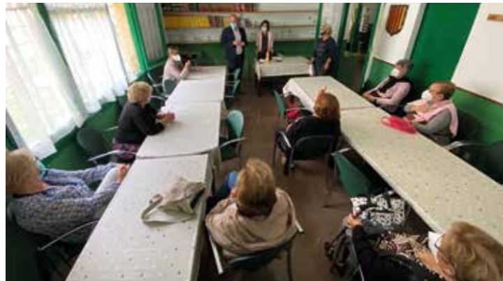
▲ Usuaris del casal de Can Mandri durant la visita de l'alcalde.

Durant la Setmana de la Gent Gran, l'Ajuntament i els tres casals de gent gran del municipi (Ocata, Can Mandri i Can Malet) van iniciar diversos tallers que, al llarg de 8 o 10 sessions, tenen l'objectiu de millorar el benestar físic i emocional de les persones grans. En concret, són sessions de ioga, estimulació cognitiva i d'estratègia d'afrontament emocional davant la COVID-19. Les activitats implanten mesures preventives i higièniques per