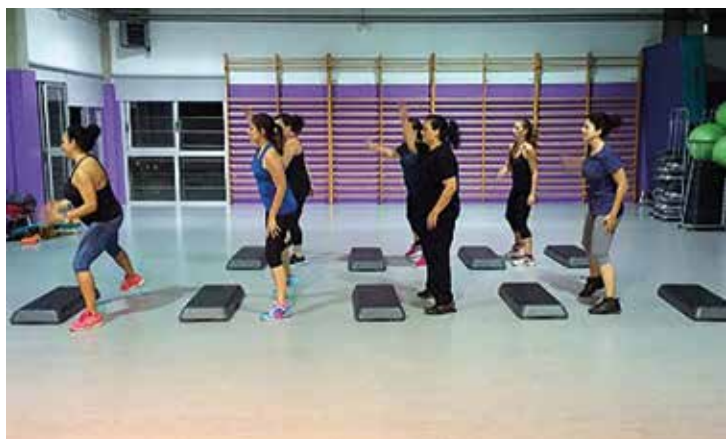
▲ Moment d'una de les sessions d'activitats dirigides al Complex.