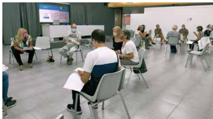
▲ La sessió de debat es va dur a terme a la Sala Joan Comellas. ALÍCIA TARODO