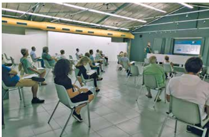
▲ La jornada va comptar amb prop d'una trentena de participants.

S'encara, doncs, la darrera etapa d'aquest procés participatiu: la votació final. Totes les persones de més de 16 anys empadronades al Masnou podran votar, en línia o presencialment, per decidir quines propostes, d'entre les 15 finalistes, rebran finançament