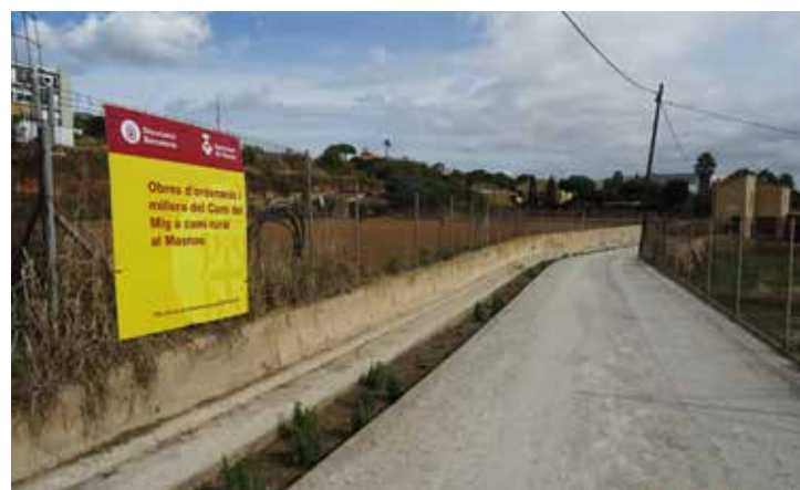
▲ Al llarg de 200 metres, es construirà un sistema de cuneta drenant verda. RAÛL ANDREU

Al tram comprès entre els torrents de Can Gaio i del Forn només hi tindran accés els vehicles de les persones residents