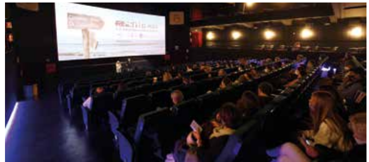
▲ El Fascurt va exhaurir les entrades tots els dies. RAMON BOADELLA

25 i 26 de setembre, al cinema La Calàndria, amb aforament limitat i seguint totes les mesures preventives establertes per les autoritats sanitàries. L'èxit va ser rotund, ja que es van esgotar les reserves per a les tres jornades del festival. També ho van ser la gran qualitat dels curtmetratges que es van projectar, posant força dificultats en la feina del jurat per decidir el palmarès de la divuitena edició del Fascurt, que es pot consultar al web www.fascurt.cat . ■