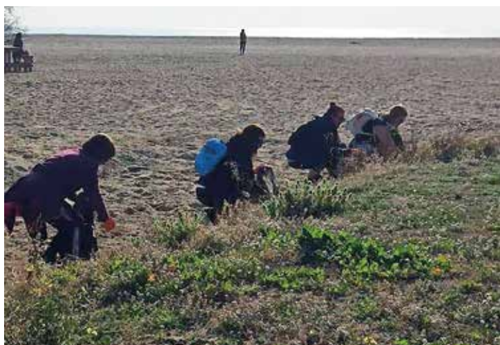
▲ L'entitat va organitzar una activitat per recollir residus a la platja d'Ocata.

A/e: nolotiresemat@gmail.com Facebook: https://www.facebook.com/groups/130742817272951/