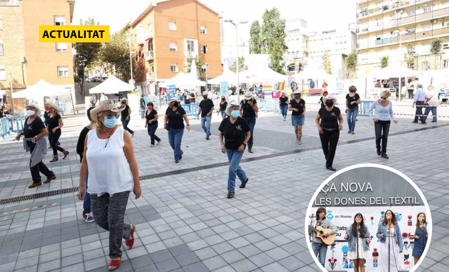
▲ Diverses actuacions van amenitzar la jornada dedicada al teixit associatiu.