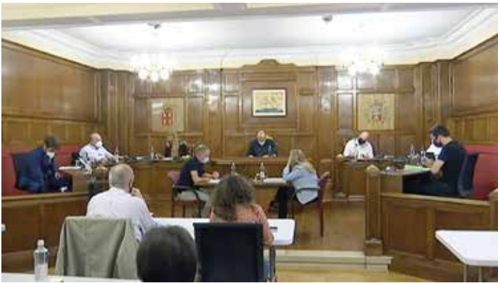
▲ Moment de la sessió plenària extraordinària del 30 de setembre. AJUNTAMENT

vot contrari: no estar d'acord amb l'externalització dels serveis per suposar una pèrdua del control de la gestió i recaptació, sumada a la suposada manca d'informació en temps i forma cap a les persones treballadores afectades.