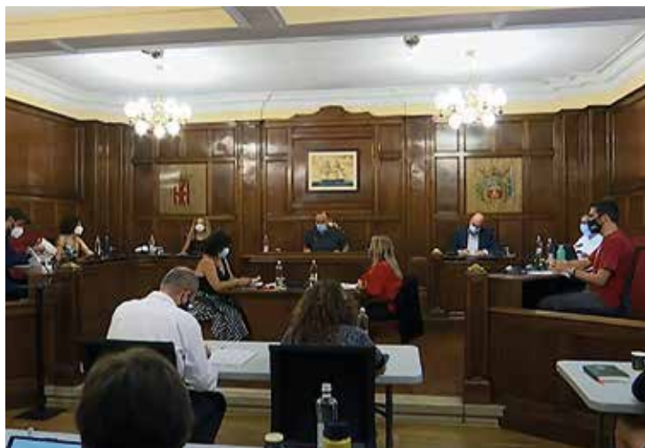
▲ Moment de la sessió plenària del 17 de setembre.

El Ple municipal del setembre, celebrat el dia 17, va abordar una de les preocupacions que han marcat l'estiu masnoví: la millora de la seguretat al municipi. No en va, l'actuació conjunta que han dut a terme l'Ajuntament i els cossos policials, acordant mesures amb representats d'associacions veïnals, ha donat com a resultat una notable reducció dels delictes, perceptible des de principis de setembre. De fet, els Mossos d'Esquadra concretaven el 15 de setembre que el dispositiu policial conjunt desplegat al Masnou ha comportat la detenció de 22 persones en un període aproximat de tres setmanes.