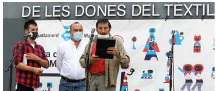
▲ L'alcalde i el regidor de Cultura van fer entrega dels reconeixements. RAMON BOADELLA

Totes les carpes es van situar com a mínim a un metre i mig de distància per garantir-ne la separació i es va limitar el nombre de paradistes. També es va delimitar una zona per a les actuacions, a l'espai central de la plaça, garantint la distància entre les persones que ballaven. ■