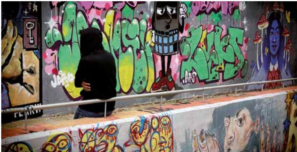
▲ El projecte Sostre 360° ofereix suport social i habitacional a una desena de joves al municipi. MIREIA CUXART

L'equip va ser distingit per l'ajuda a l'emancipació i la integració social de joves sense llar