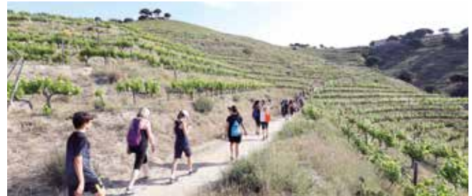
▲ Part de la marxa va transcórrer per les vinyes de la DO Alella. RAMON BOADELLA

Com en les edicions anteriors, els participants van poder sortir des de cadascuna de les tres poblacions que organitzen aquesta trobada per gaudir de la natura i compartir una bona estona d'esbarjo a l'aire lliure amb els companys i companyes d'excursió. La sortida, de caràcter familiar, va assolir el 70 % de les inscripcions, que estaven limitades a un