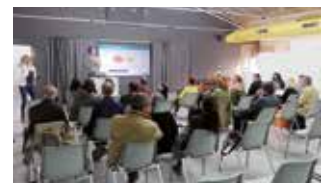
▲ Es van fer dues sessions informatives sobre el sistema porta a porta.

Són diverses les iniciatives ja preses per l'Ajuntament en aquest sentit. El Pla d'actuació municipal per al mandat 2019-2023 recull, entre les seves actuacions, estudiar les possibilitats de millora del sistema de recollida de residus, implementant proves pilot quan sigui necessari, per tal d'assolir nivells més alts de recollida selectiva, fet cabdal per reduir les emissions de gasos d'efecte hivernacle. Al Ple municipal també s'han fet diferents pronunciaments en aquesta línia, com ara la declaració del Masnou com a municipi en emergència climàtica o l'adhesió al Pacte d'Alcaldes i Alcaldesses pel Clima i l'Energia.