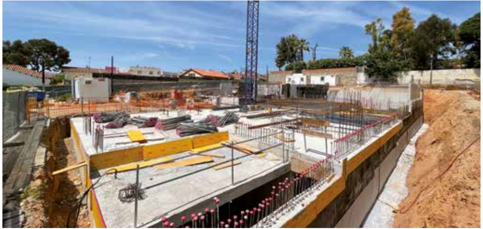
▲ A l'entorn de la nova plaça s'hi està construint una promoció d'habitatges protegits. MIREIA CUXART

E l canvi de nom de la plaça del Duc d'Ahumada per la plaça de l'U d'Octubre ja és definitiu. No s'han presentat al·legacions ni reclamacions a l'aprovació inicial que es va fer al passat Ple del febrer i que va tirar endavant amb 15 vots a favor (ERC, Fem Masnou, JxCAT-Units i CUP) i 5 en contra (PSC i Cs). Les seccions locals de l'Assemblea Nacional Catalana i Òmnium Cultural també han promogut que el Masnou tingui un espai públic que recordi aquesta efemèride.