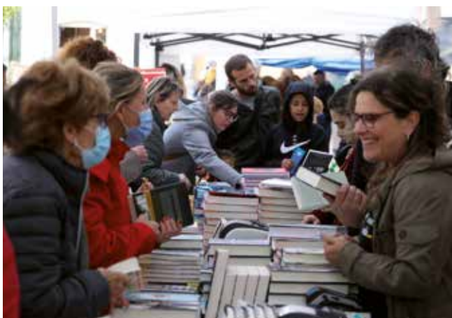
▲ El primer tram del carrer de Roger de Flor es va convertir en una fira de propostes literàries.

Amb tot, el temps, radicalment primaveral, va entorpir una mica la jornada, a causa de les tempestes intermitents que van descarregar aigua, diversos cops al llarg del dia, i, fins i tot, calamarsa, pels volts de la una del migdia del dissabte 23 d'abril. Com que s'havia previst la possible irrupció de pluges, alguns dels actes de la diada de Sant Jordi s'havien programat de manera que es poguessin traslladar sota cobert. Va ser el cas de Sarau de Sant Jordi , un espectacle d'animació infantil que el grup Rah-mon Roma va oferir al migdia a la Sala Joan