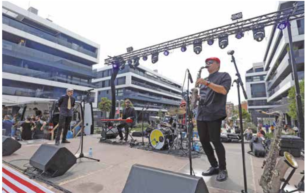
▲ Diverses actuacions musicals van amenitzar les dues jornades de festa. RAMON BOADELLA

Al llarg del cap de setmana hi va haver de tot i per a tots