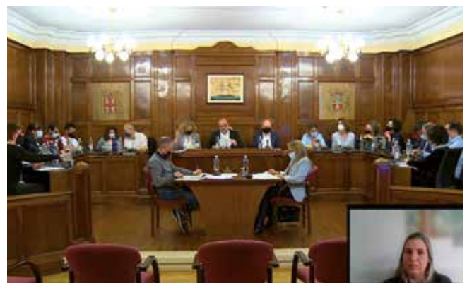
▲ Els edils van acordar continuar portant la mascareta a la sessió excepte en les intervencions.