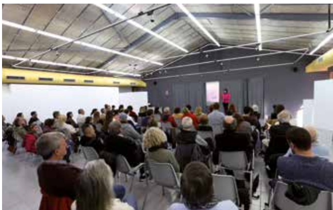
▲ Autores del Masnou van compartir les seves obres a l'acte 'Lectures de Santa Jordina'. RAMON BOADELLA

Es van celebrar tots els actes programats, tot i que alguns es van traslladar sota cobert