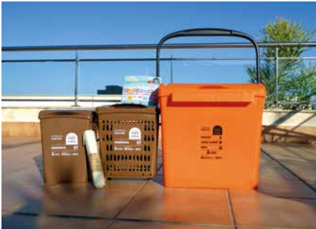
▲ Kit que es facilita al veïnat que participa a la prova pilot.

S'inicia el 23 de maig en una zona concreta del centre del municipi