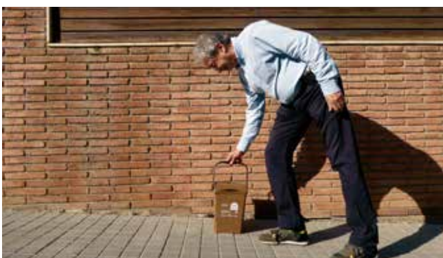
▲ En comptes de dipositar les deixalles als contenidors de reciclatge, es deixaran a les portes dels edificis. JOAN CIMA

Abans de començar la recollida, s'està informant els veïns i veïnes de la correcta separació de la brossa i se'ls facilita un kit que inclou un cubell airejat per a l'orgànica, un segon cubell per a l'orgànica amb xip (per treure'l al carrer), un cubell de 40 litres multifracció (de color taronja), un paquet de bosses compostables, un imant de nevera amb el calendari dels dies de recollida i adhesius per identificar la bossa del tèxtil sanitari. Primerament caldrà que separin els residus correctament a casa; després, hauran de treure el cubell corresponent entre les 20 i les 22 h davant la porta del