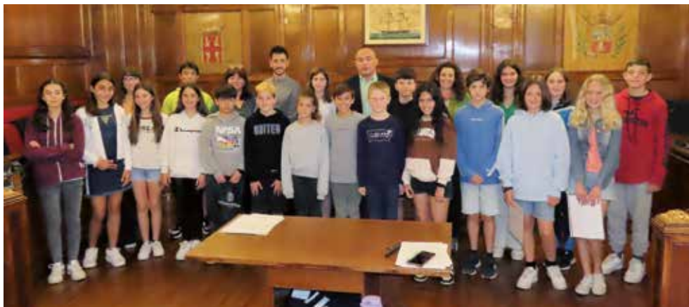
▲ L'alumnat del Consell d'Infants amb l'alcalde i altres regidors de l'Equip de Govern. DOMÈNEC CANO

A primers de maig l'Ajuntament del Masnou va acollir la sessió plenària del Consell d'Infants del curs 2021-2022. Van formar-ne part 20 alumnes, com a representants de tots els grups de 6è de primària de les escoles del Masnou. Es va retransmetre en directe a través del canal de Youtube de l'Ajuntament, per tal que tots els seus companys i companyes la seguissin des de les escoles.