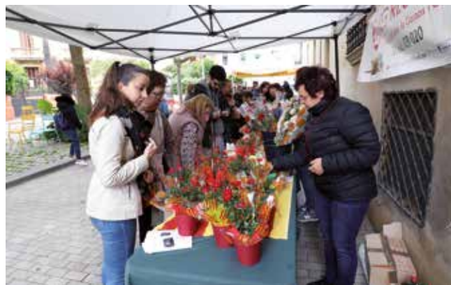
▲ Les roses van posar color a un dia de cel eminentment gris.