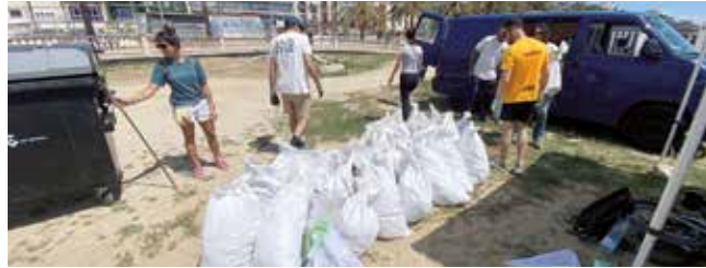
▲ Una part important dels residus que es van recollir eren tovallolletes higièniques.

E l 7 de maig es va organitzar una nova jornada de recollida de residus "Let's Clean Up Europe!" a la platja d'Ocata. Al voltant d'una quarantena de persones, convocades per l'Ajuntament, l'entitat Save The Project i el Club Nàutic El Masnou, van recollir uns 400 kg de residus.