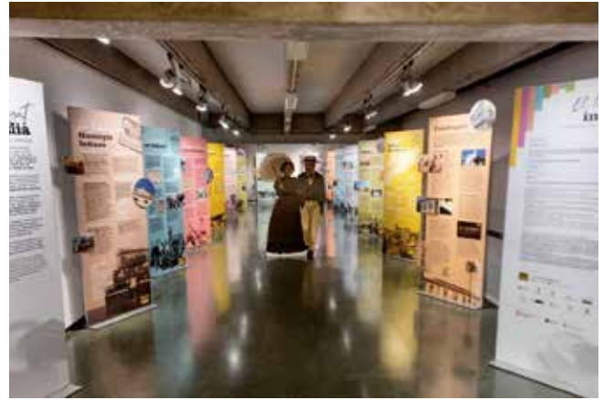
▲ Es podrà aprofundir en el llegat dels indians a la Casa de Cultura.

La mostra sobre el llegat indià es complementarà amb la conferència: "La participació dels catalans en el tràfic d'esclaus (1810-1867)", el 9 de juny