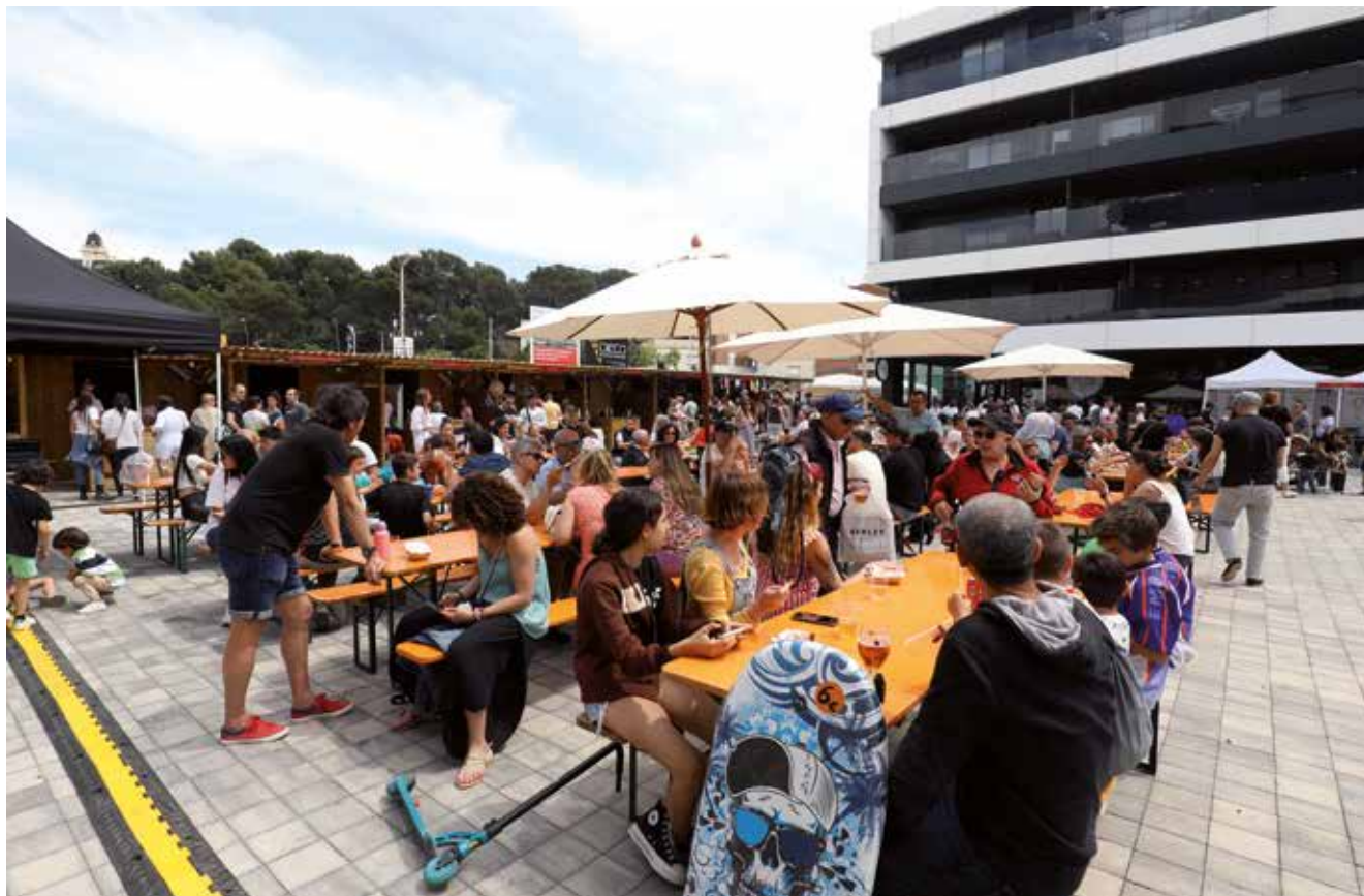
▲ Les taules de l'espai gastronòmic van estar a vessar durant gran part de la Fira. RAMON BOADELLA

L'encert en el format i en la ubicació provoquen un esclat de participació als espais d'aquesta Fira, que emulava un vaixell