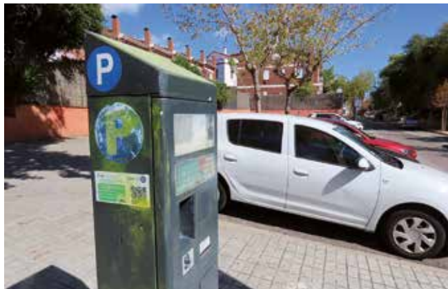
▲ Un dels parquímetres destrossats. DOMÈNEC CANO

Diversos actes vandàlics han malmès bona part dels parquímetres