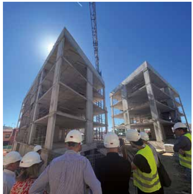
▲ Ja es poden veure les estructures dels edificis de la plaça de l'U d'Octubre. MIREIA CUXART

Pel que fa a l'obra de la plaça Nova de les Dones del Tèxtil, aturada des del mes passat, la trobada del 5 d'octubre va confirmar que encara no hi ha data concreta per reprendre la construcció i que el projecte patirà un endarreriment. L'empresa que fins ara duia a terme els treballs ha desistit del contracte i, tal com va informar l'AMB a la trobada, caldrà tornar a fer els tràmits tècnics i administratius necessaris per a una probable nova licitació de l'obra. La previsió amb què es treballa és que la construcció pugui continuar d'aquí a uns vuit o nou mesos, en funció del que s'allargui el procés de la nova adjudicació.