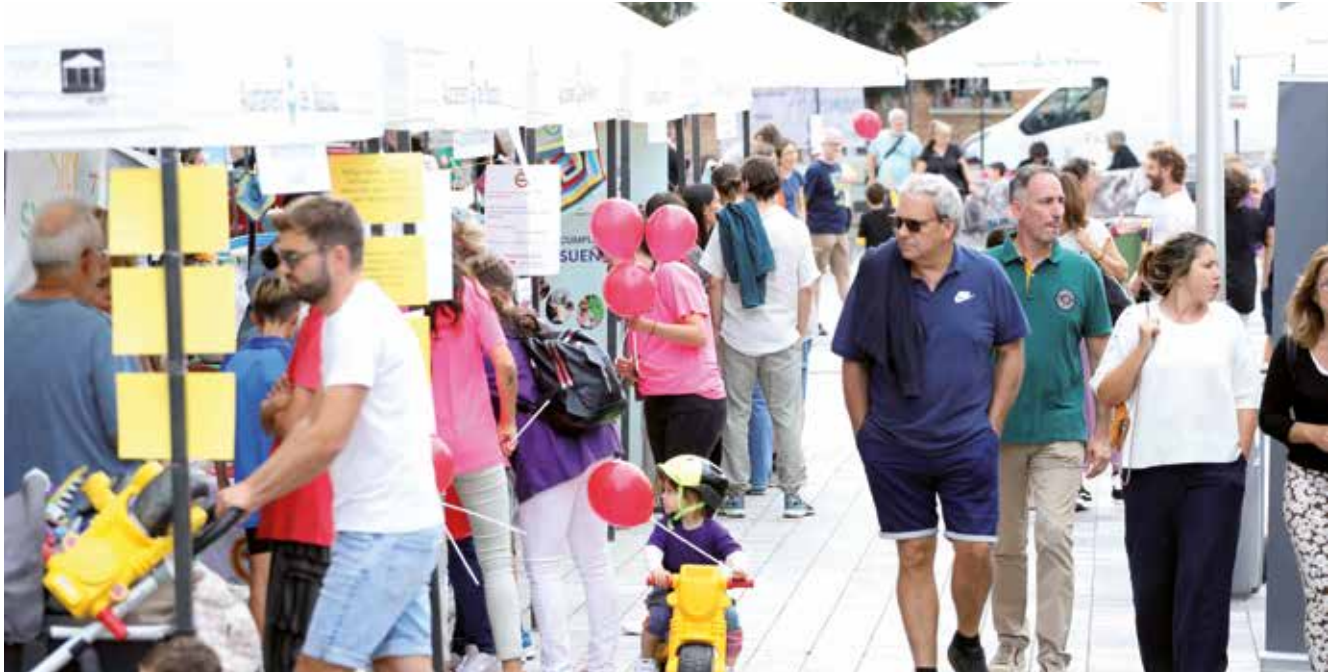
▲ Gran part del teixit associatiu local va mostrar la seva encomiable tasca a la plaça Nova de les Dones del Tèxtil. RAMON BOADELLA

Prop de quaranta entitats surten al carrer per mostrar la rica i diversa xarxa associativa