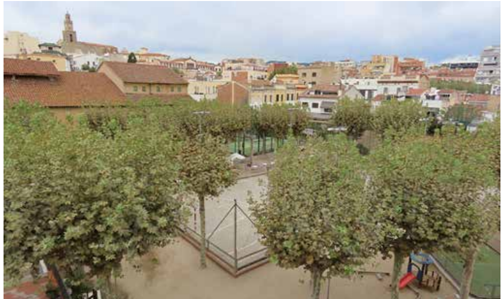
▲ Vista del pati del Casino, l'espai que es vol convertir en una plaça. DOMÈNEC CANO

L'objectiu de l'Ajuntament del Masnou és convertir el recinte del pati del Casino en una gran plaça pública. Cal precisar que l'expropiació no afecta els edificis de l'entitat —el del mateix Casino i el del teatre—, sinó només el pati i la construcció que allotja els vestidors. La modificació urbanística que implica l'expropiació va ser aprovada inicialment pel Ple municipal del 22 de juliol del 2021. Va ser el 7 de març d'enguany quan la Comissió Territorial d'Urbanisme de l'Arc Metropolità de Barcelona (Generalitat de Catalunya) va aprovar-la de manera definitiva. Uns mesos més tard, el 28