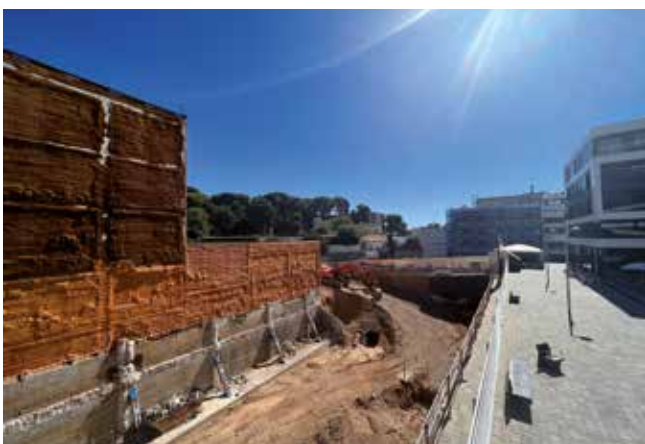
▲ A la plaça Nova de les Dones del Tèxtil, l'obra ha quedat aturada.

Per primera vegada al municipi, els habitatges protegits de la plaça de l'U d'Octubre es podran adquirir en règim de propietat, és a dir, de compra