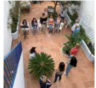
▲ Actuació en un dels patis que es van poder visitar.

Diversos patis i eixides amb mines d'aigua de cinc cases privades i un repartidor d'aquesta històrica xarxa de distribució d'aigua van participar en la jornada de portes obertes del diumenge 2 d'octubre. L'activitat es va completar amb la visita guiada a la Mina d'Aigua i del Centre d'Interpretació, a la plaça d'Ocata. Aquest conjunt d'activitats centrades en aquest reclam tan genuí del patrimoni masnoví va atreure més de cinc-centes visites.