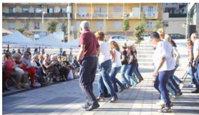
▲ Algunes de les entitats que col·laboren en el projecte van amenitzar la celebració. RAMON BOADELLA

La iniciativa del projecte Radars es va engegar al Masnou l'abril del 2021 i s'adreça a persones de més de 70 anys que viuen soles o acompanyades d'altres persones de més de 70 anys. El seu objectiu és pal·liar el sentiment de solitud no desitjada de les persones grans, i detectar i prevenir els possibles riscos que puguin patir, tot contribuint d'aquesta manera al fet que puguin continuar durant més temps a la seva llar (si així ho desitgen), gràcies a la complicitat del seu entorn.