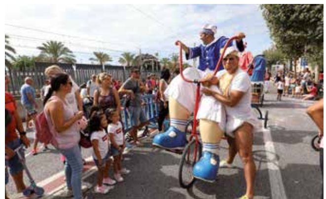
▲ Entre les propostes d'aquell dia, hi va haver un espectacle infantil itinerant de gran format. RAMON BOADELLA

La celebració de la Setmana de la Mobilitat, que es va estendre enguany del 16 al 22 de setembre amb el lema "Combina i mou-te", també va incloure el Dia del Transport Públic (21 de setembre). Durant aquesta jornada, l'autobús urbà va ser gratuït (línia C19), així com l'aparcament del port per a tots els conductors i conductores que l'utilitzessin per deixar-hi el cotxe i agafar el tren. ■