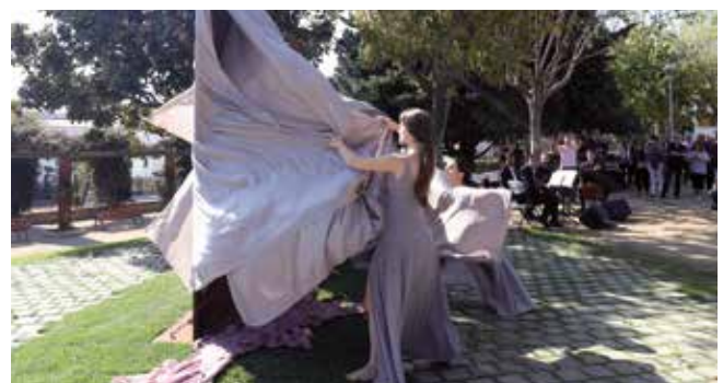
▲ Tres ballarines van descobrir l'escultura al ritme de la música. RAMON BOADELLA