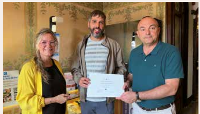
▲ Les autoritats municipals entregant el diploma acreditatiu del premi al guanyador. MIREIA CUXART

que reflecteixi la bellesa del municipi i, en aquesta ocasió, la temàtica escollida ha estat l'aigua.