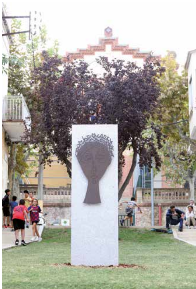
▲ El monòlit de pedra es troba al mig del jardinet del carrer de Maria Ferrer Mosset. RAMON BOADELLA

L'acte d'inauguració del monument va tenir lloc el dijous 29 de setembre a la tarda. Van acudir-hi un centenar de persones, aproximadament. La majoria eren membres de la comunitat educativa masnovina, i també ho eren les persones que van pronunciar els parlaments amb què es