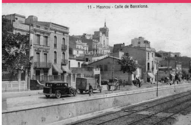
Vista del carrer de Barcelona a finals dels anys vint del segle XX.