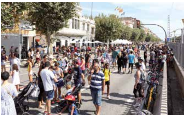
▲ Les persones van omplir l'espai que habitualment és per als vehicles.

Durant la Setmana de la Mobilitat va començar a funcionar la T-ElMasnou, que ja utilitzen més de 500 persones