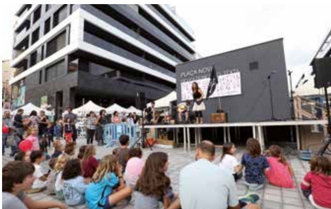
▲ Durant la jornada hi va haver jocs, tallers, exhibicions i espectacles. RAMON BOADELLA

La Fira també va servir per animar la gent a participar en la votació final dels pressupostos participatius, que ja tenen projectes guanyadors (vegeu la pàgina 18 d'aquest butlletí). Algunes de les persones que es van acostar a l'estand de l'Ajuntament van poder votar allà mateix i, a més, tothom va poder admirar-hi l'exposició de cartells dels pressupostos participatius, que es van fer amb la imatge de moltes de les persones que havien assistit a la Fira d'Entitats de l'any anterior. ■