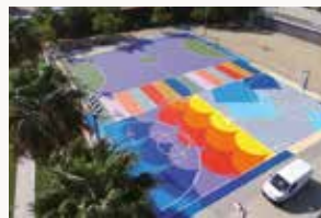
▲ Vista zenital de les pistes.

El diumenge 16 d'octubre, una festa amb el bàsquet com a protagonista va servir per inaugurar la renovació de les pistes de Pau Casals que han