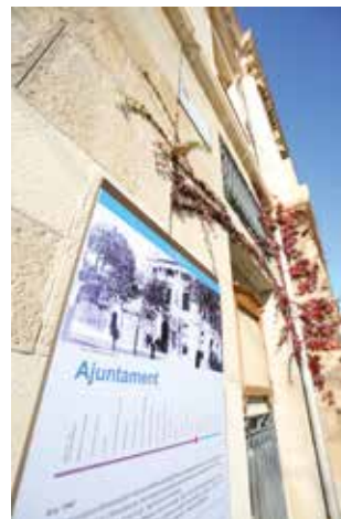
▲ Detall de la façana de l'edifici consistorial. RAMON BOADELLA

L'aplicació de proves pilot ha estat una novetat d'aquesta legislatura. S'ha implantat en zones concretes del municipi tant la recollida de residus porta a porta com la zona verda d'aparcament regulat. També ha estat el primer cop en què s'ha creat una empresa pública municipal: