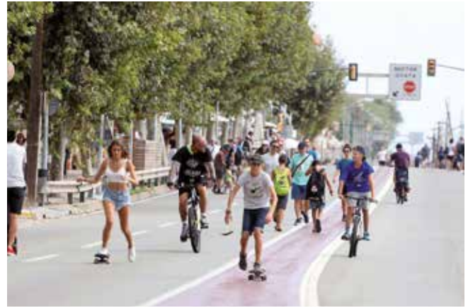
▲ Molts masnovins i masnovines es van animar a practicar el seu esport preferit.