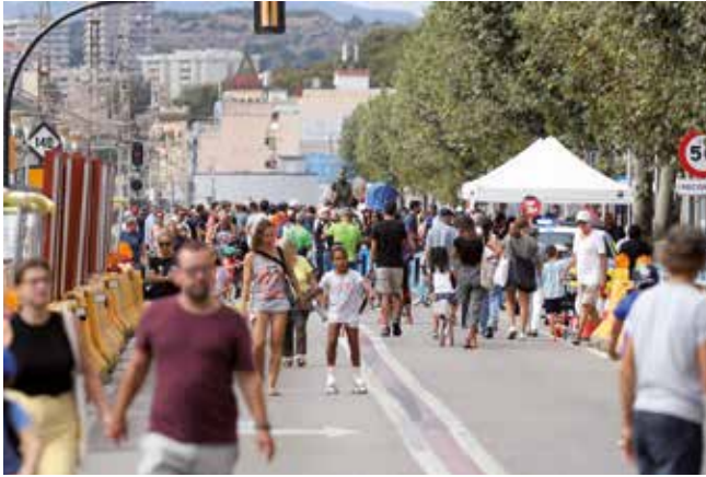
▲ Es va poder caminar per l'N-II des de Montgat fins a Vilassar de Mar.

Una jornada ludicofestiva va donar el tret de sortida a la Setmana de la Mobilitat