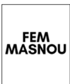
Grup Municipal de Fem Masnou

En aquest sentit, la plaça pública en què es convertirà el pati del Casino obrirà més l'espai i l'eix més utilitzat per la ciutadania. Per tal de crear un espai comú i acordat entre tots i totes, els propers mesos tan sols s'obrirà la plaça i s'iniciarà un procés participatiu sobre com es configurarà aquest espai, quins elements hi haurà i els usos que li volem donar. A més, l'espai que es configuri tindrà en compte l'entitat i el seu patrimoni, ja que se li donarà visibilitat i estarà més integrada al municipi, fet que farà que els ciutadans i ciutadanes, tant els que coneixen el Casino de tota la vida com els que fa menys que viuen al Masnou, puguin gaudir-ne i tinguin l'oportunitat de veure i conèixer aquest patrimoni tan preuat.