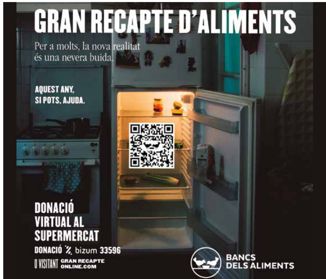
▲ La dotzena edició d'aquesta iniciativa solidària ha vist canviar el seu format a causa de la COVID-19. BANC D'ALIMENTS

Aquest any, a causa de la situació sanitària, i per tal de preservar la salut de les persones voluntàries i donants, no es podrà fer l'habitual recollida d'aliments. Es durà a terme una recollida virtual d'aliments, és a dir, fent donacions al web granrecapteonline.com i a la caixa dels supermercats, donacions que es destinaran a la compra d'aliments. Al Masnou, podreu fer-ho als establiments següents: