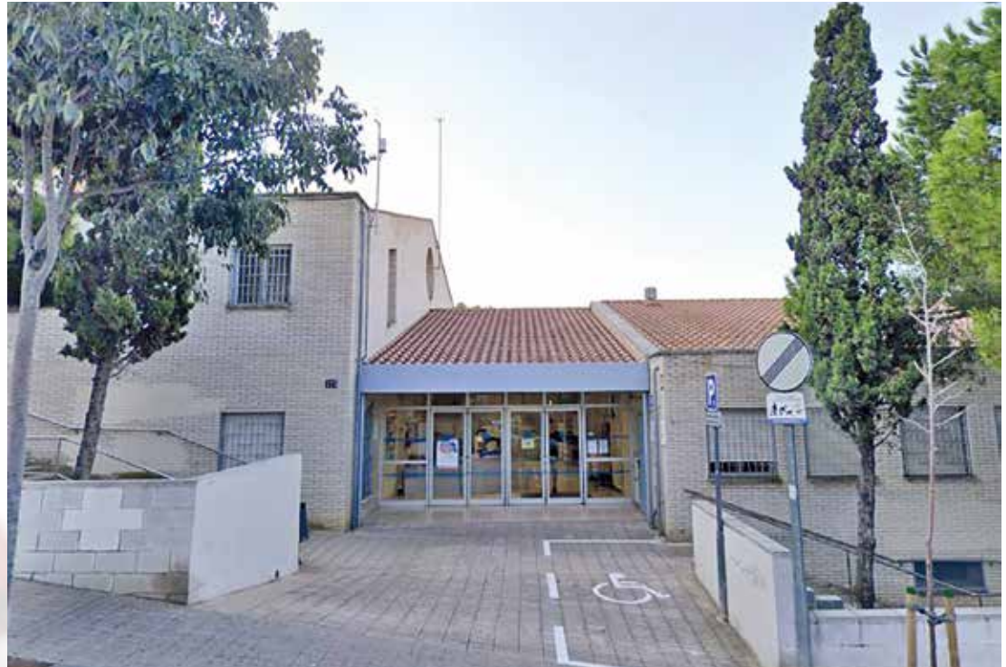
▲ Ciutadania i governants insten a la recuperació del servei d'urgències al CAP del Masnou. AJUNTAMENT

L'alcalde va qualificar les propostes plantejades de positives, si bé va instar a continuar el debat per a la recuperació de la totalitat de l'horari d'urgències un cop cessi la situació epidemiològica actual. De fet, de bon inici Oliveras va expressar tres preocupacions per part del consistori: la situació actual de pandèmia, agreujada amb l'increment del nombre de casos i un risc de contagi molt elevat, la reducció del servei d'urgències i la manca d'informació respecte al Centre d'Urgències d'Atenció Primària