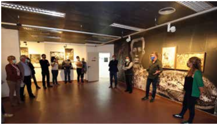
▲ "Memòria infectada", de Joan Fontcuberta, es podrà veure fins al 20 de desembre. RAMON BOADELLA

El Festival de Creació Contemporània Brama s'ajorna com a conseqüència de les restriccions aprovades per a la contenció de la pandèmia de COVID-19