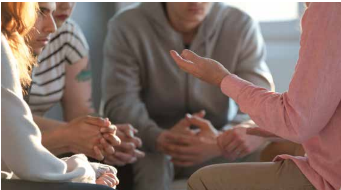
▲ Les famílies usuàries són derivades directament des dels Serveis Socials de l'Ajuntament.

Fins ara, l'Ajuntament només comptava amb el Centre Obert, un servei d'atenció diürna per a nois i noies de 4 a 15 anys que es presta través de l'empresa pública Sumar, de la qual l'Ajuntament forma part. Com a proper objectiu, es treballa per ampliar-lo, per donar cobertura a les famílies amb infants de 0 a 3 anys en situació de risc. ■