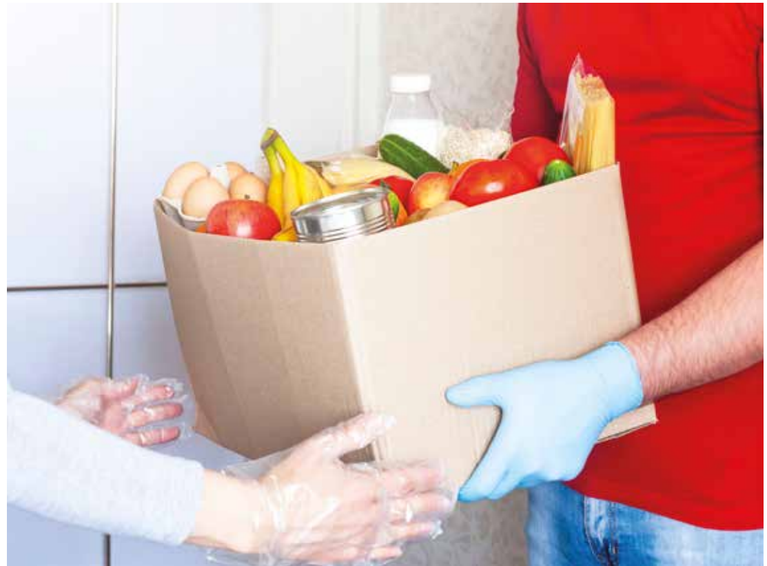
▲ La crisi de la COVID-19 ha generat nous perfils de persones que es troben en situació de pobresa.