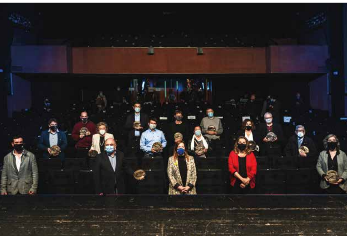
▲ A l'acte es va fer entrega de les plaques segell que distingiran les sales guardonades de manera permanent.

Va ser guardonada juntament amb una dotzena de sales més, tres de les quals també són del Maresme