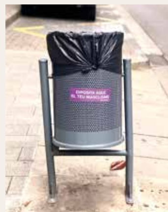
▲ El missatge es pot llegir en papereres com aquesta.

A més, l'Ajuntament s'ha adherit a la campanya impulsada per l'Institut Català de les Dones per donar visibilitat al 25-N enganxant adhesius amb el lema "Dipositada aquí el teu masclisme" a totes les papereres del Masnou.