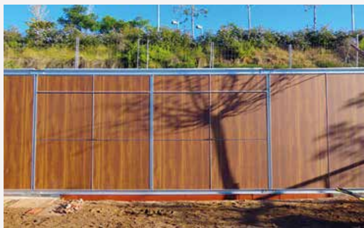
▲ El mòdul és a tocar de la zona d'esbarjo infantil. MIREIA CUXART

Amb tot, caldrà esperar l'evolució de les mesures vigents per fer front a la COVID-19 per a la seva obertura, que es preveu que serà a la primavera, un cop s'hagi fet la licitació corresponent. El cost d'aquest projecte és de prop de 120.500 euros i l'ha dut a terme l'empresa Microarquitectura, SL. ■