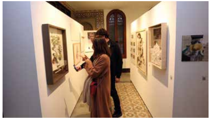
▲ Fins al 13 de desembre estaran exposades les obres dels participants al II Premi Nasevo.

d'alguns dels moments més representatius del confinament viscut a partir del mes de març d'aquest any. En el marc de les XII Jornades també hi havia prevista per al 7 de novembre una penjada de fotos del projecte "20:00 h", del col·lectiu Ruido Photo, a l'edifici municipal de Roger de Flor, que es va haver de cancel·lar. L'organització treballa per reprogramar aquesta activitat quan les circumstàncies ho permetin, així com la taula rodona prevista per al 21 de novembre en el marc de les Jornades, i la presentació del I Premi de Fotoperiodisme Héctor Zampaglione.