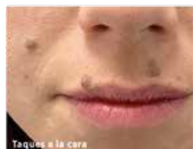
Taques a la cara

C/ Amadeu 1 32b. El Masnou 08320 / Tel. 676 658 250. Davant pàrquing gratuït