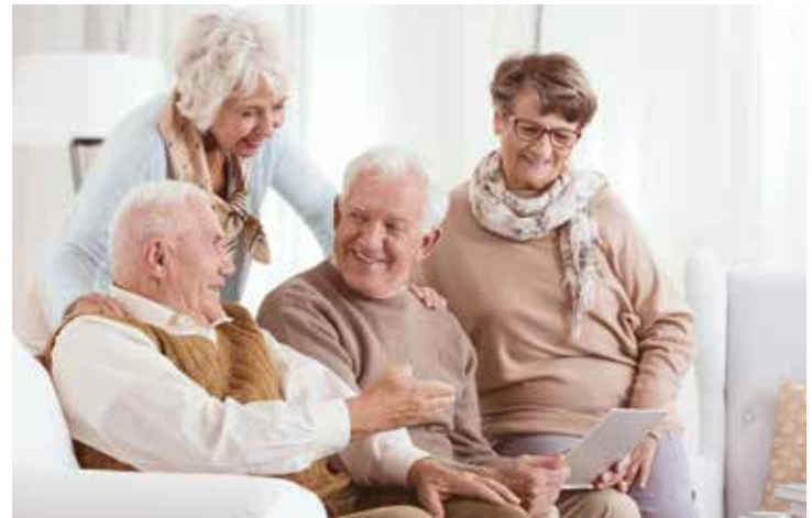
▲ El projecte Radars té per objectiu detectar les persones grans que es troben soles i actuar de forma preventiva per evitar-ne l'aïllament.

Si sou grans i voleu que us facin un seguiment, podeu trucar al 93 557 18 72 i deixar les vostres dades