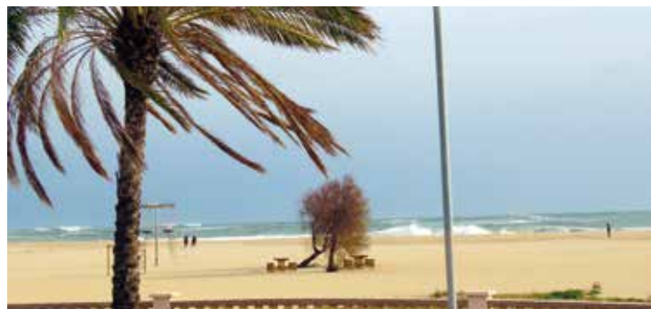
▲ El temporal Glòria va afectar greument l'emissari. DOMÈNEC CANO

El Consell Comarcal del Maresme està pendent de rebre l'atribució del fons corresponent per poder licitar l'actuació i iniciar la reparació