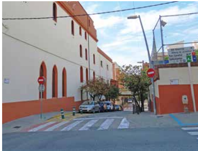
▲ El carrer de Fontanills és un dels que ha canviat el sentit de circulació. DOMÈNECCANO

El carrer de Joan Miró, al tram que va des de l'avinguda de Cusí i FortUNET fins al carrer de la Generalitat de Catalunya, és ara