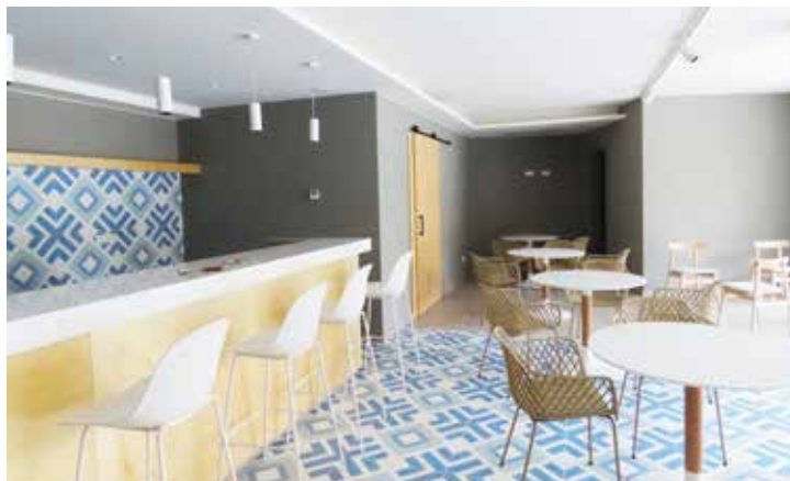
▲ El bar queda ubicat en un annex que uneix la part nova i l'antiga, al centre del complex actual. MIREIA CUXART

Les obres de construcció del nou bar del Complex Esportiu Municipal ja han finalitzat. L'espai, de prop de 90 metres quadrats, queda ubicat en un annex que es va crear durant l'ampliació de l'equipament i que uneix la part nova i l'antiga, al centre del complex actual. L'objectiu d'aquest projecte ha estat crear un indret acollidor, obert, amb la possibilitat de tenir una terrassa exterior. Després d'una licitació, en el moment de tancar aquesta edició la persona adjudicatària per a aquest