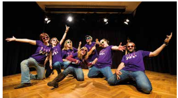
▲ Els contes es poden veure a través del canal Youtube de l'Ajuntament. VIVIM DEL CUENTU

Sessió de contes sobre sostenibilitat i reciclatge. El malvat bruixot Ció ha contaminat tot el planeta i només si entre tots i totes ajudem la fada Resi serem capaços d'aturar-lo. ■