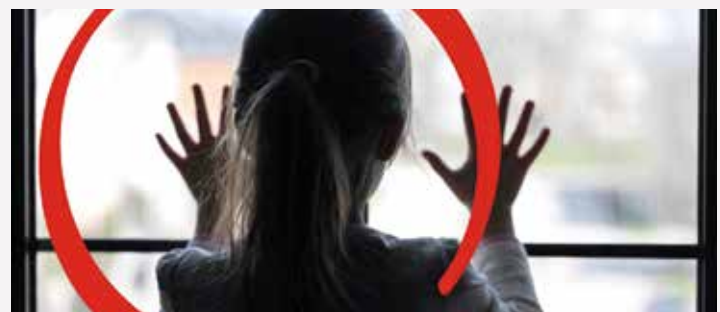
▲ L'entitat Save the Children col·laborarà amb l'Ajuntament.

La col·laboració té dos objectius: d'una banda, fer una diagnosi sobre el tractament de l'abús sexual als diferents serveis públics gestionats per l'Ajuntament i, de l'altra, aconseguir l'efectiva protecció dels infants i adolescents davant l'abús sexual. ■