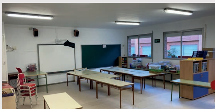
▲ Nova aula a l'espai que acollia l'antic menjador de l'escola Ferrer i Guàrdia. DOMÈNEC CANO

A l'Escola Ferrer i Guàrdia s'ha creat una nova aula per a l'alumnat de P5, a la sala que ocupava l'antic menjador del centre, que ara es troba en un edifici annex nou que es va construir l'any passat. A l'Escola Marinada s'han reparat les finestres de parvulari i s'han pintat les aules. En paral·lel, s'ha reparat la façana de l'edifici per evitar filtracions