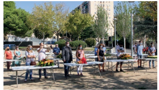
▲ Només van poder assistir-hi representants d’entitats i de grups polítics. GERARD POCH