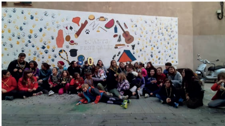
▲ Un dels actes de celebració del 50è aniversari.

L'Agrupament Escolta Foc Nou va introduir la coeducació des de la seva fundació, el setembre de 1969