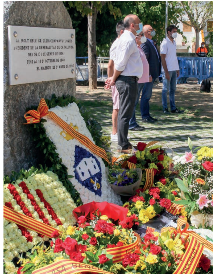
▲ Van assistir a l'acte representants dels grups polítics ERC-AM, Fem Masnou, PSC i JxCAT-Units. GERARD POCH