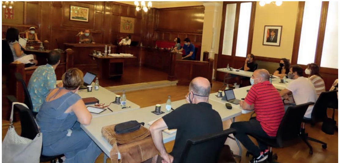
▲ Reunió entre representants de l'Ajuntament i equips directius dels centres educatius. DOMÈNECCANO

Més de 3.000 alumnes de segon cicle d'educació infantil, primària i ESO dels centres educatius del municipi van encetar el curs escolar 2020-2021 el 14 de setembre. També ho van fer els dos instituts i, dies enrere, tant les dues escoles bressol municipals com les tres llars d'infants van iniciar el procés d'adaptació. La reobertura dels centres escolars s'ha fet amb diverses restriccions a causa de la crisi sanitària de la COVID-19. Per coordinar-la, d'acord amb les directrius del Departament d'Educació de la Generalitat, les direccions dels