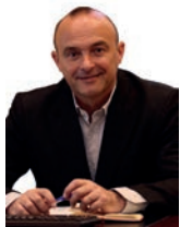
Jaume Oliveras Alcalde

Després d'un estiu marcat pels problemes de seguretat ciutadana, reprenem els reptes del mes de setembre amb el condicionant de la COVID-19, especialment pel que fa a l'inici del curs escolar.