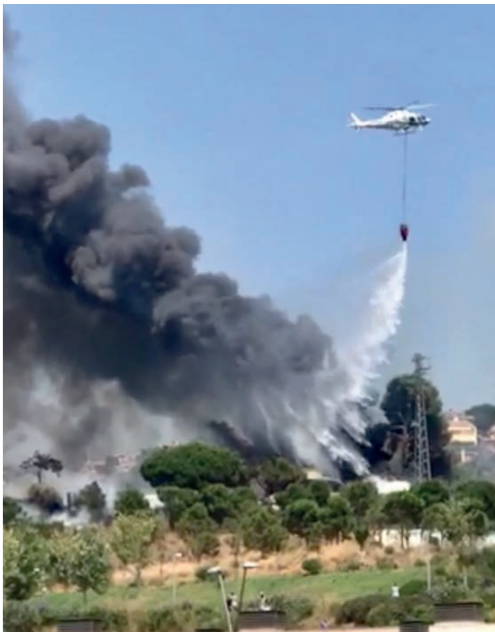
▲ Un dels helicòpters que van participar en l'extinció del foc.

Aquell dia va haver-hi tres focs més i sembla que tots haurien estat causats pel mateix motiu