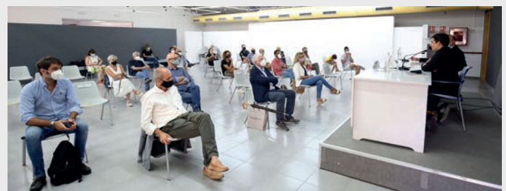
▲ La reducció de l’aforament va ser una de les mesures preventives.

La ponència va acabar amb l’optimisme del conferenciant, que va assegurar que “tenim les eines col·lectives com a societat per resistir aquestes situacions i pensar en una resposta col·lectiva”. Tant l’alcalde com el públic assistent van aportar diverses idees relacionades amb la dissertació de Jordi Muñoz que van generar un fructífer debat a l’entorn de les noves perspectives per a la societat, la política i les institucions després de la COVID-19. ■