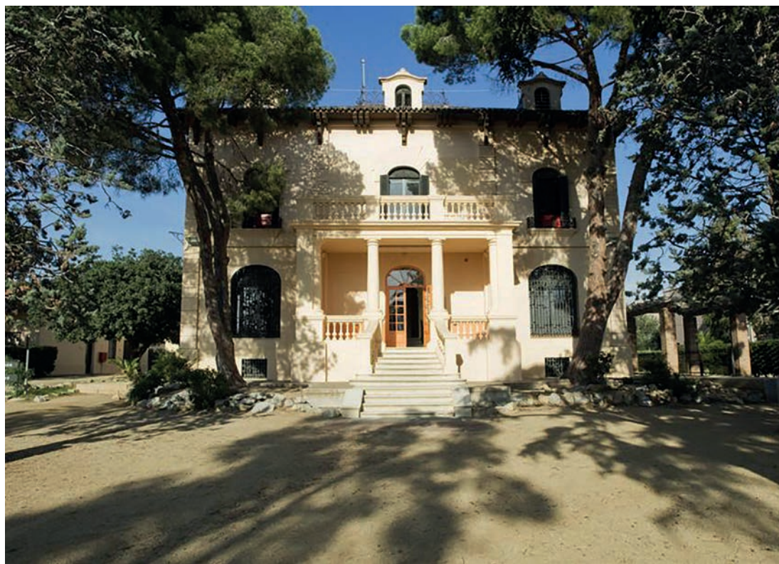
▲ L'alberg Josep M. Batista i Roca és un equipament turístic que gestiona l'Agència Catalana de Joventut.

Es vol crear un altre recurs estable per als joves que s'han integrat al municipi