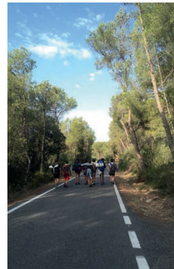
▲ Una de les excursions de l'entitat. AE FOC NOU

a les sortides de cap de setmana, precisen que n'organitzen de diversos tipus. Hi ha les d'unitat, en què es treballen objectius marcats, les esportives i la de la neu, que compta amb una cerimònia de compromís i estones de diversió en indrets nevats. A l'octubre té lloc una altra cita assenyalada, la sortida de pas de branca, en la qual tot l'agrupament acomiada el curs anterior i dona la benvinguda al que tot just comença.