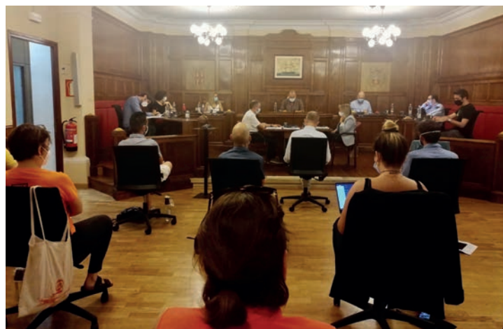
▲ Sessió plenària del 16 de juliol.

L'abstenció de Fem Masnou va tenir quatre motius. Neus Villarrubia els va resumir en: "participació de baixa qualitat,