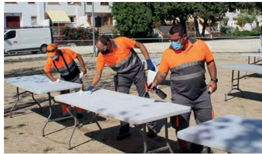
▲ El personal municipal es va encarregar d’extremar les mesures higièniques.

restriccions), va fer esment de la necessitat de mantenir els actes de la Diada per refermar el compromís com a Ajuntament envers “les llibertats socials i nacionals del nostre poble”. Amb tot, el batlle va expressar un desig per a l’any vinent: “Poder recuperar la normaltat i commemorar i reivindicar la Diada en les millors condicions possibles”. ■