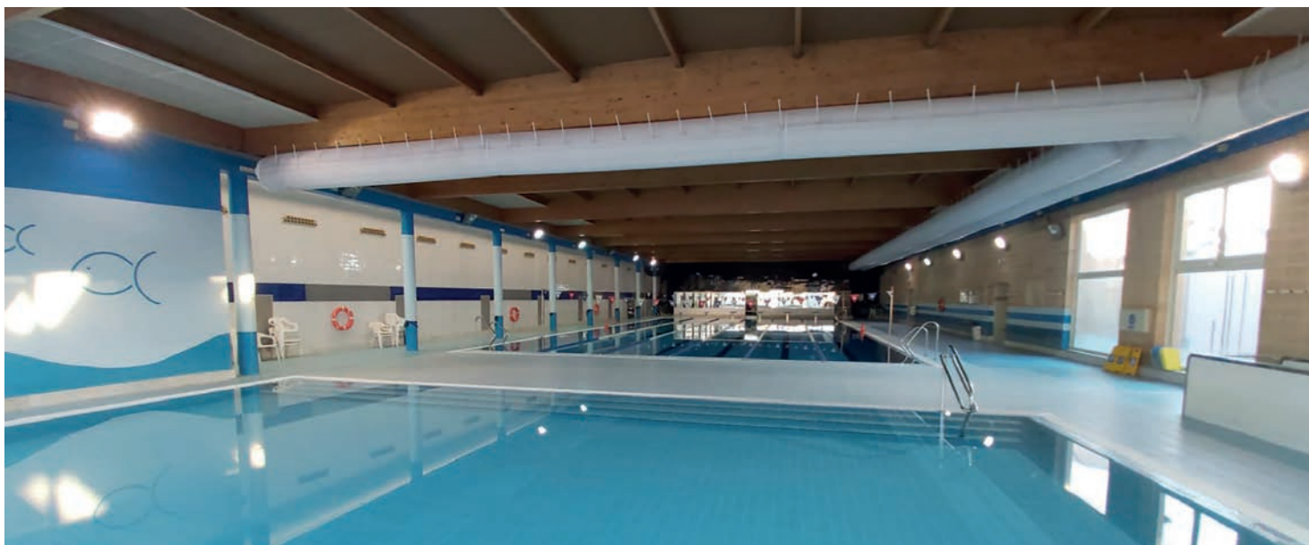
▲ Vista de les piscines municipals.