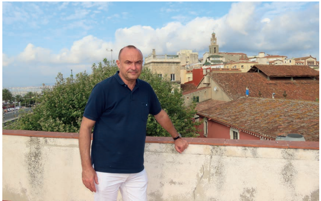
▲ El batlle, fotografiat al terrat de l’Ajuntament el 28 d’agost. DOMÈNEC CANO

La pandèmia de la COVID-19 va esclatar el març passat, al cap de nou mesos d’iniciar-se el mandat. Com ha impactat en el funcionament de l’Ajuntament? Hem hagut d’introduir molts canvis en les prioritats per fer front a les conseqüències socials i econòmiques d’aquesta crisi sanitària. També ha comportat un treball molt intens per adequar el funcionament de l’Ajuntament, en molts àmbits. Es pot citar l’adaptació del personal