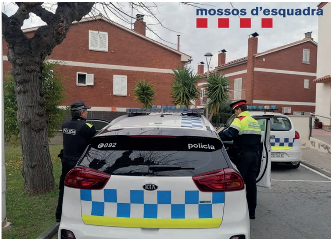
▲ Agents dels dos cossos de seguretat treballant plegats al Masnou.

A banda, el consistori ha constituït la Taula de Seguretat Interna, en la qual participa personal tècnic de diverses àrees de l'Ajuntament (Policia Local, Acció Social, Urbanisme, Intervenció, Secretaria...) per potenciar la coordinació, intercanviar dades i resoldre qüestions de tipus logístic, jurídic i administratiu. Finalment, també es vol actuar fent intervencions a l'espai públic. En primer lloc, es preveu que properament finalitzin els tràmits administratius per adquirir càmeres de videovigilància. En segon lloc, ja s'estan duent a terme millores en la il·luminació d'alguns carrers i places. ■