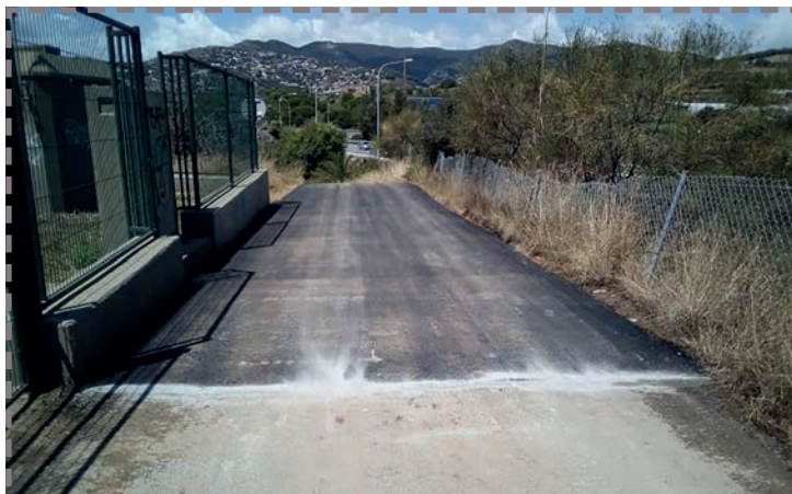
▲ S'ha asfaltat un tram de via que abans era de terra.

L'incendi va ocasionar una fumera de grans dimensions que va obligar a tallar el trànsit de l'autopista C-32. Una unitat de bombers i tres helicòpters, a més de la Policia Local, Protecció Civil i diverses unitats d'agents rurals, van treballar per extingir-lo. Dues ambulàncies van atendre una persona per intoxicació i erosions, i una altra per crisi nerviosa. Diversos agents de la policia també van ser atesos per inhalació de fum durant l'evacuació de persones. L'Ajuntament del Masnou agraeix la col·laboració de totes les persones que van participar en l'extinció de l'incendi. ■