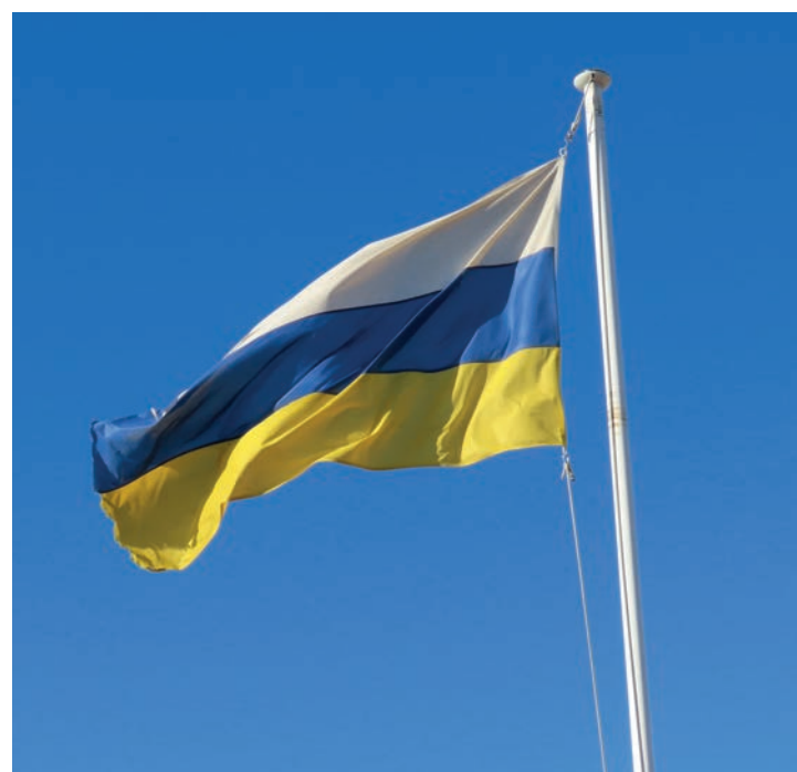
▲ Bandera del Masnou.

Bona part dels consistoris consideren que necessiten disposar dels seus recursos per fer front a la crisi de la COVID-19