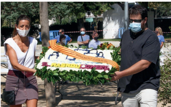
▲ Les entitats van fer les ofrenes de forma esglaonada. GERARD POCH