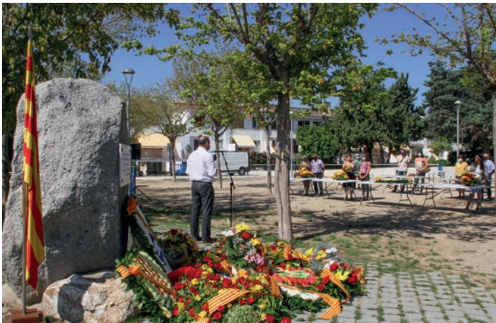
▲ Les flors es van dipositar al monòlit que recorda el president assassinat.