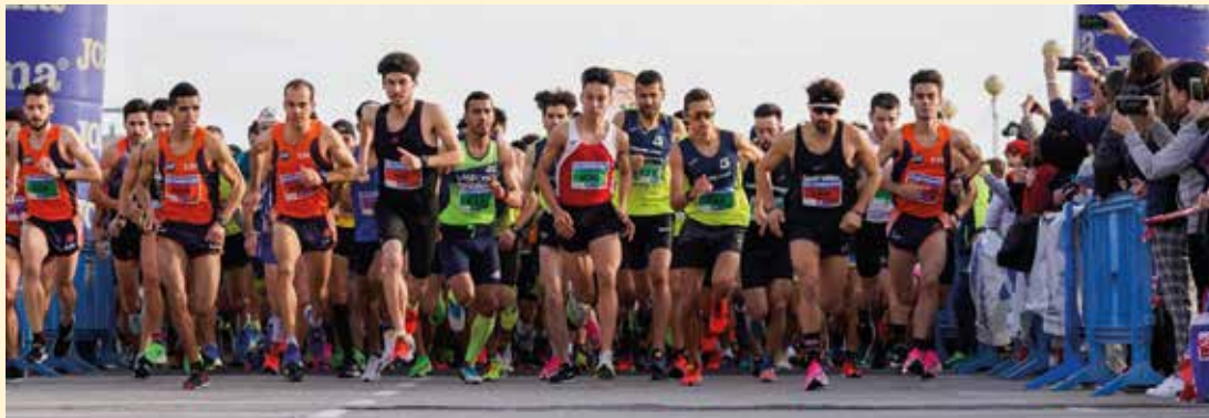
▲ És la 41a edició d'aquesta Cursa de Sant Silvestre, la més antiga de Catalunya. LA SANSI

L'organitzador de l'esdeveniment és l'Ajuntament del Masnou, i l'entitat encarregada de la gestió i desenvolupament de la cursa és el Club Atletisme la Sansi, juntament amb el suport de la Diputació de Barcelona. ■