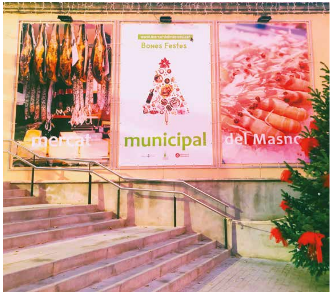
▲ L'entrada al Mercat guarnida per rebre el Nadal. MIREIA CUXART

Durant el confinament, els i les paradistes van treballar a l'una per abastir els compradors i compradores. D'aquesta situació en va néixer el servei de repartiment a domicili per, segons expliquen, "garantir a la