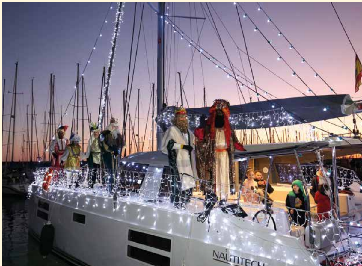
▲ L'arribada de Ses Majestats els Reis d'Orient al Masnou serà retransmesa telemàticament. RAMON BOADELLA

Gebre, assistirem al descobriment de la Terra amb els warao de les Índies Occidentals, descobrirem el miracle del canelobre jueu que va estar encès durant vuit dies seguits i entendrem per què a la Xina celebren el cap d'any dues vegades. Tot això sense oblidar-nos de fer un repàs a algunes de les nostres tradicions, com el tió o el caganer.