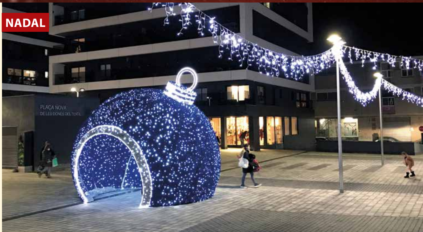
▲ La gran bola de Nadal a la plaça Nova de les Dones del Tèxtil és la novetat lumínica d'aquest any. JOAN CIMA

> Aquest Nadal, comerç local Malgrat no poder dur a terme la Fira de Nadal, El Masnou Comerç ha engelat la campanya "Aquest Nadal segur que rasques alguna cosa", que regalarà més de 100 premis per gastar en el comerç federat. En concret, hi haurà