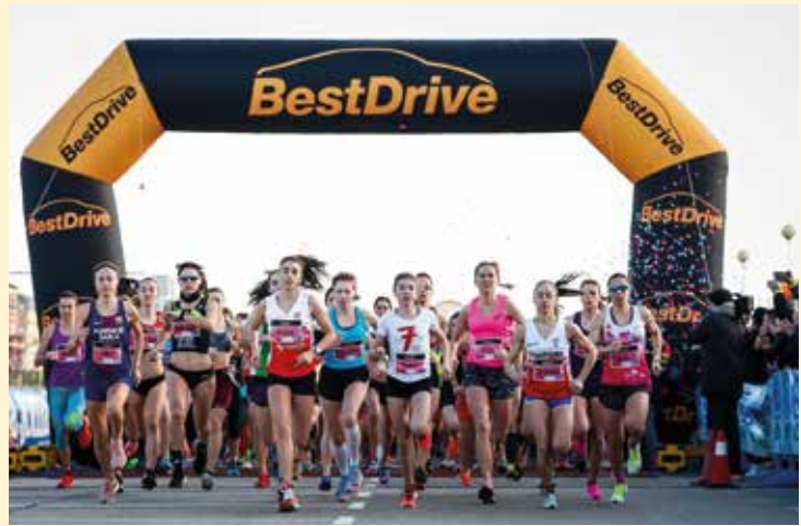
▲ Atletes d'àmbit internacional i popular es barregen en aquesta cursa del Masnou.

amb un límit de 900 persones inscrites, tant de l'àmbit internacional com atletes populars. Aquest any no es faran curses infantils, amb la intenció de reduir la participació i fer d'aquest un esdeveniment segur i controlat, tenint en compte que aquestes curses sempre compten amb la col·laboració dels pares i mares i la presència de molts familiars.