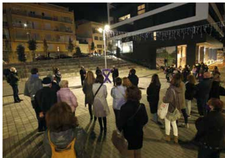
▲ El manifest es va llegir a la plaça Nova de les Dones del Tèxtil. RAMON BOADELLA

A primers de novembre, la Junta de Govern Local va aprovar de