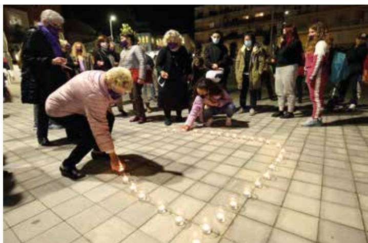
▲ Durant l'acte es va fer l'encesa d'espelmes en suport a les víctimes. RAMON BOADELLA

Amb el confinament ha incrementat el risc en nombre i intensitat de les agressions d'aquesta xacra social. Si patiu algun tipus de violència masclista o sabeu d'algú que en sigui víctima, buqueu assessorament i suport especialitzat: CIRDA del Masnou (tel. 93 557 18 70) o línia especialitzada (900 900 120). ■