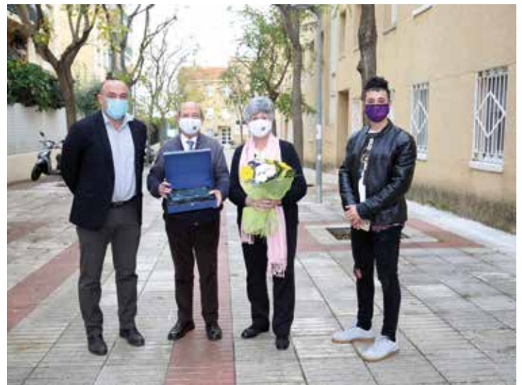
▲ L'alcalde i el regidor de Cicles de Vida van visitar les parelles homenatjades. RAMON BOADELLA.