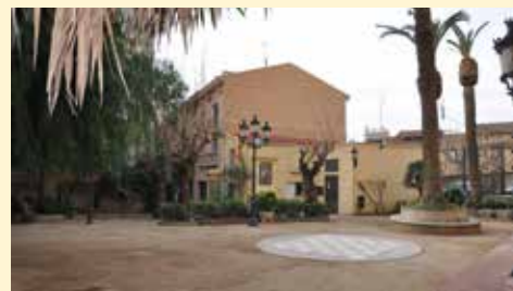
▲ Els concerts es duran a terme a l'aire lliure, als jardins de Can Malet.

93 540 37 40 dimarts i divendres, de 17 a 19 h.