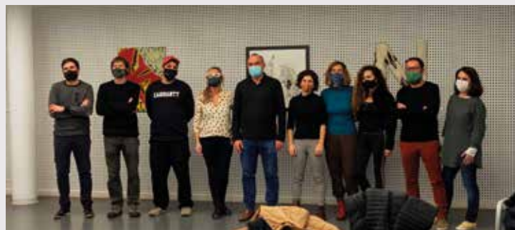
▲ L'alcalde i la regidora de Cultura van trobar-se a la sala amb els primers artistes que participen en el projecte. RAMON BOADELLA

Cada any es repetirà la convocatòria perquè els artistes plàstics hi presentin les seves propostes