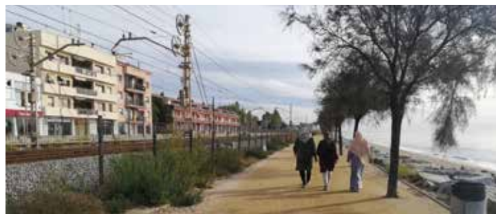
▲ La nova il·luminació anirà des de l'altura del carrer del Brasil fins al terme municipal de Premià de Mar. DOMÈNECCANO.

Han votat 2.499 persones, xifra que suposa un 12,31% de participació. Els vots emesos, però, han estat 7.151. Això s'explica perquè cada persona podia votar entre un i tres projectes, els que preferís d'entre les 14 propostes sorgides de la jornada de prioritització que va tenir lloc el 22 de setembre. Inicialment n'eren 15, però una es va descartar perquè ja s'havia inclòs al pressupost municipal com a inversió ordinària. En aquesta votació final tenien dret a vot totes les persones majors de 16 anys empadronades al Masnou abans de l'1 de novembre del 2020. Més del 93% de votants hi van participar a