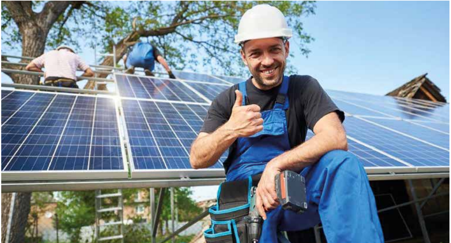
▲ En aquesta primera fase, la iniciativa es destina als habitatges unifamiliars. MOMENT SOLAR