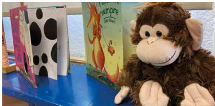
▲ Objectes d'una aula de l'Escola Ferrer i Guàrdia. DOMÈNECCANO

Les xerrades virtuals es faran a través de plataforma Zoom. Es pot trobar l'enllaç i la informació per connectar-s'hi a www.elmasnou.cat/educacio .