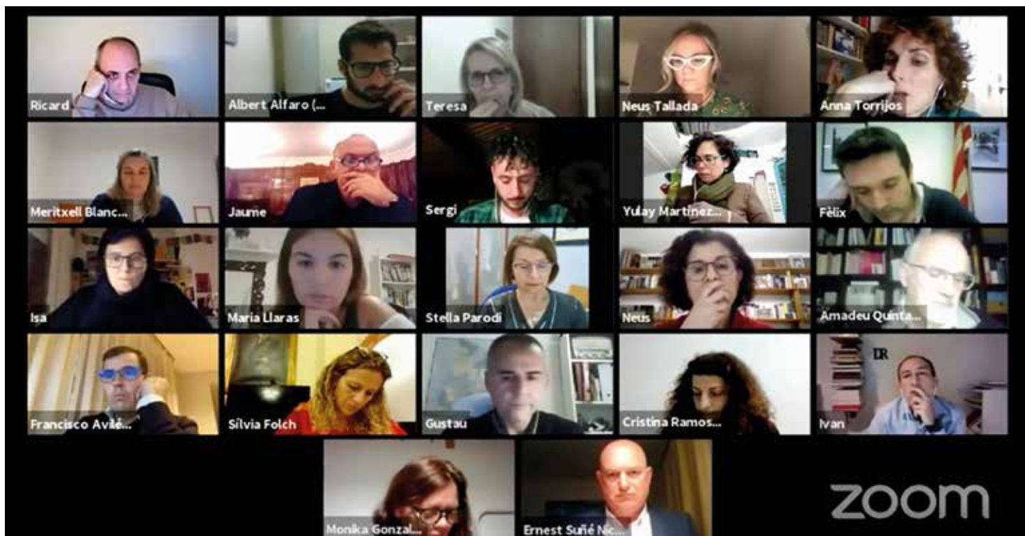
▲ Captura de pantalla del Ple municipal telemàtic del 28 de gener. ZOOM