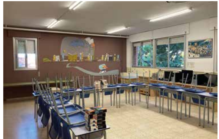
▲ Aula de l'Escola Ferrer i Guàrdia. DOMÈNEC CANO

Al fins ara Col·legi Lluís Millet hi estudiaran també, a partir del curs vinent, alumnes d'ESO