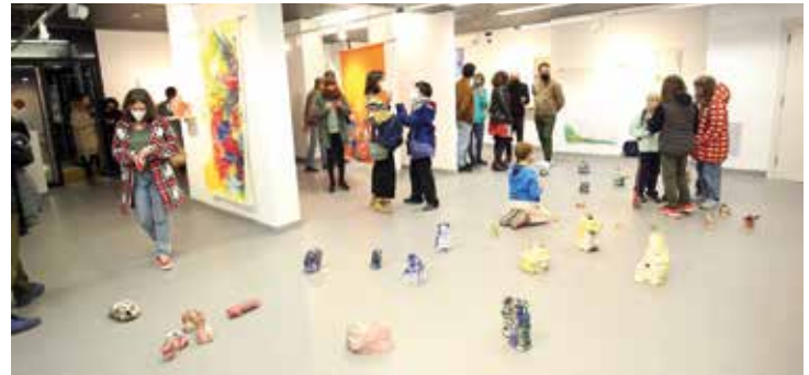
▲ Obertura de la mostra "El cielo está enladrillado", a l'Espai Casinet.

Tornant a les mostres del febrer, Feduchi exposa al Masnou els quadres que va pintar durant el confinament de la primavera passada. Les flors i les fruites que tenia a mà en són les protagonistes. Alguns dels quadres estan emparellats, resultat de l'exercici que ha fet l'artista en pintar el mateix motiu amb algunes variacions, per concloure que és impossible pintar dos cops el mateix quadre. L'exposició compta també amb algunes peces de ceràmica. Es pot afirmar que aquesta mostra permet cloure la primera exposició de l'artista al Masnou, que es va haver de suspendre per la declaració del primer