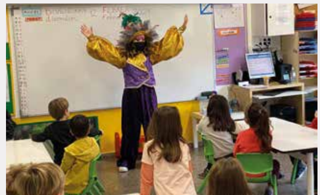
▲ Nens i nenes paren atenció a les cançons i les paraules de la reina Carnestoltes.

P4 i P5). A l'Escola Lluís Millet també va passar una estona amb l'alumnat de 1r i 2n de primària. Malgrat que enguany la COVID-19 ha aigualit el carnaval a tot arreu, la reina Carnestoltes va voler compartir les seves ganes de gresca amb els infants masnovins, cantant i ballant amb ells. A més, els nens i nenes van mostrar-li les seves disfresses i van explicar-li de què es pensaven disfressar durant el cap de setmana. ■