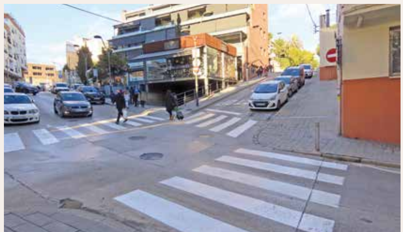
▲ Passos de vianants pintats de nou. DOMÈNEC CANO

franja força extensa del municipi, adjacent a l'N-II i entre la carretera d'Alella, en un extrem, fins a l'avinguda del President Kennedy, a l'altre. Cap a l'interior, aquesta franja ha quedat delimitada pel carrer de Navarra, englobant el nucli antic i bona part del centre, i pel carrer de la Ciutat Vila Jardí, ja a la zona d'Ocata. La inversió que s'hi dedica és de 17.553,88 euros. L'empresa encarregada d'executar-la ha estat Lonix Invest SL. ■