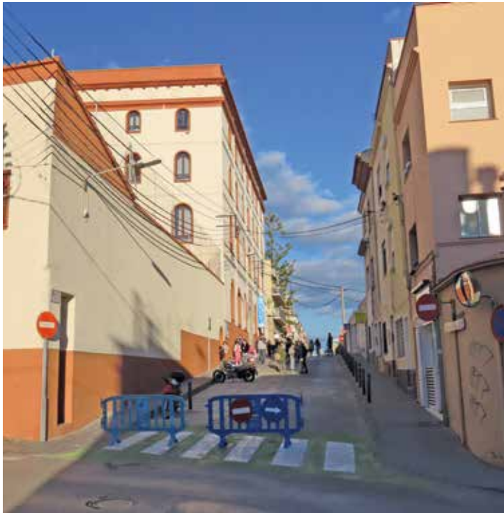
▲ Els vehicles ja no poden circular al tram del carrer de Jaume I on es troba l'escola. DOMÈNEC CANO

L'actuació genera una superilla amb accés exclusiu per als vehicles que entrin o surtin dels guals