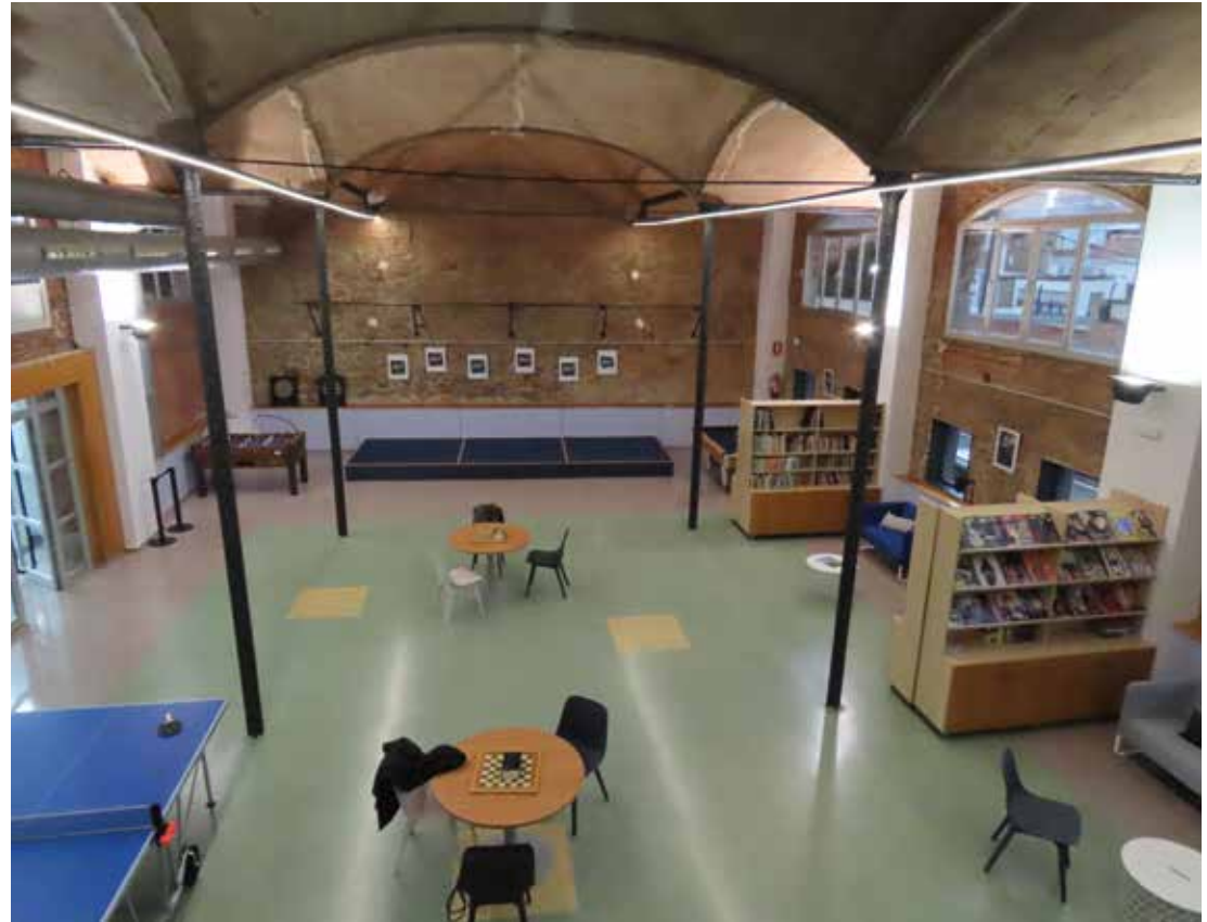
▲ El punt de trobada s'ubica a la nau principal de l'antiga fàbrica. DOMÈNEC CANO

Just al costat de l'entrada principal, on es troba el punt d'informació, s'alça la nau principal de l'equipament, un