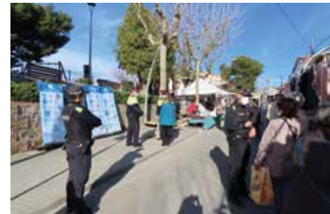
▲ Agents d'ambdós cossos informaven les persones que transitaven pel mercat setmanal. MIREIA CUXART

en comerços, es recomana dur sempre ben custodiats els diners, en bosses en bandolera al pit i amb tancaments segurs, i dur-ne només la quantitat aproximada que es necessita. No s'ha de fer ostentació d'objectes de valor o de diners ni confiar-se si algú desconegut intenta distreure'ns. També s'ha de parlar molta atenció en llocs amb aglomeracions de gent. A més, i entre altres consells, és important ocultar el codi PIN quan es paga amb targetes de crèdit i anul·lar-les immediatament si es perden o algú les sostreu. ■