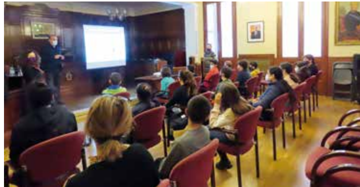
▲ Visita d'alumnes a l'Ajuntament.

El següent pas serà treballar el projecte d'enguany, que com en l'anterior edició, troncada per la COVID-19, posarà el focus en el medi ambient; en concret, en la reducció de residus. La voluntat, si l'evolució de la pandèmia ho permet, és mantenir-ne el format habitual; és a dir, presencial i aplicant les mesures corresponents en totes les fases. En aquest sentit,