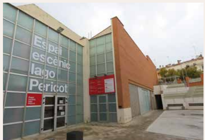
▲ Vista de la façana de la sala. DOMÈNEC CANO

programació d'arts escèniques. A dins, al vestíbul i altres espais interiors, s'hi han pintat de nou les parets, amb els colors que identifiquen l'Espai Escènic Iago Pericot, el vermell i el negre, i s'hi ha renovat i millorat la senyalització. La inversió que s'hi ha fet és d'uns 15.000 euros, aproximadament. El disseny de la retolació és obra de Josep Puig. Les feines les han dut a terme l'empresa Cau d'Imatge i les brigades municipals. L'Espai Escènic Iago Pericot es troba a l'antic recinte fabril de Ca n'Humet, que també estrena un rètol que l'identifica. ■