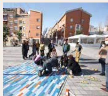
▲ Instal·lació de l'obra creada per alumnes.

Més de 500 alumnes del Masnou van crear i pintar les peces de fusta que formaven el mosaic,