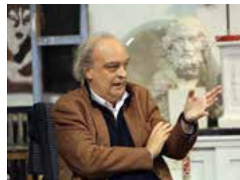
▲ Enrique Vila-Matas.