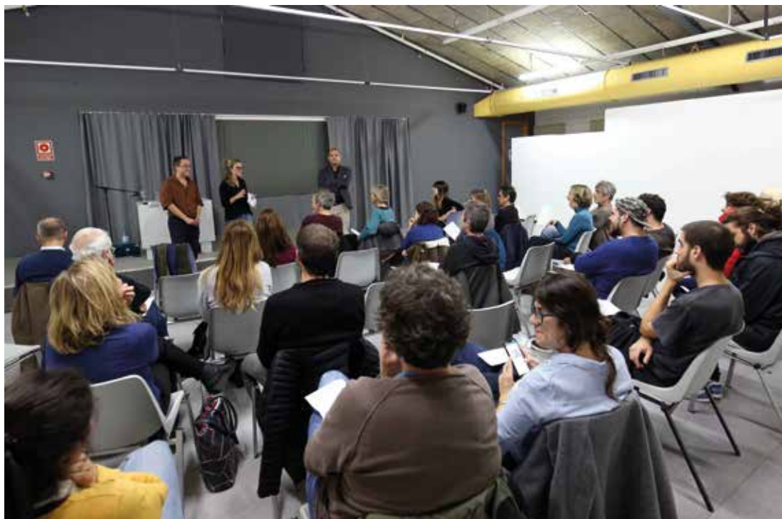
▲ El cicle d'actes del Brama s'ha estès del 27 de novembre al 4 de desembre. RAMON BOADELLA

Bona acollida del I Festival de Creació Contemporània del Masnou