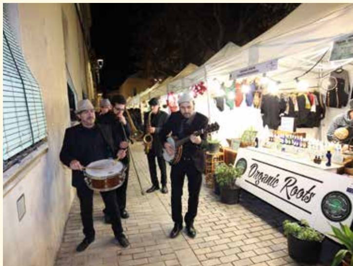
▲ Una banda va animar el carrer amb la seva música. RAMON BOADELLA

La Fira va marcar l'inici de la campanya comercial "Queda't", que s'estendrà fins al 31 de desembre