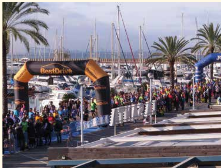
▲ El circuit de la cursa és de 5 quilòmetres. LA SANSI

El 26 de setembre, Sant Esteve, la cursa més antiga de Catalunya assolirà els quaranta anys de convocatòria. Sobre un circuit de 5 quilòmetres al llarg del port esportiu i del passeig Marítim, la del Masnou també és la tercera cursa de finals d'any amb més participants a Catalunya. Les inscripcions, que ja són obertes, tenen un límit de 2.200 places.