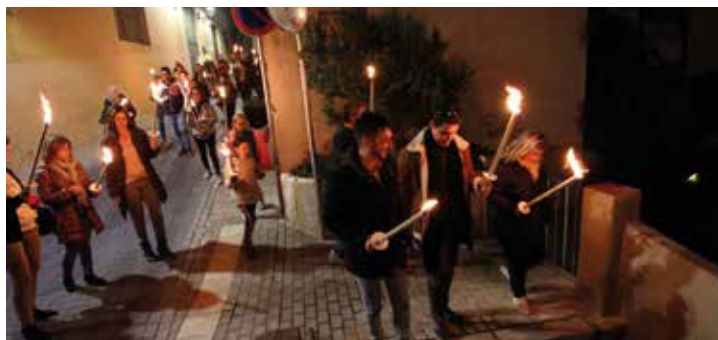
▲ La baixada de torxes va ser una mostra més de suport a les dones que pateixen violència masclista.