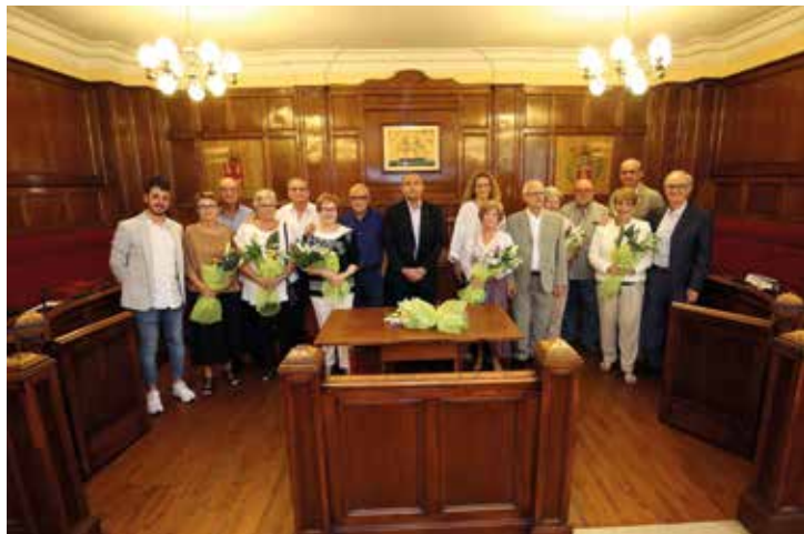
▲ Sis parelles van ser homenatjades el 19 d'octubre. RAMON BOADELLA

L'Ajuntament celebra cada any la festa de les Noces d'Or, un acte en què es ret homenatge a totes les parelles que fan cinquanta anys de casades. Aquest any 2019, el nombre de parelles del municipi que han celebrat a l'Ajuntament el mig segle de convivència també són xifres rodones: una desena o, el que és el mateix, una vintena de masnovins i masnovines. L'enhorabona!