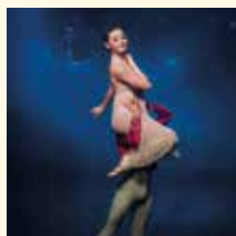
▲ La màgia de l'hivern es podrà veure a El ballet del Trencanous.

banda, la Jove Orquestra de Cambra del Masnou (JOCEM) i l'historiador, músic i divulgador, Carlos Calderón, oferiran un acostament al tradicional Concert de Cap d'Any de la Filharmònica de Viena. De l'altra, s'hi representarà un clàssic de les dates de Nadal: El ballet del Trencanous , un conte de fades amb música de Piotr Txaiovski.