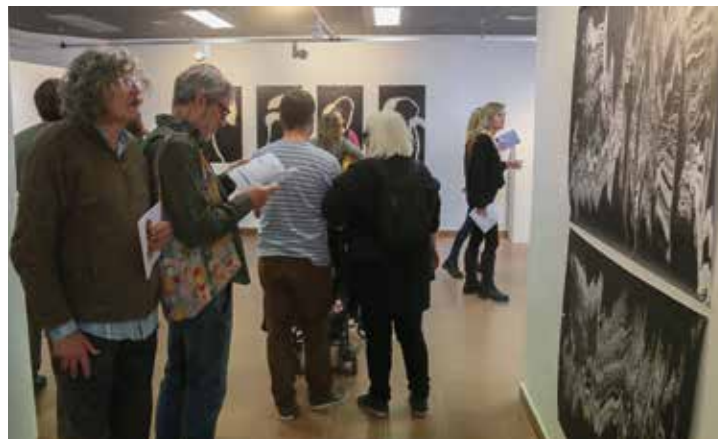
▲ Les obres dels participants al Brama són exposades a l'Espai Casinet. RAMON BOADELLA

El Festival, entre els seus objectius, ha volgut difondre la tasca realitzada des de diverses manifestacions per artistes que, tot i la seva joventut, ja tenen un ampli reconeixement. En aquest sentit, el 30 de novembre es va inaugurar la mostra expositiva a l'Espai Casinet, que és l'eix al voltant del qual s'ha estructurat el Festival i, novament, les autoritats municipals van ser-hi presents, acompanyades pels artistes que formen part de l'exposició. La regidora va tornar a manifestar la satisfacció de l'Ajuntament per participar en una iniciativa com aquesta i col·laborar conjuntament amb Blanc de Guix. També va destacar que la Fundació La Calàndria hagi fet possible la publicació del catàleg, que ajuda a entendre molt millor l'exposició i que és un valor afegit al conjunt del Festival, i va donar molta importància al fet que la convocatòria s'hagi estès a diversos espais de la vila. D'altra banda, l'alcalde va remarcar el suport als creadors joves i les noves manifestacions artístiques. Va posar en relleu la tasca de Blanc de Guix per difondre la tasca dels joves creadors a la vila i va remarcar la voluntat