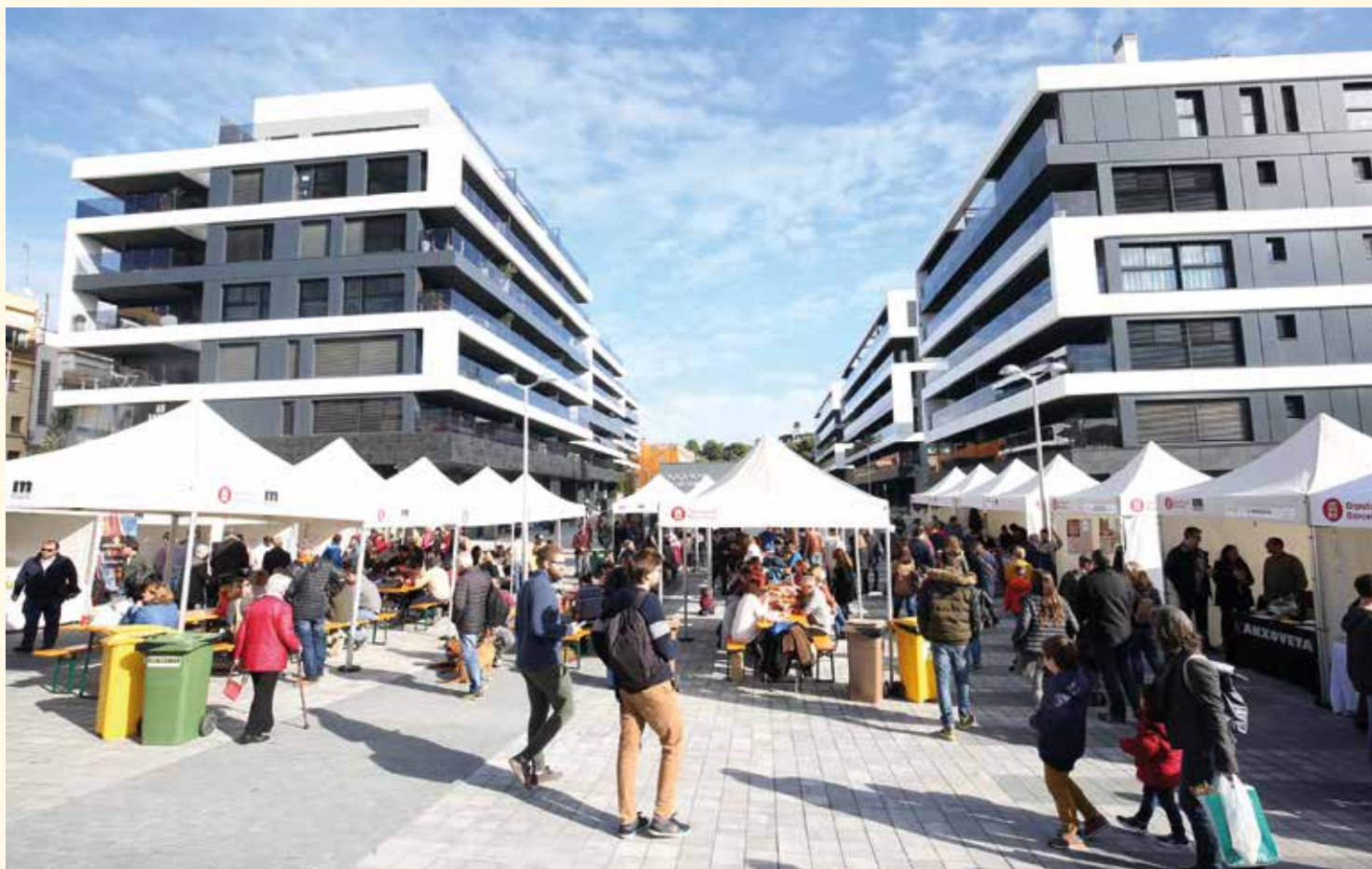
▲ La plaça Nova de les Dones del Tèxtil va acollir la primera mostra gastronòmica "Tasta i Cuina el Masnou". RAMON BOADELLA