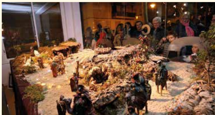
▲ El pessebre municipal s'exposa a Els Vienesos. RAMON BOADELLA

E l Nadal dona cabuda a tot tipus d'activitats. Al Masnou, les propostes per a aquestes festes vinculen l'entreteniment i l'esbarjo a sessions culturals, competicions esportives o projectes solidaris, entre d'altres. Així, a les activitats tradicionals s'hi sumen un seguit d'iniciatives complementàries amb l'objectiu que tothom gaudeixi d'uns dies de bons plans per als més petits, però també per als grans.