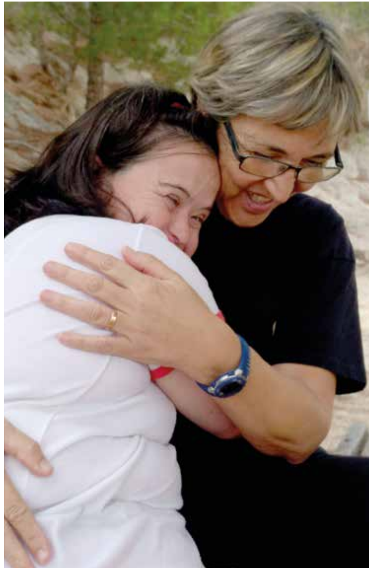
▲ L'entitat dona suport a persones amb dificultats especials. FUNDACIÓ EL MARESME

Aquesta entitat, que ja supera els cinquanta anys, va néixer gràcies a l'impuls d'un grup de famílies preocupades per la situació dels seus fills i filles que, en aquell moment, es trobaven a casa desatesos i en situació de marginació social. Una vegada els primers professionals van anar assolint experiència i formació, van fer un esforç d'especialització i de millora de l'atenció donant una continuïtat a la tasca de l'escola d'educació especial i creant els primers tallers per atendre les persones amb discapacitat.