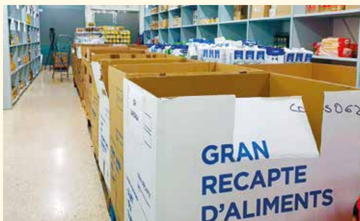
▲ Al Masnou, els aliments recollits al Gran Recapte es van emmagatzemar a La Sitja.

Només al Centre de Distribució d'Aliments La Sitja van acudir-hi 35 persones voluntàries, a més de les que hi havia distribuïdes als supermercats. Entre totes les mans que van ajudar-hi, cal comptar les de l'alumnat de 4t d'ESO de l'Escola Immaculada-Escolàpies del Masnou, com a part de les hores de servei comunitari del currículum escolar i dins el marc del conveni signat entre aquest centre educatiu i la Creu Roja. També hi van participar menors del Centre Obert Maricel.