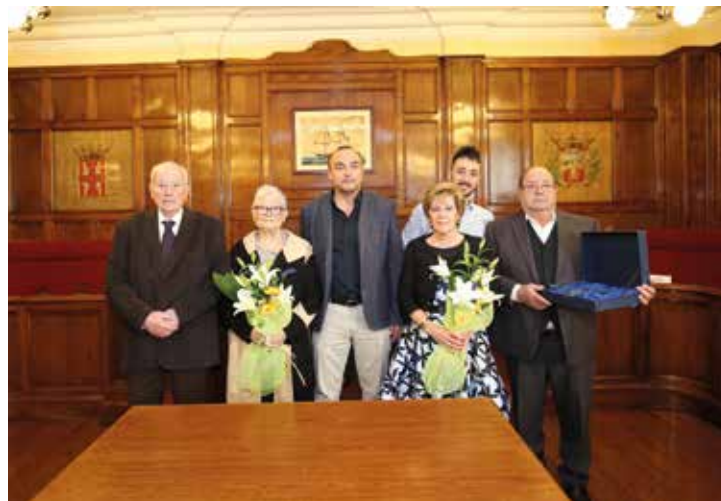
▲ Dues parelles més van celebrar-ho el 23 de novembre. RAMON BOADELLA

Per felicitar i obsequiar les parelles que compleixen cinquanta anys compartint vida, il·lusions i esforços, s'organitza una recepció a la sala de plens del consistori, amb les autoritats municipals i amics i familiars de les persones homenatjades. Enguany, els actes es van celebrar els dissabtes 19 d'octubre i 23 de novembre. ■