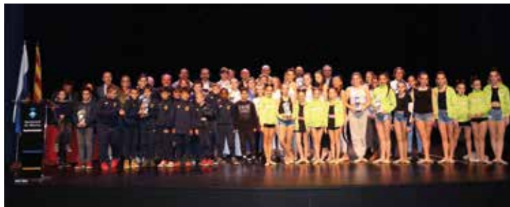
▲ Fotografia conjunta d'aquesta edició 2019.

U n any més, el Masnou va lliurar els guardons als i les esportistes i entitats esportives a la Nit de l'Esport per destacar els èxits esportius de la temporada 2018-2019. L'esdeveniment, en forma de gala, va assolir la sisena edició el divendres 29 de novembre al vespre, a l'Espai Escènica.