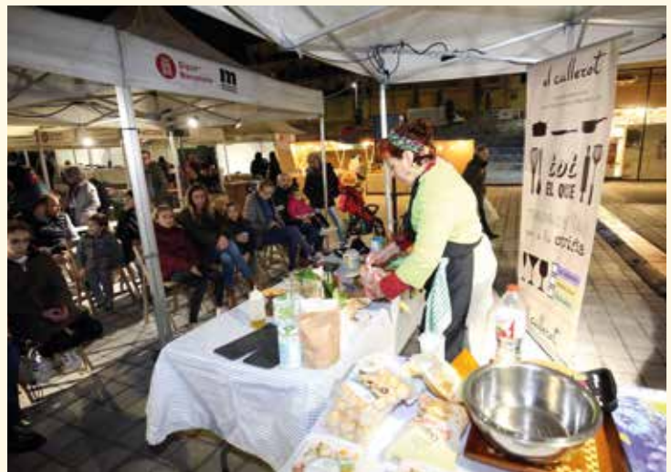
▲ Exhibició de cuina a la mostra gastronòmica. RAMON BOADELLA