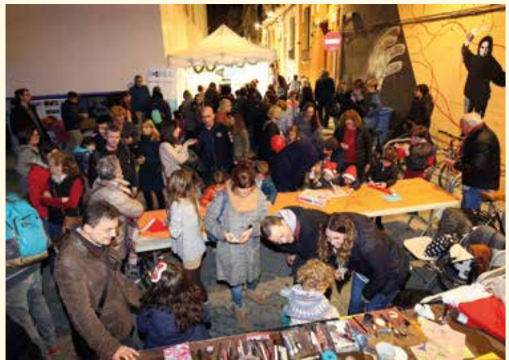
▲ Els tallers de manualitats infantils van tenir molta bona acollida.