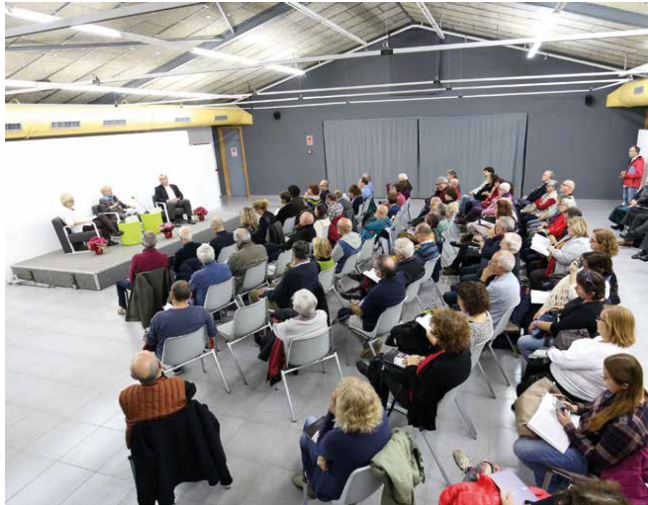
▲ La Sala Joan Comellas es va omplir de gom a gom per escoltar la historiadora masnovina. RAMON BOADELLA

Tal com va explicar Toran, bona part del llibre està dedicada a les víctimes, amb les seves biografies i els processos repressius als quals van ser sotmeses: "És potser la part més atractiva del llibre, però no es pot entendre sense llegir l'entramat legal", comentava en relació amb la construcció, per part del franquisme, d'un engranatge institucional pensat per estendre la por i eliminar la