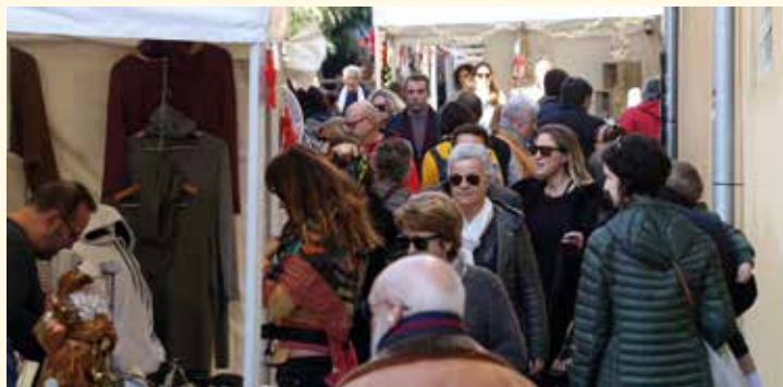
▲ El carrer de Roger de Flor es va omplir d'expositors. RAMON BOADELLA

Per segon any, la Fira de Nadal es va instal·lar al centre del Masnou