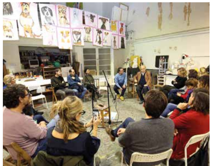
▲ La seu de Blanc de Guix va acollir l'acte final del Festival. RAMON BOADELLA