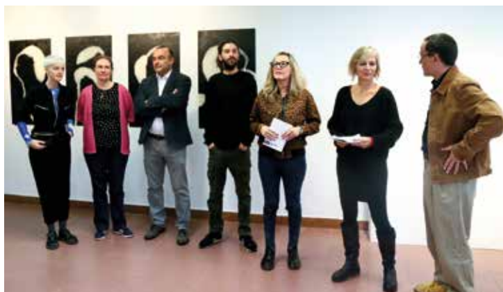
▲ Autoritats municipals amb els organitzadors del Brama i alguns dels i les artistes participants. RAMON BOADELLA

La xerrada conjunta entre el comissari del Festival i l'escriptor Enrique Vila-Matas, el 4 de desembre, va desafiar el temporal que s'estava vivint i va acollir un significatiu grup d'admiradors i lectors de l'obra de l'escriptor. Les renúncies a què han de fer front els creadors, les possibilitats de l'art per indagar en la condició humana i l'actualitat de les manifestacions artístiques van ser alguns dels temes abordats mentre es repassava la trajectòria literària de Vila-Matas. ■