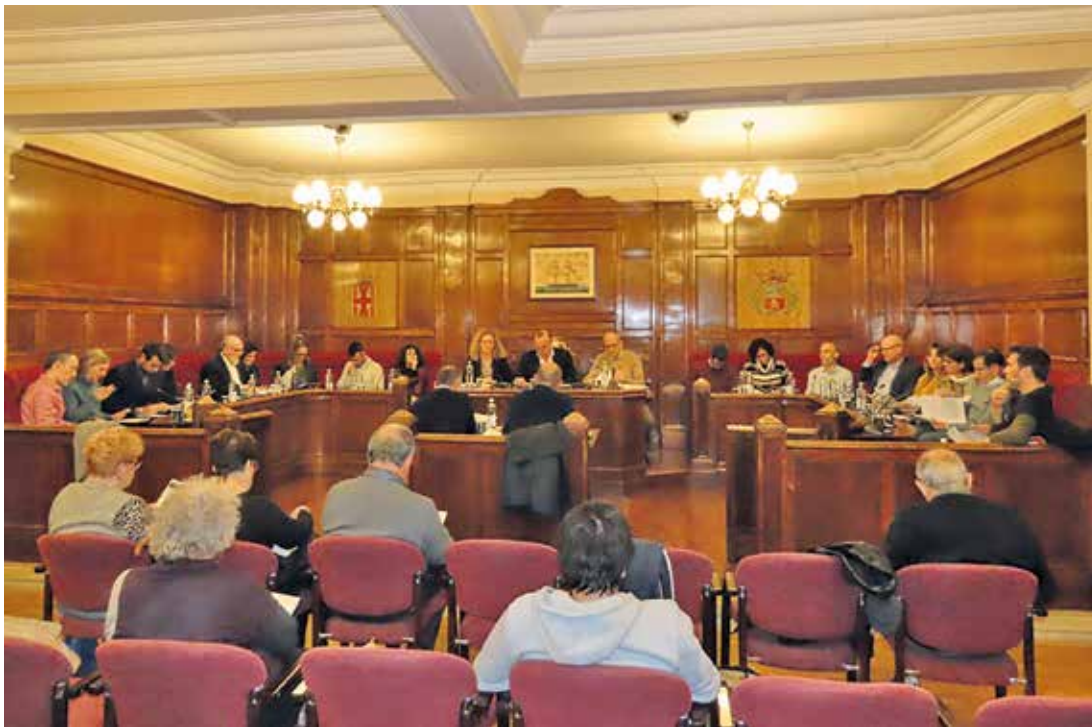
▲ Moment de la sessió plenària del novembre.

Amb l'aprovació provisional, ja és més a prop la regulació definitiva que limitarà l'ús turístic a una zona del municipi i una tipologia d'edificis