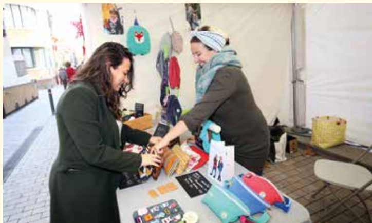
▲ Una de les cinquanta parades que es van instal·lar al llarg del c. de Roger de Flor.

l'esdeveniment firal, va ser la primera cita del repartiment de les bosses reutilitzables de la campanya i, també, de distribució de butlletes per participar en el sorteig de deu premis de 300 euros cadascun per gastar als negocis del Masnou. Un cop passada la Fira, les persones que hi vulguin participar poden fer-ho emplenant les butlletes i recollint les bosses de la promoció als punts fixos.