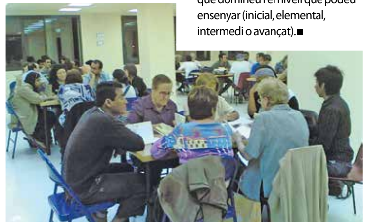
▲ Taller del col·lectiu 'Aprenem' en una altra població.

Des d' Aprenem concreten que el col·lectiu no té "cap filiació política ni religiosa". "Esperem continuar oferint aquests tallers, que contribueixen a conèixer-nos tots una mica més", desitgen des del col·lectiu.