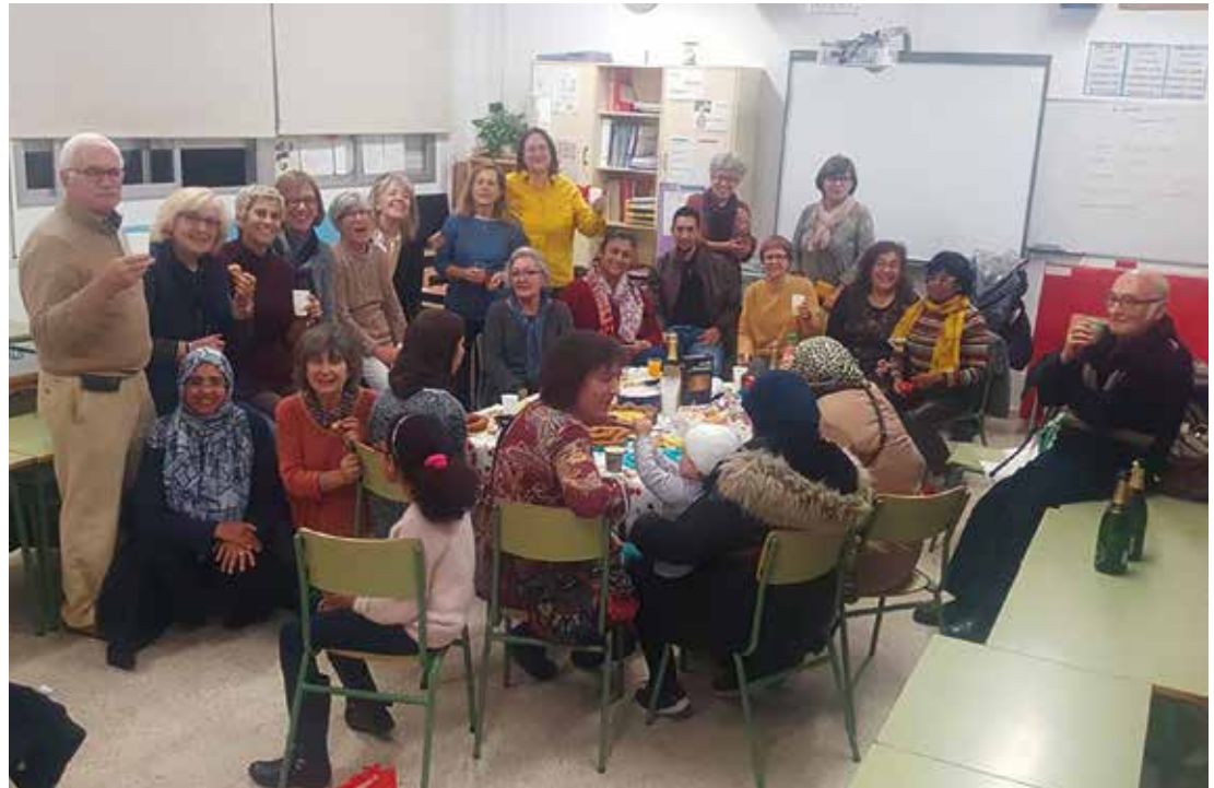
▲ Participants dels tallers del Masnou, en una trobada prèvia a les festes de Nadal.

Els tallers Aprenem fan que sigui fàcil aprendre llengües, amb una metodologia innovadora, basada en l'aprenentatge; llegint i parlant, deixant de banda la gramàtica. Fan possible que persones amb