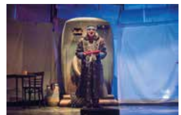
▲ 'Italino Grand Hotel'.