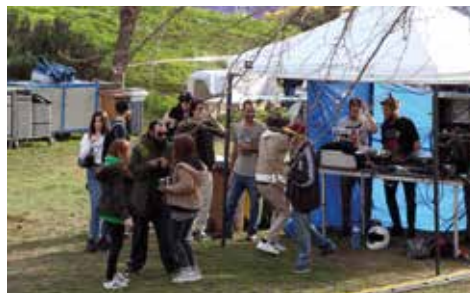
▲ El Mural Jam B-side va incloure una festa 'sound-system'. RAMON BOADELLA