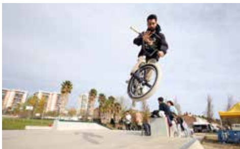
▲ Un dels joves participants de l'Skate & Sound Volum 3. RAMON BOADELLA

Aquests actes han estat organitzats per l'Ajuntament i les entitats Mural Jam, Dubbuc i Everling, amb la col·laboració de J de Jocs, LWD Radio i Reborn Sound System. ■