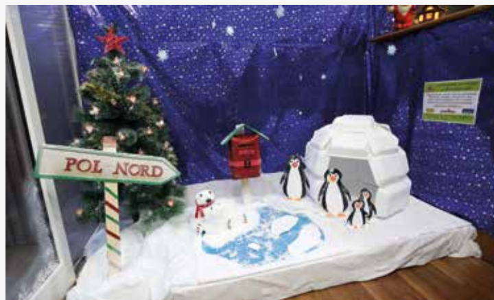
▲ La recreació del Pol Nord es va endur el primer premi. RAMON BOADELLA.

Reparació de Calçats Antonio es dedica a la reparació de sabates, però també de bosses, roba, complements..., i especialment de peces fetes amb pell. També