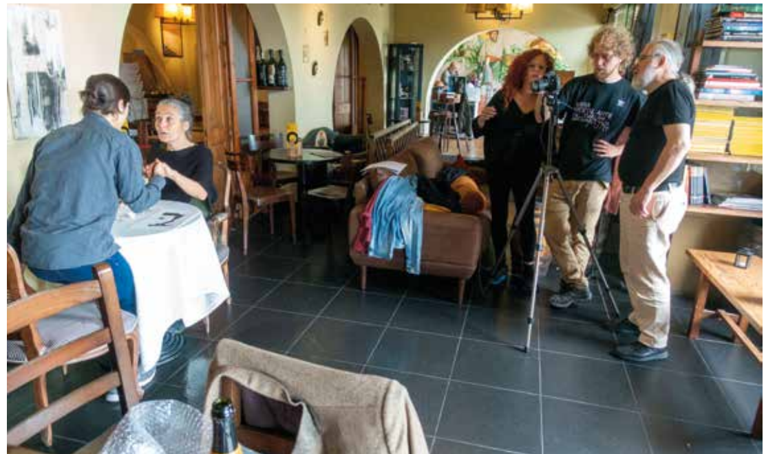
▲ Rodatge de 'Plaça d'Ocata'.

La seva activitat professional el va portar a desenvolupar tasques estretament relacionades amb el Masnou, com el fresc de l'absis de l'església de Sant Pere o la