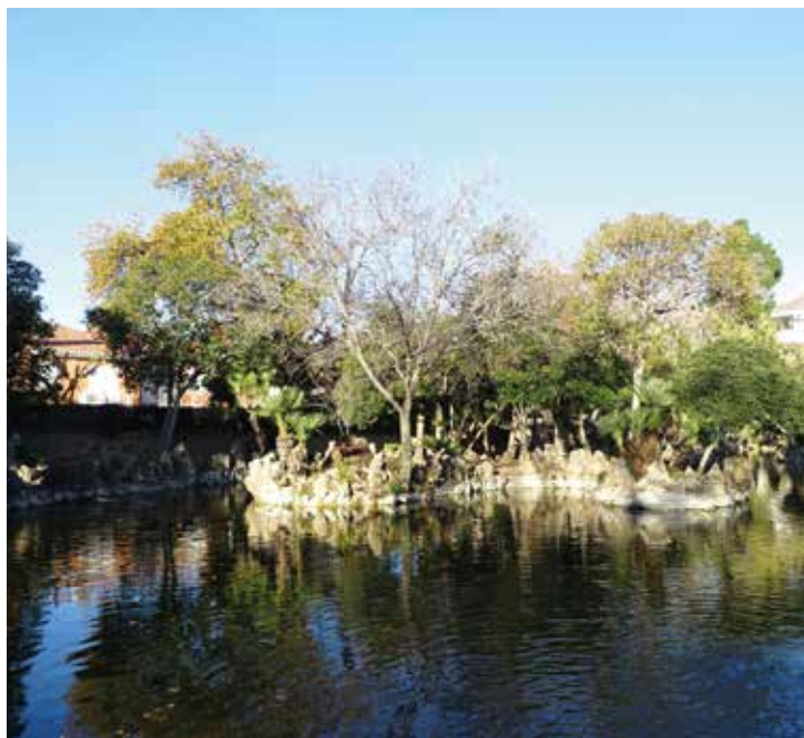
▲ El parc del Llac és un dels indrets on es faran millores. RAÚL ANDREU

Es tracta de les inversions aprovades en les últimes juntes de govern local del 2019