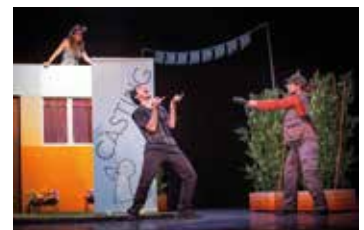
▲ 'Ai, rateta, rateta'.