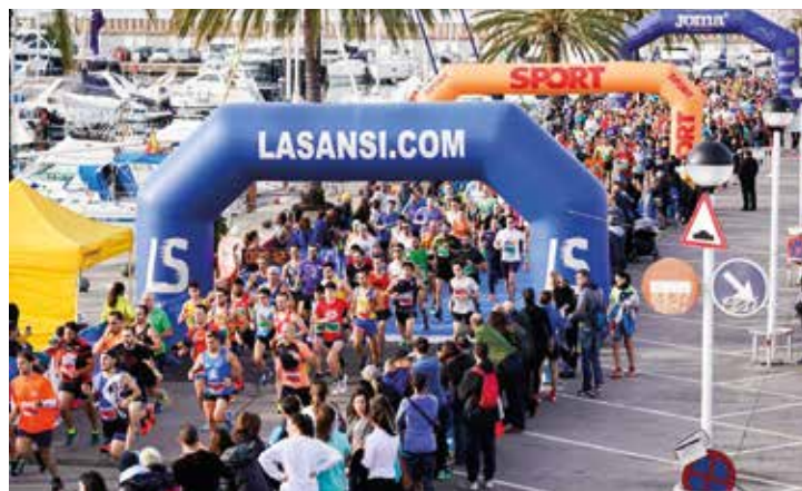
▲ Cursa Masculina de 'La Sansi' 2019.