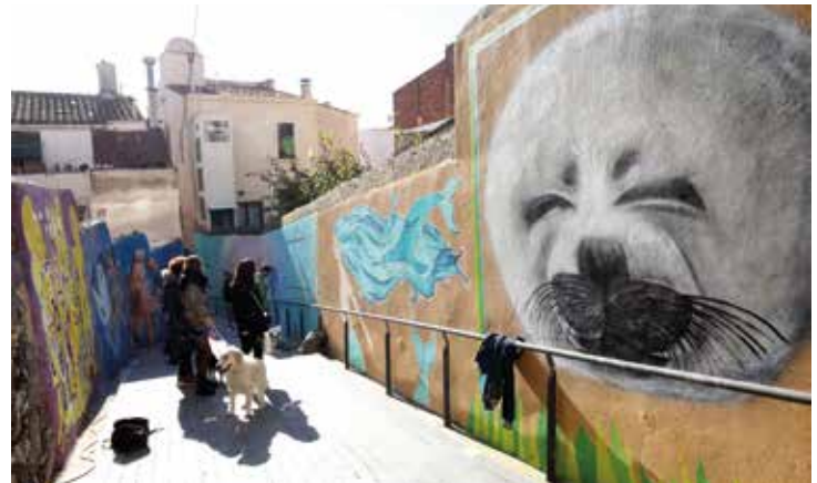
▲ Pintures murals al carrer del Rector Pineda. RAMON BOADELLA

COL-LABORACIÓ Els actes han estat organitzats per l'Ajuntament i diverses entitats joves