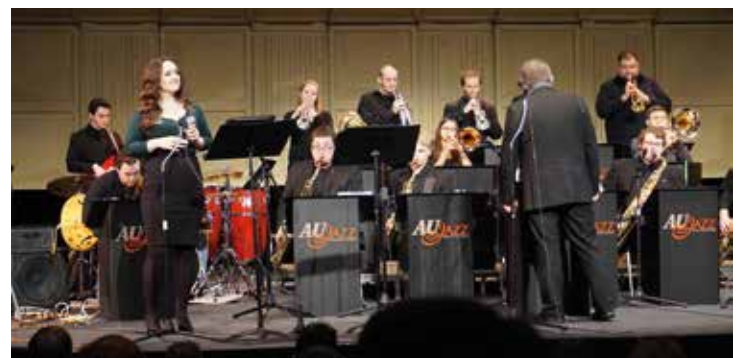
▲ Ashland University Jazz Orchestra.