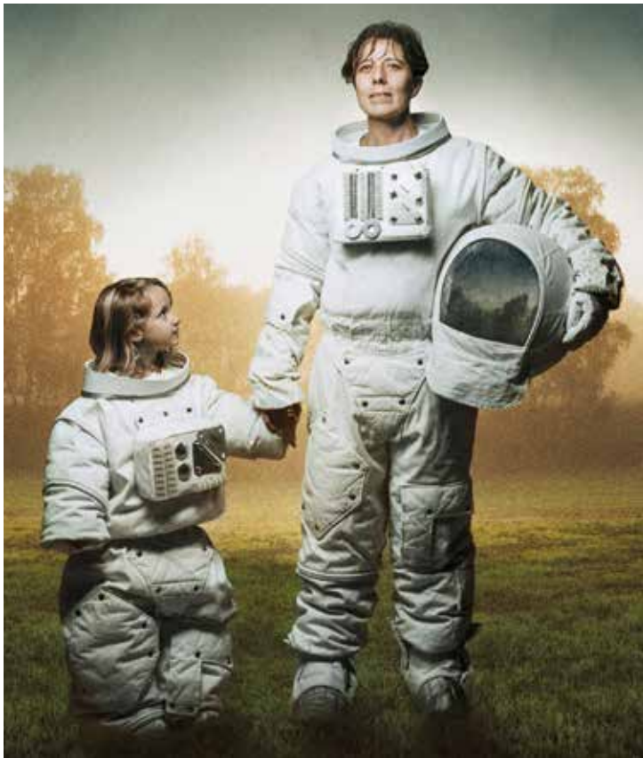
▲ Cartell de l'obra 'Abans que es faci fosc'.