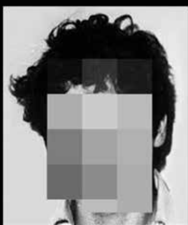
PRESO POLITICO N° 31

Les sales d'exposicions municipals volen crear xarxa entre tots els agents que treballen per les manifestacions artístiques a la vila