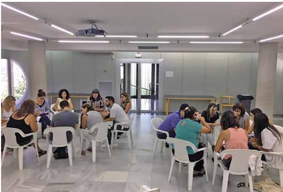
La trobada va servir per afavorir la reflexió, l'intercanvi de recursos i el treball col·laboratiu en l'àmbit de la salut mental.

La Taula de Salut Mental, mancomunada entre tots tres municipis, té previst que els dos grups de treball es reunixin un cop per trimestre, aproximadament, i que es facin dues sessions plenàries anuals de la Taula per fer seguiment dels grups de treball. L'objectiu principal és afavorir la reflexió, l'intercanvi de recursos i el treball col·laboratiu per promoció de l'atenció integral de les persones del territori que conviuen amb problemes de salut de mental.