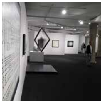
El 17 de novembre, l'artista farà una visita guiada a l'exposició.

La mostra, que és probablement la més rellevant que s'ha fet a Catalunya sobre el cinetisme internacional, reuneix una àmplia i acurada selecció d'obres de 37 artistes internacionals que busquen una transformació