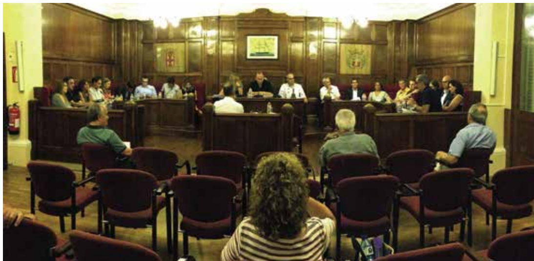
Moment de la sessió plenària.

E l Ple Municipal celebrat el 20 de setembre va rebutjar la pròrroga que proposava el Govern per allargar sis mesos més el contracte de manteniment i neteja de parcs i jardins. La proposta va ser rebutjada per 14 vots contraris (PDeCAT-Unió, C's, CUP, ICV-EUiA i PSC). Els vots favorables van ser 7, emesos per l'Equip de Govern (ERC) i pel regidor del PP.