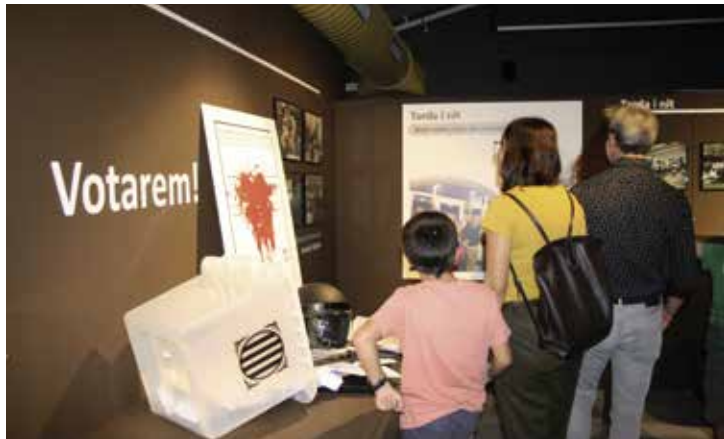
La mostra s'ha fet amb la col·laboració de la ciutadania i les entitats.

D esenes de persones van assistir l'1 d'octubre a la Sala Joan Comellas de l'Edifici Centre per participar en la inauguració de l'exposició "01-10-17". S'hi poden veure, fins al 20 d'octubre, imatges aportades per la ciutadania i altres objectes que documenten i posen en valor la mobilització popular i els fets viscuts al Masnou entre els dies 1 i 3 d'octubre del 2017.