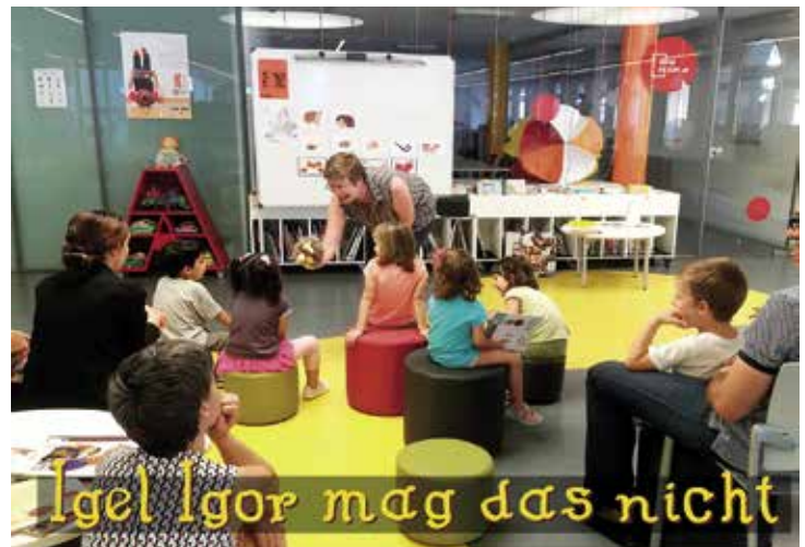
Sessió de L'Hora del Conte en llengua d'origen.

L'objectiu d'aquest projecte, per les activitats del qual ja hi han passat gairebé tres-centes