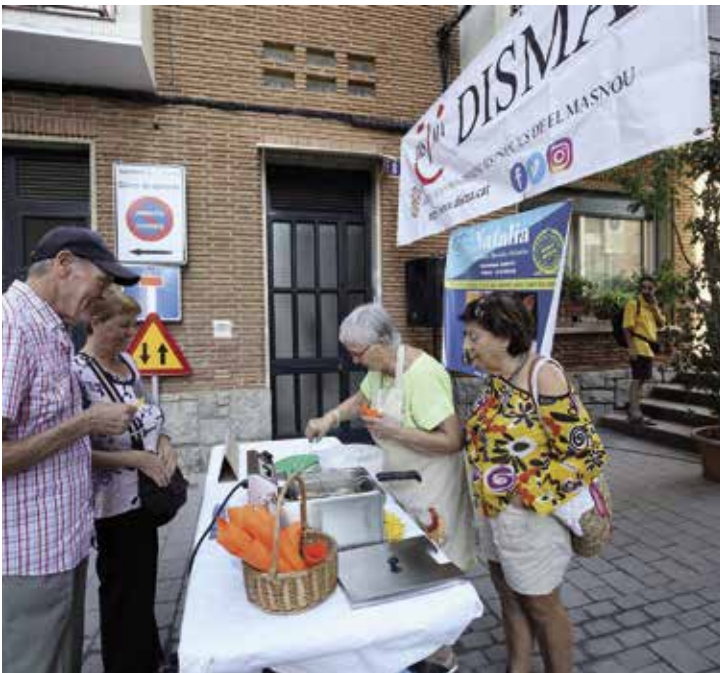
Al carrer de Sant Rafael es van poder tastar unes delicioses tapes solidàries.