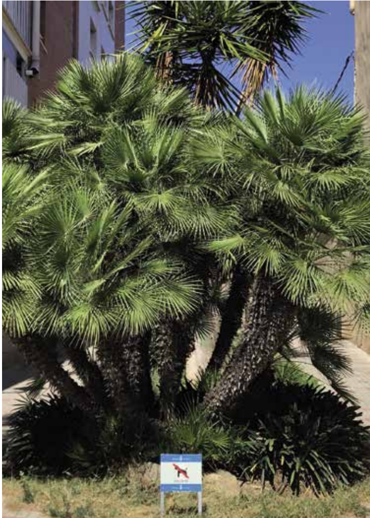
Els nous plecs preveuen adjudicar el contracte per un any amb dues pròrrogues de sis mesos cadascuna.

L a Junta de Govern Local celebrada el 4 d'octubre va aprovar l'expedient de contractació i dels plecs per a l'adjudicació del contracte de manteniment i neteja de parcs, jardins municipals, parterres, talussos i jardineres, esporga i tractament fitosanitari de l'arbrat del Masnou. El mateix dia es va fer una junta extraordinària amb els portaveus del grups municipals del consistori per informar-los, entre d'altres temes, d'aquesta decisió.