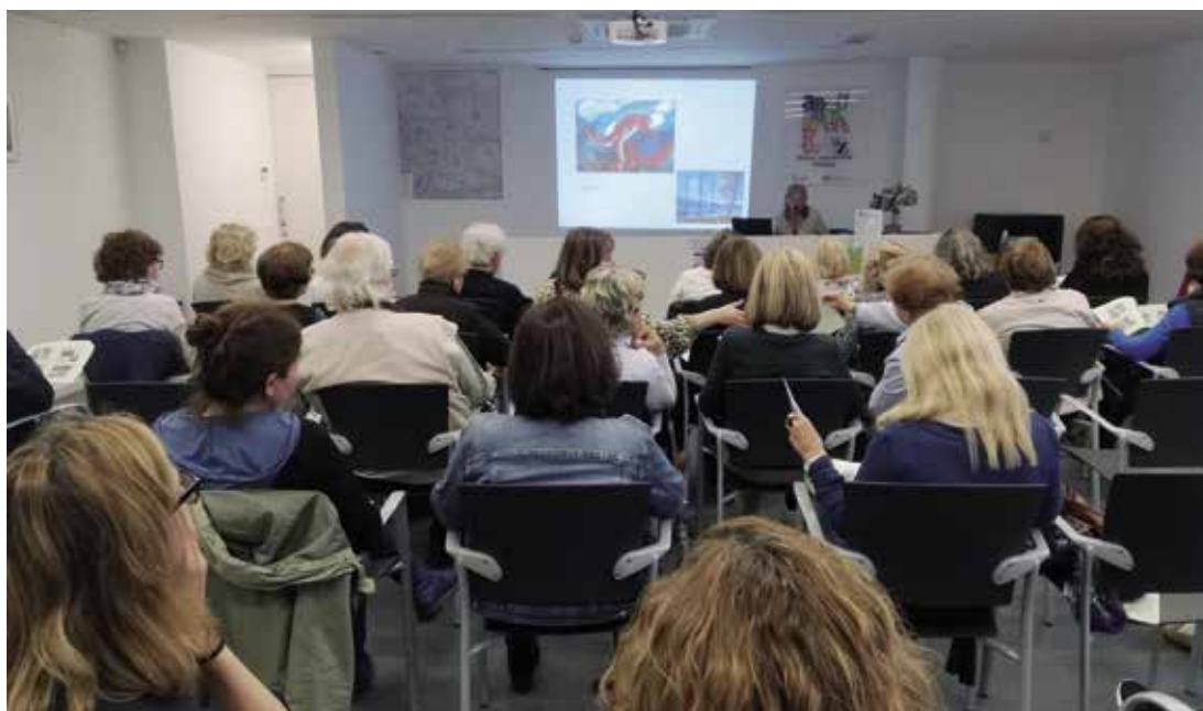
La programació, que finalitzarà l'1 de desembre, inclou una desena d'activitats.