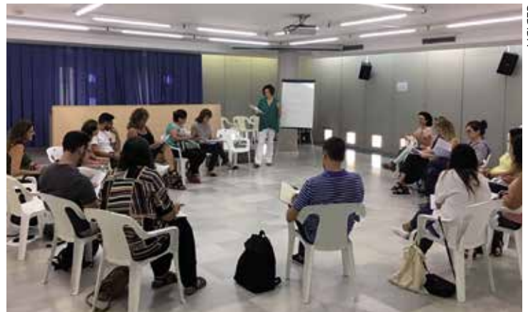
La Taula de Salut Mental és mancomunada entre Alella, Teià i el Masnou.

L'objectiu de la reunió va ser crear una comissió centrada en el coneixement i el treball en xarxa, i una altra sobre l'educació i la sensibilització