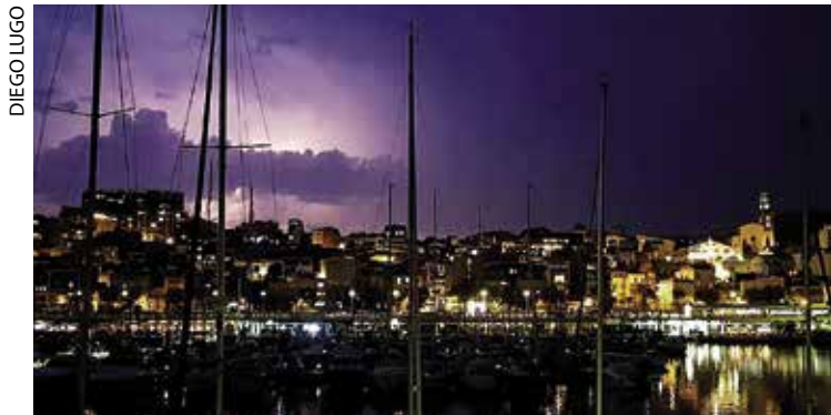
La fotografia guanyadora va ser feta en el moment en què un llamp il·luminava el municipi.

> La convocatòria del concurs fotogràfic va rebre més de 150 publicacions