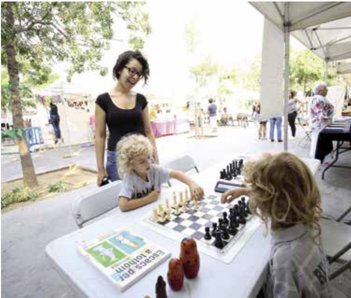
Propostes com els escacs van fer passar l'estona a petits i grans.