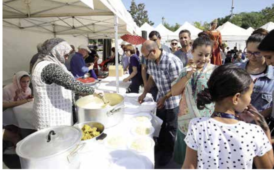
La gastronomia també va ser un dels reclams de la trobada.

organitzat per la colla bastonera Ple de Cops; una festa amb degustació de tapes en benefici de l'Associació DISMA, a càrrec de l'Associació de Veïns del Carrer de Sant Rafael i amb la col·laboració de diversos comerços del Masnou, i la representació de la comèdia L'inspector a l'Espai Escènic, de la mà del grup de teatre GAT. ■