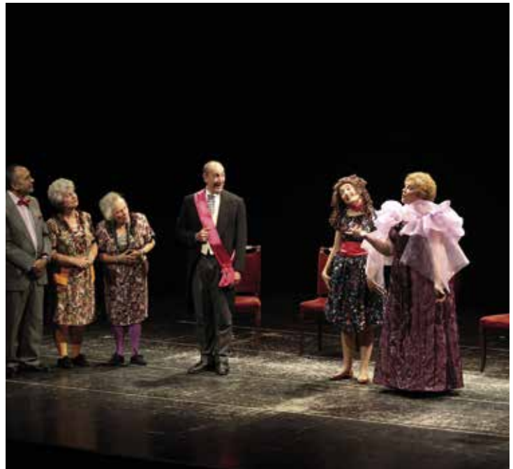
El GAT va pujar a l'escenari de l'Espai Escènic per oferir la comèdia L'inspector .