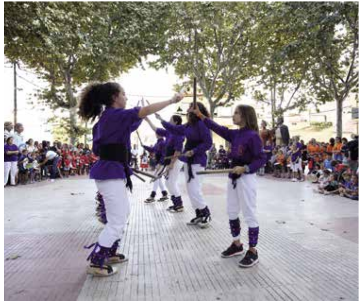
Balls populars com el de bastons van tenir lloc al Ple de Raixa.