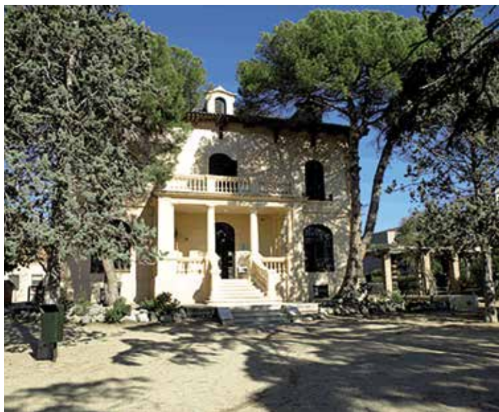
L'alberg és l'edifici que acull els menors nouvinguts.

La Direcció General d'Atenció a la Infància i l'Adolescència (DGAIA) de la Generalitat de Catalunya, que té la competència en atenció als menors, ha escollit l'Alberg Batista i Roca del Masnou com a centre d'acollida temporal d'emergència. En concret, s'han habilitat 92 places per a joves