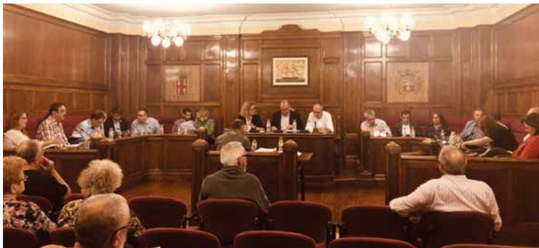
Les bases aprovades al Ple del juliol de 2017 mantindran la seva vigència. MIREIA CUXART

Les bases reguladores de la concessió d'ajuts sobre la quota de l'impost sobre béns immobles a favor de persones amb escassa capacitat econòmica aprovades per unanimitat al Ple del juliol de 2017 mantindran la vigència després que al Ple del 18 d'octubre no se n'aprovés l'actualització presentada per l'Equip de Govern. Tot i quedar rebutjada, l'alcalde, Jaume Oliveras, va anunciar que mantindria el compromís pres amb els grups municipals favorables a la proposta d'encarregar un "estudi a la Diputació de Barcelona que estableixi uns criteris de tarifació social que serveixin per treballar en una revisió d'aquest import de l'IBI", un estudi que permetria, d'una banda, guanyar en equitat, i de l'altra, una major eficiència per part de l'Administració, segons el batlle.