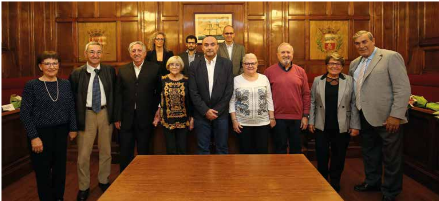
L'Ajuntament va homenatjar les parelles que aquest 2018 celebren les noces d'or, és a dir, cinquanta anys d'unió matrimonial. RAMON BOADELLA