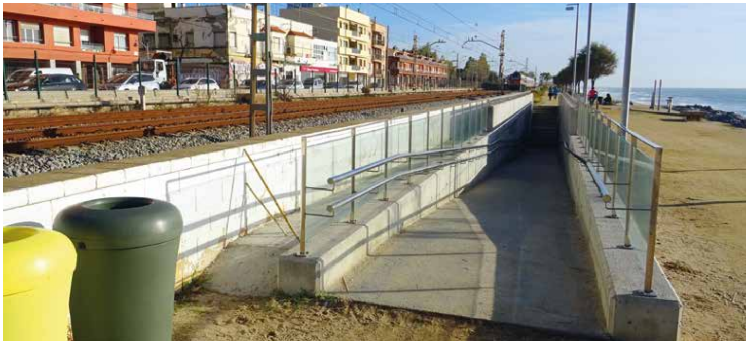
A la banda del passeig Marítim s'hi ha fet una rampa i se n'ha modificat l'escala existent. RAÚL ANDREU