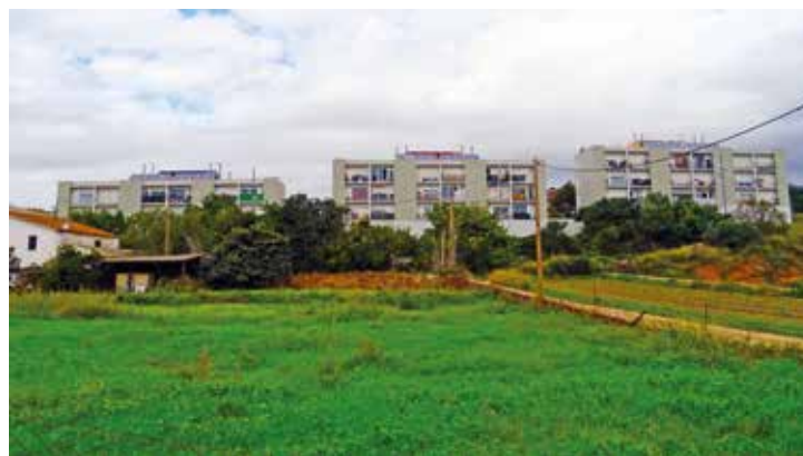
Tres blocs d'habitatges formen la promoció del Sector Llevant. RAÚL ANDREU

Una vegada l'Agència de l'Habitatge de Catalunya ha informat sobre les dates de venciment dels contractes