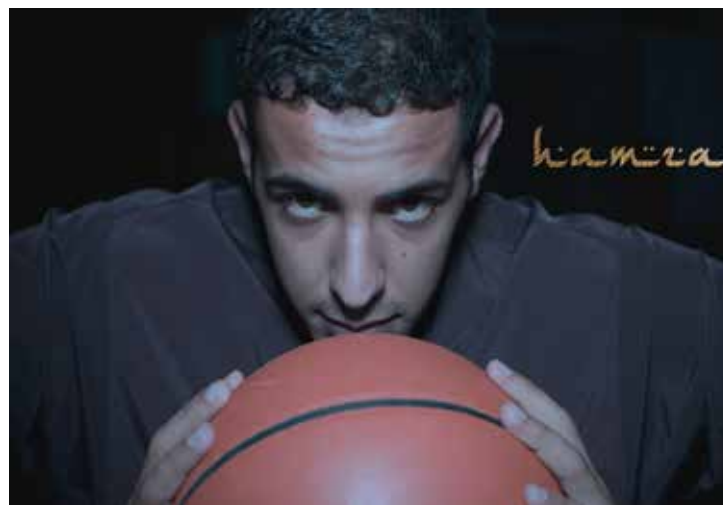
En trobareu més informació a www.projectehamza.org.