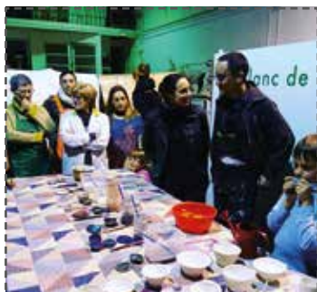
Imatge de l'edició anterior. BLANCDEGUIX