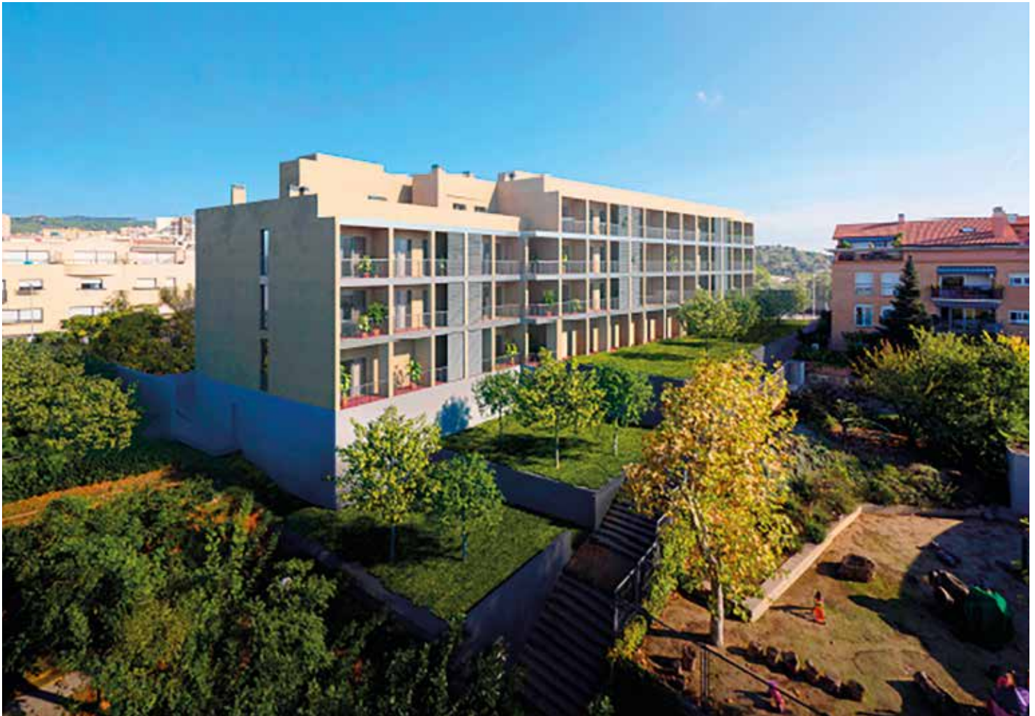
L'Incasòl entrega a l'Ajuntament el projecte d'aquest edifici, que ha estat aturat més de deu anys.