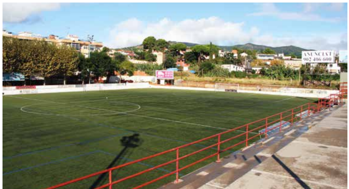
Al camp del CD Masnou hi entrenen prop de 300 jugadors. DOMÈNEC CANO

L'altre pilar on s'aboca il·lusió, talent i esforç és el planter, la base i el futur del club. Les xifres són significatives, en un club que compta amb uns 300 jugadors: "Hem crescut de 17 a 24 equips respecte a la temporada passada", detalla Reyes. Segons afirma, la fórmula es basa en la feina: "Ens ho vam treballar molt al camp. Han renovat el 95% dels jugadors i n'han vingut més de fora". Volen cuidar molt el futbol base i "que el primer equip es nodreixi sobretot de jugadors de casa; això s'aconsegueix amb