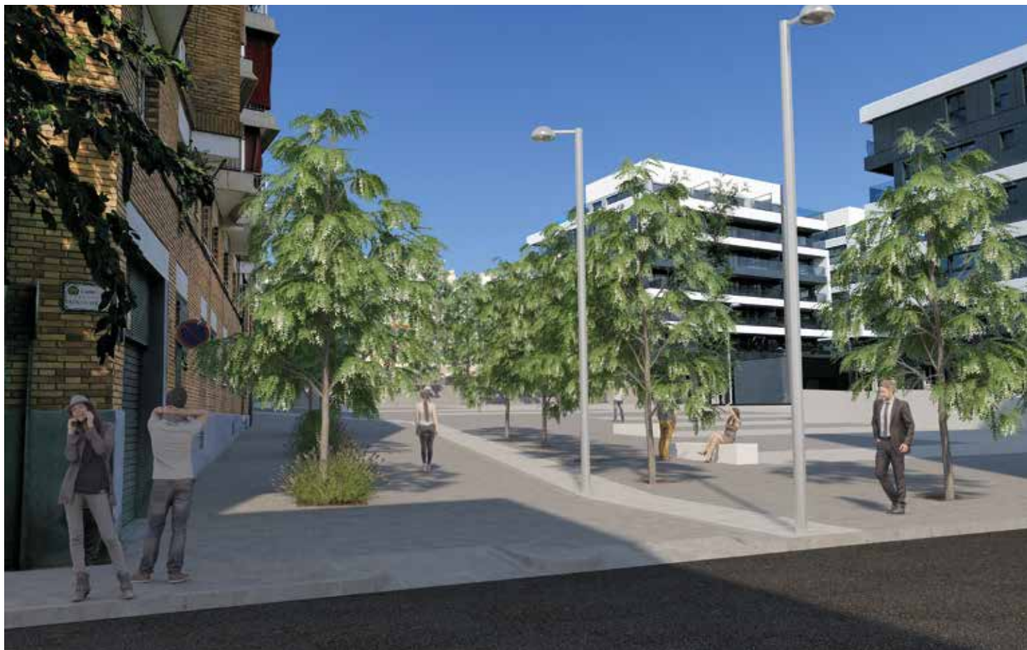
La segona fase també convertirà el carrer de Roger de Flor fins a l'altura del de Josep Estrada en via per a vianants.